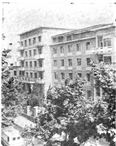
左图为提署街北侧新建的当涂饭店。

建国以后，当涂县城关镇的街、巷都先后进行了修葺。街道铺设了柏油路面，巷道一般改建为水泥路面，从而改变了过去路面坎坷不平、雨后泥泞难行的状况。尤其是提署街，过去路很窄，两边多为矮小的草房，1958年以后开拓为8米宽的柏油马路，两边造起了幢幢楼房。