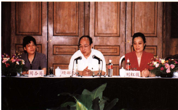
● 1998年8月，财政部部长项怀诚（中）来上海考察期间，在市财税系统处级以上干部会议上讲话。右为市财政局、市地税局局长刘红薇，左为市国税局局长周杏英