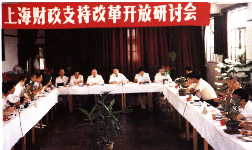
● 1991年9月，市局召开财政支持改革开放研讨会，财政部副部长迟海滨(正面右三)出席会议并讲话