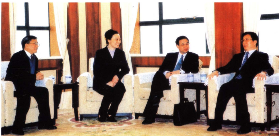
● 2003年3月1日,中共上海市委副书记、市长韩正(右一),市委常委、副市长冯国勤(右二)在出席上海市财税审计工作会议期间,与市财政局、市地税局局长刘红薇(左二),市国税局局长谢华康(左一)交谈