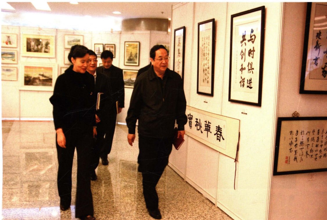
● 2007年11月14日，中共中央政治局委员、上海市委书记俞正声(右)到市财政局、市国税局、市地税局视察调研。左一为市财政局、市地税局局长葛爱玲，左二为市国税局局长顾炬，左三为市财政局、市地税局党委副书记、副局长田春华