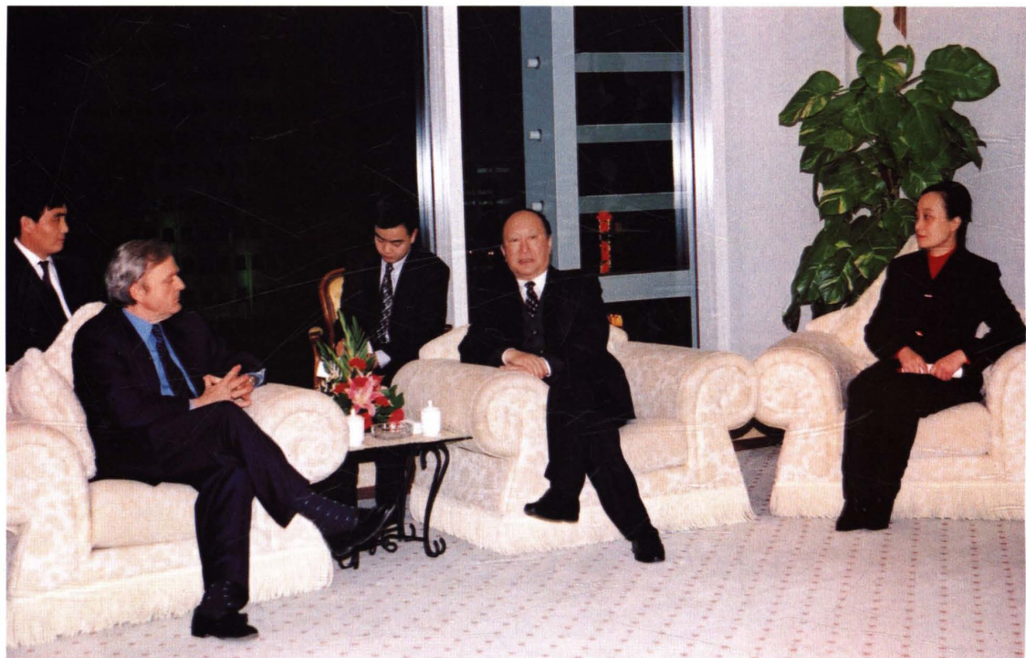
● 2001年2月13日，上海市市长徐匡迪(右二)会见国际金融公司执行副总裁彼得·沃奇(左二)一行。市财政局、市地税局局长刘红薇(右一)参加会见