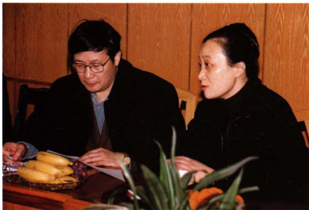
● 2000年2月，财政部常务副部长楼继伟（左）来上海视察，并就机构设置、预算会计改革等工作进行调研