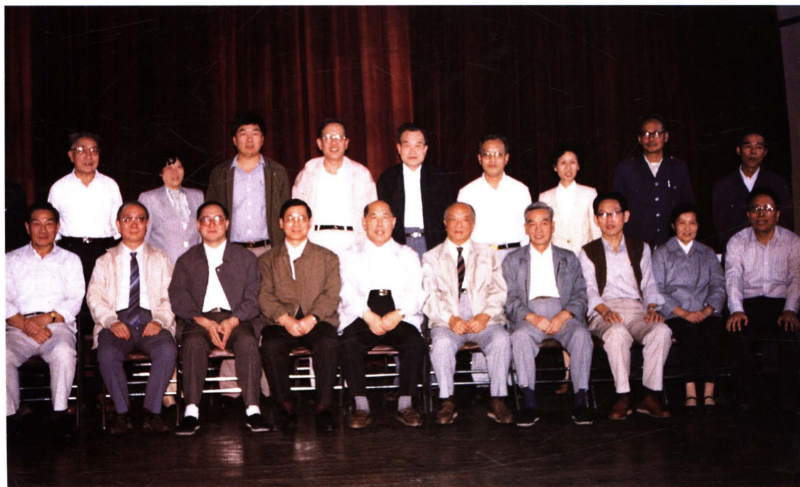
● 1990年10月，国务委员兼财政部部长王丙乾(前排左五)在上海市副市长庄晓天(前排左四)陪同下，与市局新老负责同志及劳动模范座谈并合影。市财政局、市税务局局长鲍友德(前排左二)，副局长郭苗钦(后排右五)、周有道(前排右一)、董鼎荣(后排左四)、郁子冲(后排右四)、陈步林(后排左三)、周杏英(后排左二)、程静萍(后排右三)；市局离任老领导：顾树楨(前排右五)、方成平(前排右四)、忻可坊(前排右三)、熊瑞祥(前排左一)、余瑾(前排右二)、奚祥德(后排左一)；财税干部、市劳动模范：詹文华(后排右一)、许元冲(后排右二)出席