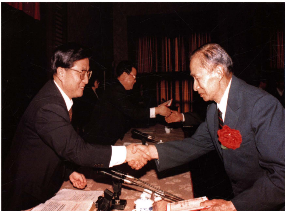
● 1997年4月25日，在中共上海市委、市政府召开的人民群众参政议政表彰会上，中共中央政治局委员、上海市委书记黄菊（左）向市财税四分局干部、全国劳动模范董世成（右）颁发“人民群众参政议政先进个人”奖状