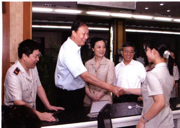
● 2004年9月13日，国家税务总局副局长钱冠林（左二）在市政府副秘书长，市财政局、市地税局局长刘红薇（左三），市国税局局长谢华康（左四）陪同下，到杨浦区税务局视察