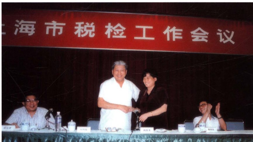
● 1997年7月29日,上海市人民检察院检察长倪鸿福(左二)出席上海市税检工作会议。左一为市检察院副检察长俞云波,右二为市国税局局长周杏英,右一为市财政局、市地税局副局长蒋卓庆