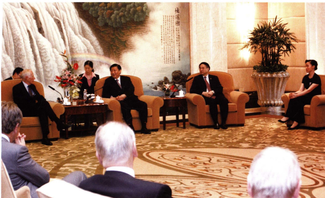
● 2007年5月29日，中共上海市委书记习近平(右三)会见荷兰全球人寿保险集团监事会主席一行，市委常委、常务副市长冯国勤(右二)，市财政局、市地税局局长葛爱玲(右一)参加会见