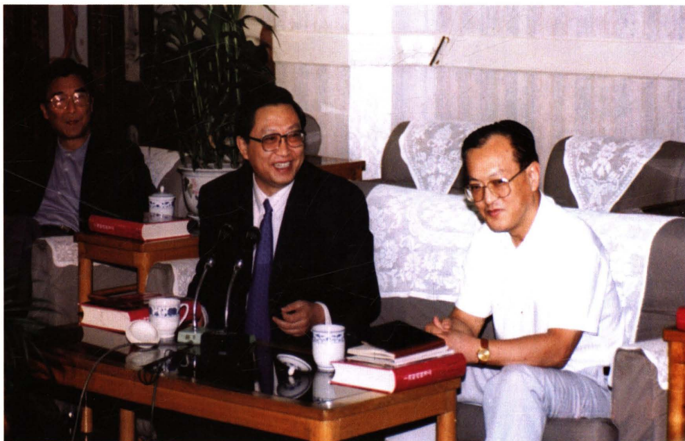
● 1995年9月，上海市副市长华建敏（中）出席首部《上海财政税务志》评审会