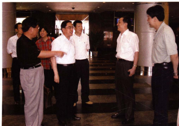
● 2005年6月15日，国家税务总局总经济师董树奎(右四)在浦东新区房地产交易中心，调研房地产交易税收“一窗式”征管情况