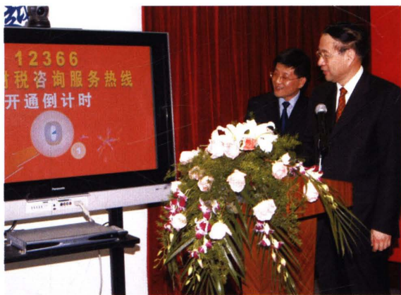
● 2006年1月1日，中共上海市委常委、常务副市长冯国勤（右）出席上海市12366财税咨询热线开通仪式并启动服务热线