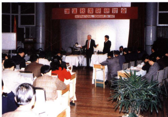
● 1996年2月，增值税国际研讨会在上海召开