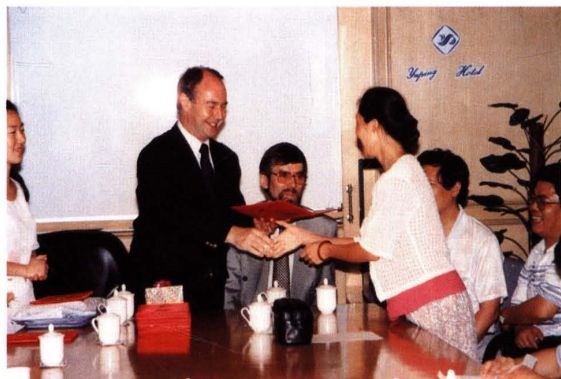
● 1996年7月，上海市财政局与英国海外发展署(ODA)合作开发“上海财税改革”项目并进行业务培训。图为英国专家伊恩·罗杰斯为学员颁发结业证书