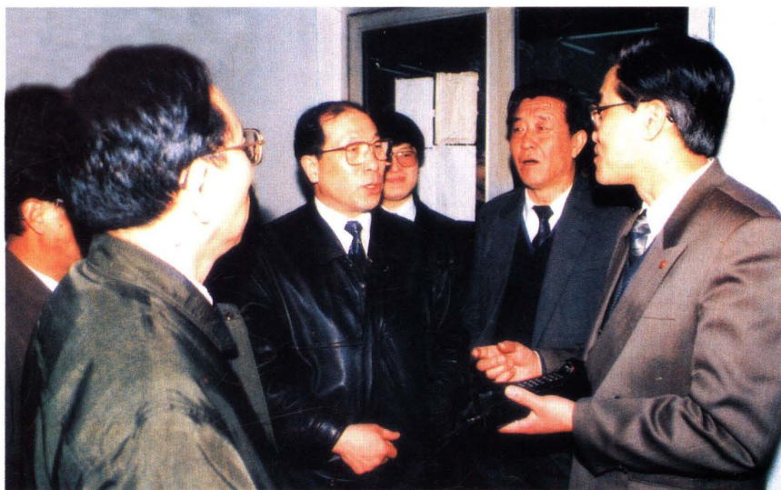
● 1993年2月，财政部部长刘仲藜(中)来上海调研，并视察上海财政证券公司