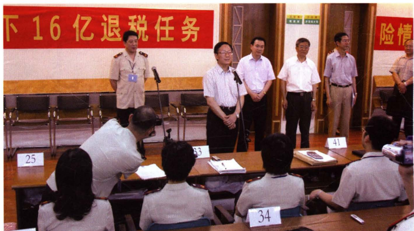
● 2003年7月20日，国家税务总局局长谢旭人(正面左二)在上海慰问因受轨道交通4号线工地突发事件影响、紧急搬迁到临时办公点工作的财税干部。正面左三为国家税务总局总经济师王力