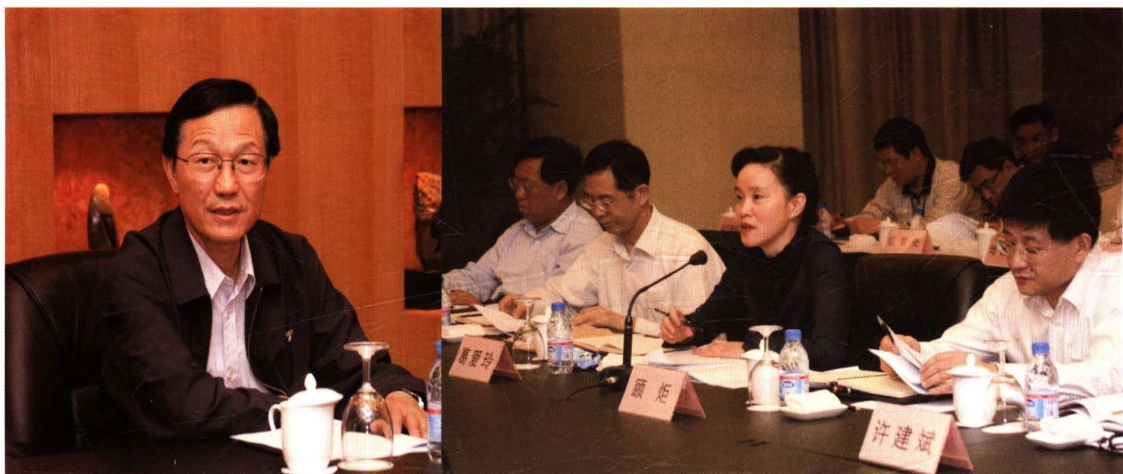
● 2007年5月15日，国家税务总局局长谢旭人来上海调研(左图)。右图为市局领导汇报工作。前排为市财政局、市地税局局长葛爱玲(右二)，市国税局局长顾炬(右一)，市财政局、市地税局党委书记、副局长张爱民(左二)