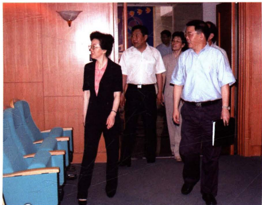
● 2005年6月17日，国家税务总局总会计师宋兰(左一)视察市财税干部教育中心