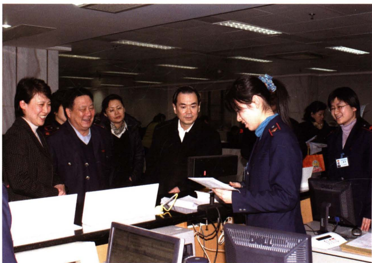
● 2007年1月16日，国家税务总局副局长王力(前排左三)在黄浦区税务局视察年所得12万元以上个人所得税纳税人自行申报工作