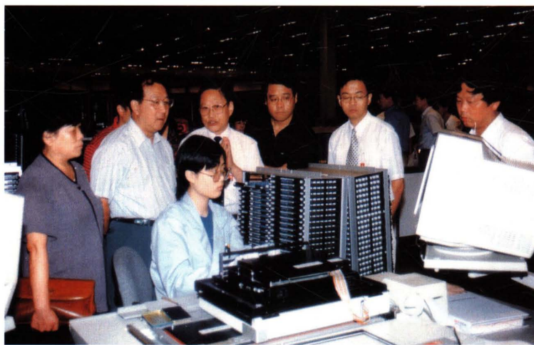
● 1998年9月22～25日，国家税务总局局长金人庆（左二）在上海调研