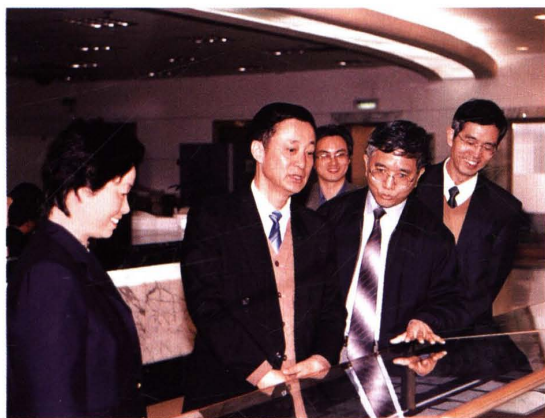
● 2002年4月，中共上海市委副书记、市委书记罗世谦（左二）视察市财税票据中心