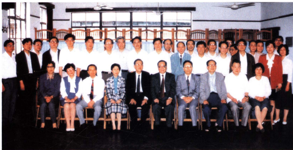
● 1993年6月，国家税务总局局长金鑫(前排右五)在上海视察期间，与市局机关干部合影