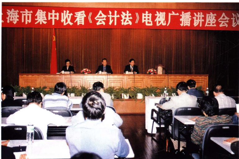
● 2000年5月11日，上海召开集中收看全国《会计法》电视广播讲座会议，市人大常委会副主任沙麟(中)参加会议并讲话，市政府副秘书长姜斯宪(右)主持会议