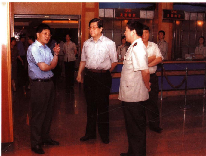
● 2006年7月6日，国家税务总局副局长许善达(前排中)视察杨浦区税务局