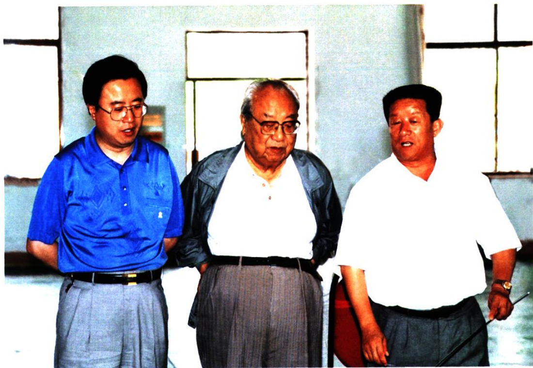
1998年7月26日，全国人大常委会原副委员长费孝通（中）在龙口市调研。