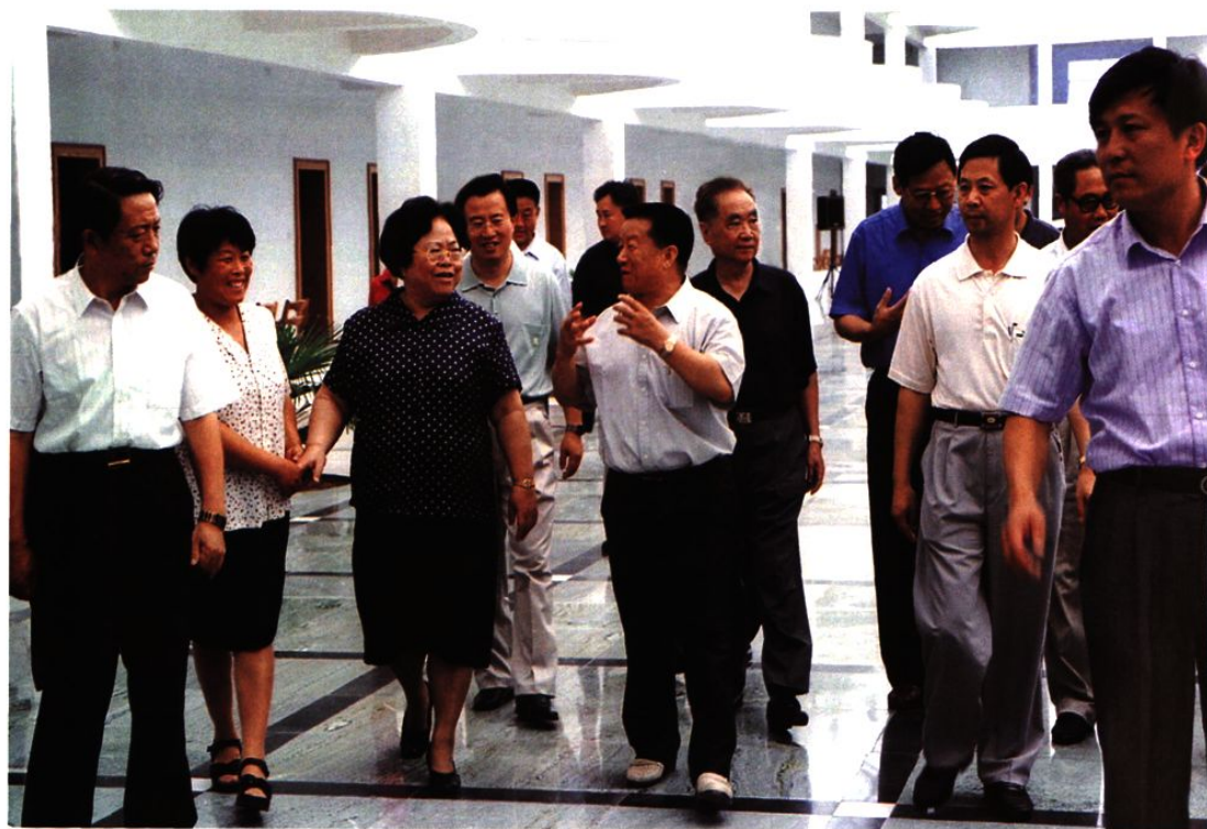
1999年8月3日，全国人大常委会副委员长彭佩云（左三）在龙口市视察。