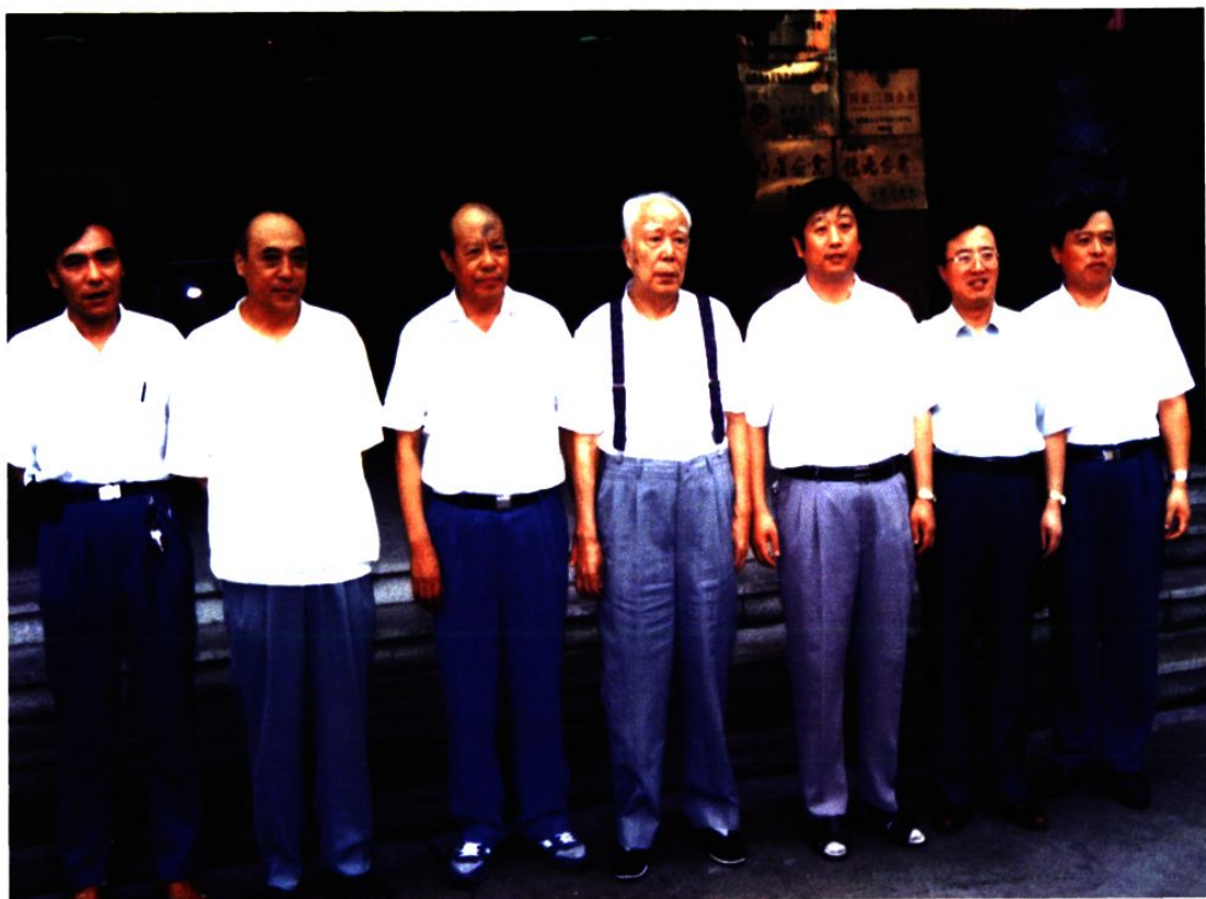
1995年8月4日，原中共中央政治局委员、全国人大常委会原委员长万里（中）在龙口市视察。