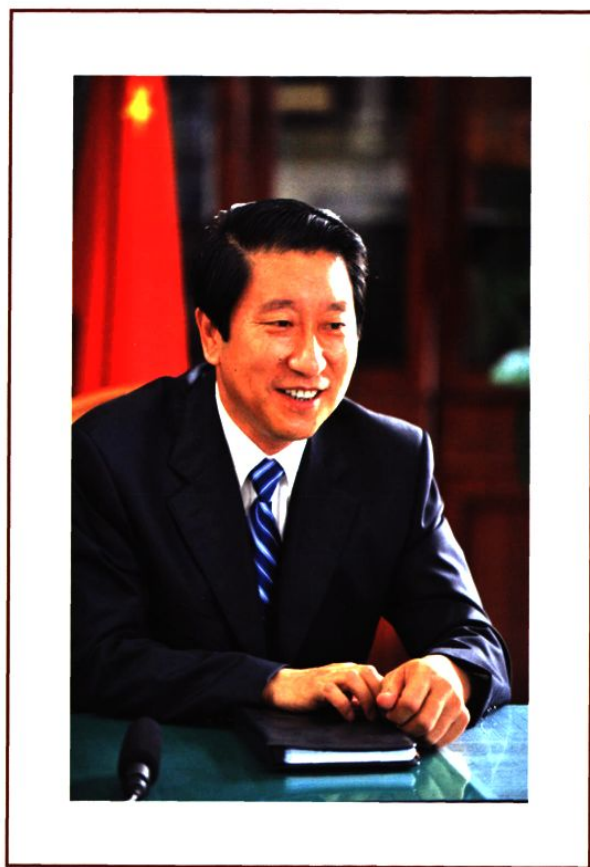
中共龙口市委书记 李树军