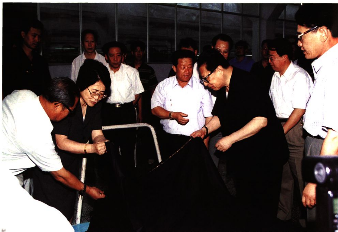
1999年8月22日，原中共中央政治局常委、全国人大常委会原委员长乔石（右三）在龙口市视察。