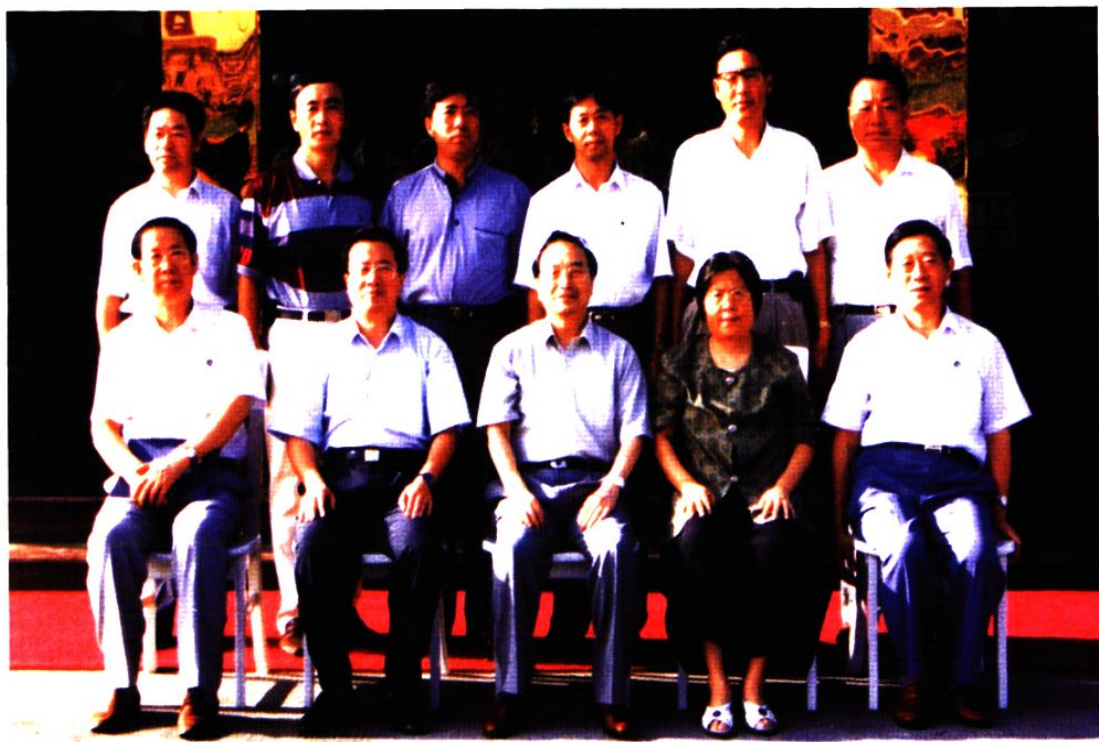
1998年8月5日，全国人大常委会副委员长蒋正华（前排中）在龙口市视察。