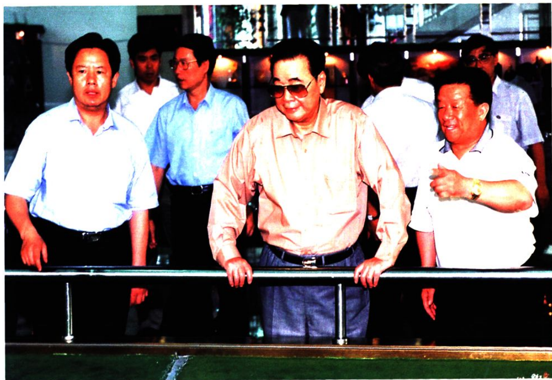
2005年6月16日，原中共中央政治局常委、全国人大常委会原委员长李鹏（中）在龙口市视察。