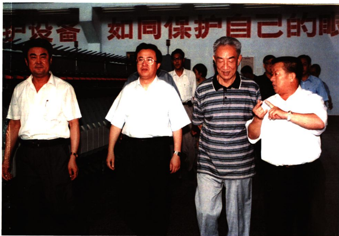
1998年8月3日，全国人大常委会副委员长邹家华（右二）在龙口市视察。