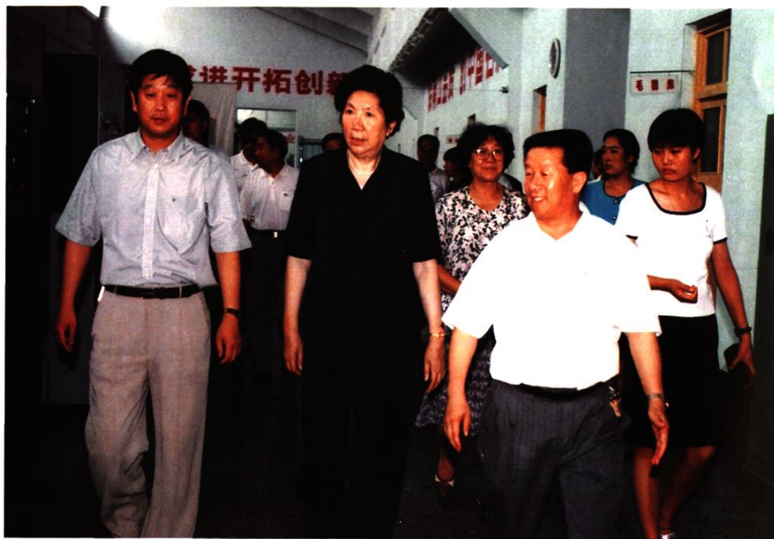
1997年7月30日，全国人大常委会副委员长陈慕华（中）在龙口市视察。