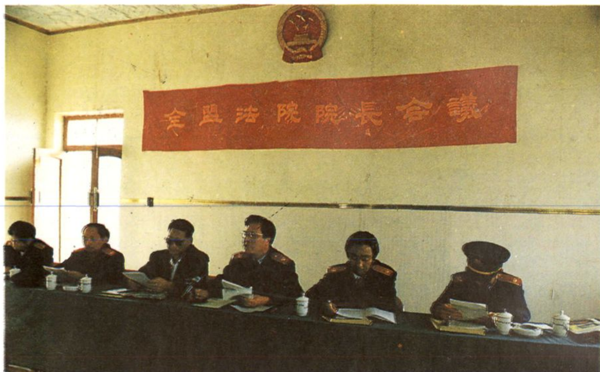
中院召开全盟法院院长会议,恩和院长讲话