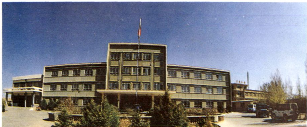
中院办公大楼和审判法庭