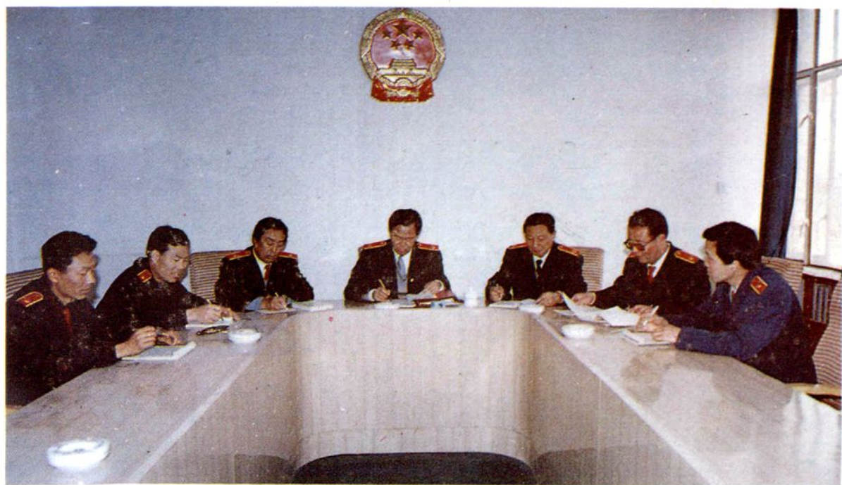
中院召开审委会,正在讨论研究案件