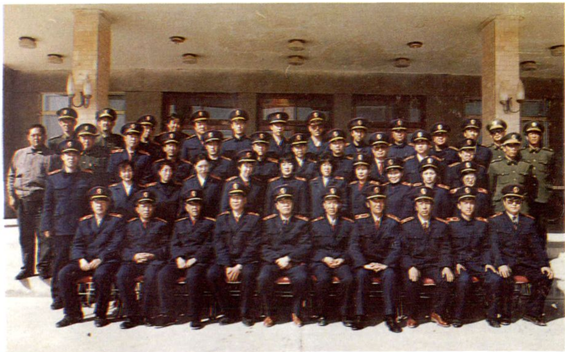
中院全体干警和三旗法院院长、副院长合影