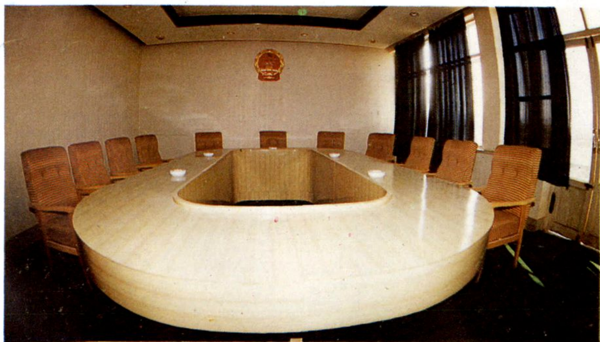
中院审判委员会会议室