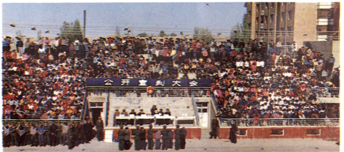
中院联合左旗法院召开“严打”公判大会