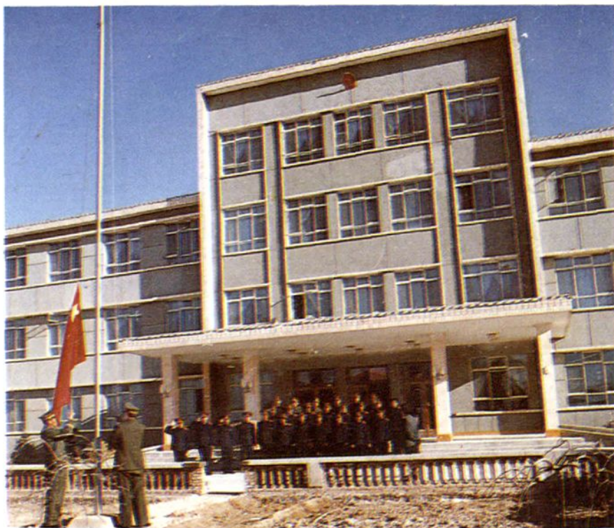
国旗法实施后,中院每周举行升旗仪式