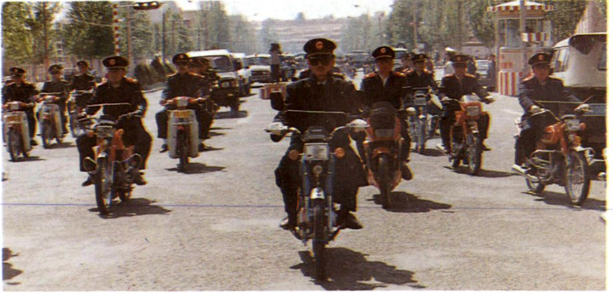
在全盟严打中,阿盟中院积极参加“严打”宣传活动