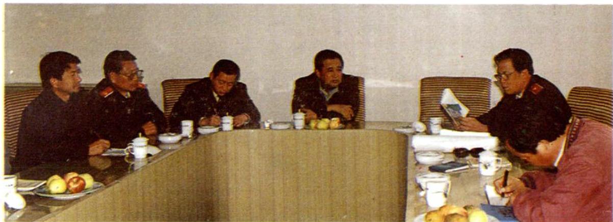
内蒙高院院长巴士杰来院巡察工作