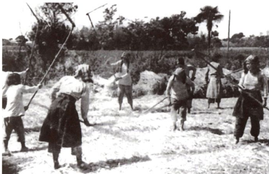
农业合作化时期妇女们 在脱粒场劳动