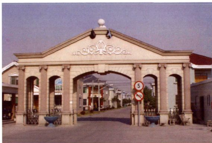
2003年，华阳中心村别墅建成