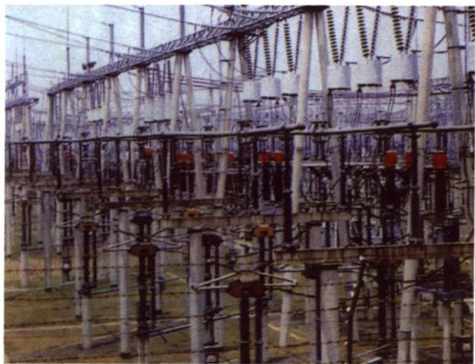
1988年，车墩110千伏变电站建成