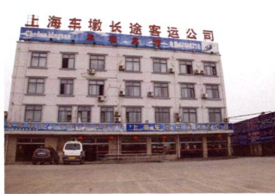
2004年8月8日，车墩长途汽车站建成启用