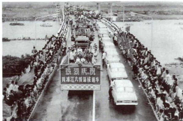
1976年6月29日，黄浦江上第一座大桥—— 松浦大桥通车仪式