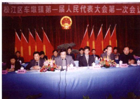
2001年1月16~17日，车墩镇第一届人民代表大会第一次会议召开