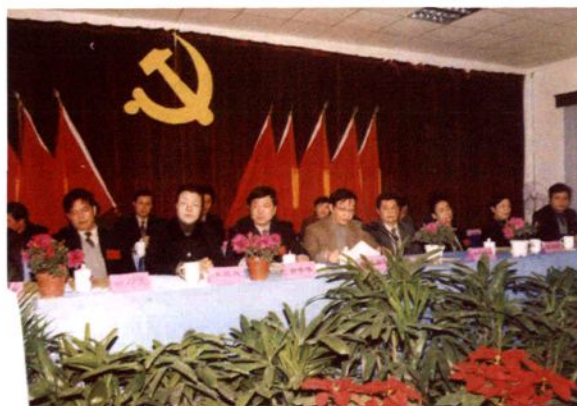
2001年12月12日，中共车墩镇第一次代表大会召开