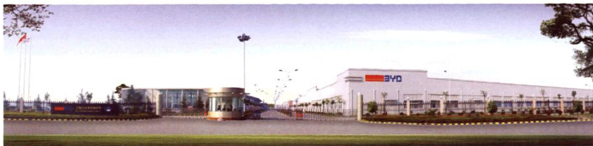
2002年8月，上海比亚迪有限公司建成