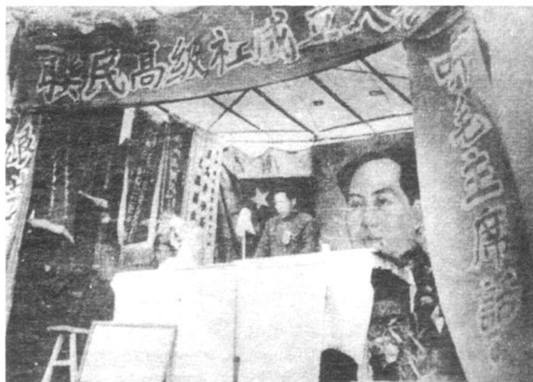
1956年秋，联民高级社成立