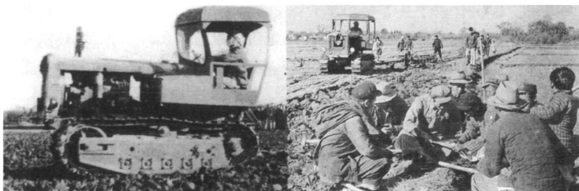
1956年秋，联民高级社 在松江全县首次使用拖拉机 耕田