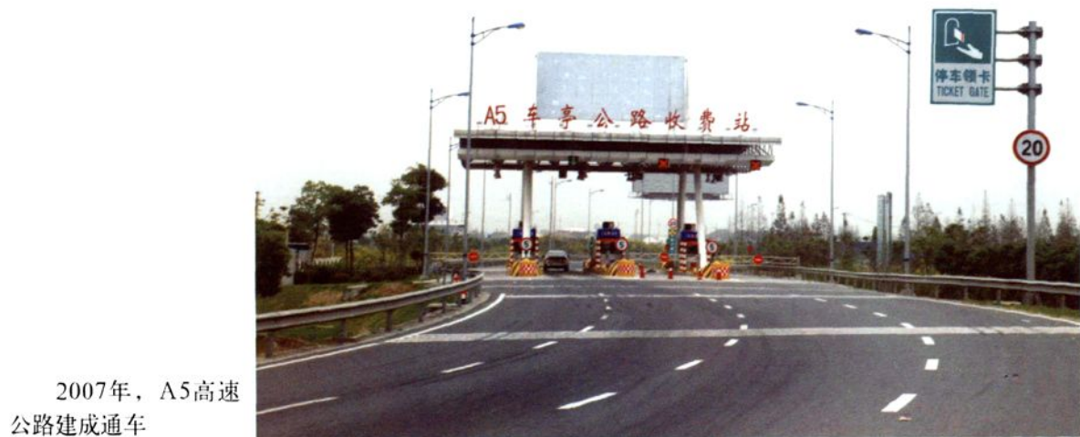
2007年，A5高速 公路建成通车