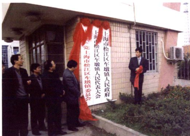
2001年1月8日，车墩、华阳二镇合一，新车墩镇党委、镇政府挂牌仪式