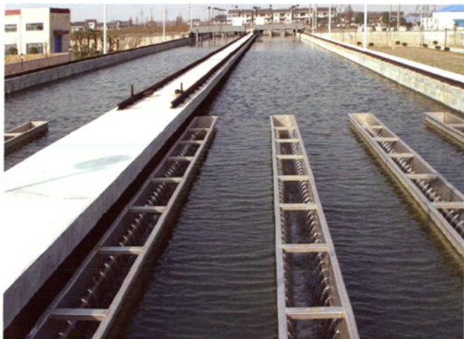
2005年7月16日，车墩镇新自来水厂建成投入使用