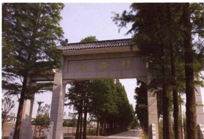
2009年，长湊村被确定为上 海市建设社会主义新农村试点村