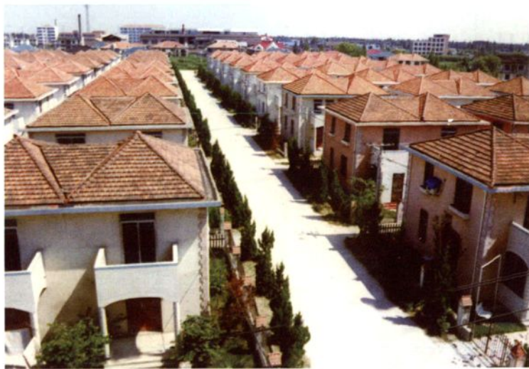
1996年，车墩集镇好莱坞别墅花园建成