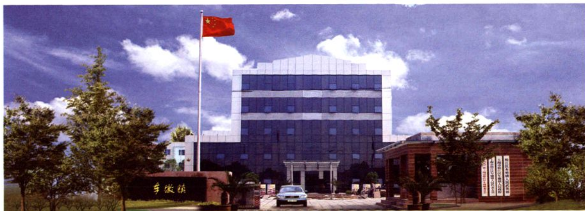
2004年6月，整修后的车墩镇政府大院