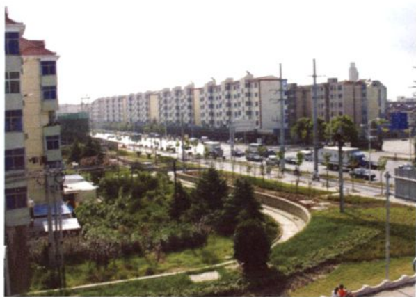
2005年6月，北松公路拓宽后的车墩集镇