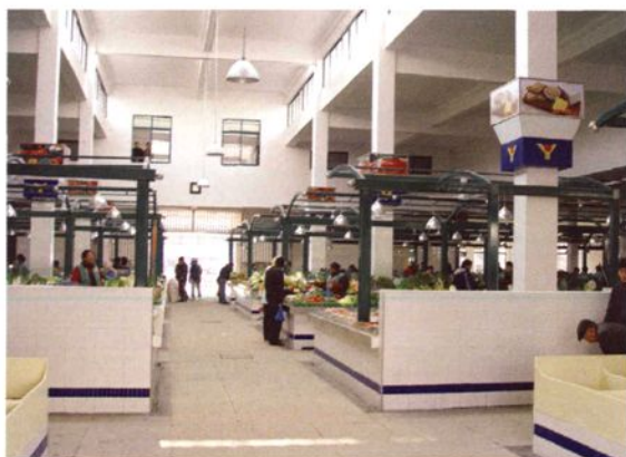
2006年6月，改造翻新后的车墩农贸市场