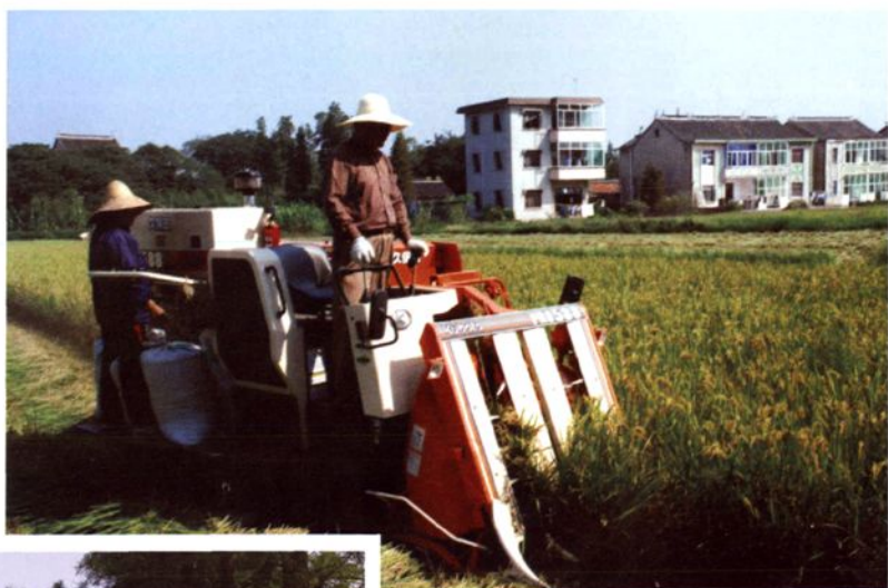
上海2BA型收割机在长湊村 “三高”粮田收割水稻