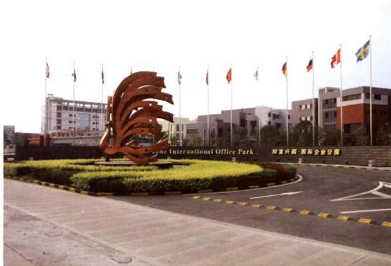
2007年10月，财富兴园国际企业公园建成