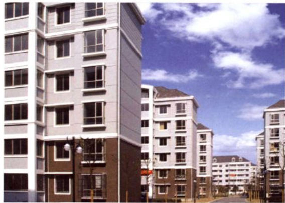
2005年12月，农民动迁安置新村——祥东小区（一期）建成