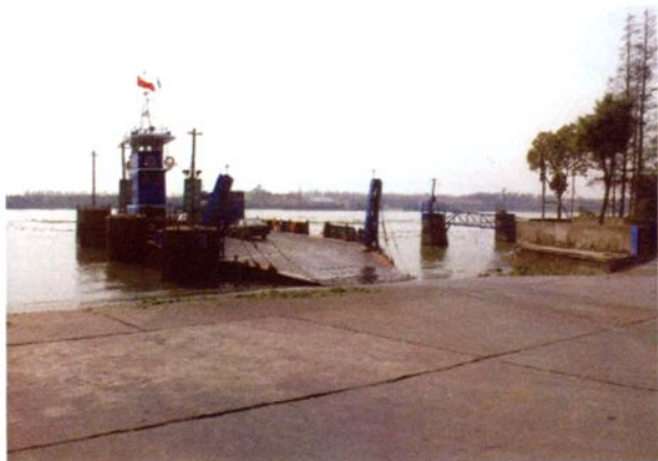
1964年，黄浦江米市渡斜坡码头建成