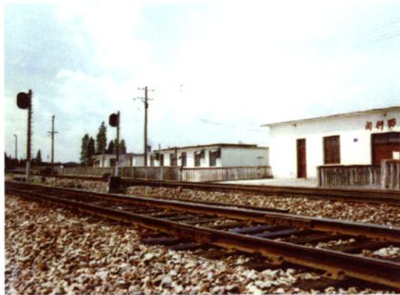
1974年，金山支线闵西车站建成