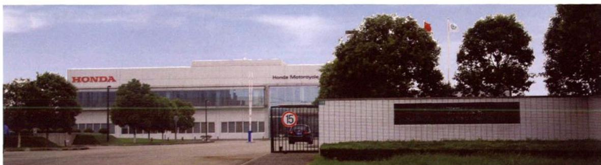
2003年1月，本田摩托车研究开发有限公司建成