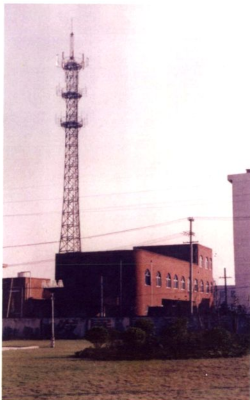
1997年11月，车墩邮电支局内架设镇内第一座移动电话基站