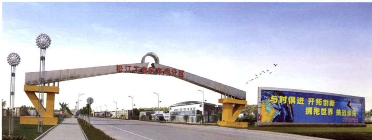
2003年，车墩工业园区（一期）建成