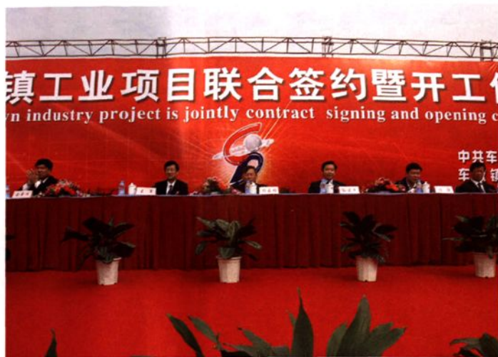
2004年10月18日，车墩镇举行 工业项目联合签约暨开工仪式