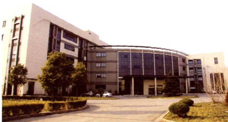
2006年6月，生工生物工程 (上海)有限公司建成