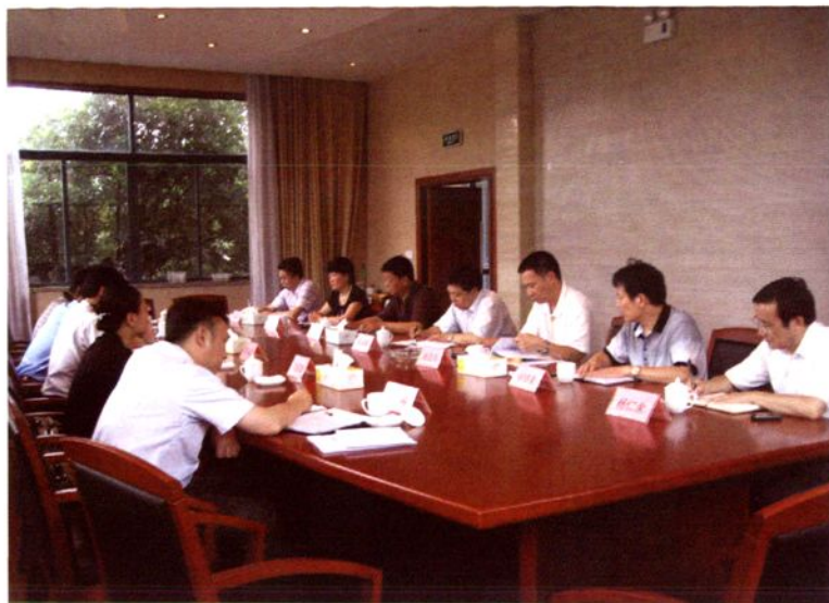
车墩镇党政班子会议