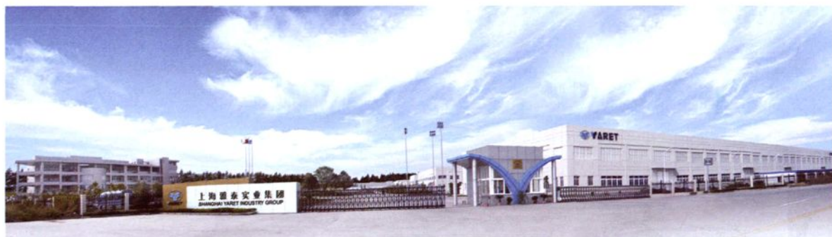
2004年6月，上海雅泰实业集团有限公司建成