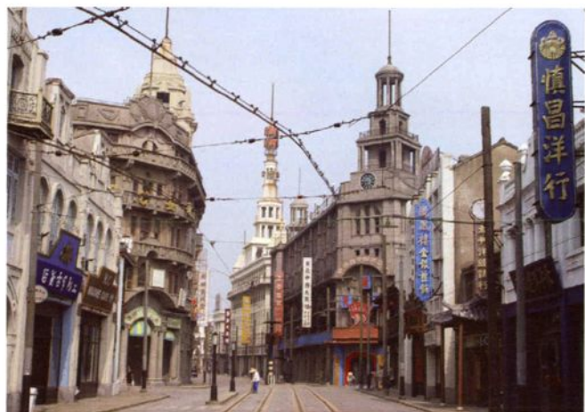
1999年10月，上海影视乐园（一期）建成