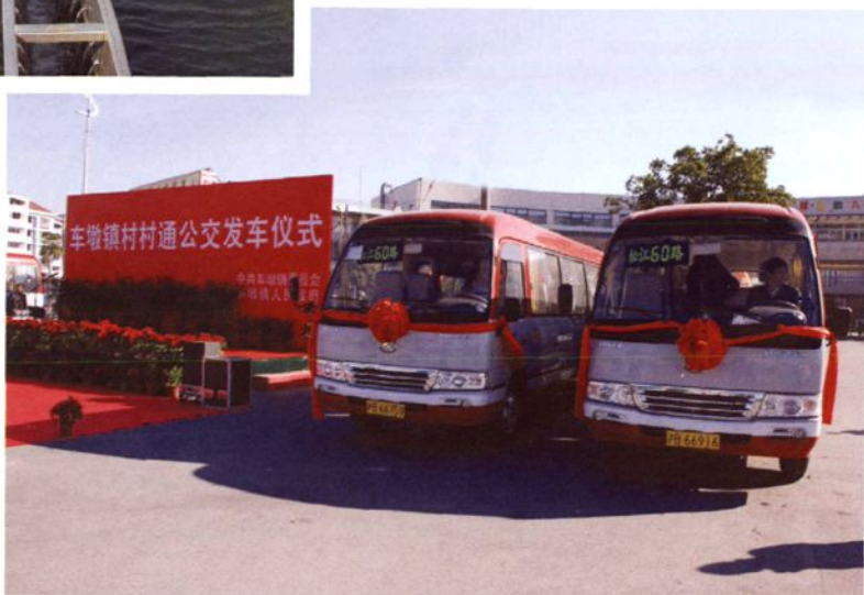
2008年11月28日，车墩镇村村通公交发车仪式