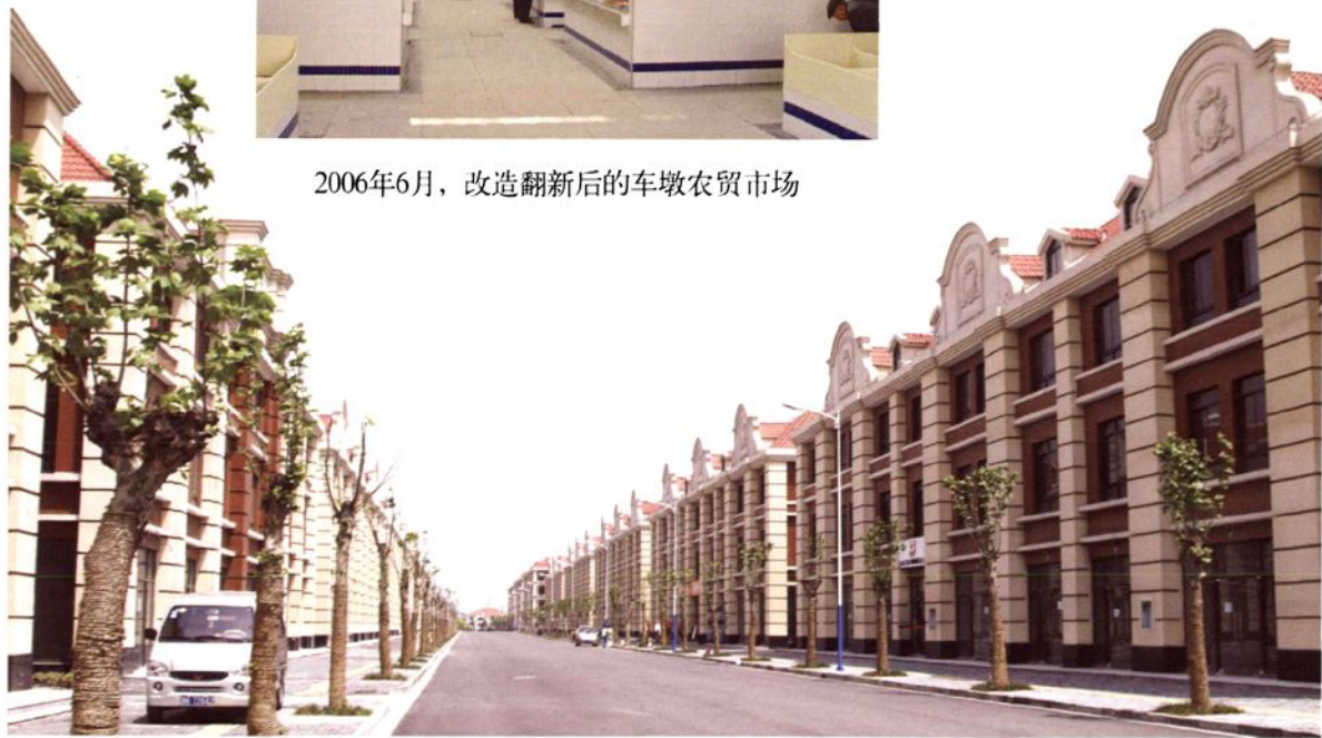
2007年2月，车墩集镇影视路商业街建成