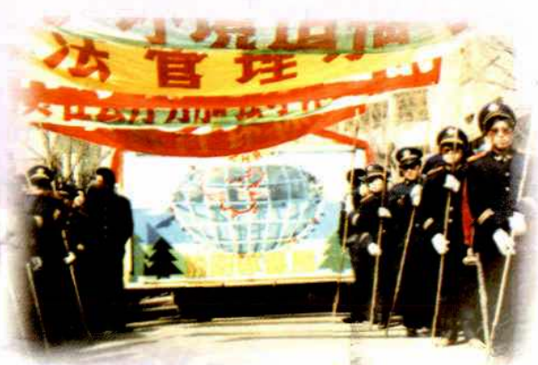
1991年春节环保局街头文艺宣传