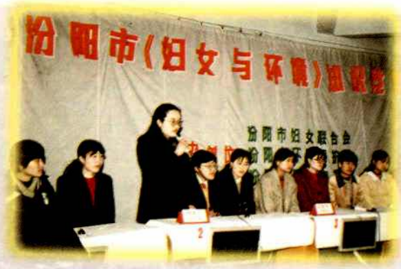
1998年,《妇女与环境》知识竞赛。