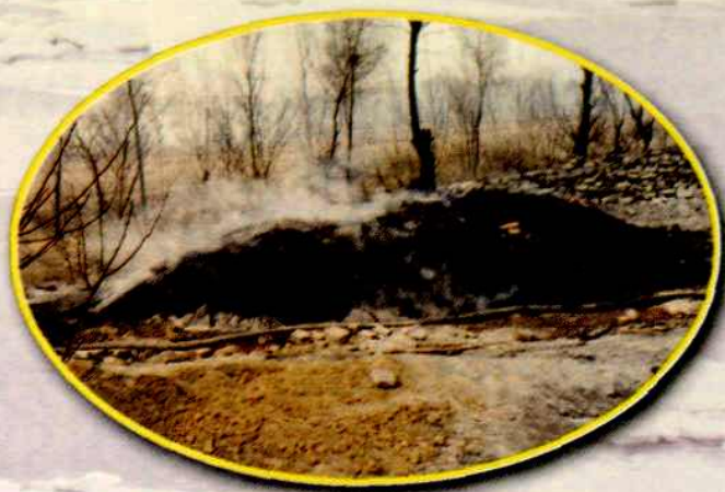
八十年代初期坑式土焦炉