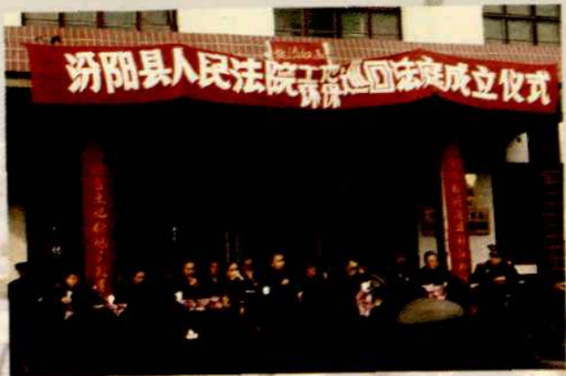
1994年12月26日，环保巡回法院挂牌成立。