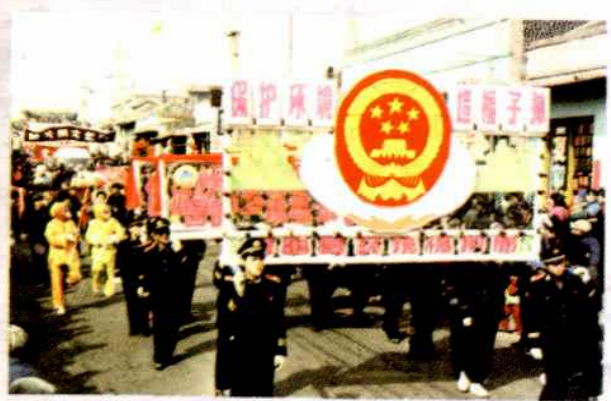
1993年春节环保局街头文艺宣传