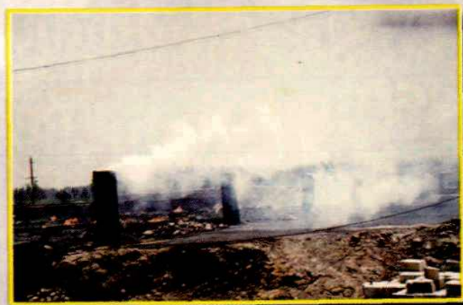
八十年代末的萍乡炉土焦炉