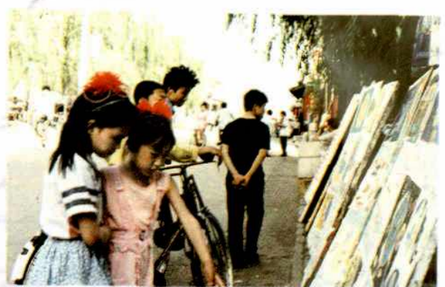
《儿童与环境》绘画展