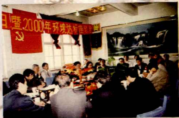
2000年世界环保日暨环境达标座谈会