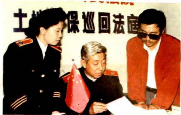
市环境监理大队与环保法庭办案