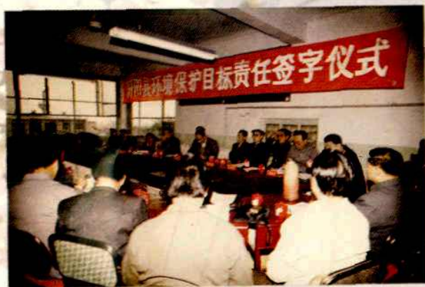
1993年，环境保护目标责任签字仪式现场。