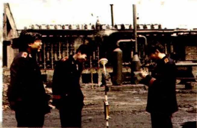
市环境监测站监测人员在企业进行现场监测