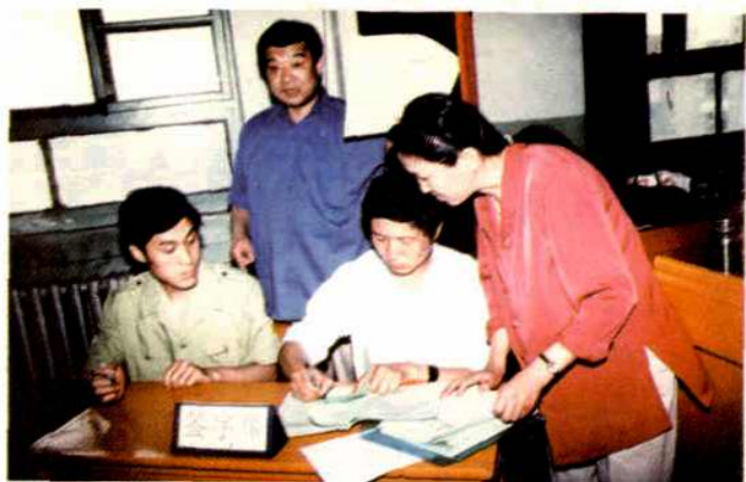
市委书记(原市长)徐德(左二)在1998年环保目标责任制签字仪式上。