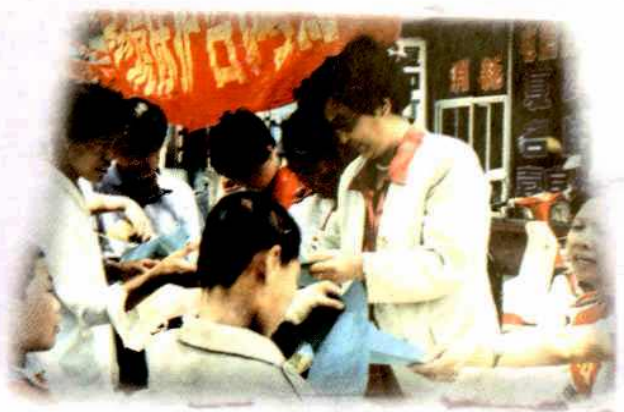
副市长靳尔兰与环保工作人员在街头参加咨询宣传活动。