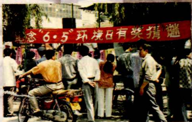
纪念“6·5”环境日有奖猜谜