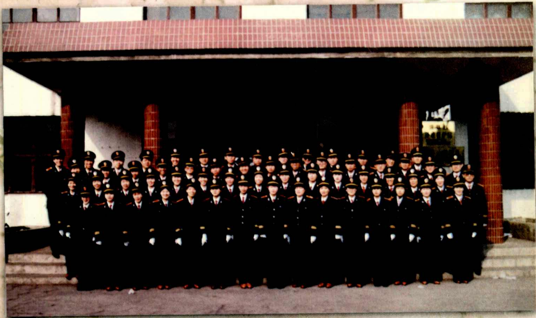
阵容整齐的环保局队伍