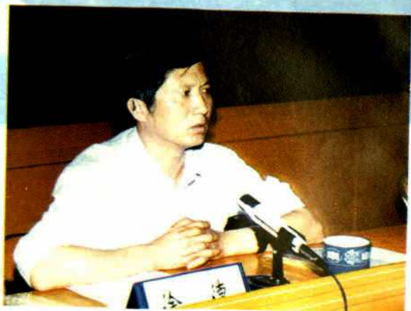
中共汾阳市委书记(原市长)徐德 1999年6月5日在全市环境工作会议上讲话。