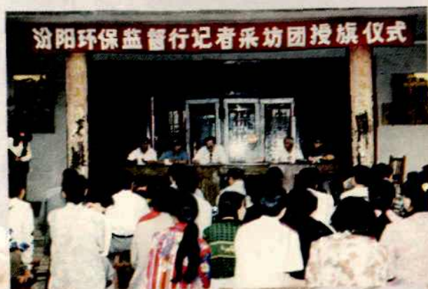
1996年，汾阳环保监督行记者采访团授旗仪式现场。