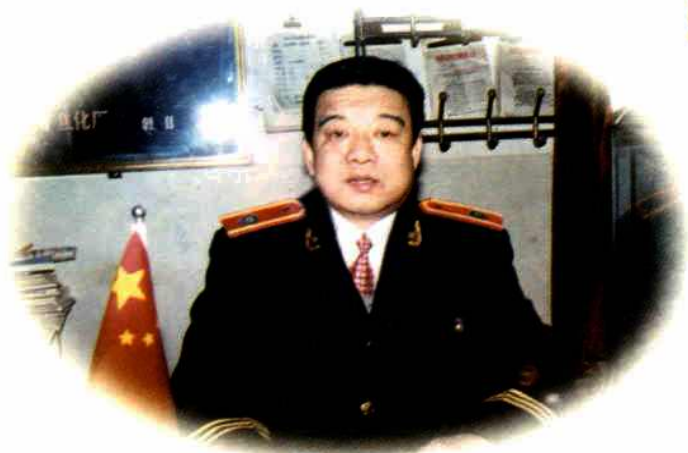
汾阳市环境保护局局长张世森