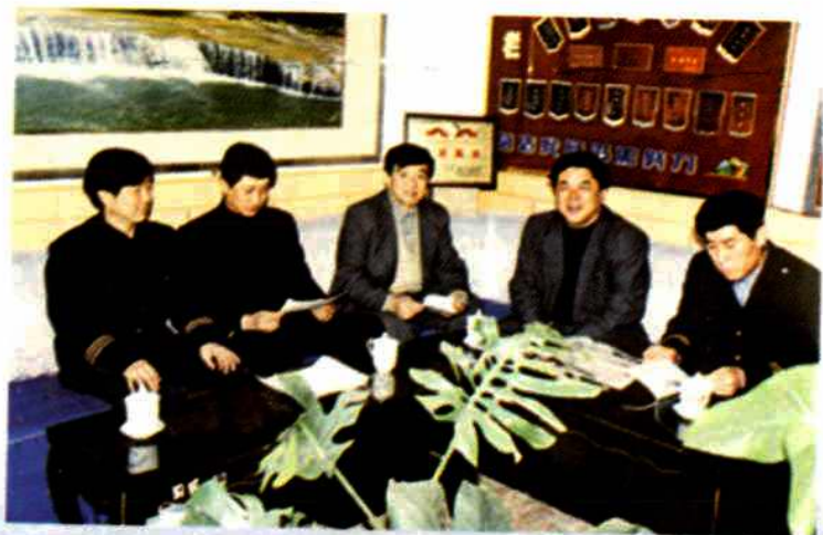
市环保局领导研究工作