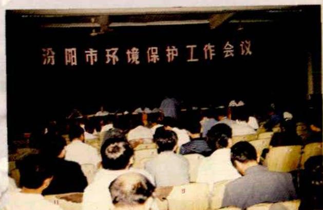
1999年，汾阳市环保工作会议现场。