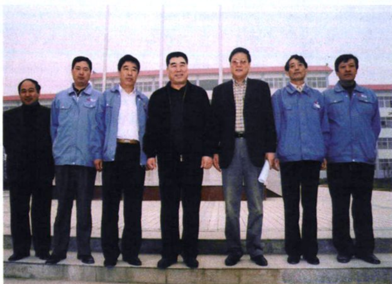
▲ 2004年11月8日，河南省省长李成玉（左四）到公司视察10万吨电解锌工程