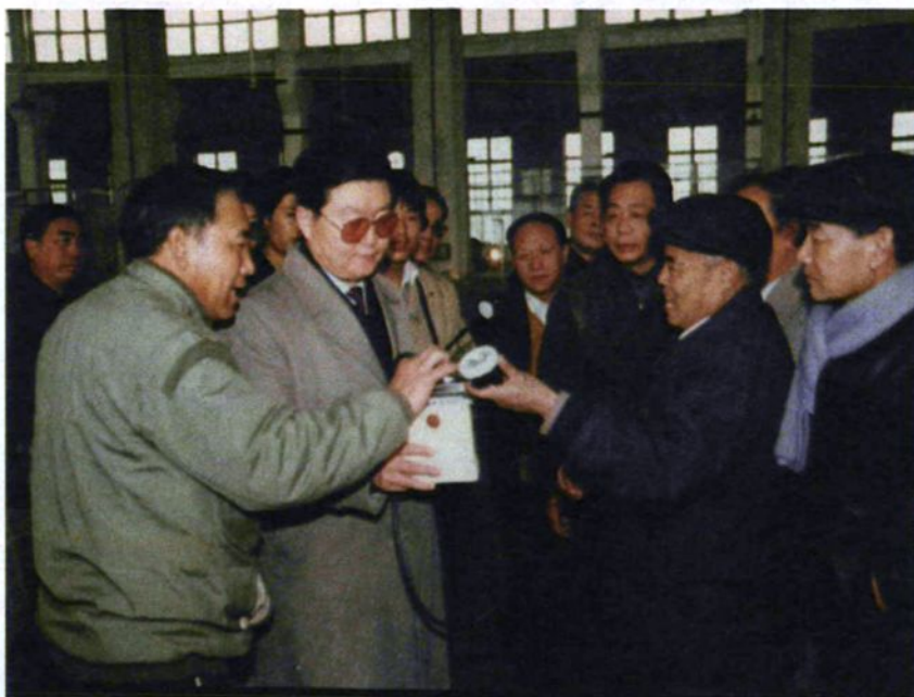
▲ 中央政治局常委、原河南省省长李长春（左二）于1991年12月17日到企业视察