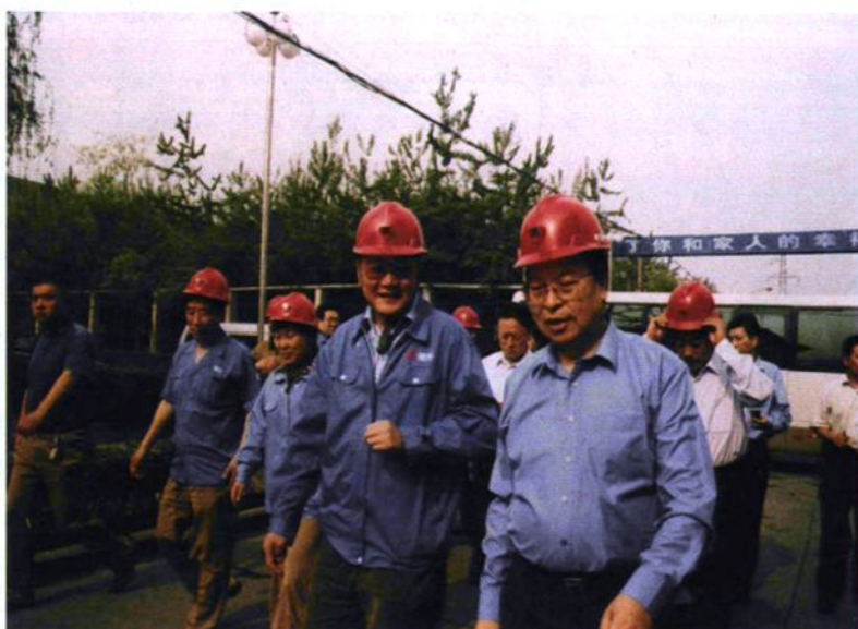
▲ 2005年4月30日，河南省委书记徐光春（右一）到公司视察