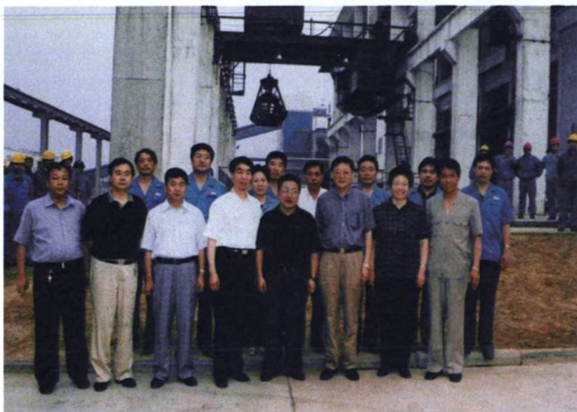
▲ 全国政协副主席、原河南省委书记陈奎元（左五）于2002年7月8日到公司视察