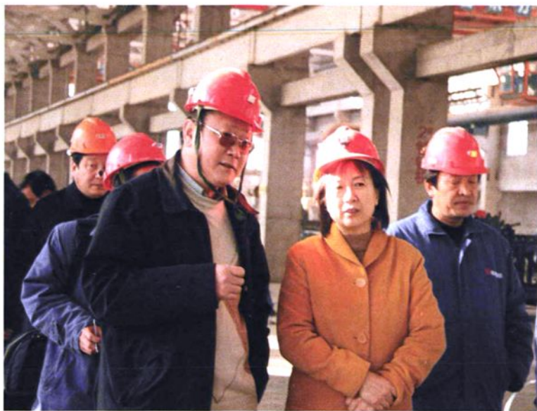
▲ 2007年1月8日，济源市市长赵素萍（右二）到公司视察