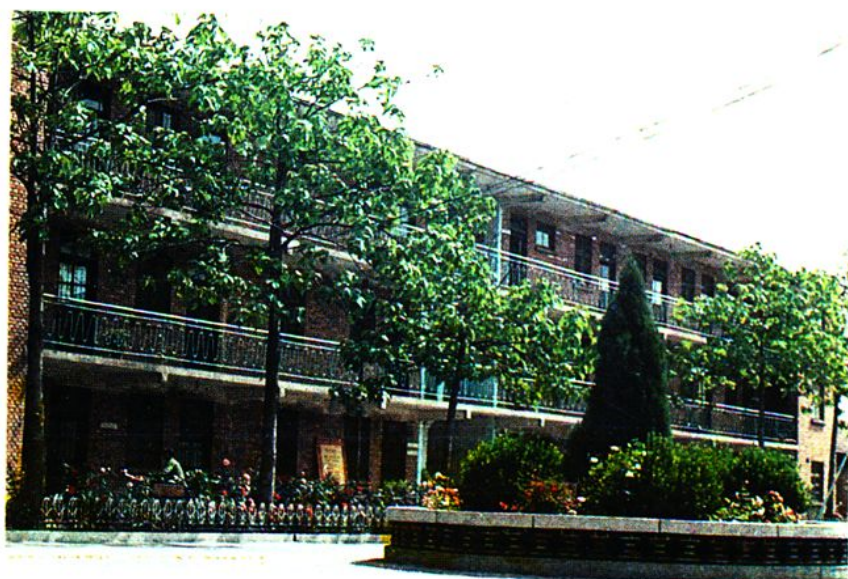
地区物资公司办公楼