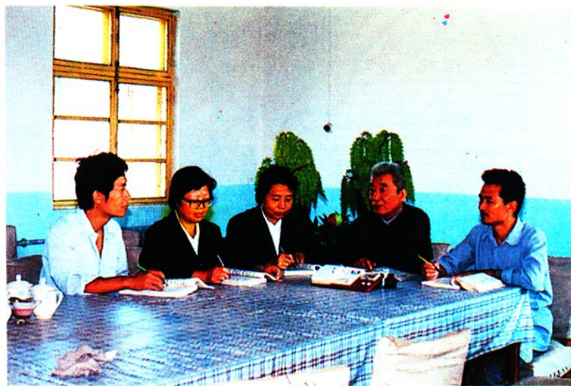
地区物资公司编志办公室工作照