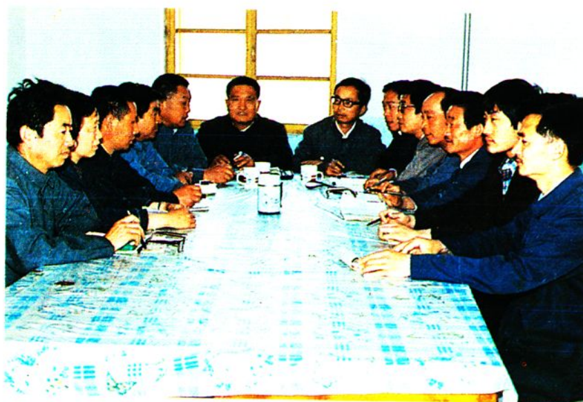
地区物资公司办公会