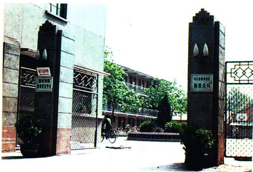
地区物资公司大门