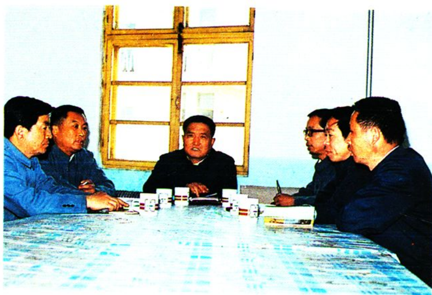
地区物资公司党委扩大会