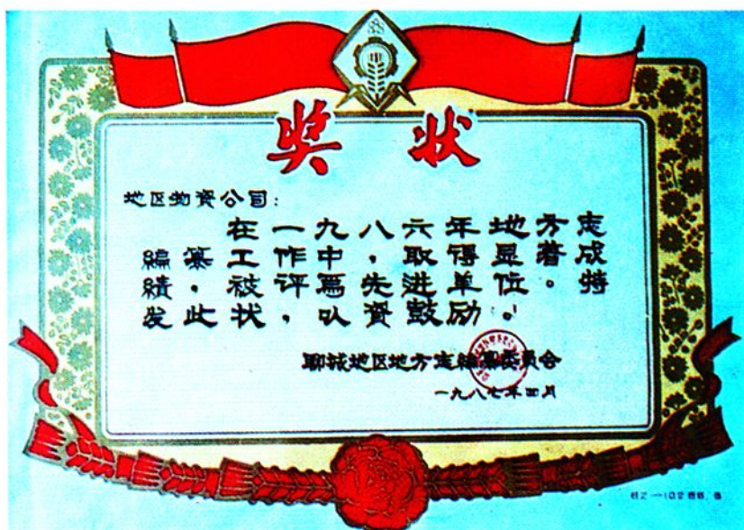
地区物资公司在编志工作中荣获的奖状