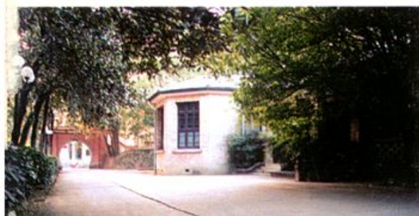
毛泽东同志1959年回韶山时居住过的一号楼

韶山宾馆位于韶山市韶山冲，距毛泽东同志故居500米，是省委、省政府设立在韶山的国宾馆，隶属于湖南省韶山管理局领导。该馆采用传统园林建筑形式，处于青山绿水掩翳映带之中，环境清新幽雅，自1952年建立以来已接待了毛泽东、邓小平、江泽民等党和国家领导人80多位，外国元首14名，外国