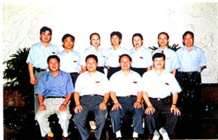
现代化的管理队伍