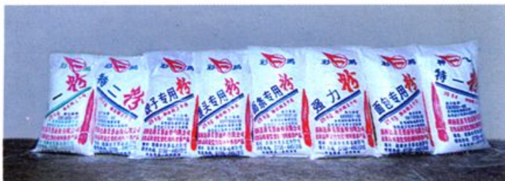
涟源芙蓉面粉公司生产的面粉