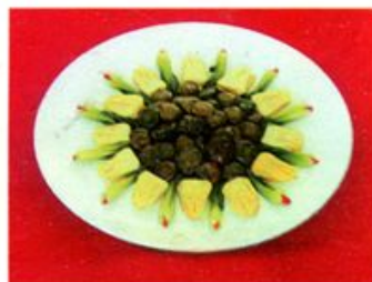
韶山宾馆制作的部分毛家菜肴