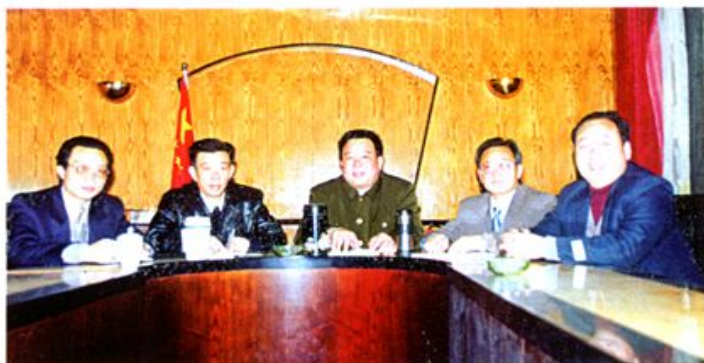
市局领导正在研究工作

娄底市粮食局在全市共有 6 个粮食工作管理局, 6 个粮食贸易总公司, 48 个独立核算的粮食购销企业, 43 个附营企业, 拥有粮食职工 7000 多人。全市多种经营资产达 1 亿元, 有各种设备 158 台(套), 形成了集大米加工、饲料加工、面粉、面条加工等支柱产业, 新开辟了榨油、饮食、宾馆住宿、冷冻食品、彩印包装、养殖等多种经营门路。至 1998 年底, 全区拥有固定资产净值 36740 万元, 储粮网点 184 个, 总仓容 400447 吨, 经营场地 15 万平方米。