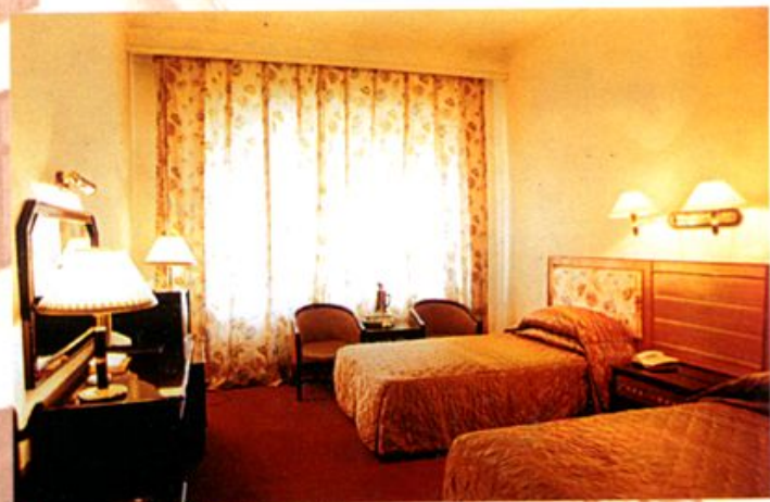
温馨舒适的标准客房

娄底宾馆系湖南省旅游局所设涉外旅游定点单位，是娄底对外的重要“窗口”，紧邻市委、市政府大院。宾馆备有中、高档客房190间（套），403个床位，豪华套房3组；有装饰精美、风格脱俗的大小餐厅26个，会议室15个；配有桑拿、美容、歌舞厅及电话、中