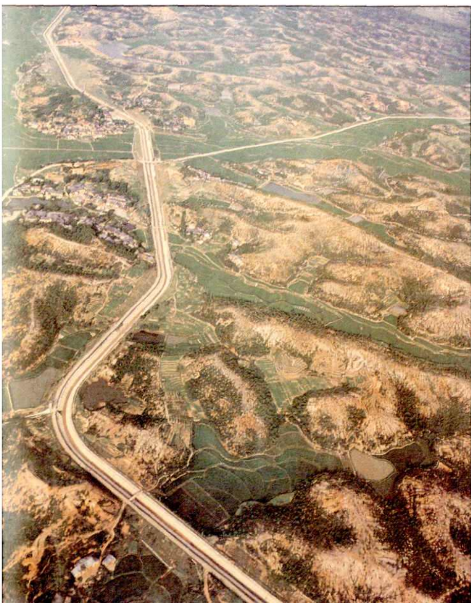
湘北第一大水利枢纽 工程—铁山灌区