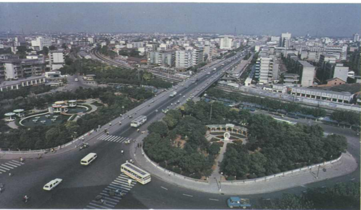
岳阳市城区巴陵大桥及桥头公园