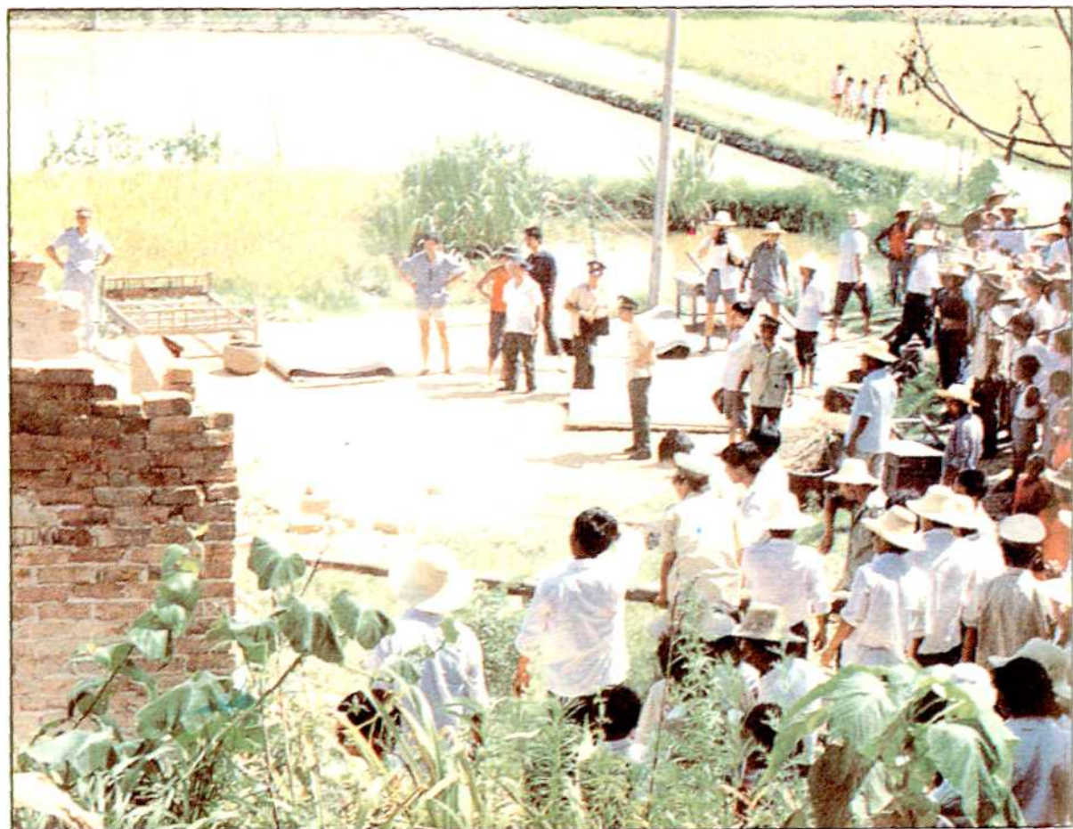
岳阳市国土部门坚持依法管土，图为执法人员拆除违法占用耕地建造的房屋。