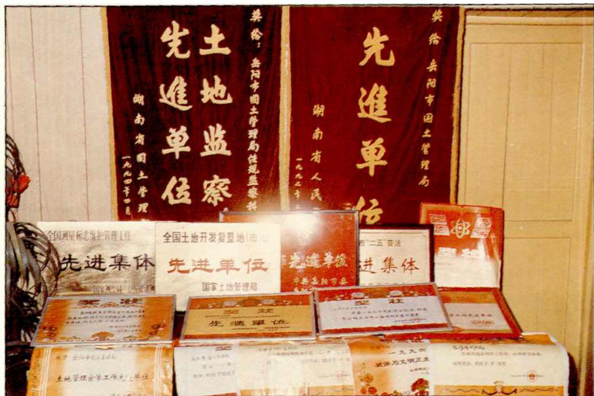
市国土局获得的部分锦旗和奖状