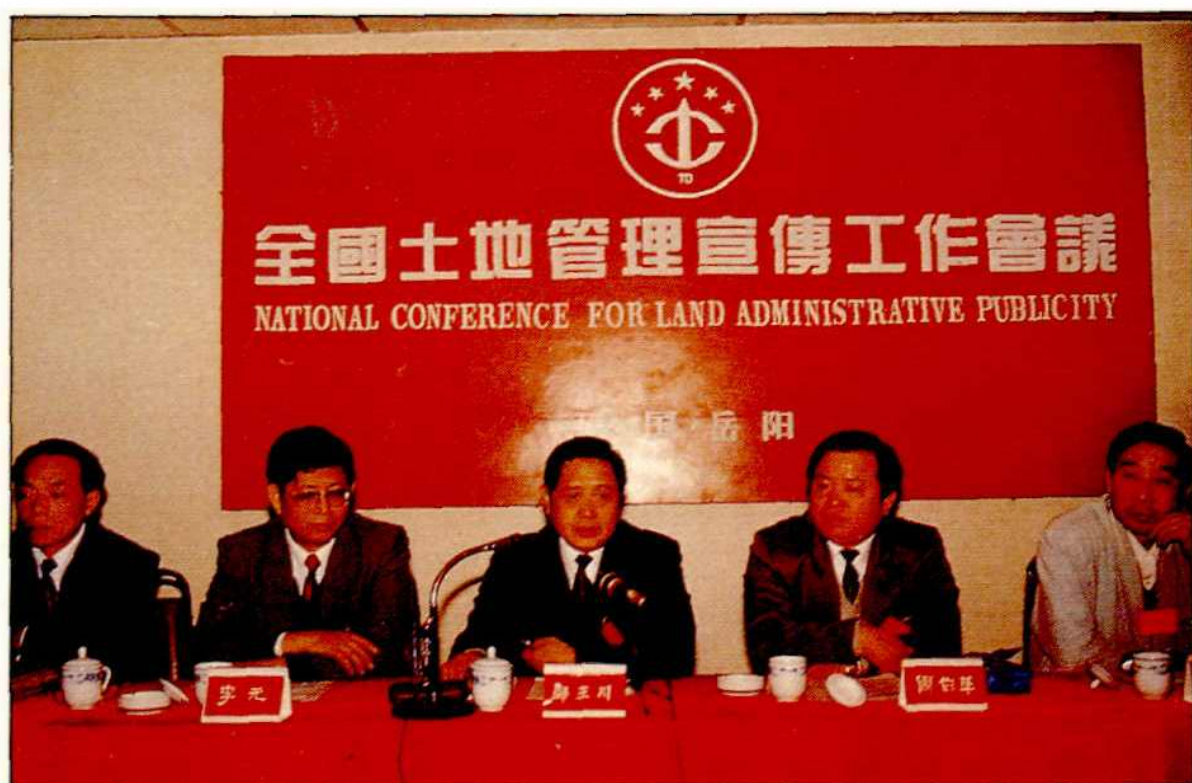
1995年4月，国家土地局在岳阳市召开全国土地管理宣传工作经验交流会，图为国家土地局局长邹玉川（右三）、副局长李元（左二）、副省长周伯华（右二）、省国土局局长邓鸿章（右一）、市长黄甲喜（左一）在主席台上