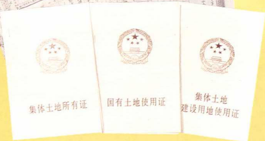
新中国成立后颁发的土地权利证书