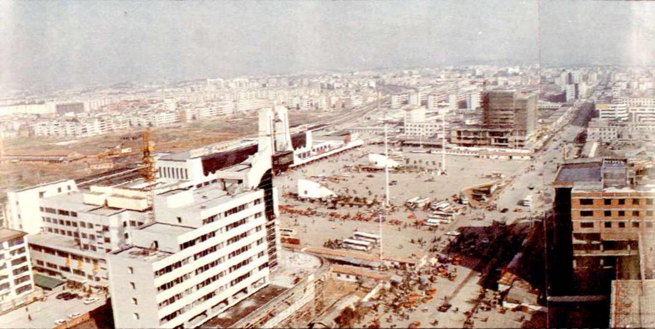
欣欣向荣的岳阳市新城区（一九九六年摄）