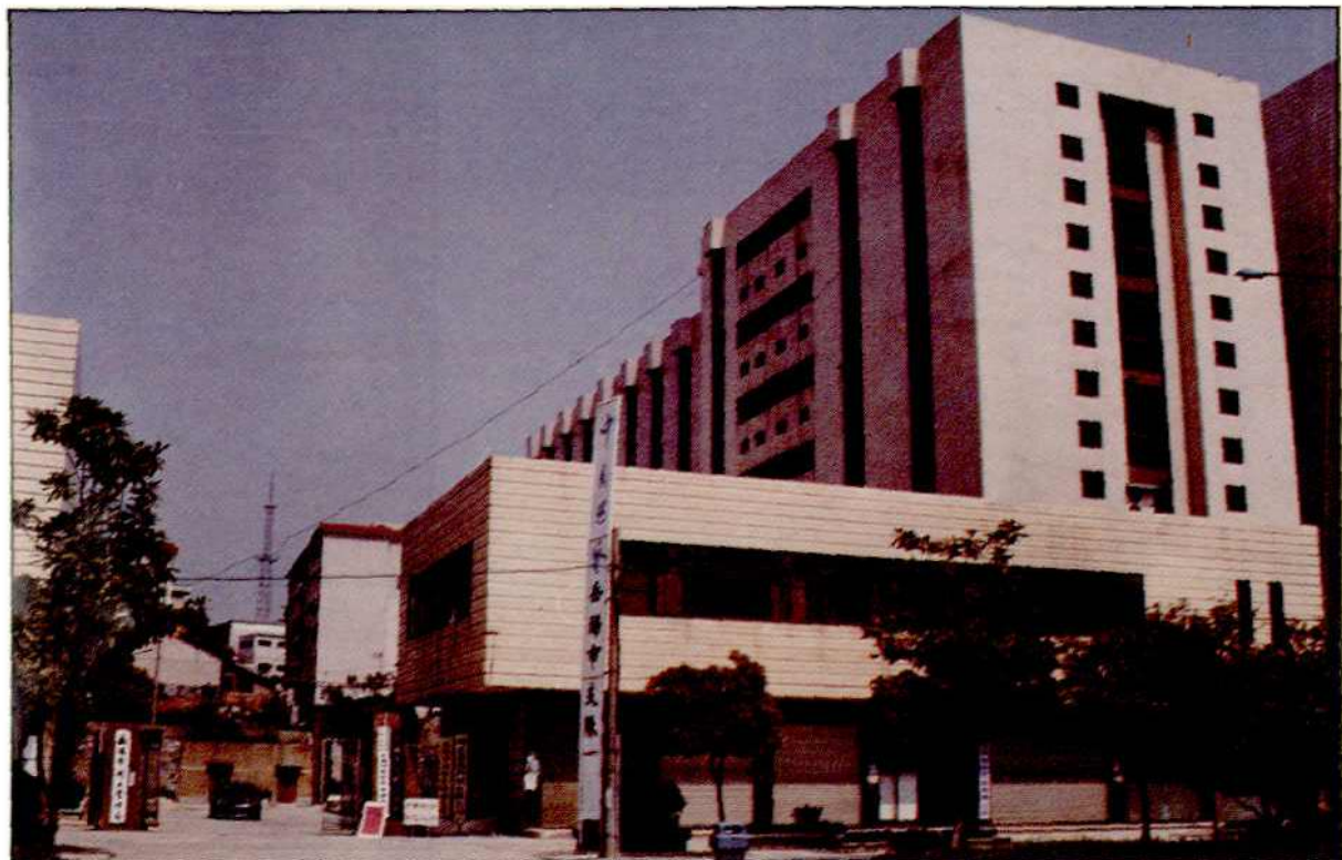
市国土局办公大楼