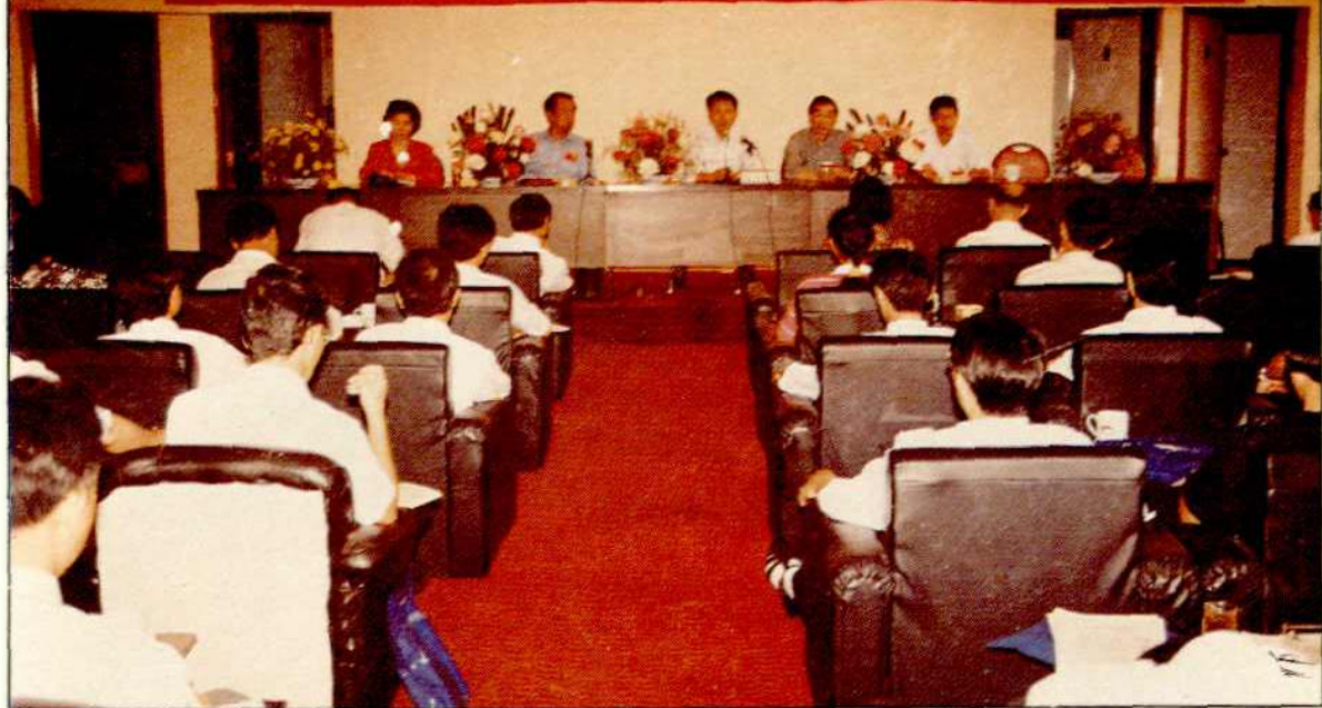
一九九一年五月，在岳阳市召开的全国土地利用计划管理工作研讨会。