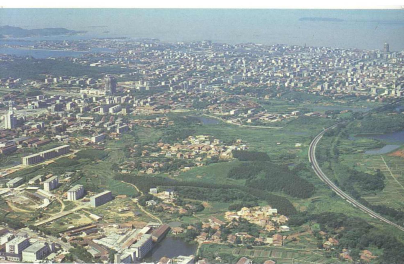
岳阳市城区鸟瞰(一九八七年摄)