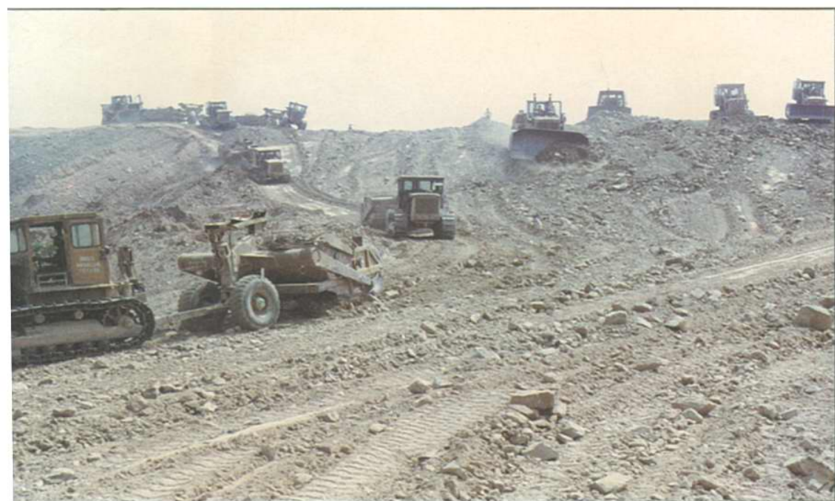
为城市建设开山造地