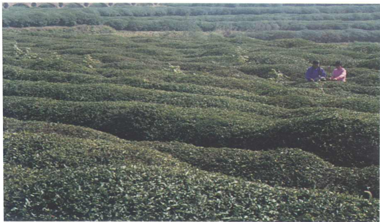
山丘区开发的成片茶园