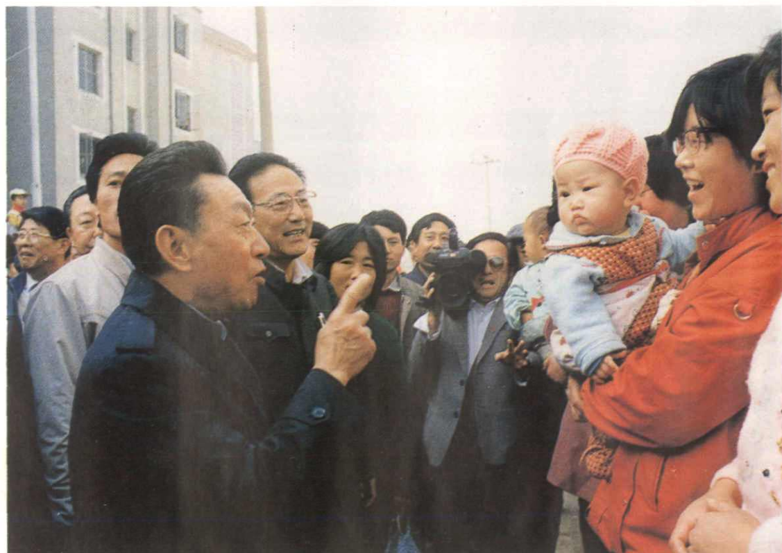
◇ 1989年10月15日，陈希同市长在视察义宾小区时与市民亲切交谈。