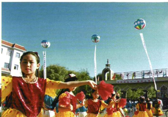
◇ 载歌载舞庆“六一”，哈密市回城小学学生跳着民族舞进入公园。