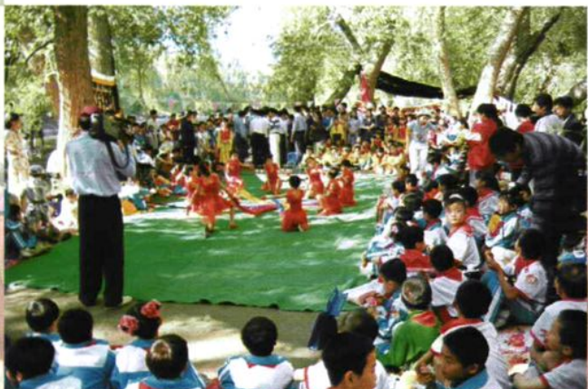
载歌载舞庆“六一”，哈密市各民汉学校师生在联欢。