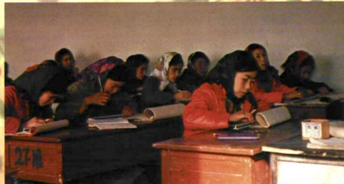
◇ 1988年，哈密市被评为全国扫除文盲先进县[100县(市)之一]。图为哈密市柳树沟牧场扫盲班学员脱盲后在进行巩固提高学习。