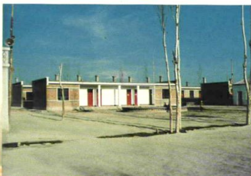
哈密市上阿牙小学新建校舍。