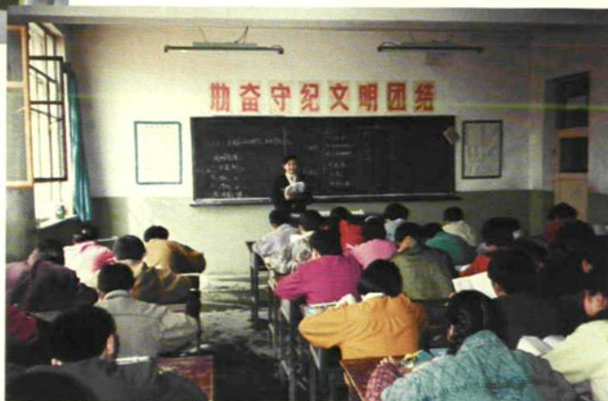
巴里坤第一中学创建于 1948 年，多年来培养了不少各类有用人才，图为教师在上课。