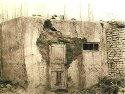
哈密市上阿牙小学于 20 世纪 30 年代创建时的教室。