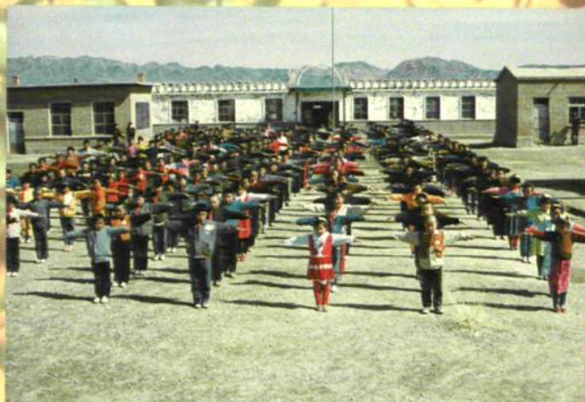
牧业地区寄宿学校蓬勃发展。图为伊吾县盐池乡寄宿学校学生正在做课间操。