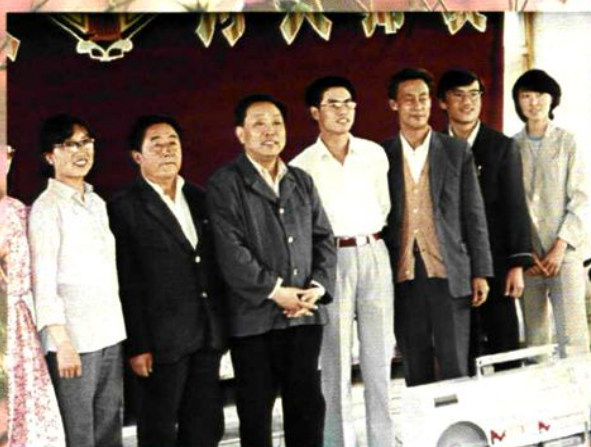
◇ 自治区党委书记宋汉良（右五）在地委书记韩鹏图（右三）、专员阿尤甫（右六）的陪同下到师范学校看望首届中央讲师团在哈密地区支教的部分成员。