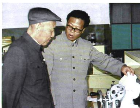
◇ 自治区人大副主任张少彭（左）在哈密师范学院视察工作。