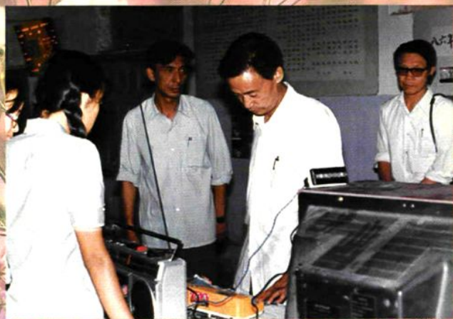
◇ 地委书记韩鹏图（右二）在哈密市三中视察并现场办公。