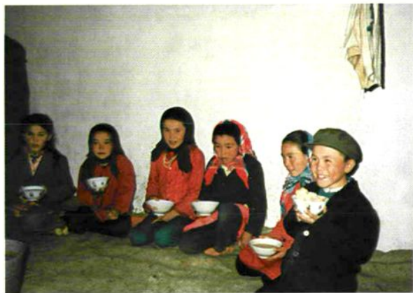
◊ 气候寒冷多变的伊吾县前山乡寄宿制学校学生，在宿舍的热炕上吃一碗热奶茶泡饽，已感到很满足了。