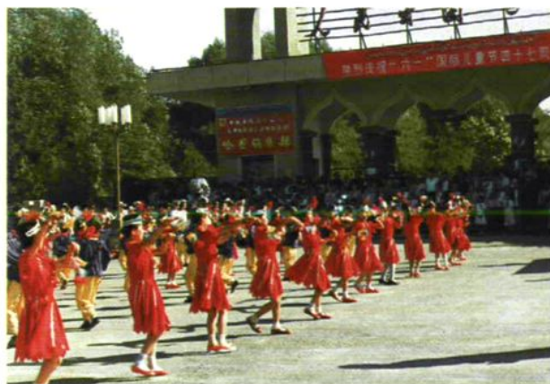
◇ 载歌载舞庆“六一”，哈密市花园小学学生表演文艺节目。