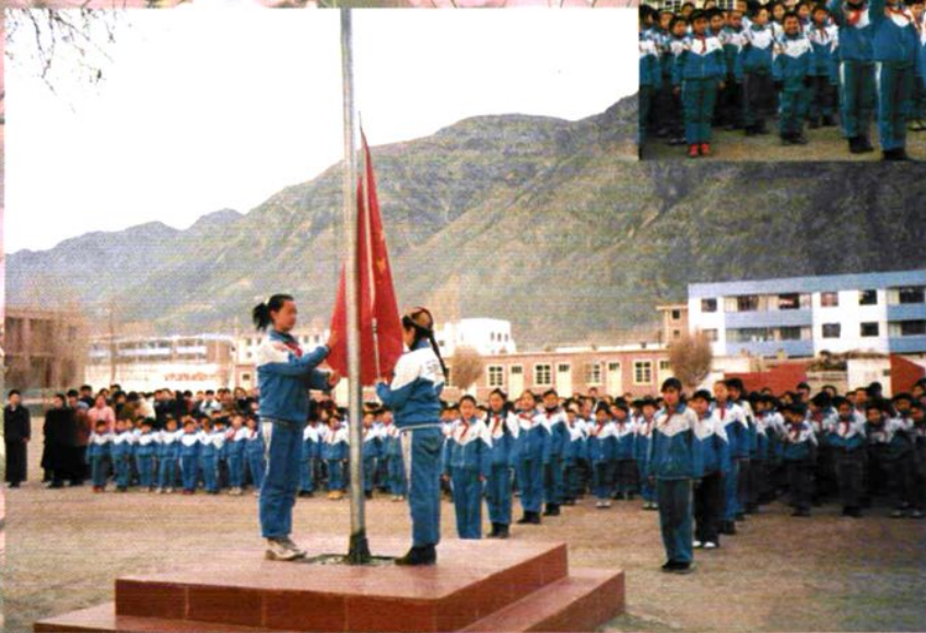
◇ 伊吾县小学师生在升国旗。