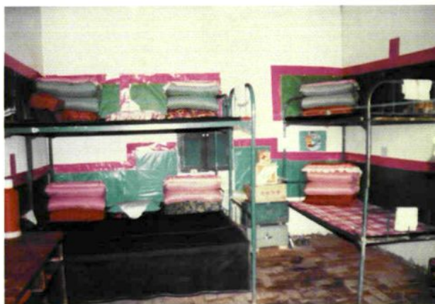
◇ 巴里坤花园乡牧场哈萨克族寄宿制学校是所较好的民办学校。图为学生宿舍。