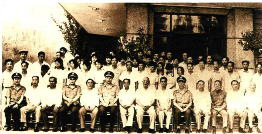
◇ 中共中央总书记胡耀邦（右八）在自治区党委书记王恩茂（右七）、人大主任铁木尔·达瓦买提（左三）、自治区主席司马义·艾买提（右四）、自治区政协主席贾那布尔（右二）、自治区人大副主任李嘉玉（左二）、地委书记韩鹏图（右六）、专员阿尤甫（左五）的陪同下视察技校时与职工合影留念。