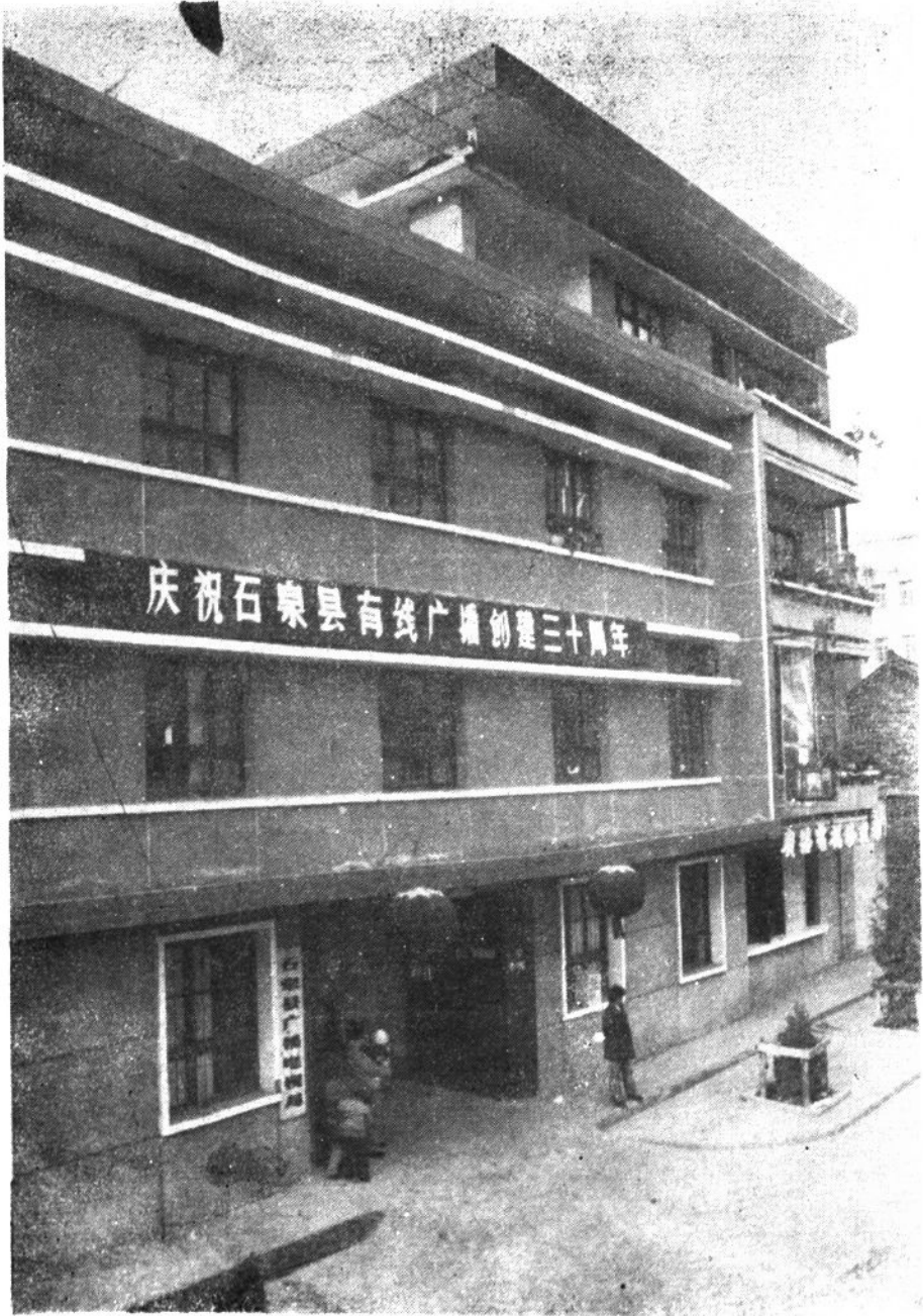
石泉县广播电视局大楼