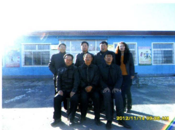
2001年5月—2004年4月西跃村“两委”班子成员