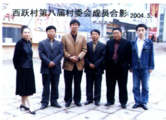
西跃村第八届村民委员成员