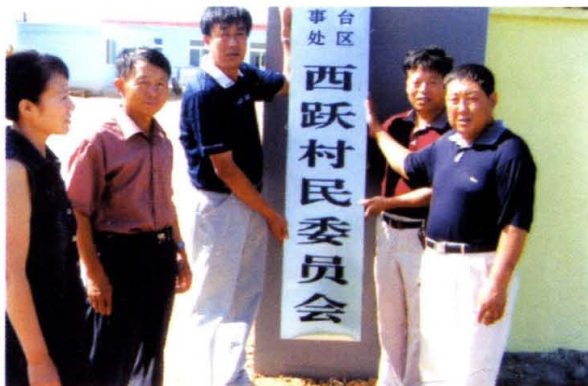
西跃村第九届村民委员成员