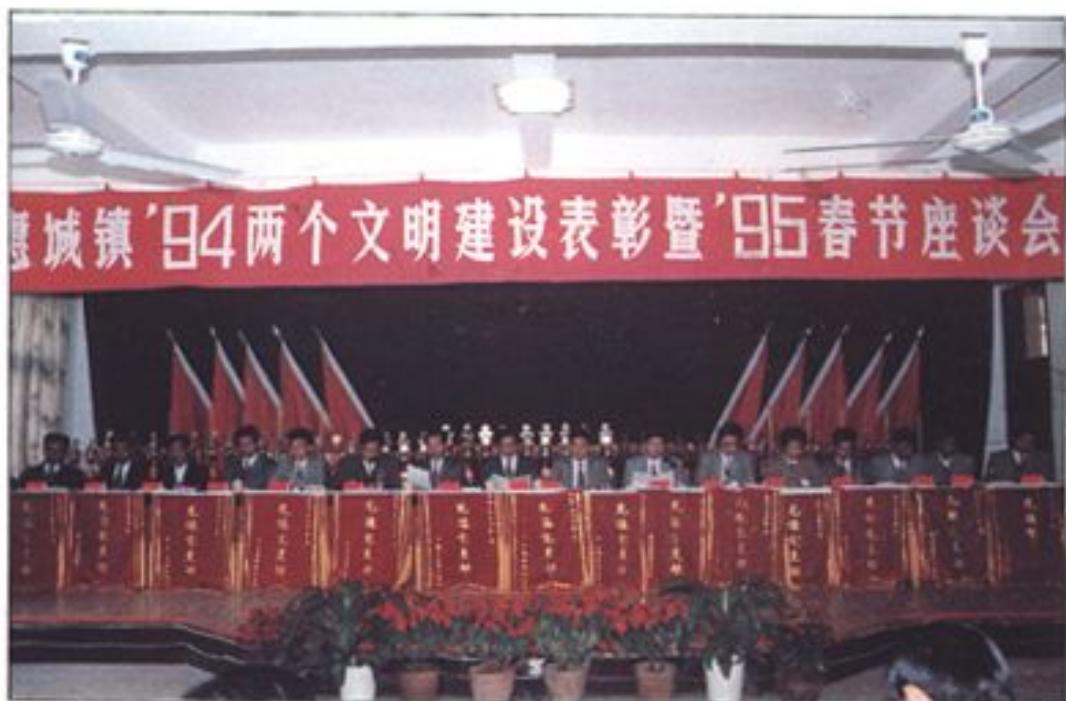
鎮黨政領導在惠城鎮'94兩個文明建設表彰暨'95春節座談會主席台上