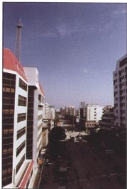
葵和公路縣城過境路段