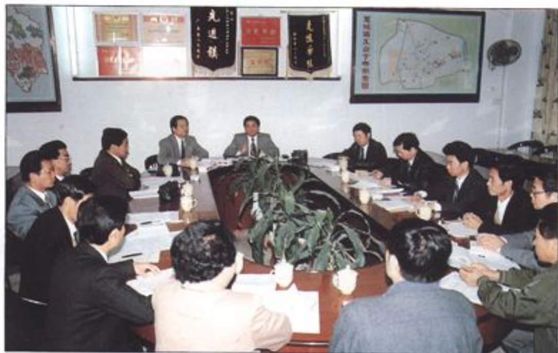
惠城鎮委、鎮政府領導班子在研究部署工作