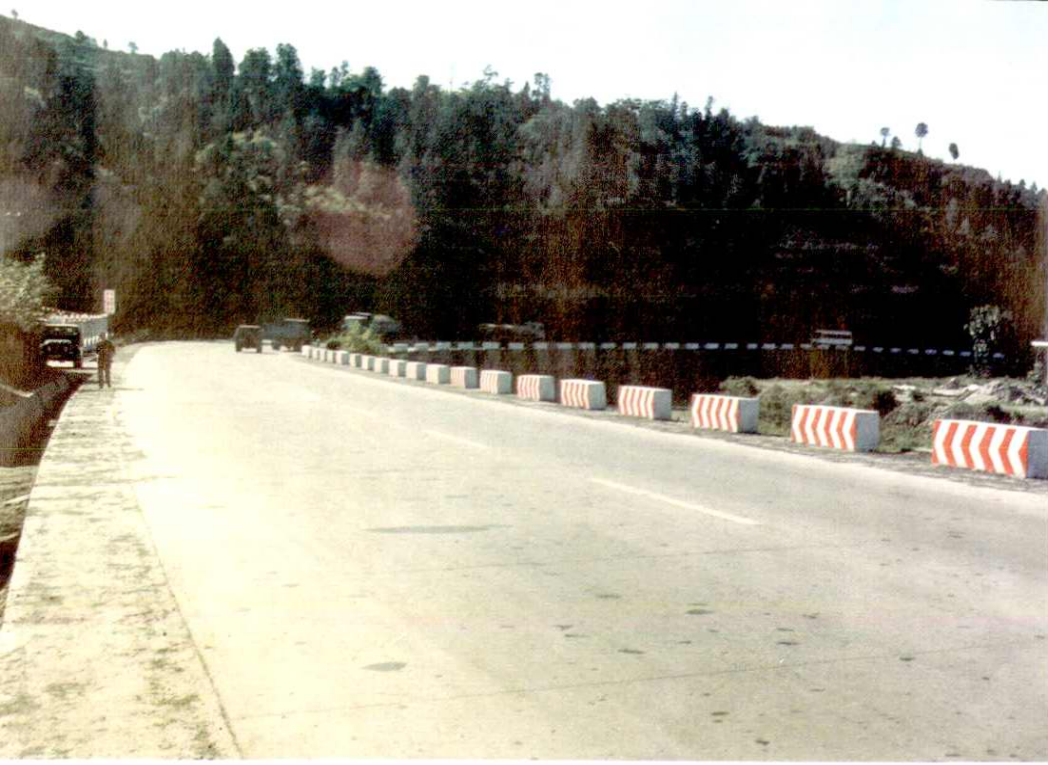
210国道（西包公路）铜川段