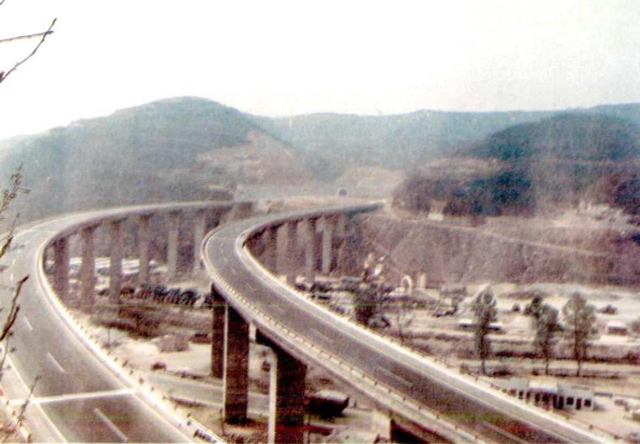
铜(川)黄(陵)高速公路 上的纸坊高架桥