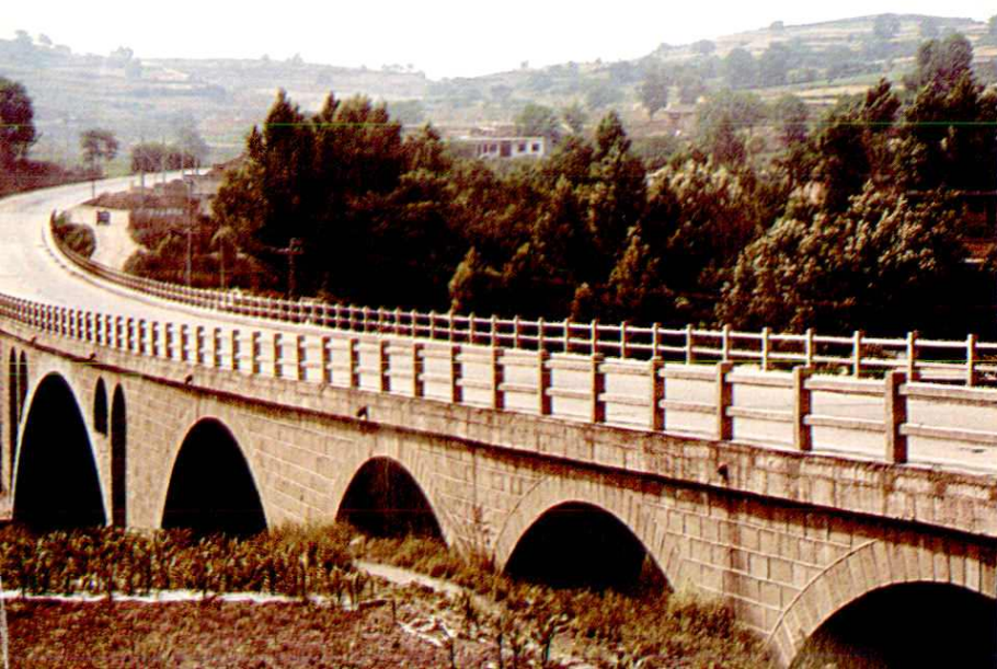
烈(桥)柴(沟)二级地方公路焦坪大桥