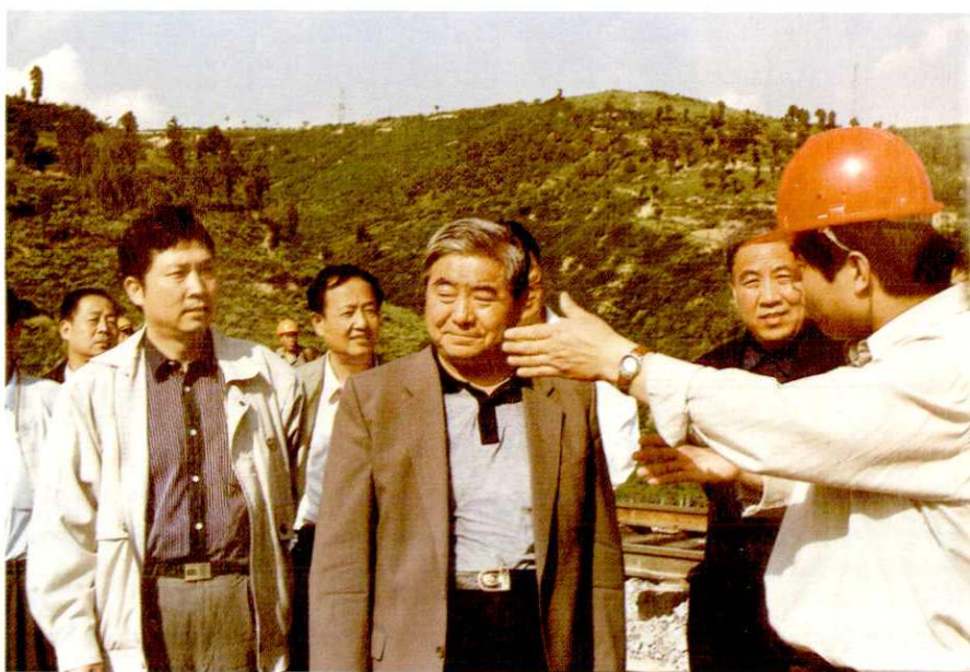
程安东省长（中）视察 铜黄高速公路建设工地