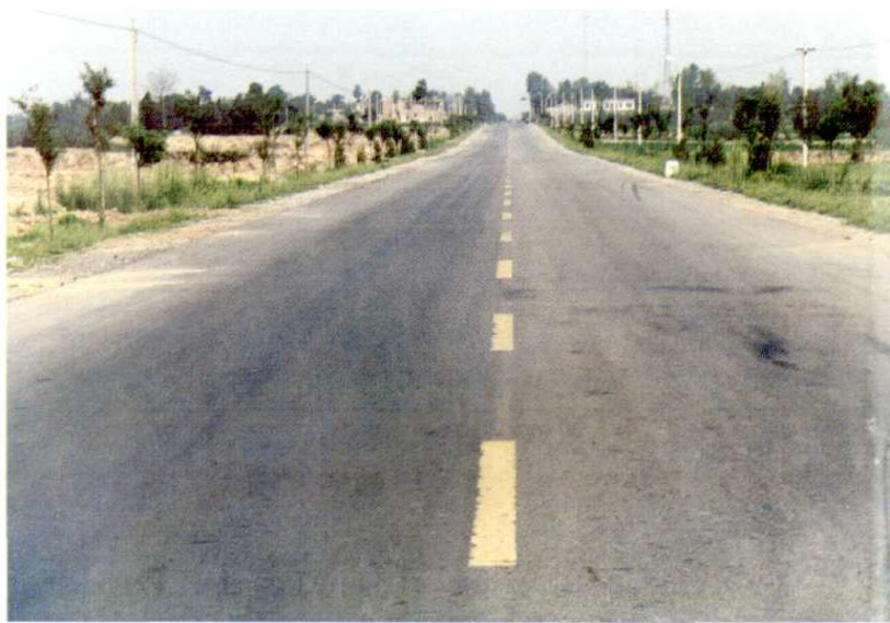
耀（县）柳（林）二级地方公路