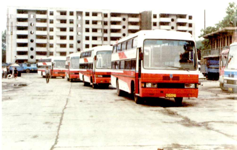
铜川市第一汽车运输公司豪华客车队