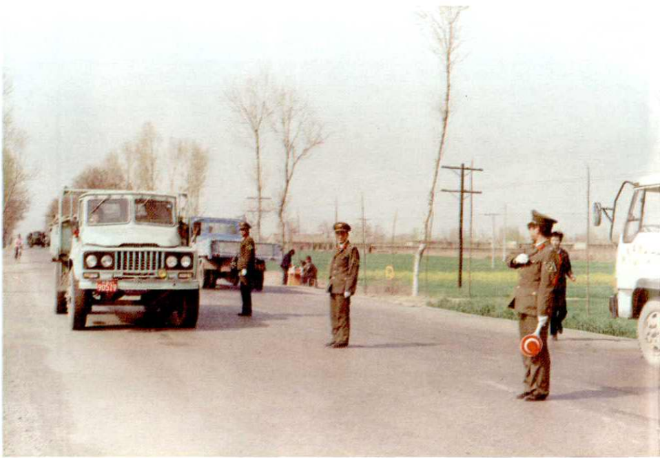
运政管理稽查人员执行公务