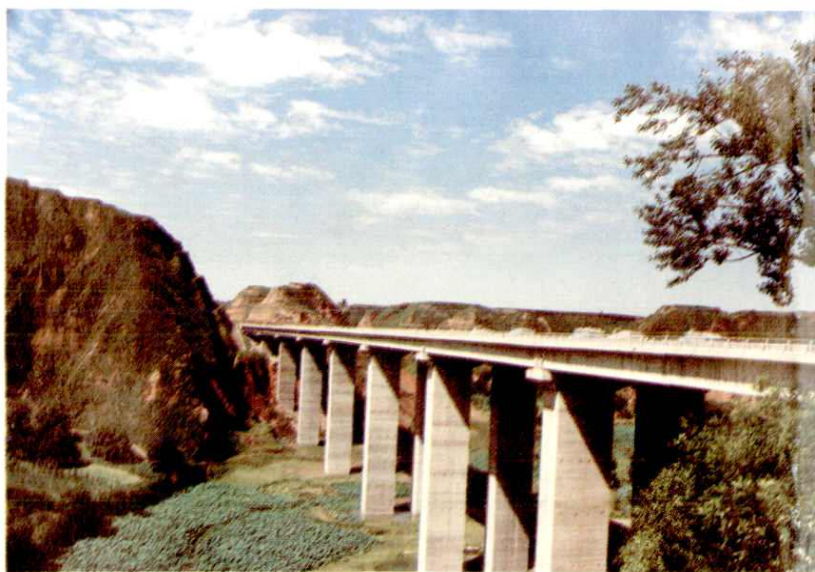
西(安)铜(川)一级公路 赵氏河大桥