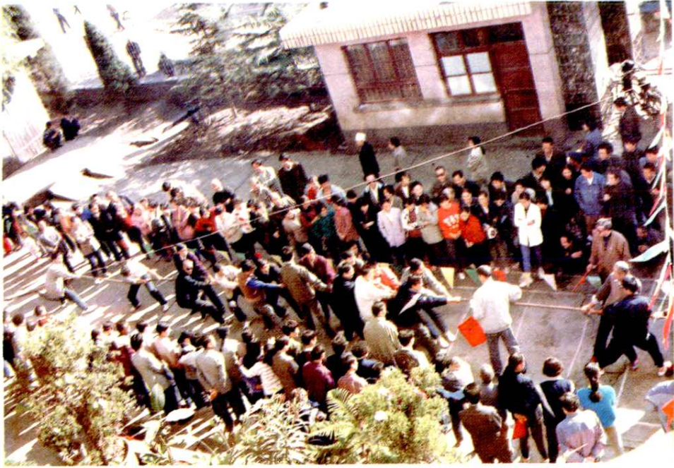
丰富多彩的职工业余生活