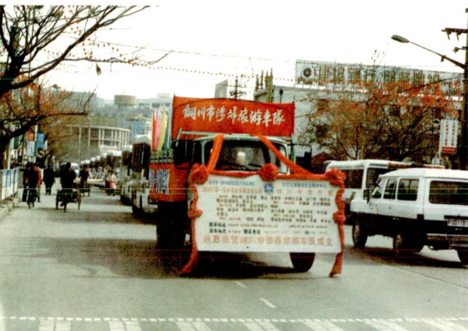
铜川市第一汽车运输公司的 涉外旅游车队