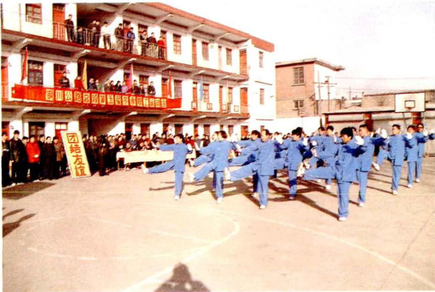
铜川公路总段第五届冬季职工运动会太极拳表演