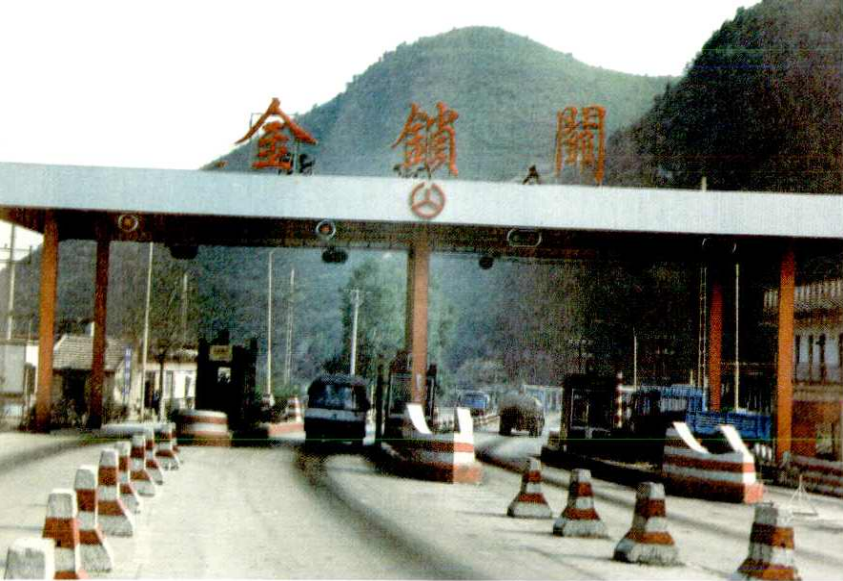
210国道金锁关收费站