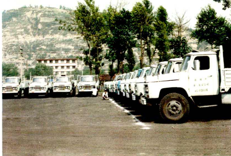
铜川市第二汽车运输公司 货运车队