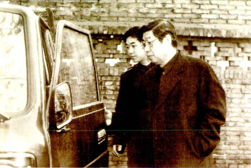
中共陕西省委书记张勃兴在 铜川市秦丰农用车总厂视察