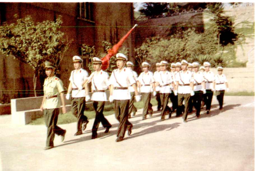
运政管理人员参加军训