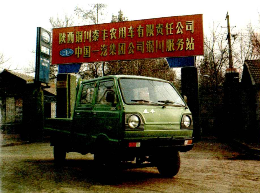
1993年由铜川汽车运输公司、陕西省 东风机械厂共同研制生产的秦丰牌农用车