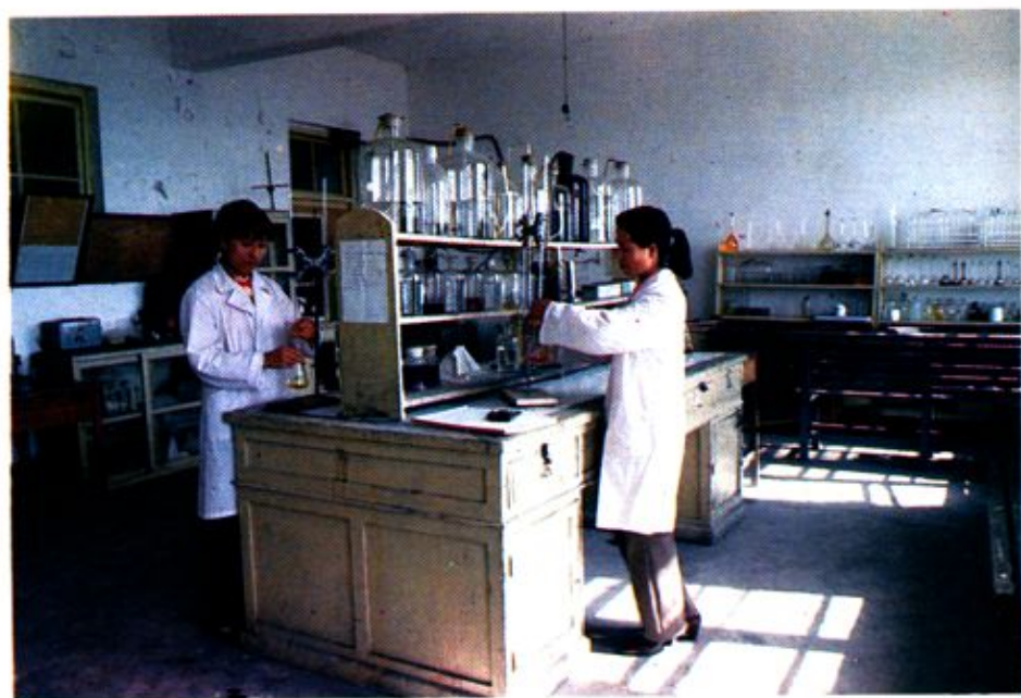
化 驗 室