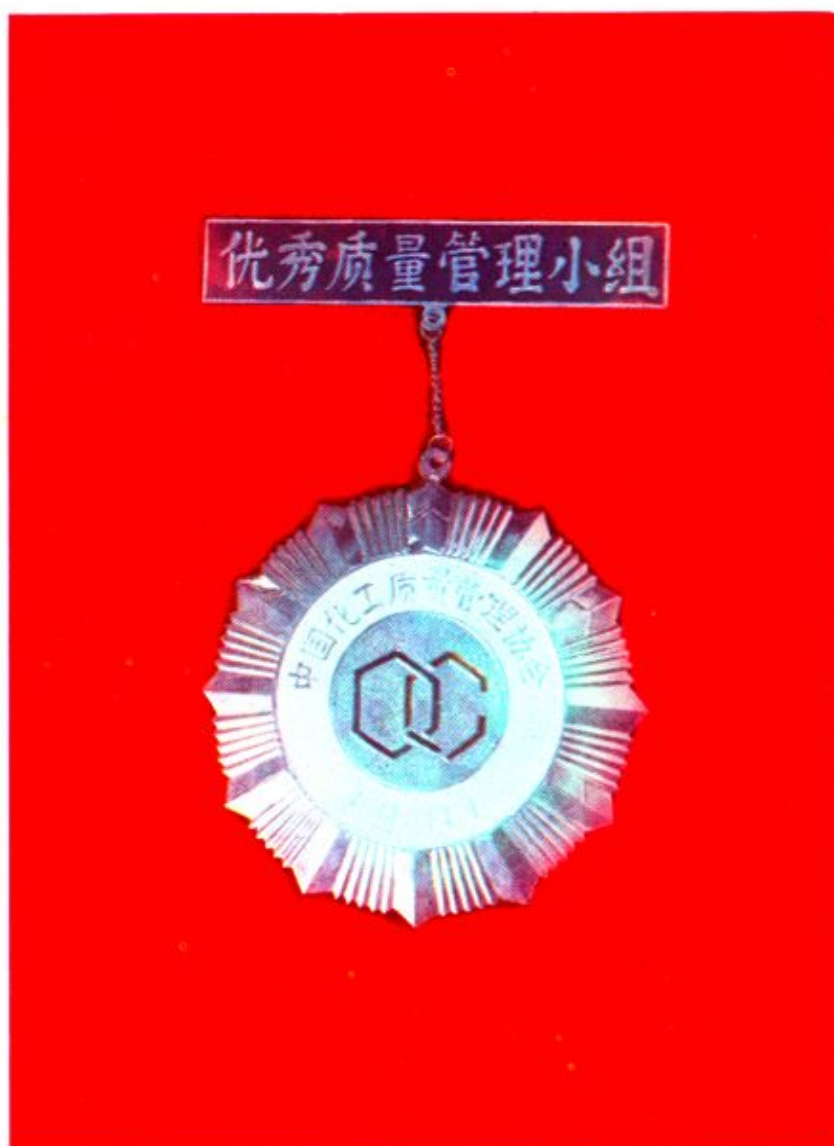
一九八一年获化工部质量管理银牌