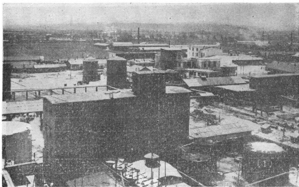
厂区一角 (近影大楼为蒸发工段)