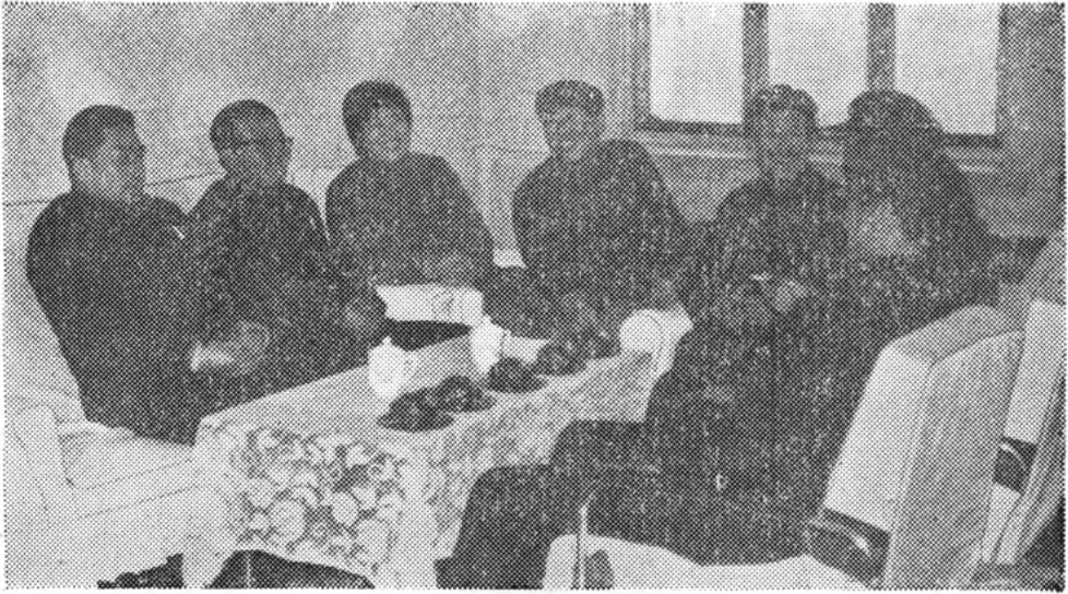
厂务会议正在研究加强企业管理问题 (八二年)