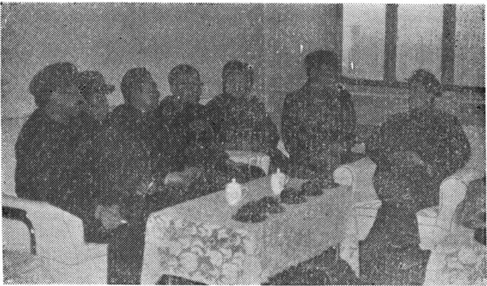
研究工厂远景规划的党委会正在进行 (八二年)