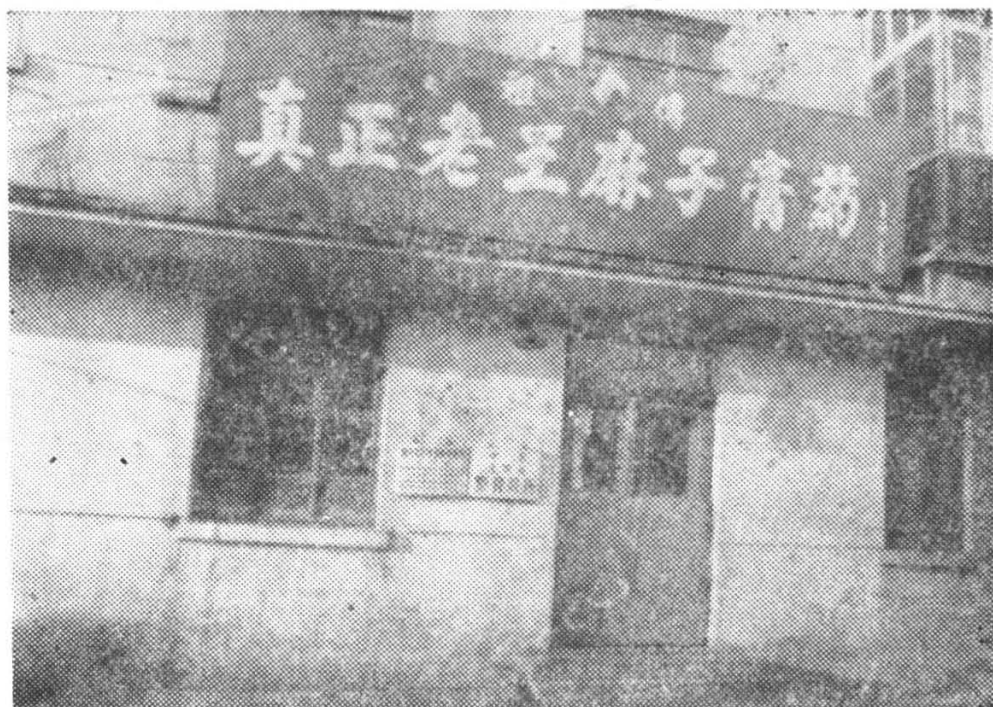
一九八一年复业后的“真正老王麻子膏药”店（道外区富锦街233号）