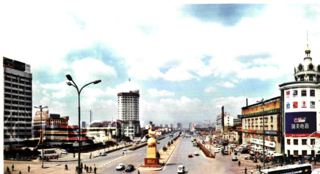
世纪大道——长风大街