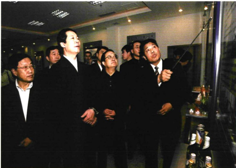
2004年山西省省长张宝顺（前左二）、太原市委书记云公民（前左三）、太原市市长李荣怀（前左一）来太原经济技术开发区调研，小店区委书记、太原经济技术开发区管委会主任张金旺（前右一）在介绍工作