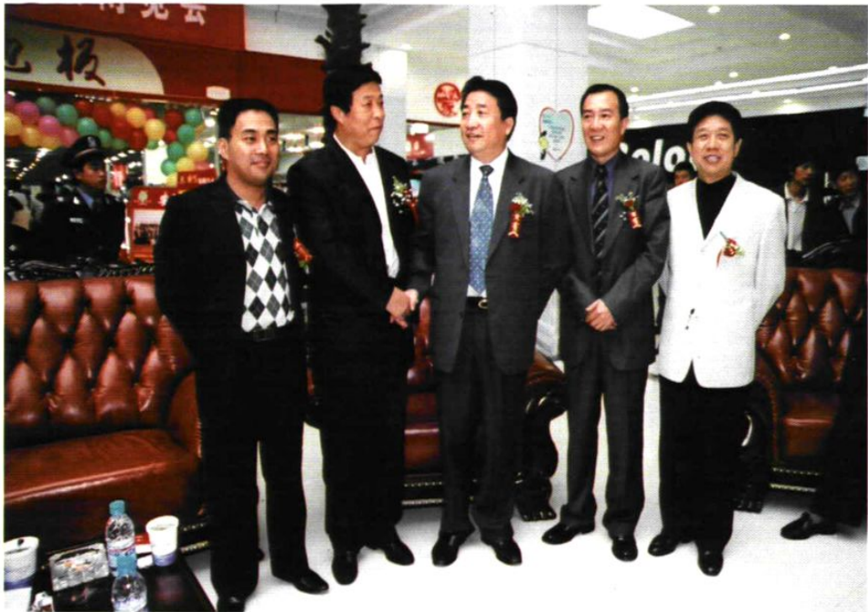
2005年，居然之家开业。图为太原市委副书记郭振中（左二）、小店区委书记柳逢记（右一）同相声艺术表演家姜昆（中）、戴志诚（右二）在一起