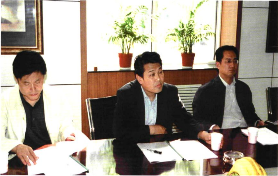
区委书记张金旺，区委副书记、区长常青，区纪委书记连金会在基层调研