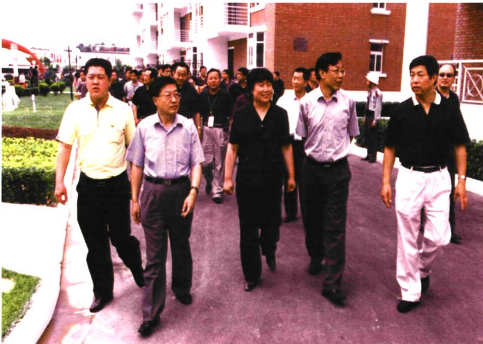
2003年，省领导视察小店城镇建设。图为山西省副省长靳善忠（右二）、太原市市长李荣怀（左二）、太原市委副书记郭振中（右一）、小店区区长荣福香（中）