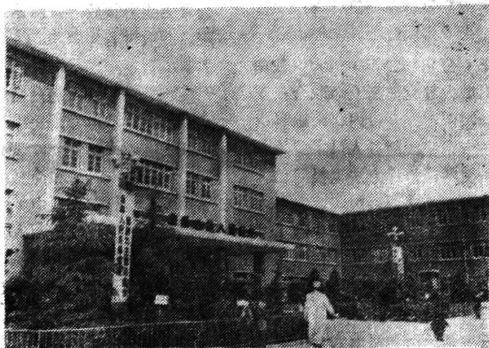
图为南阳地区人民医院门诊大楼

1949年2月，建立南阳市公立人民医院，原址设武庙（今南阳地区人民医院家属院），有医务人员八人，设病床23张。同年7月与南阳专署卫生所合并，更名为南阳专区公立人民医院。1951