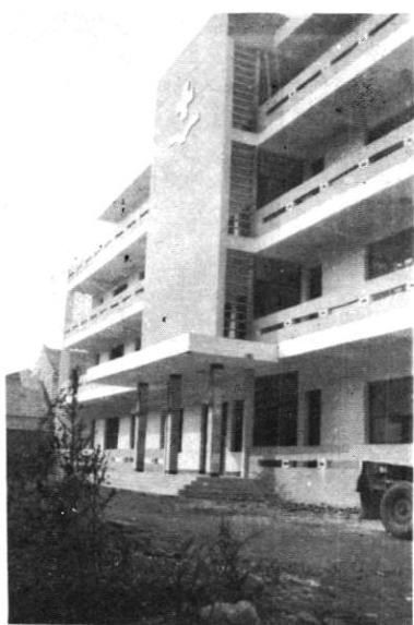
县卫生学校教学楼