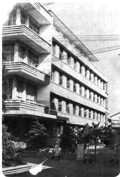
县中医医院 住院部