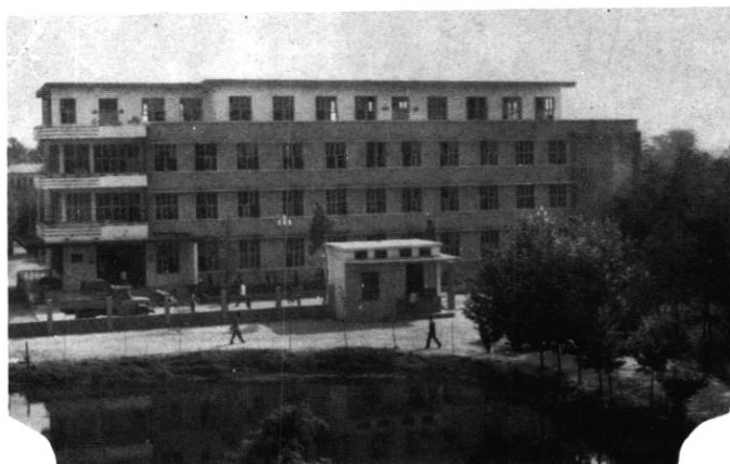
县第二人民医院 住院部