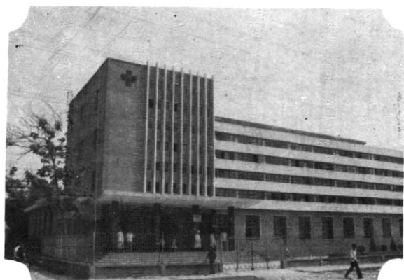
沙湖中心卫生院门诊部