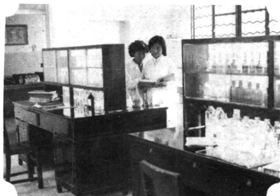
县药检所实验室一角