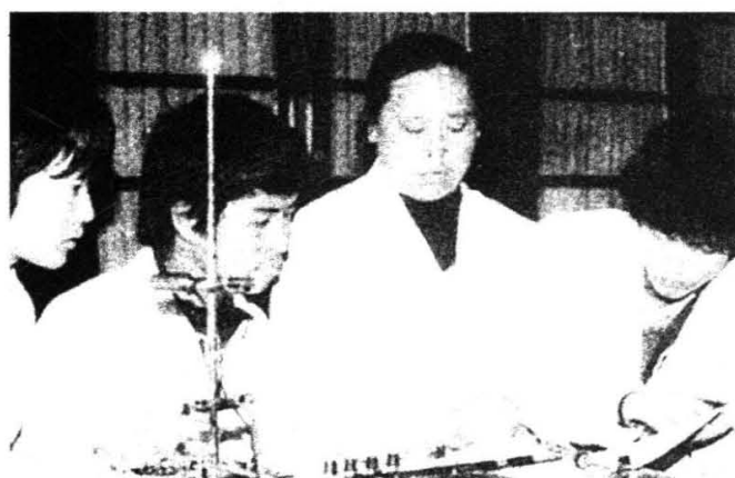
学生在教师指导下分析药理实验资料