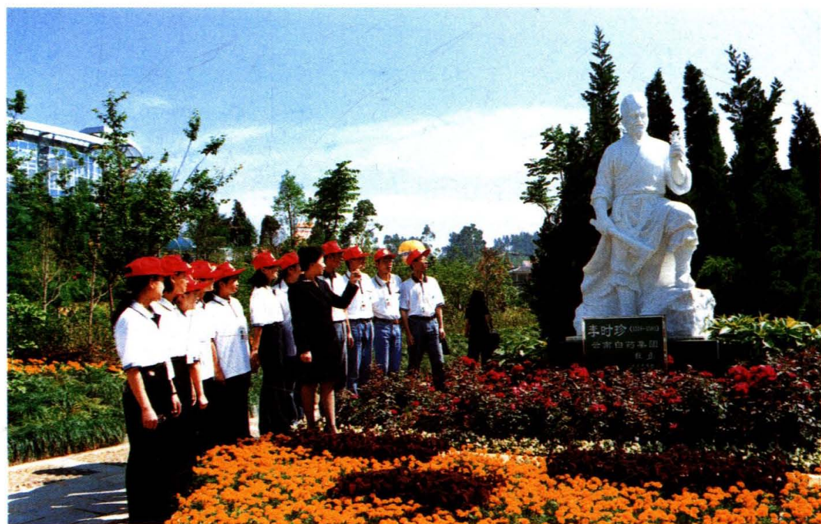
我院青年志愿者在建成的中国'99昆明世界园艺博览会药草园进行导游及咨询工作培训