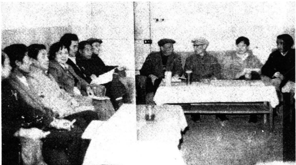
原学院党委扩大会议