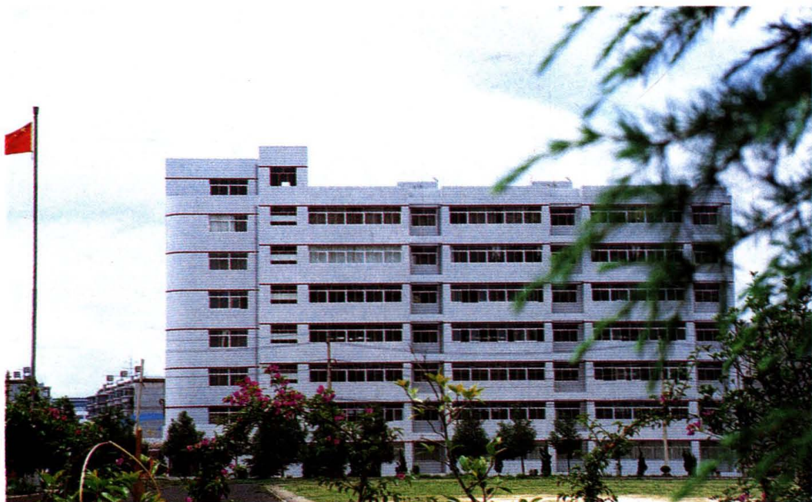
双桥校区医学实验楼全景