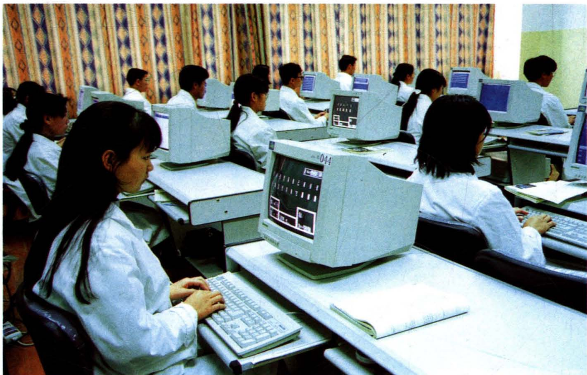
我院学生进行计算机教学实习