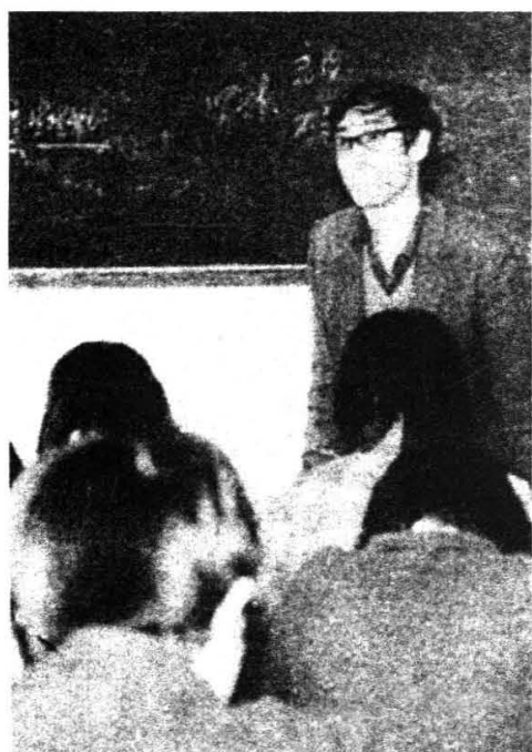
教授在给学生上课