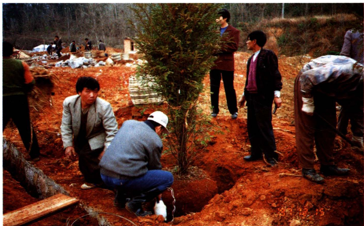
我院师生全力以赴投入中国'99昆明世界园艺博览会药草园初期建设