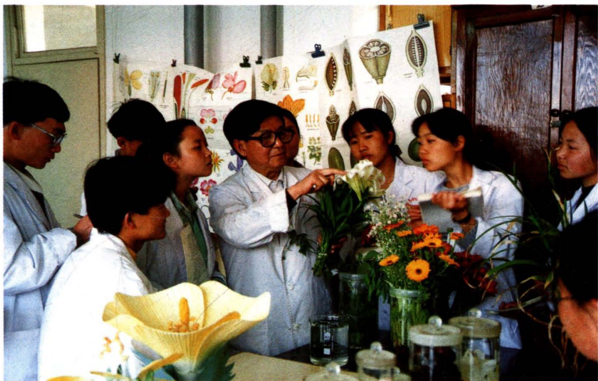
教师指导学生识别生药标本