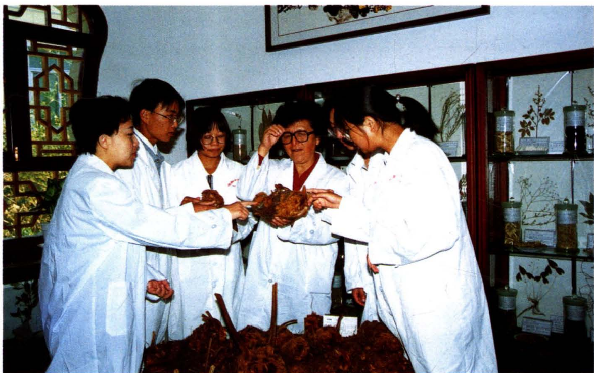
教授指导学生鉴定中药材