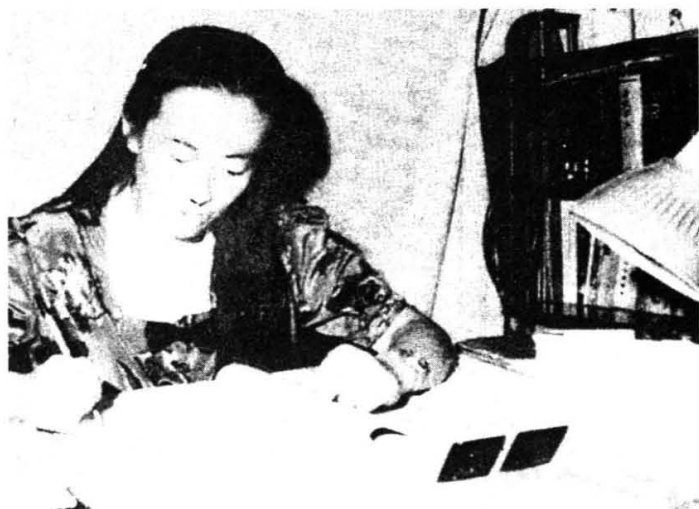
校友尤江云—中国第一位 女中医博士