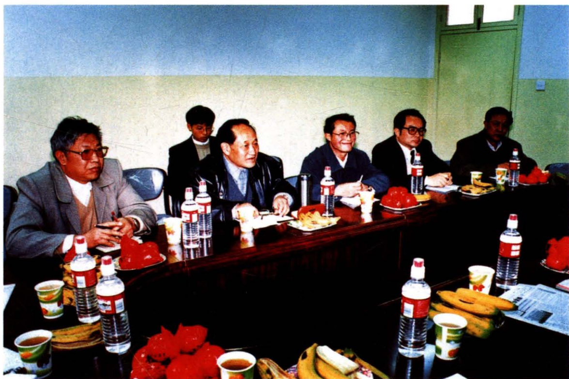
学院领导向上级汇报工作