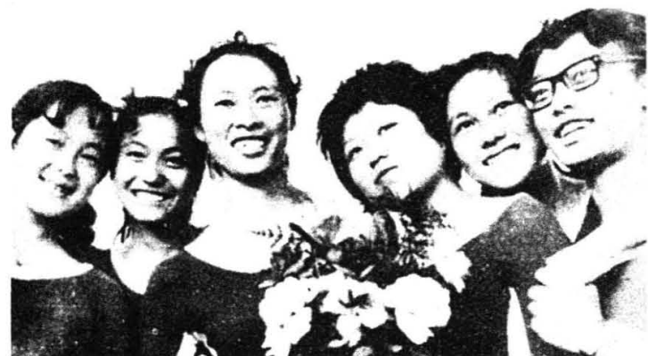
曾获云南大专院校首届体操锦标赛 女子团体冠军的学院体操队队员