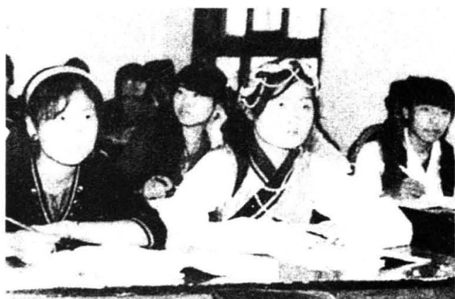
兄弟民族学生在上课