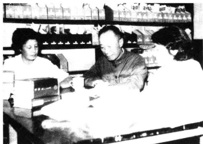
教授和青年教师共同编写五版教材 《方剂学》