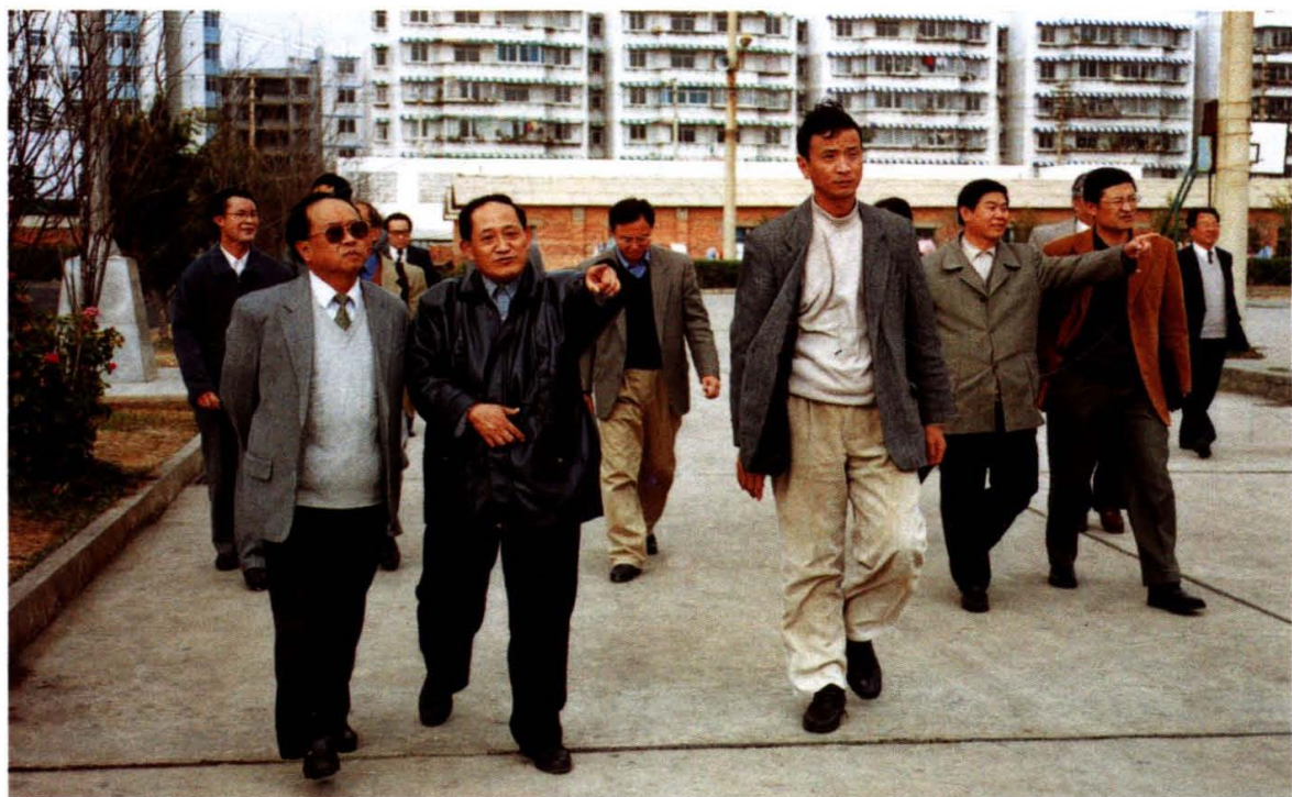
云南省副省长梁公卿同志视察我院双桥校区