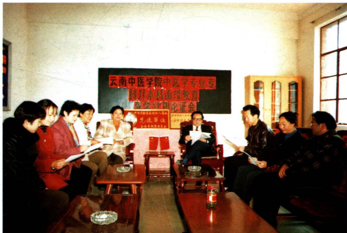
学院成教部对中医专业专升本函授教学计划进行论证