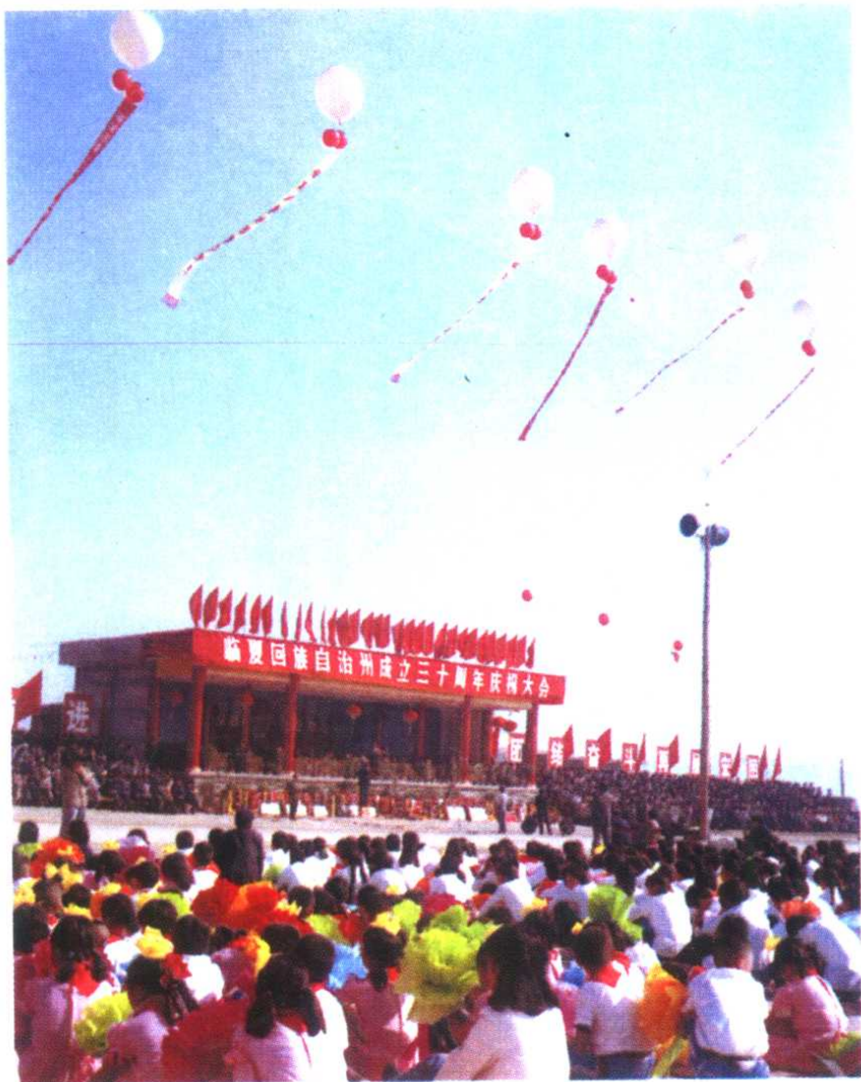
宁夏回族自治区成立三十周年庆祝大会会场