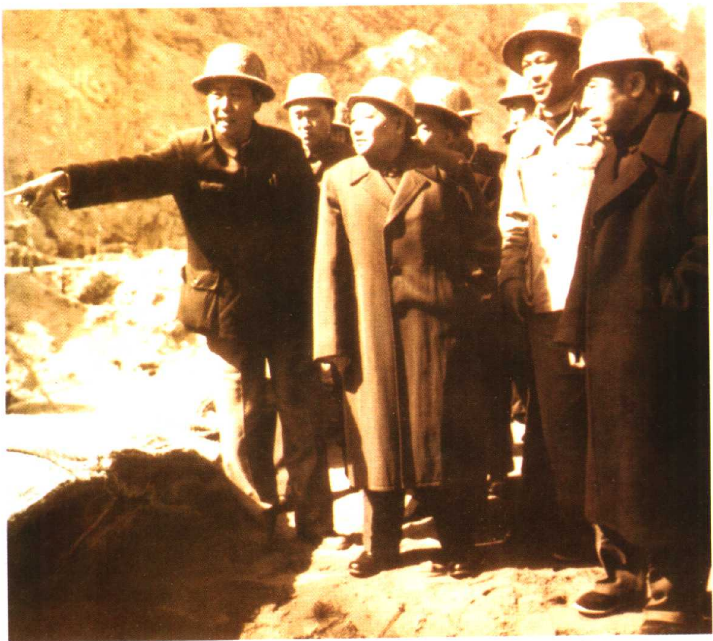
1966年4月邓小平同志视察刘家峡电站建设工地