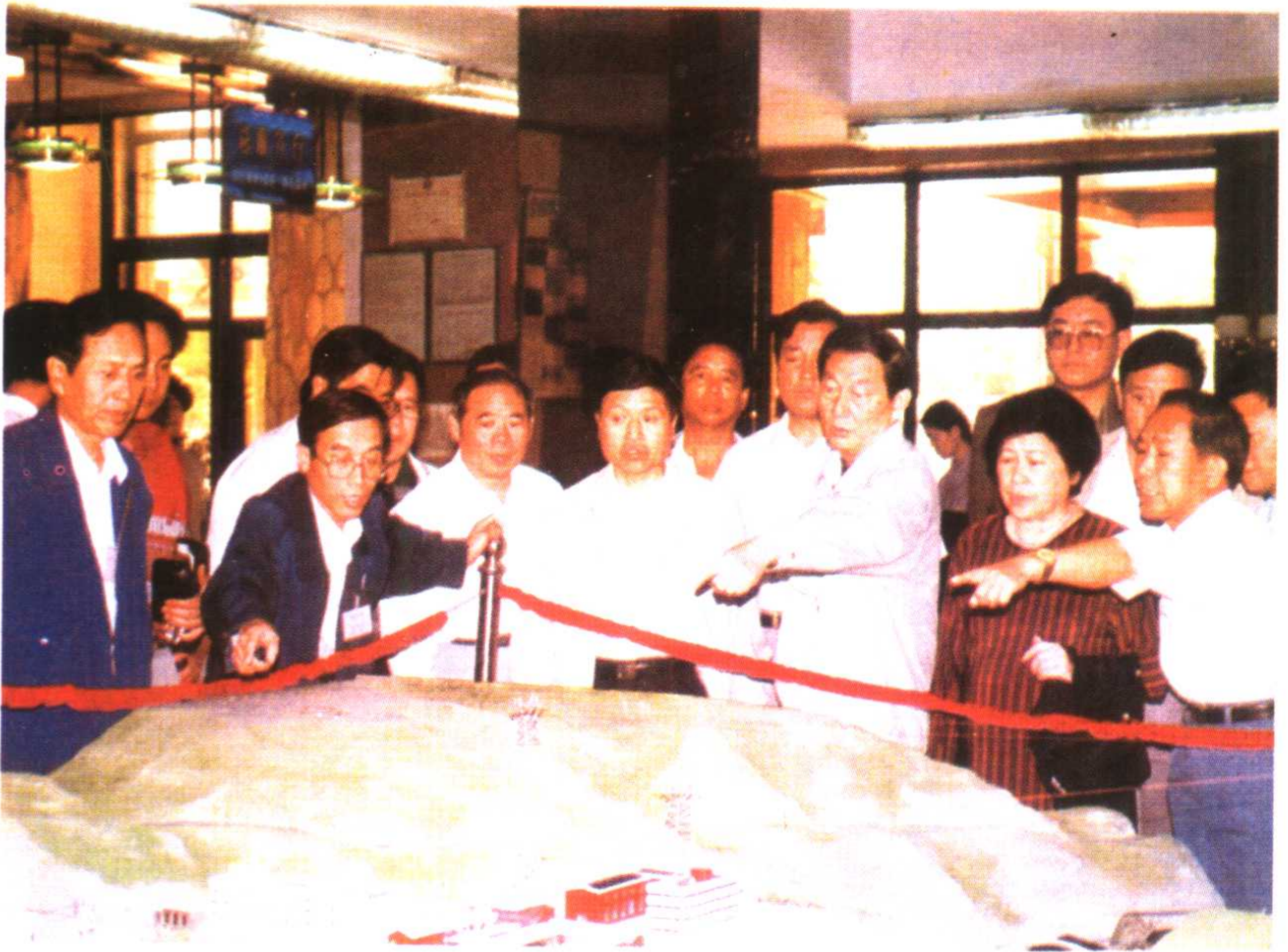
1996年7月朱镕基同志视察刘家峡库区