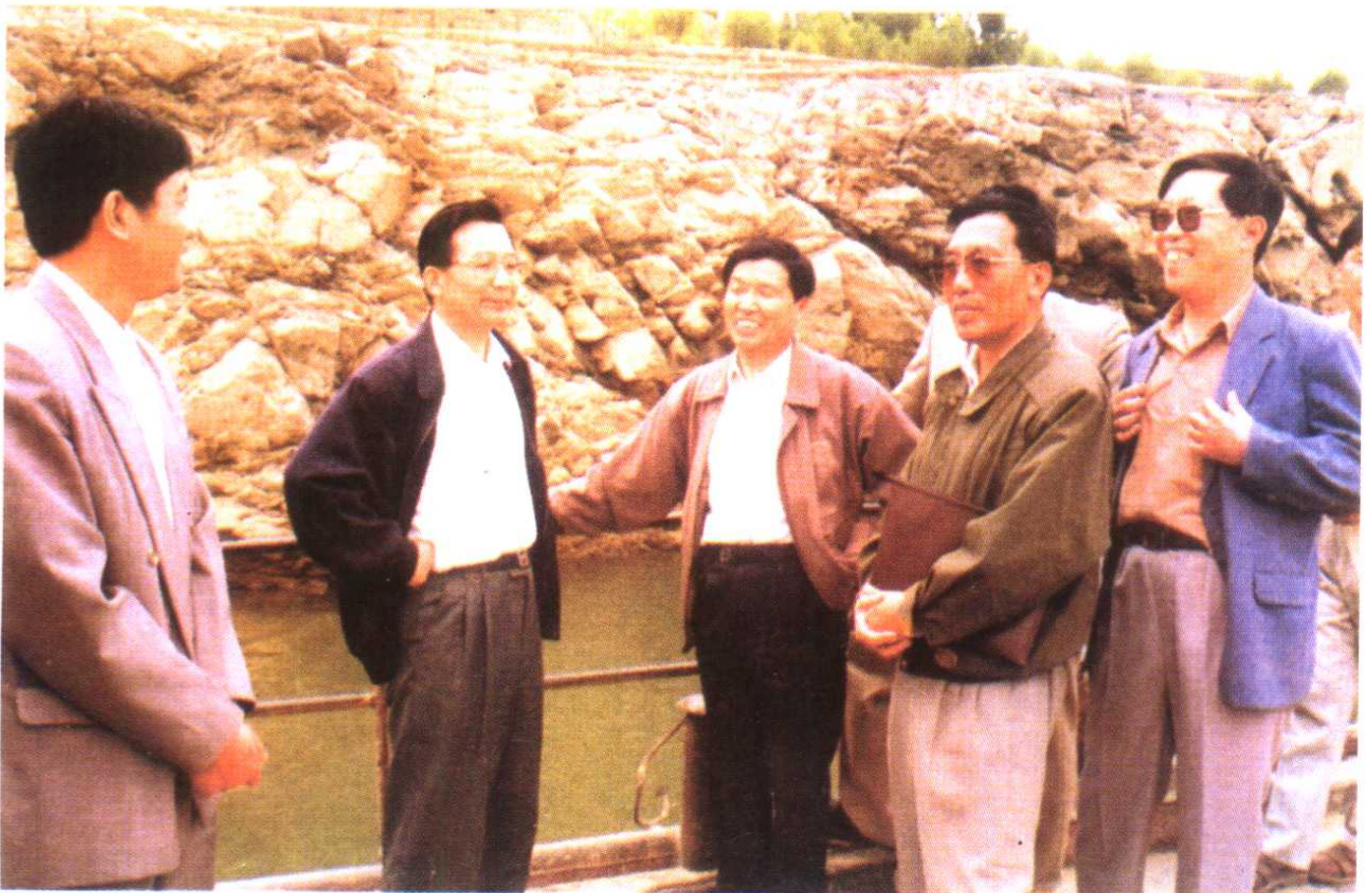
1995年6月温家宝同志在临夏视察工作