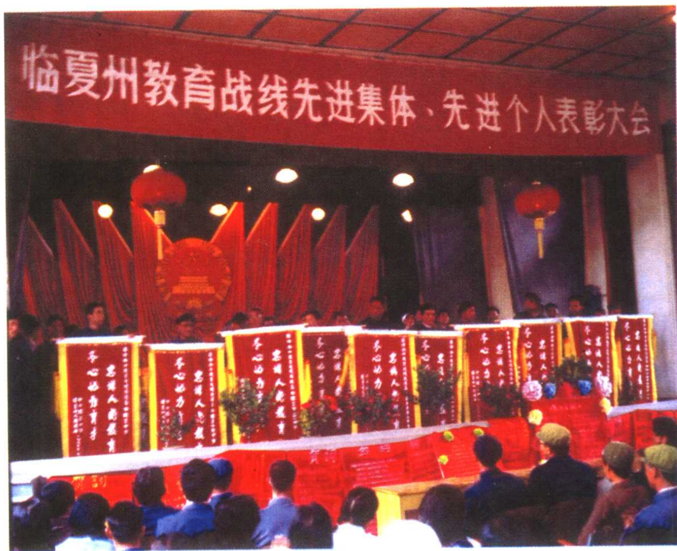
州委、州政府表彰奖励全州教育战线先进集体和个人