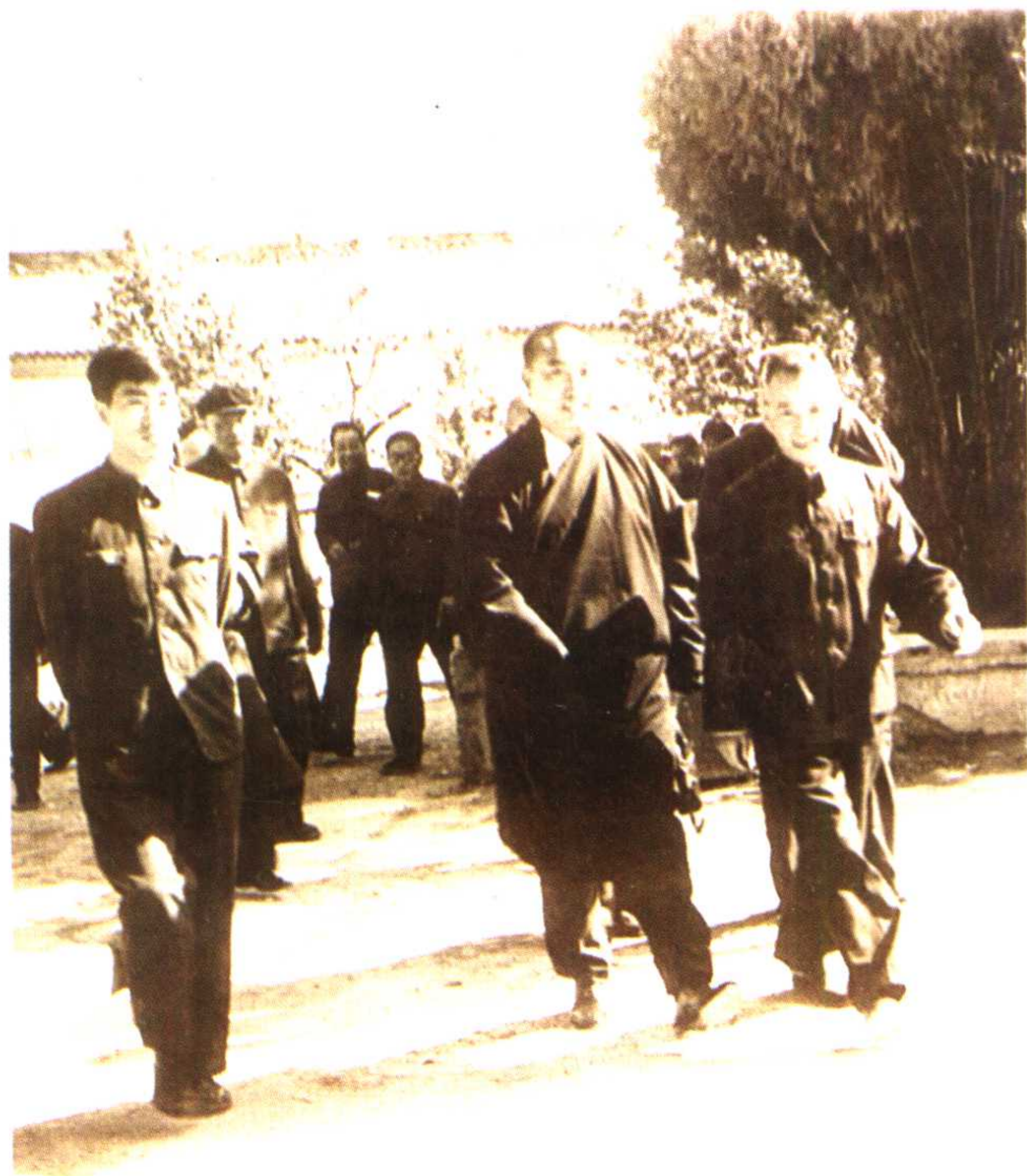
一九八二年九月全国人大常委会副委员长班禅视察临夏工作