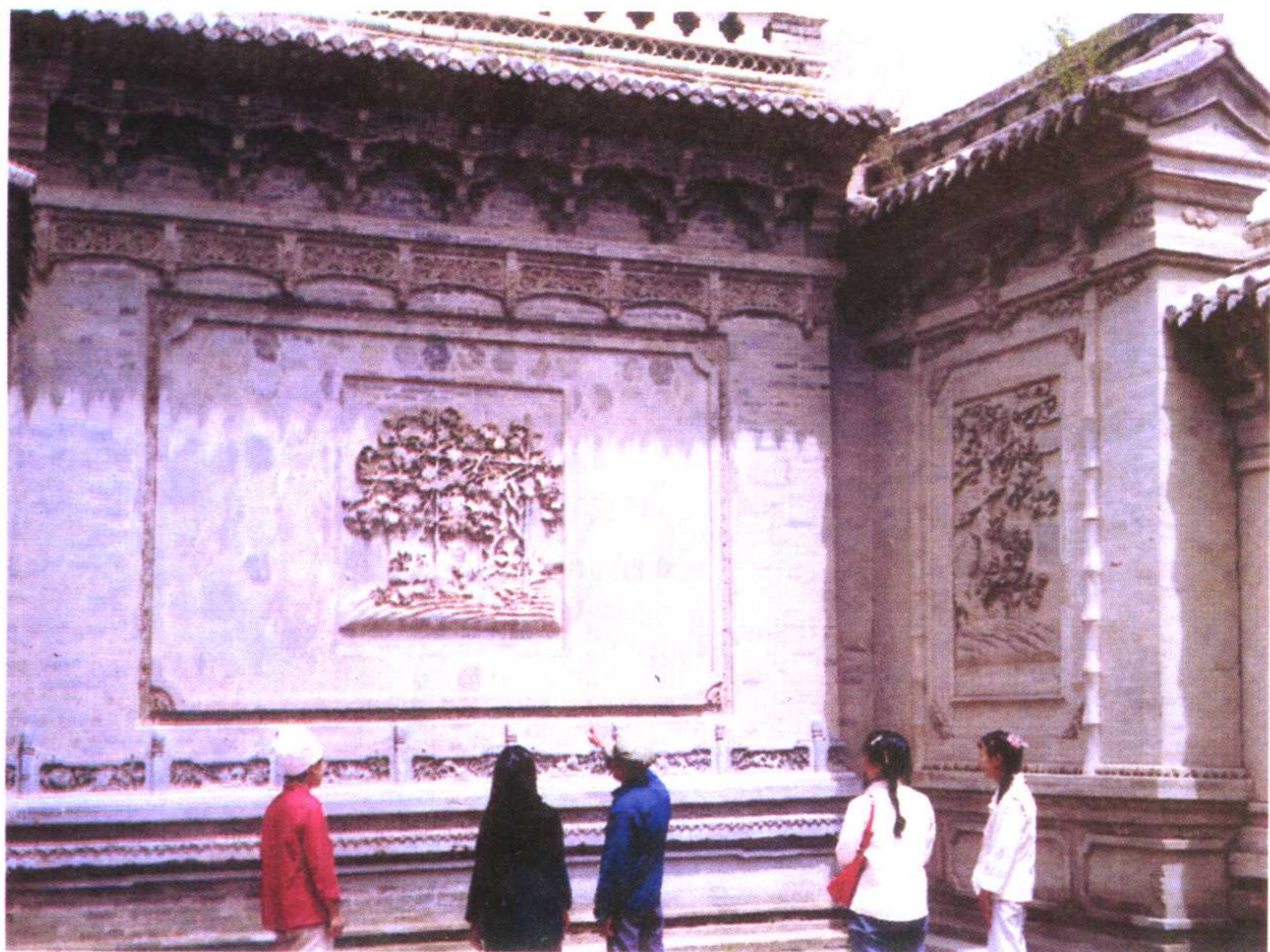
具有悠久历史和独特艺术风格的临夏砖雕