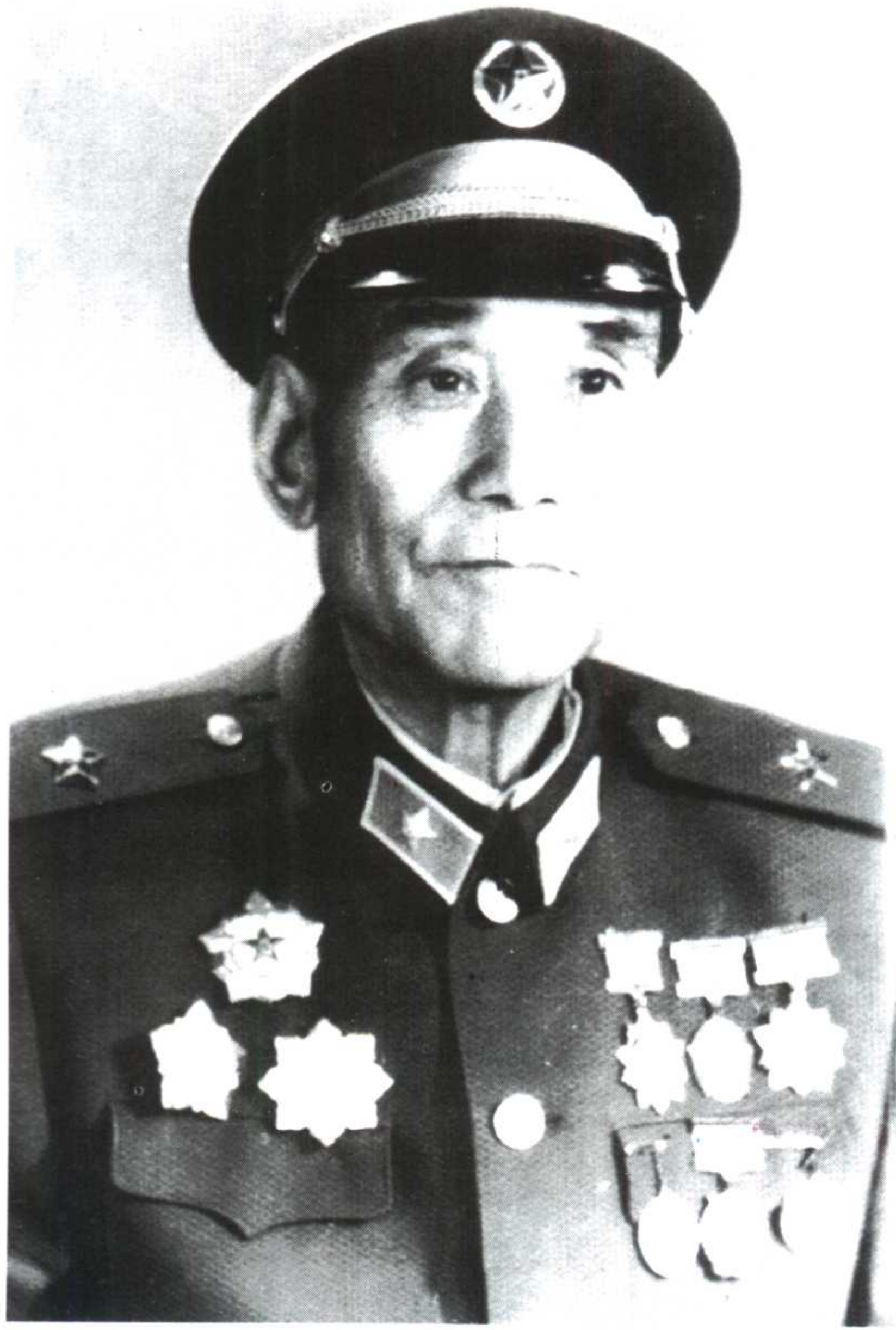
瑞林将军 解放初任中共临夏地委书记、 临夏军事管制委员会主任、 代理专员的鲁