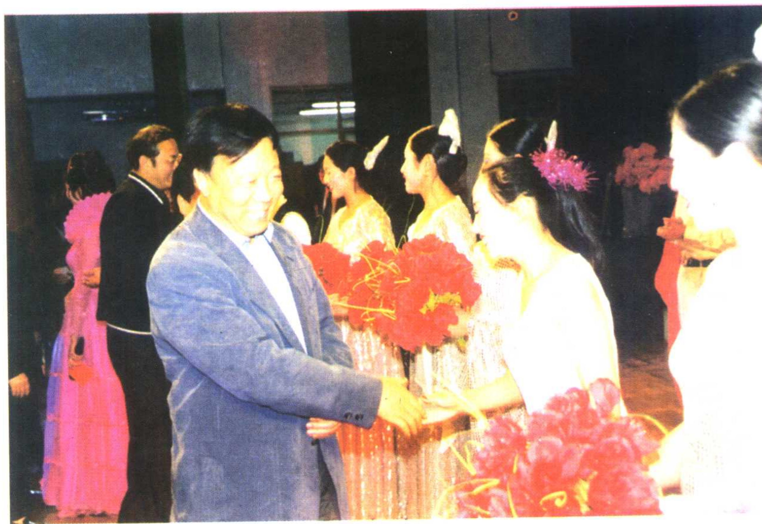
省长陆浩等领导观看临夏州民族歌舞团演出后与剧组演员握手