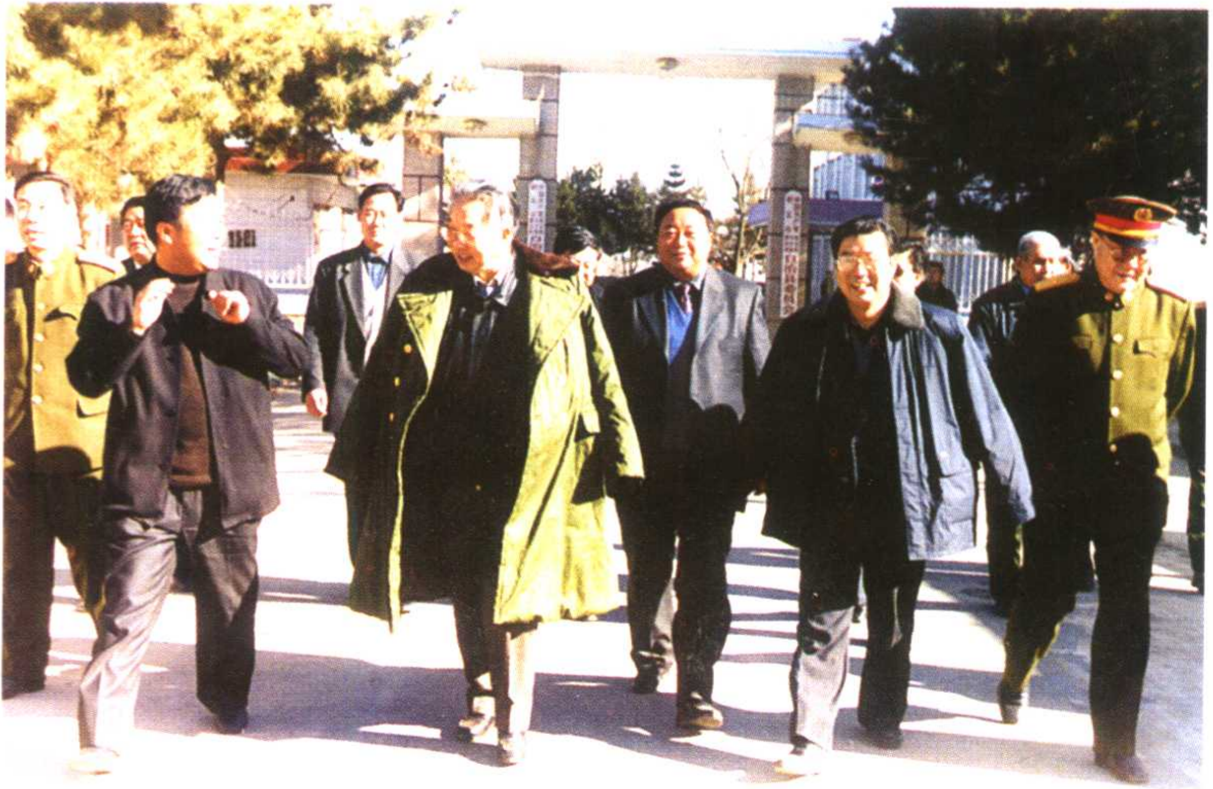
中共甘肃省委书记宋照肃在临夏视察工作