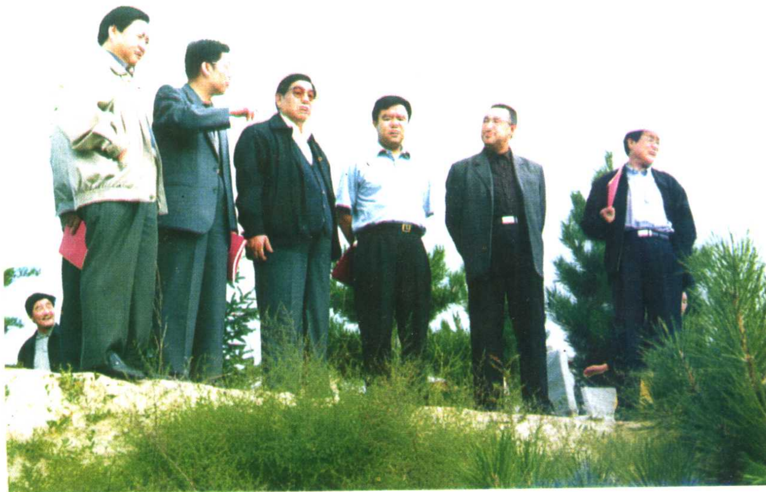
省人大常委会主任卢克俭在临夏视察工作