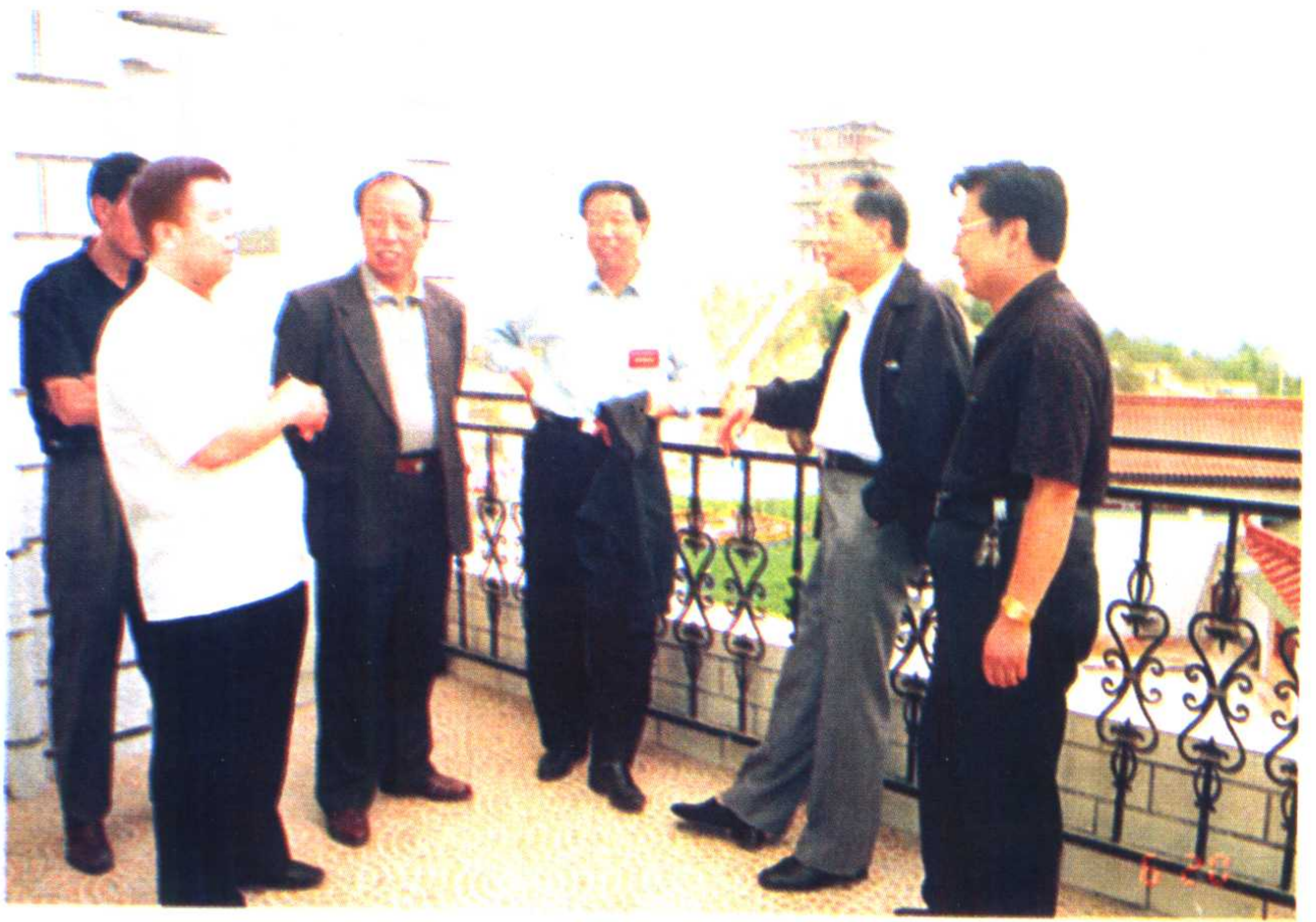
省政协主席杨振杰在临夏视察工作