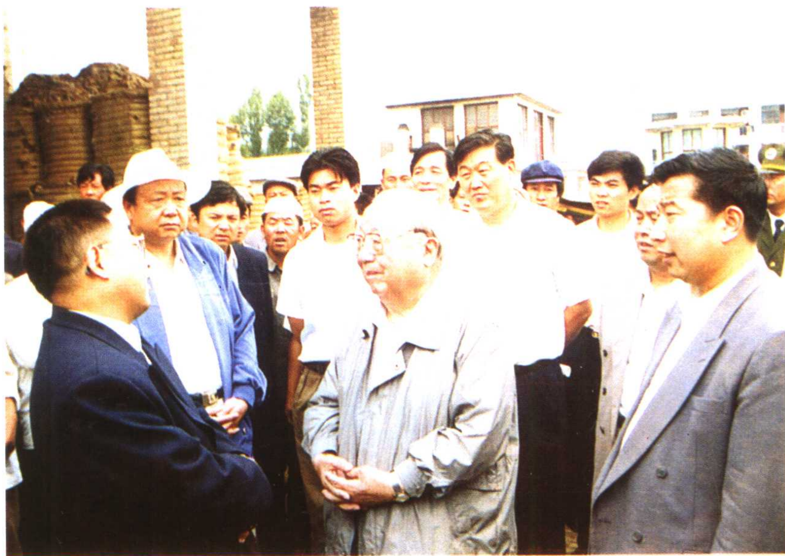
1995年9月全国人大常委会副委员长费孝通在临夏视察民营经济