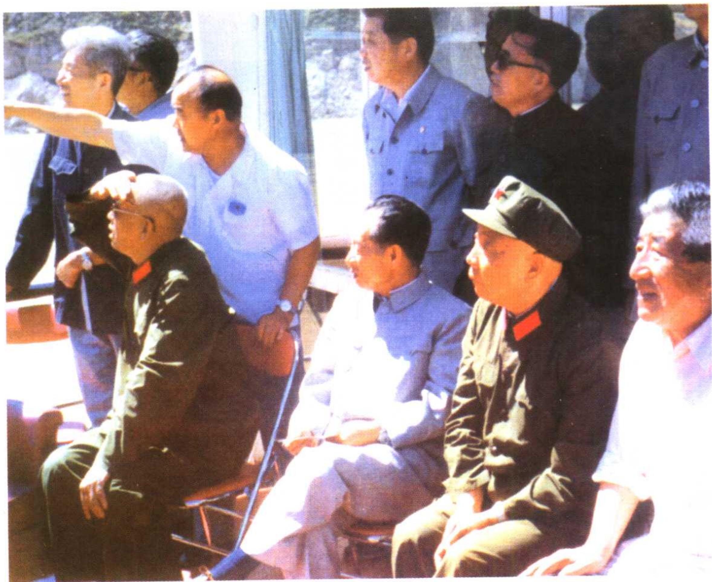
1986年7月胡耀邦同志视察临夏工作