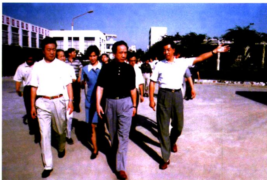
1998年9月11日河北省副省长郭世昌(中)视察工厂