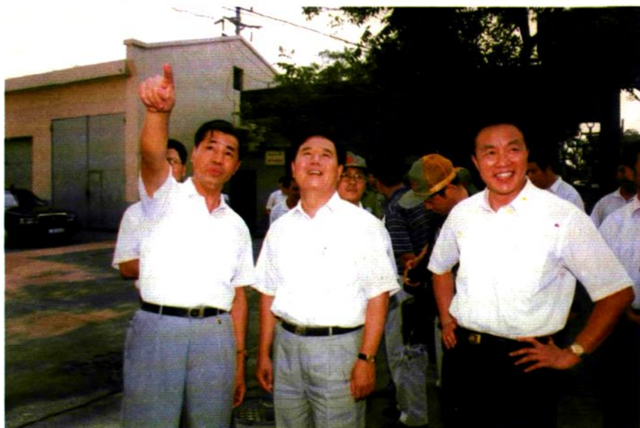
1997年8月22日铁道部党组书记、副部长傅志寰(中)视察工厂