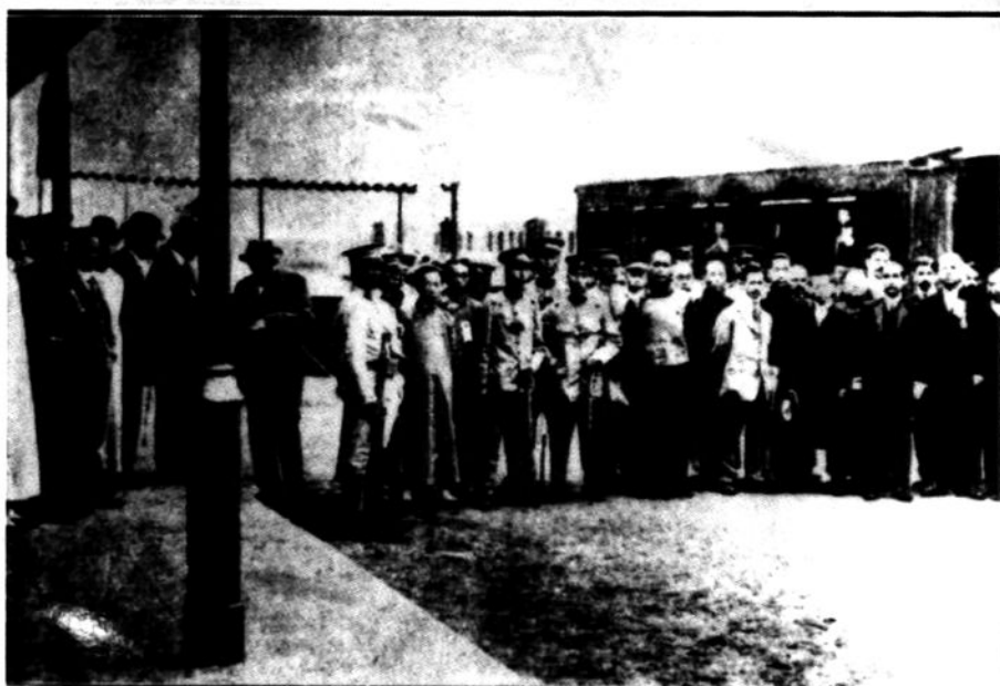
影留路本察視時路鐵國全總理總直