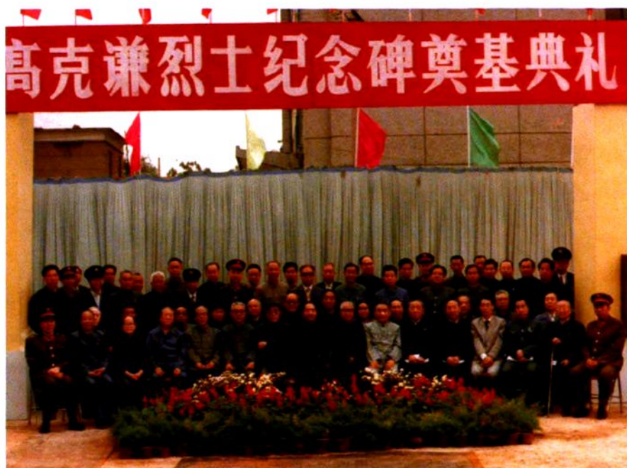
1985年10月8日革命前辈参加高克谦烈士纪念碑奠基典礼并视察工厂