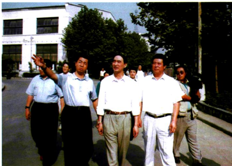
1998年9月18日中华全国总工会副主席徐锡澄(中)视察工厂