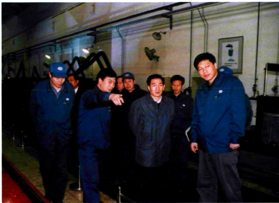
中国南车集团公司总经理赵小刚(右二)视察工厂