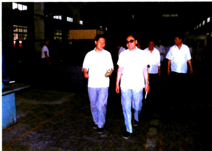
1985年7月10日铁道部部长丁关根(右)视察工厂