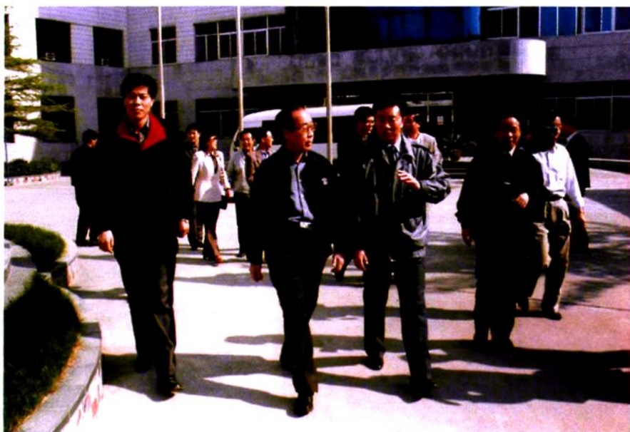
2000年4月26日河北省常委、纪委书记吴野渡(左二)视察工厂