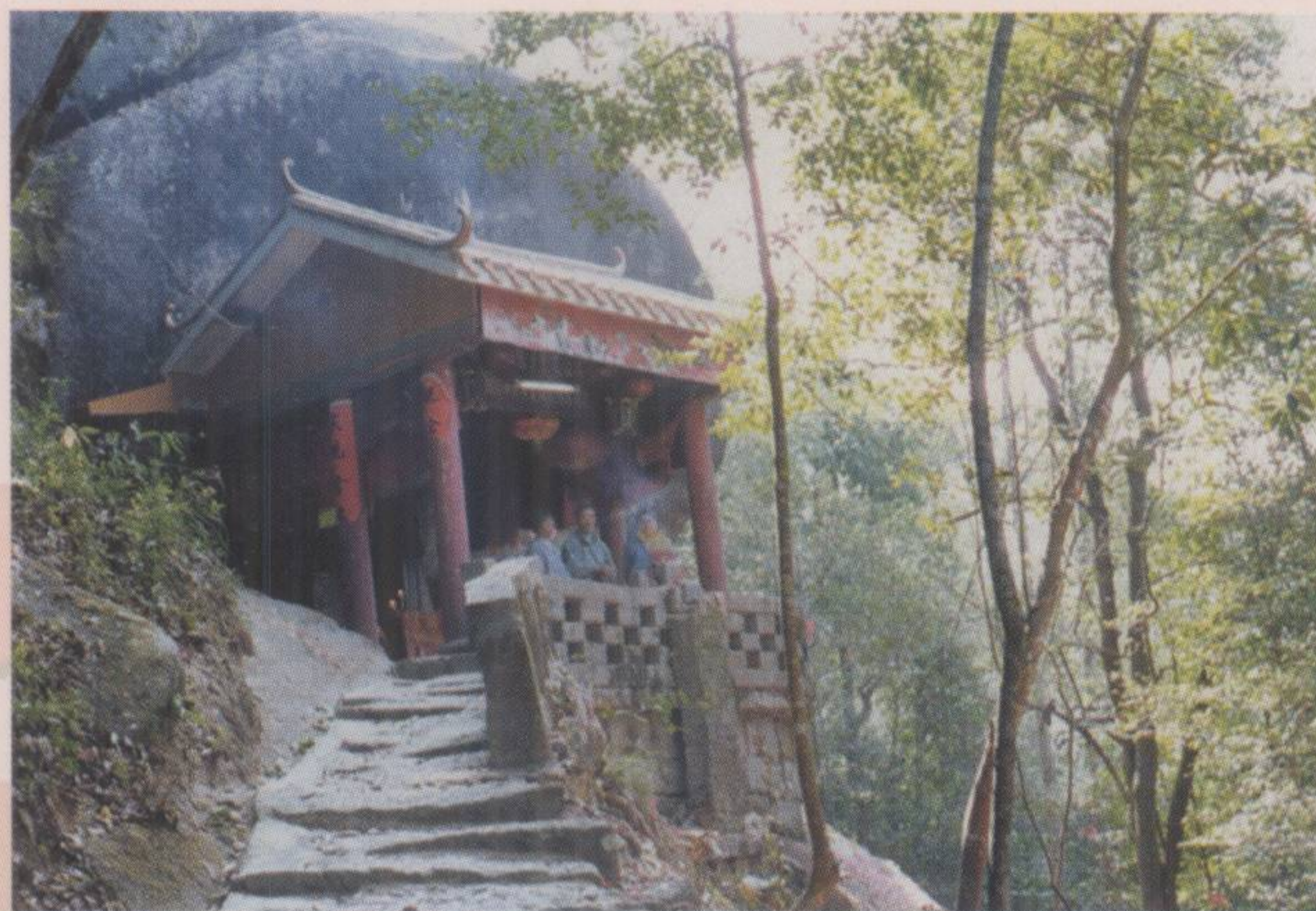
▲ 九树庙祖石风景区