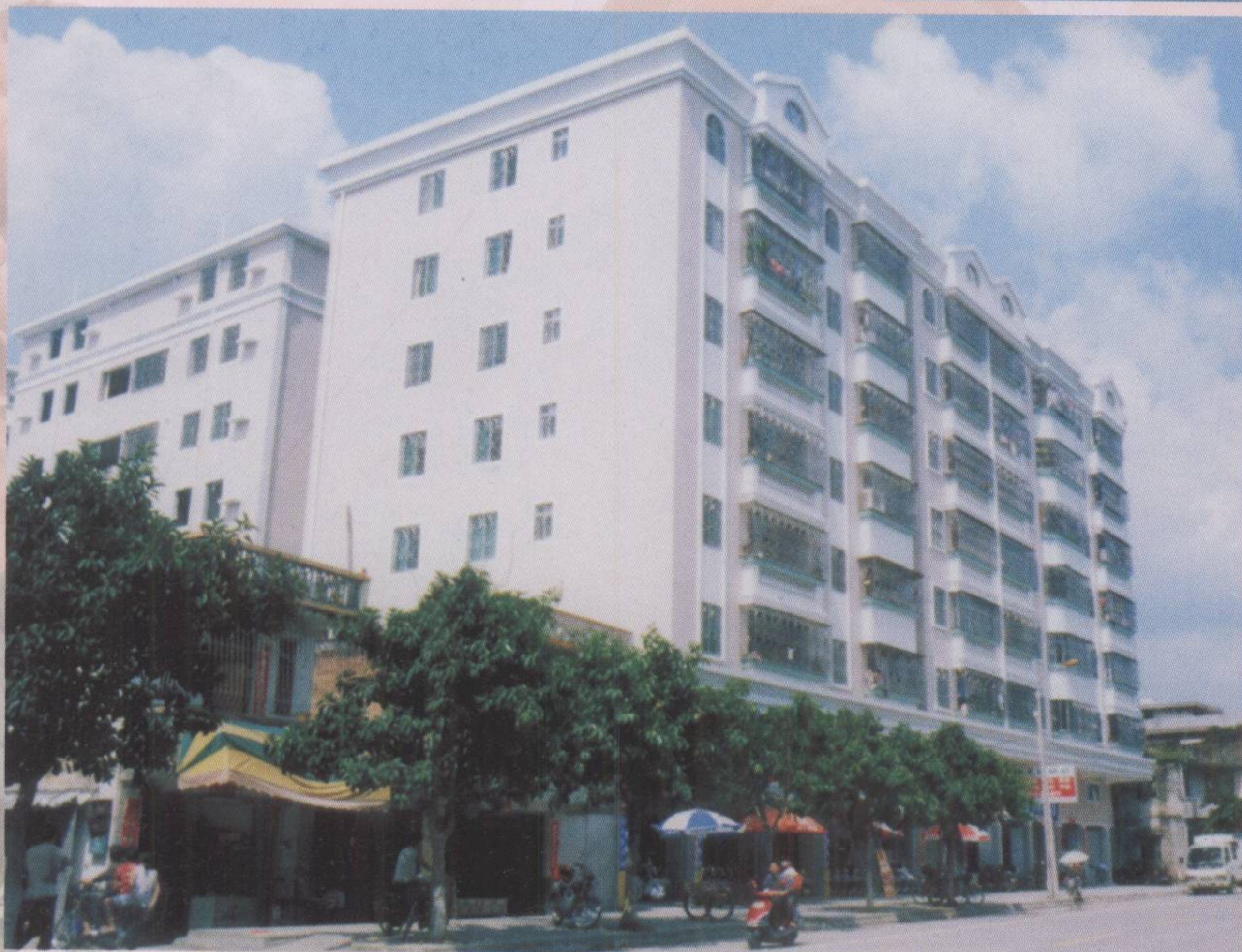
▲ 远安花苑（黄花路口）