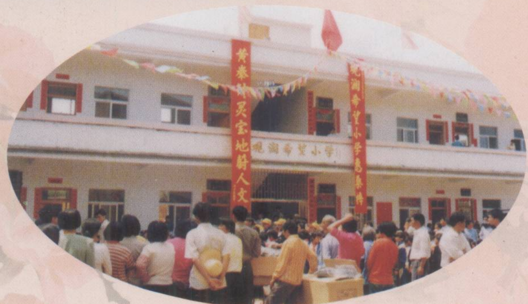
▲ 由深圳观澜热心人士捐建的水墩观澜希望小学