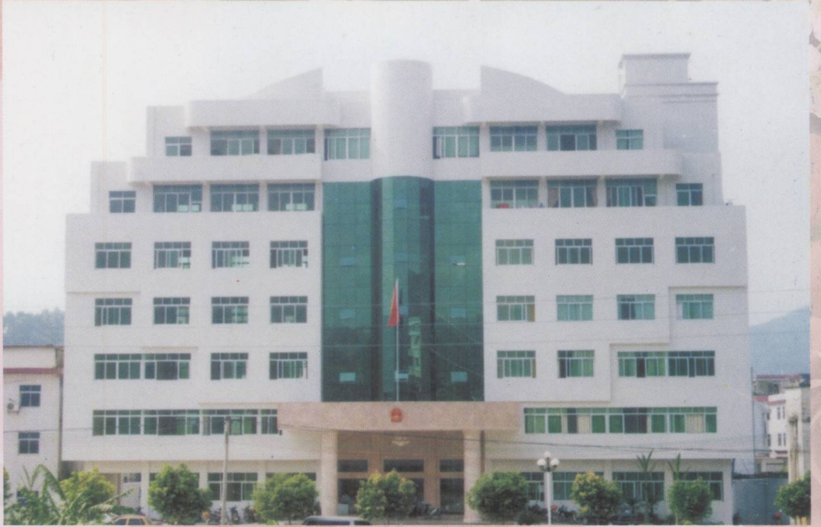
▶ 县人民检察院办公大楼