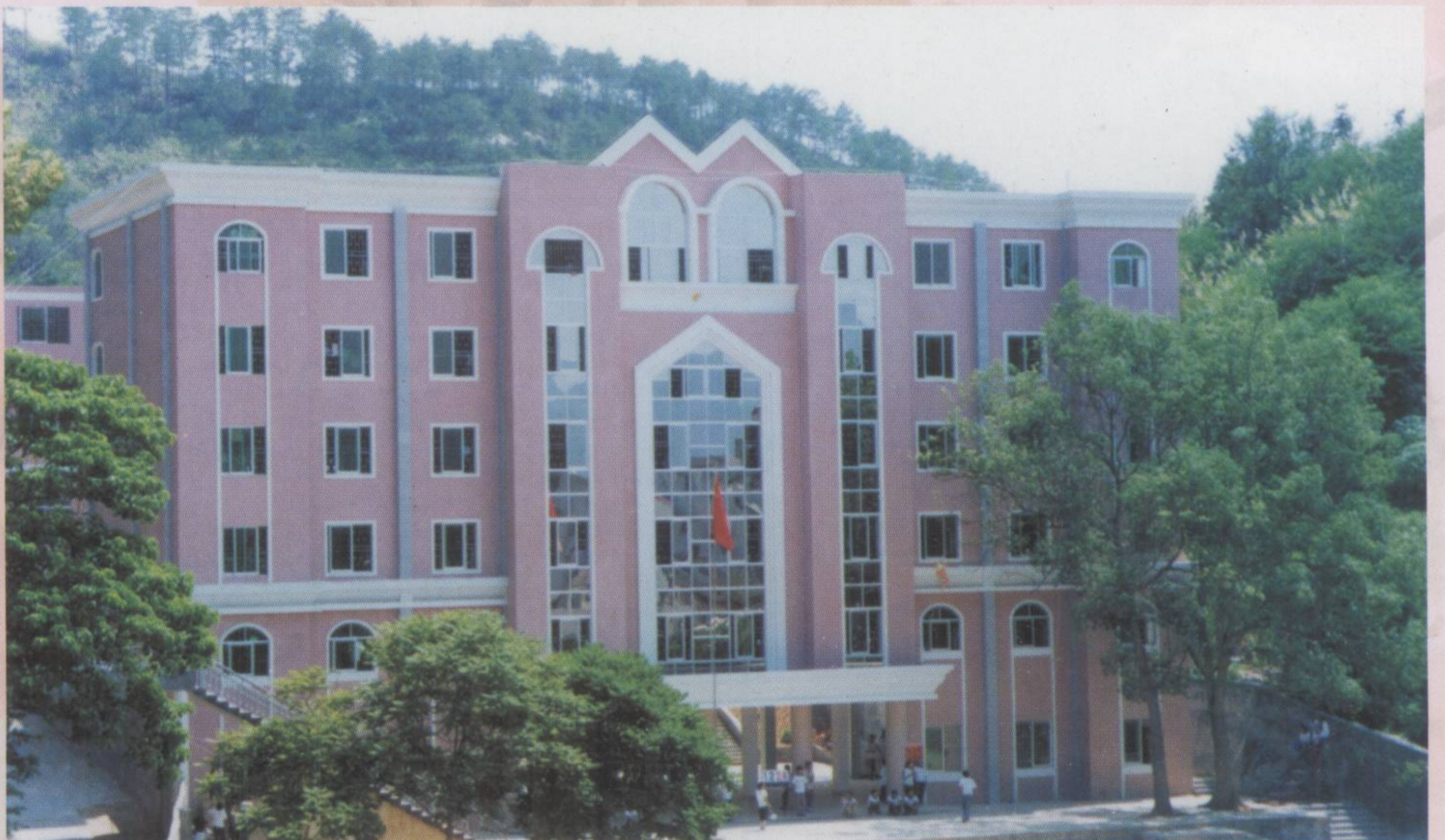
▶ 紫金中学戴角坑学生宿舍大楼