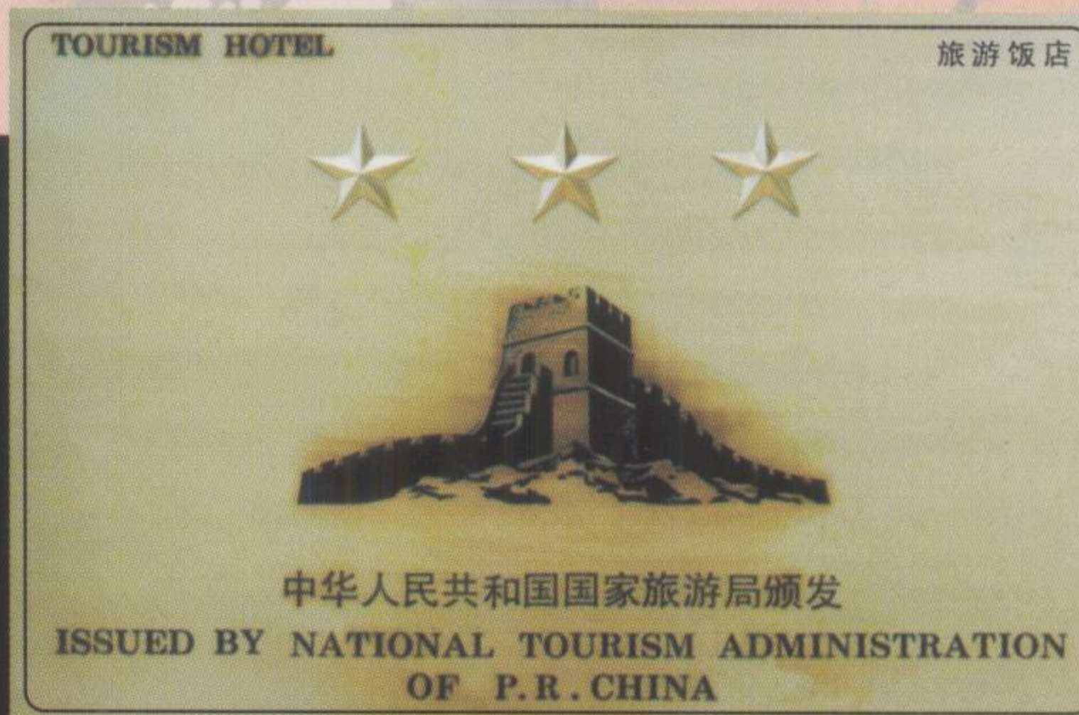
▲ 紫金县委、县政府接待基地 — 紫金宾馆夜景