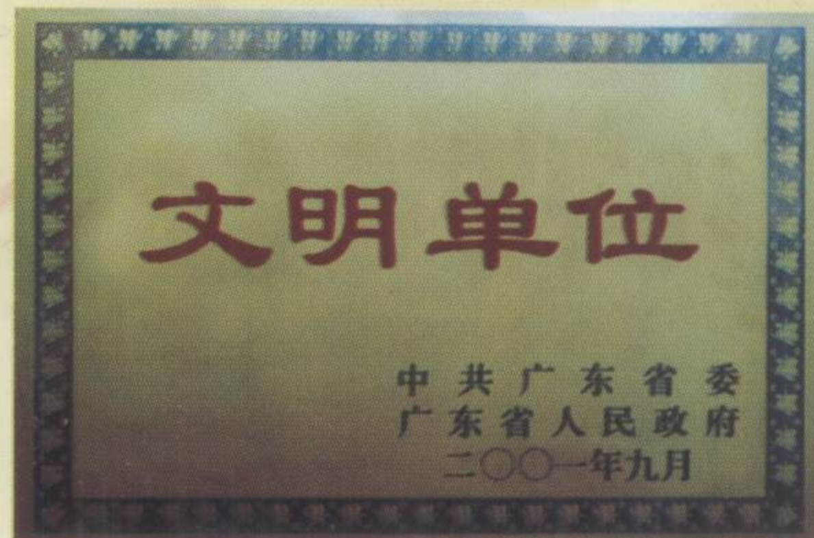
▲ 省“文明单位”三连冠