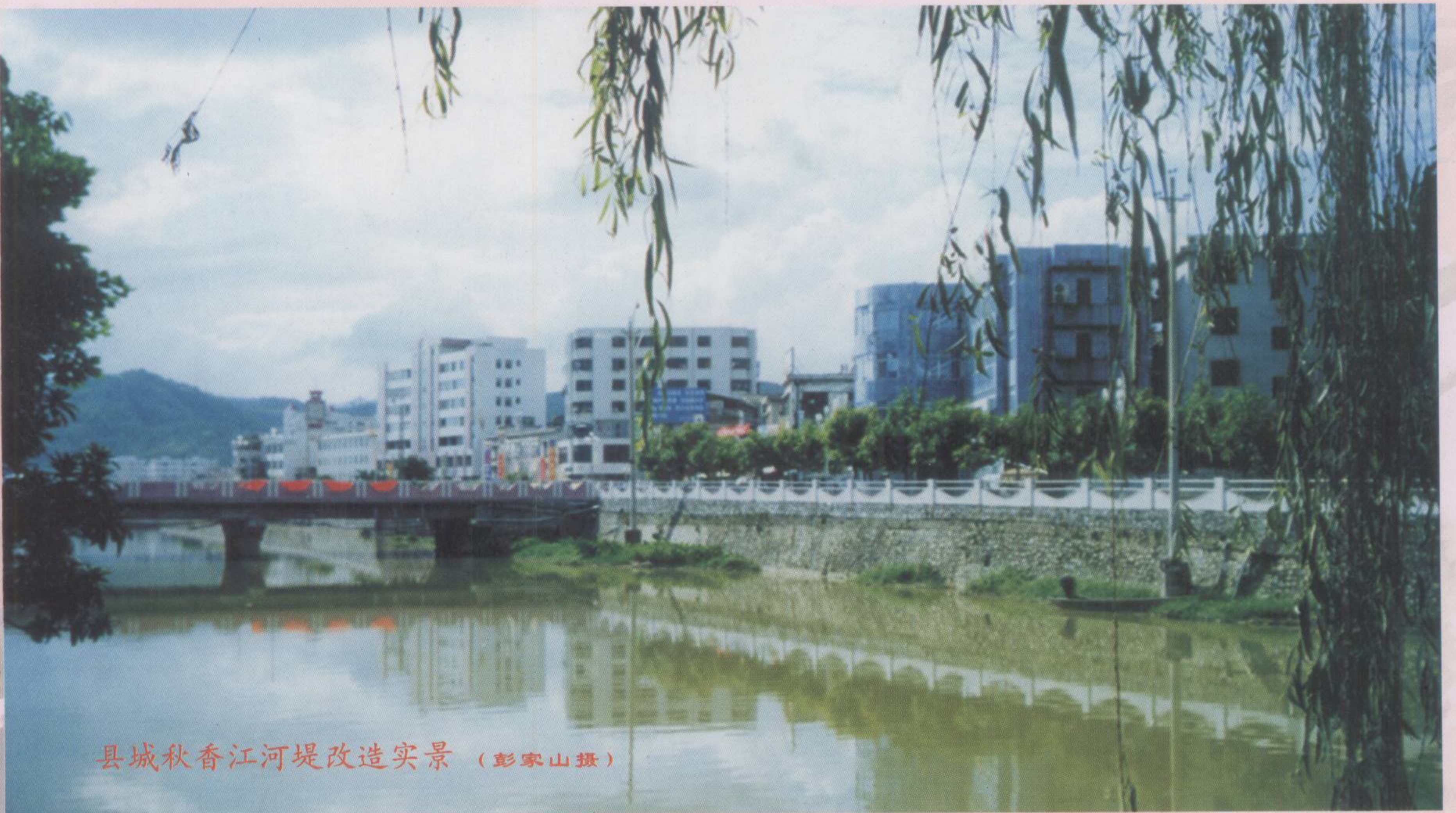
县城秋香江河堤改造实景