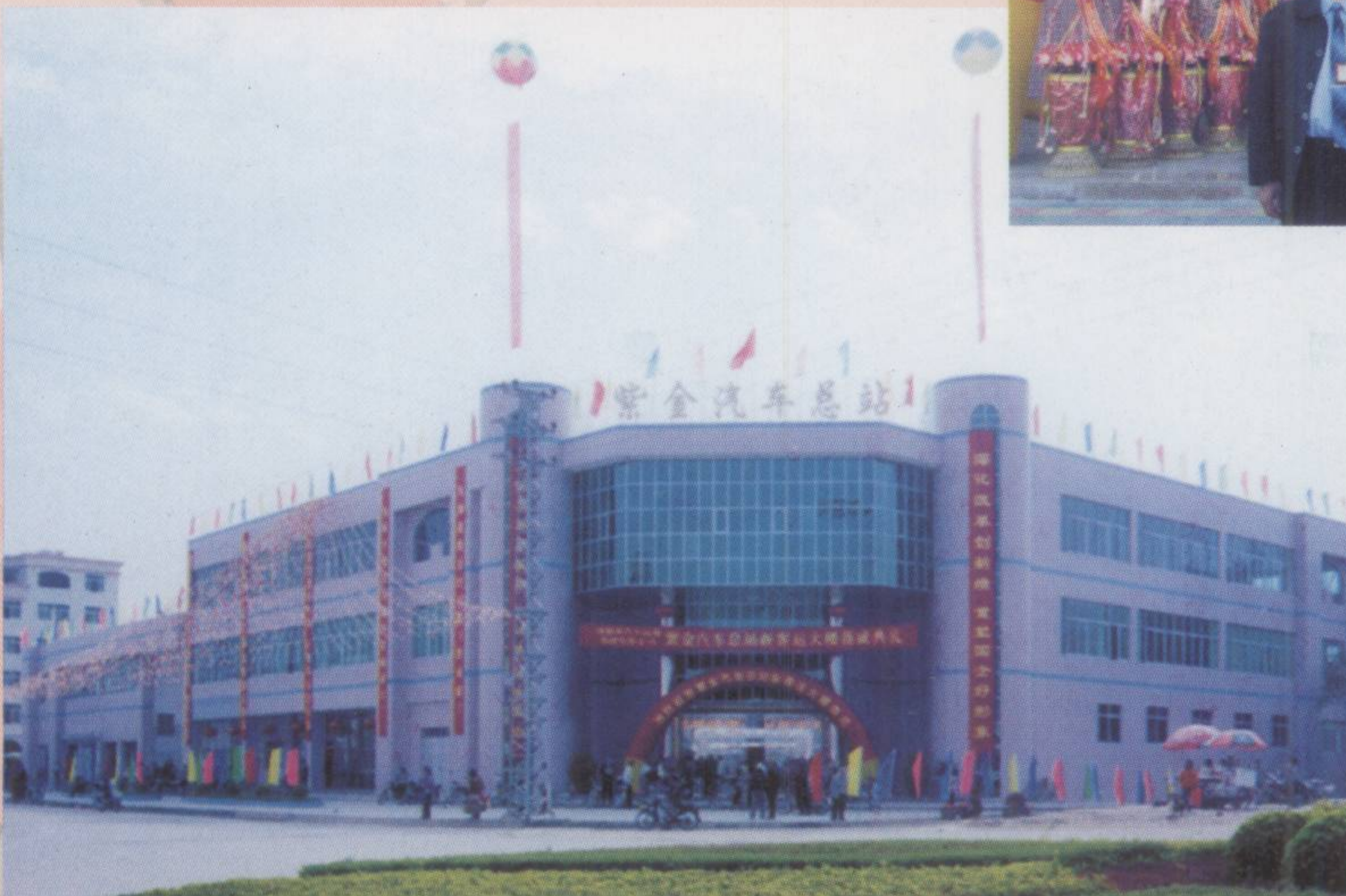
◀ 按国家二级客运站标准设计建造的紫金汽车总站