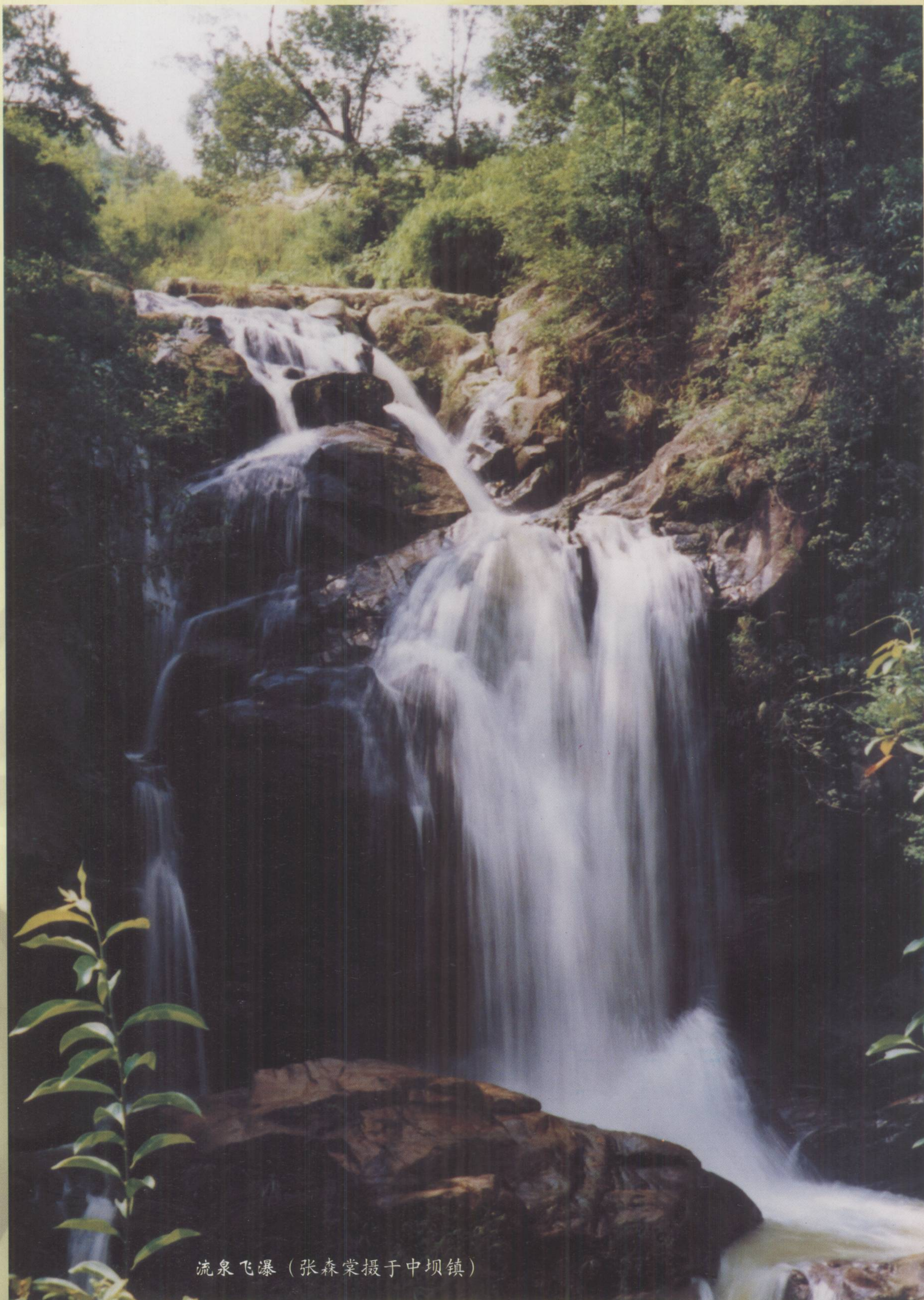
流泉飞瀑（张森棠摄于中坝镇）