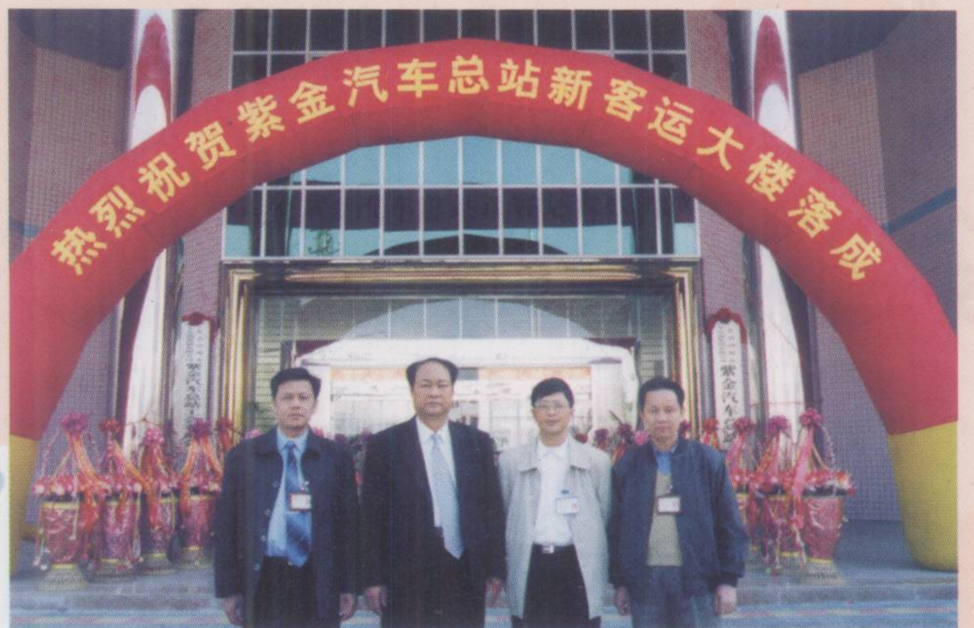
▲ 站领导班子成员合影