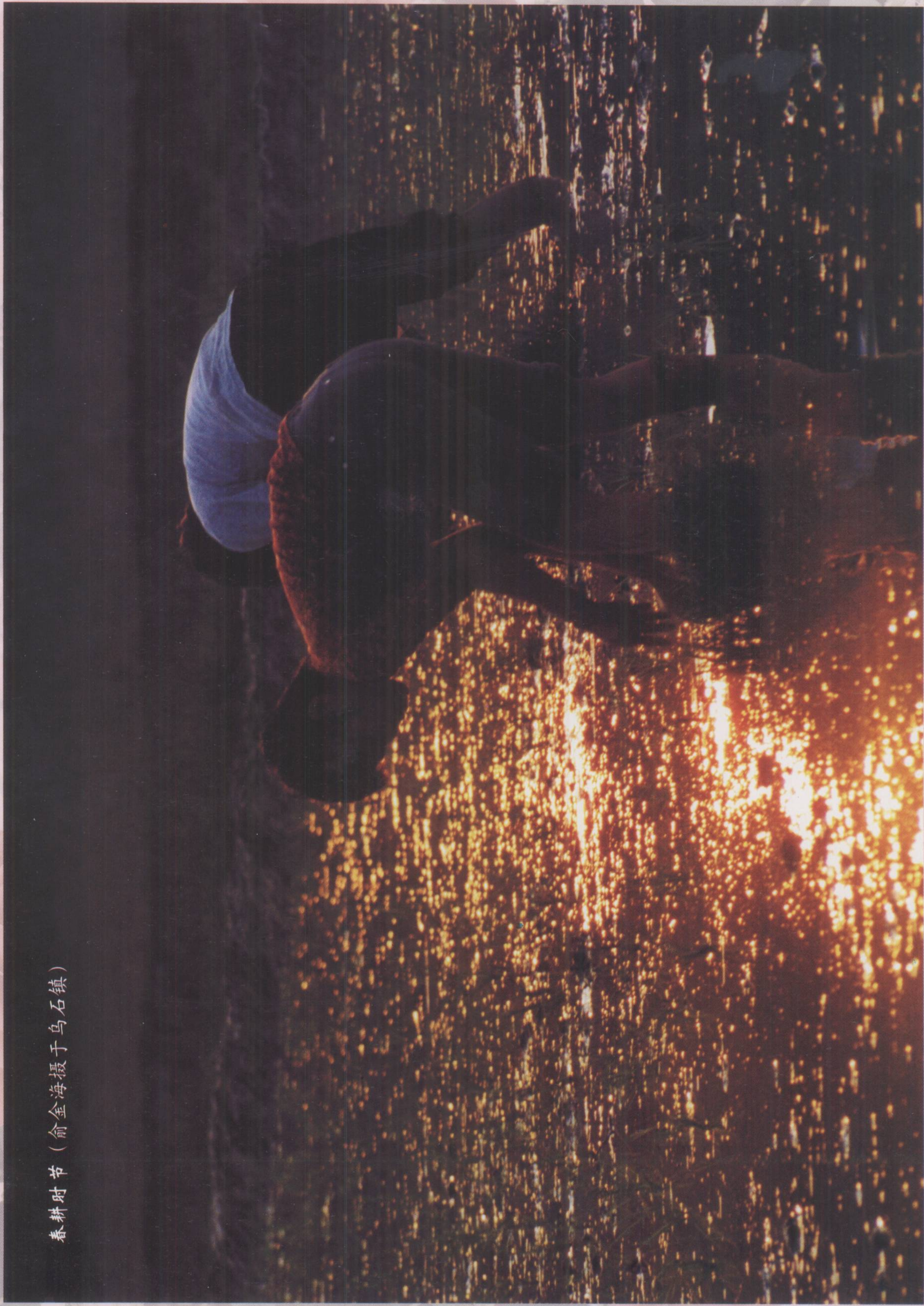
春耕时节 (俞金海摄于乌石镇)