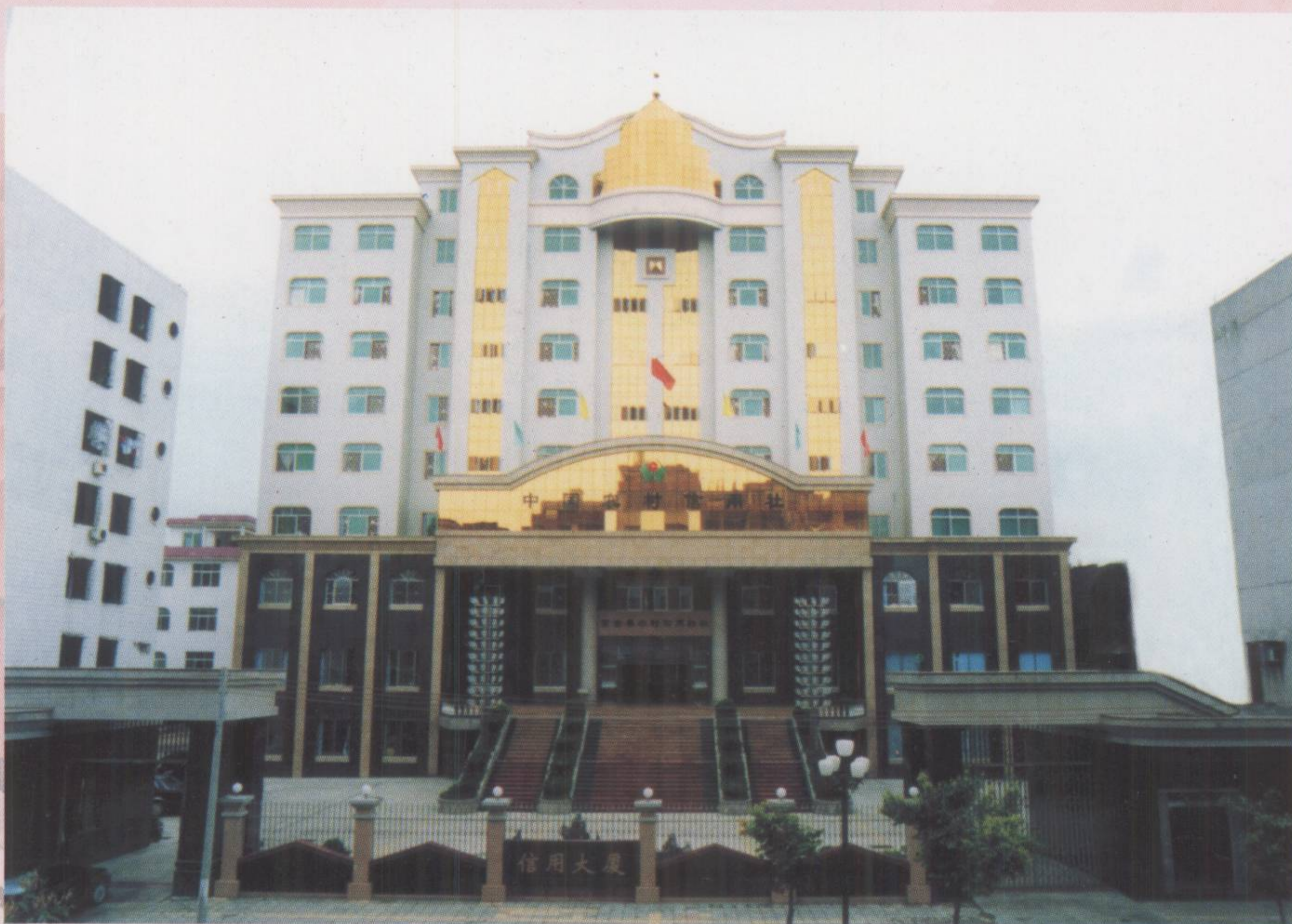
▲ 2001年十大建筑——县农信联社综合大楼