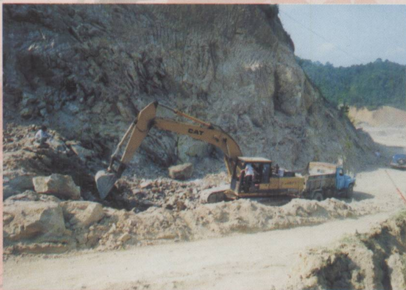
▲ 紫河公路扩改附城伯公坳路段剪影