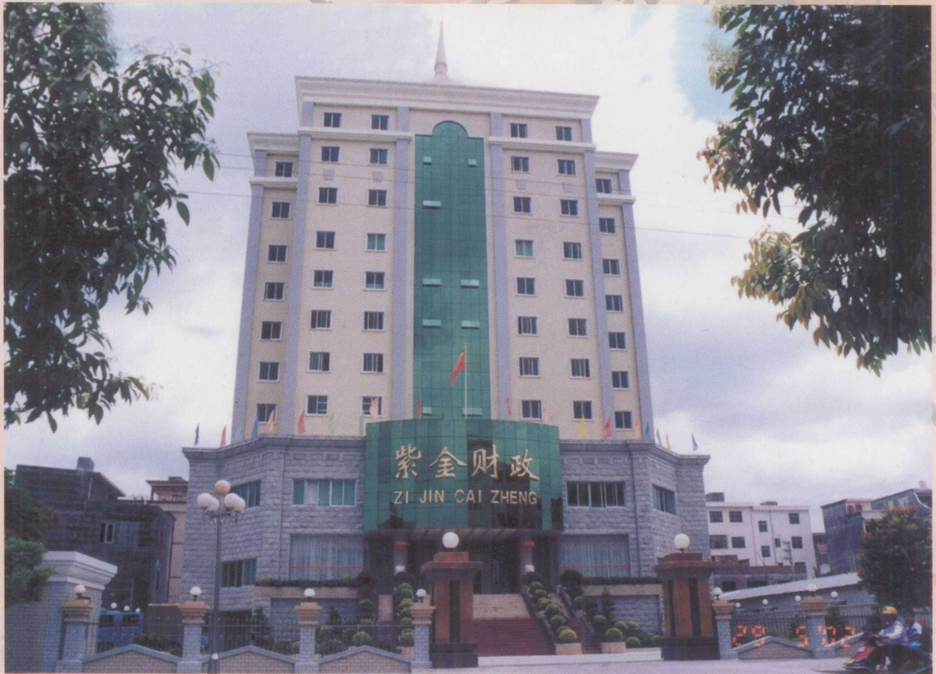
▲ 县财政局办公大楼