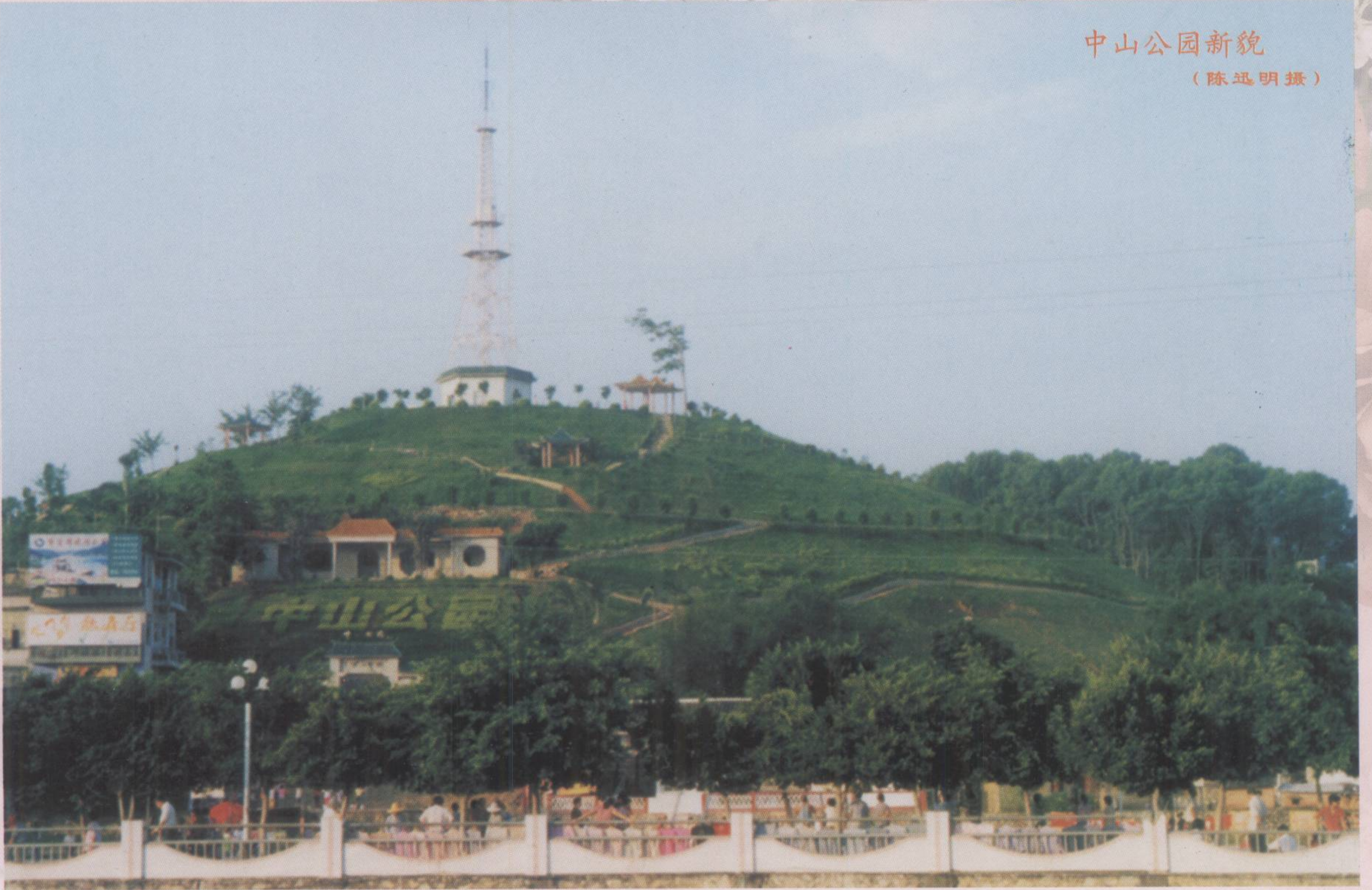
中山公园新貌