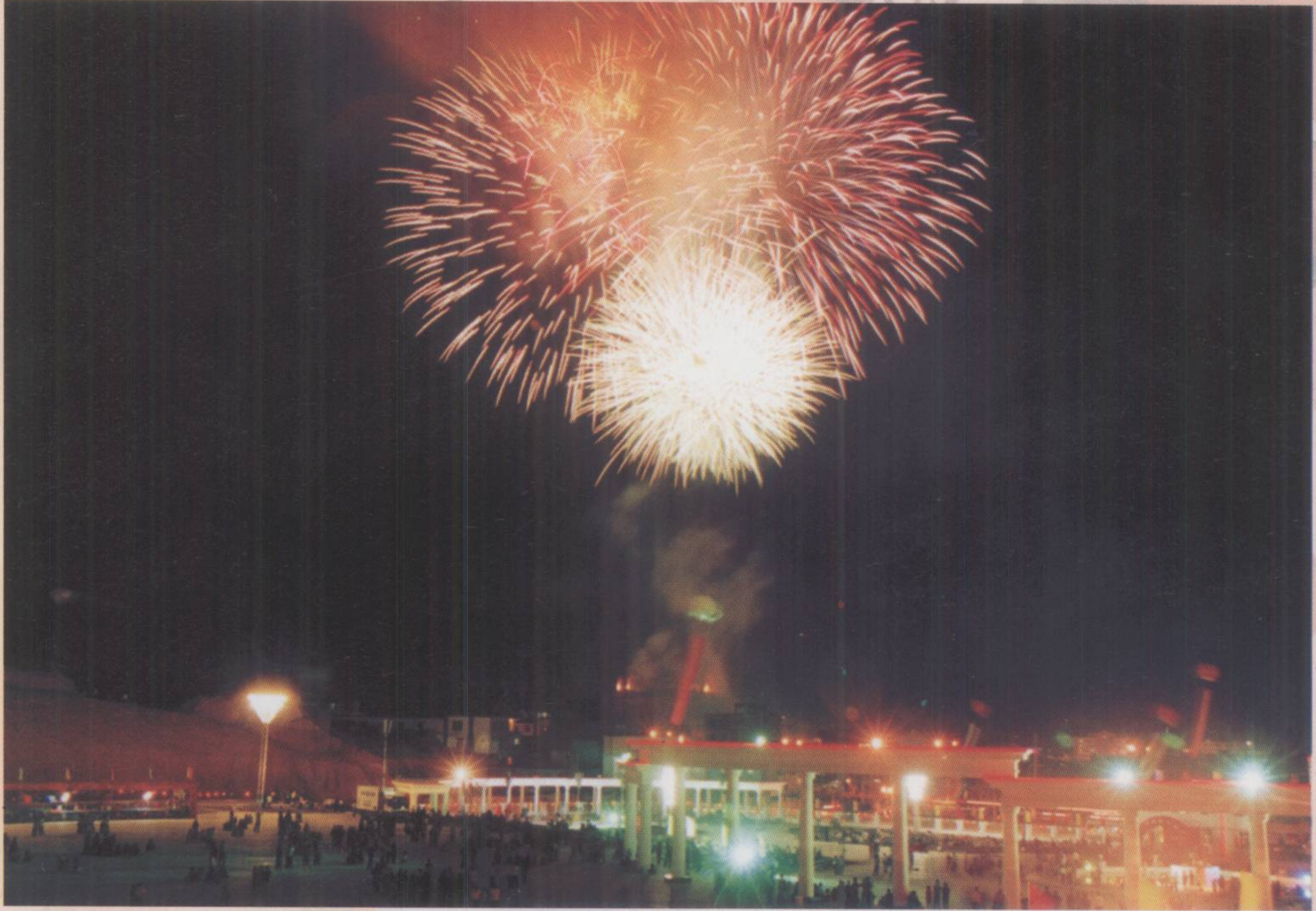
紫金县文化体育广场