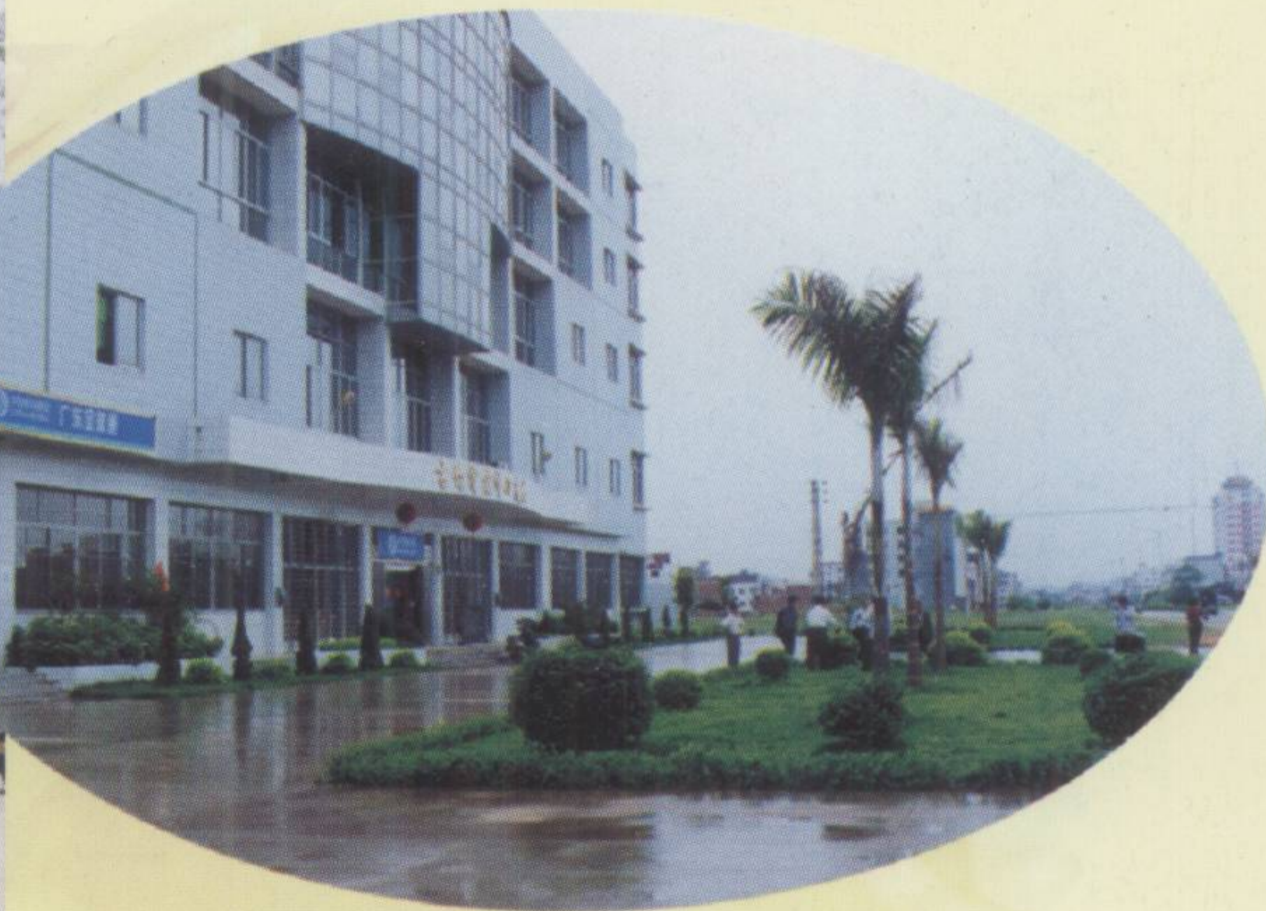
▲ 县电信局基层所绿化建设一瞥