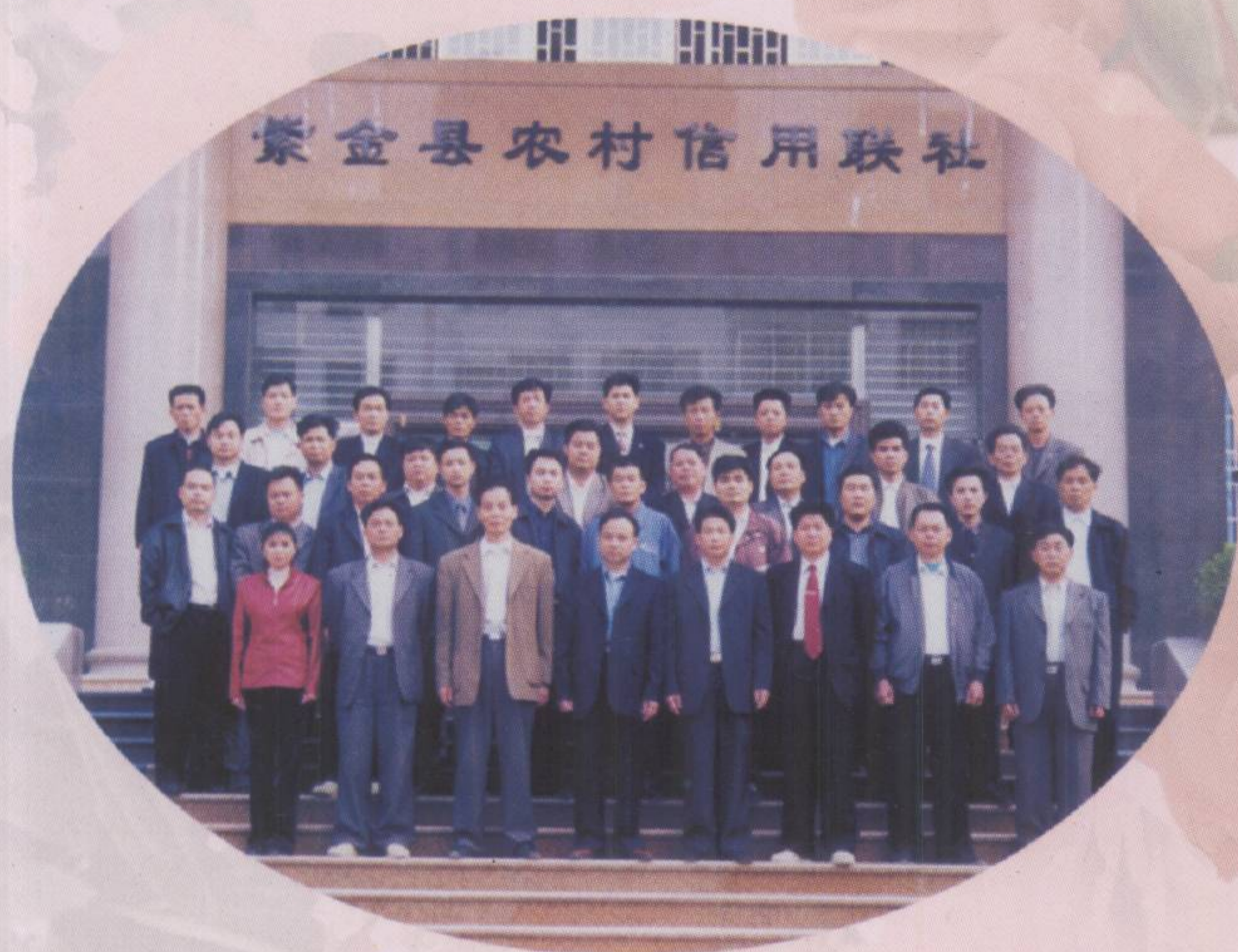
▲ 各社主任、联社股级以上干部大楼落成合影

紫金县农村信用合作社联合社成立于1984年11月，1996年12月与农业银行脱离行政隶属关系，成为独立法人金融机构。下辖全县23个农村信用社，1个营业部和49个营业网点，在职员工302人。该社坚持“以农为本，为农服务”的宗旨，坚持优质服务，取得了广大客户的信赖和支持，特别是2001年6月开通全市储蓄存款通存通兑业务以来，各项业务迅速发展，至年底，各项存款余额4.89亿元，比上年增长13%；