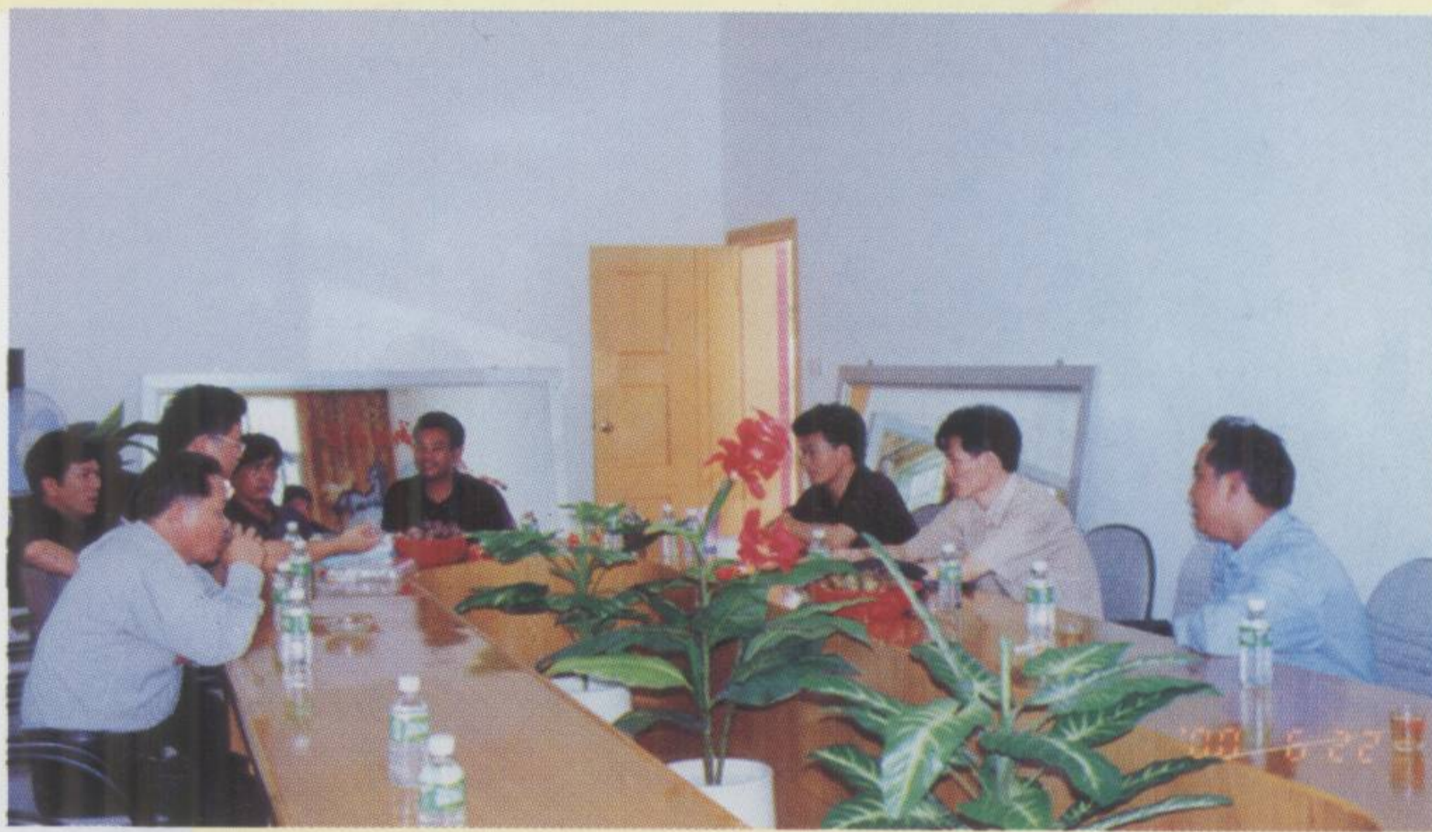
▲ 局领导深入基层与当地共商通信发展大计