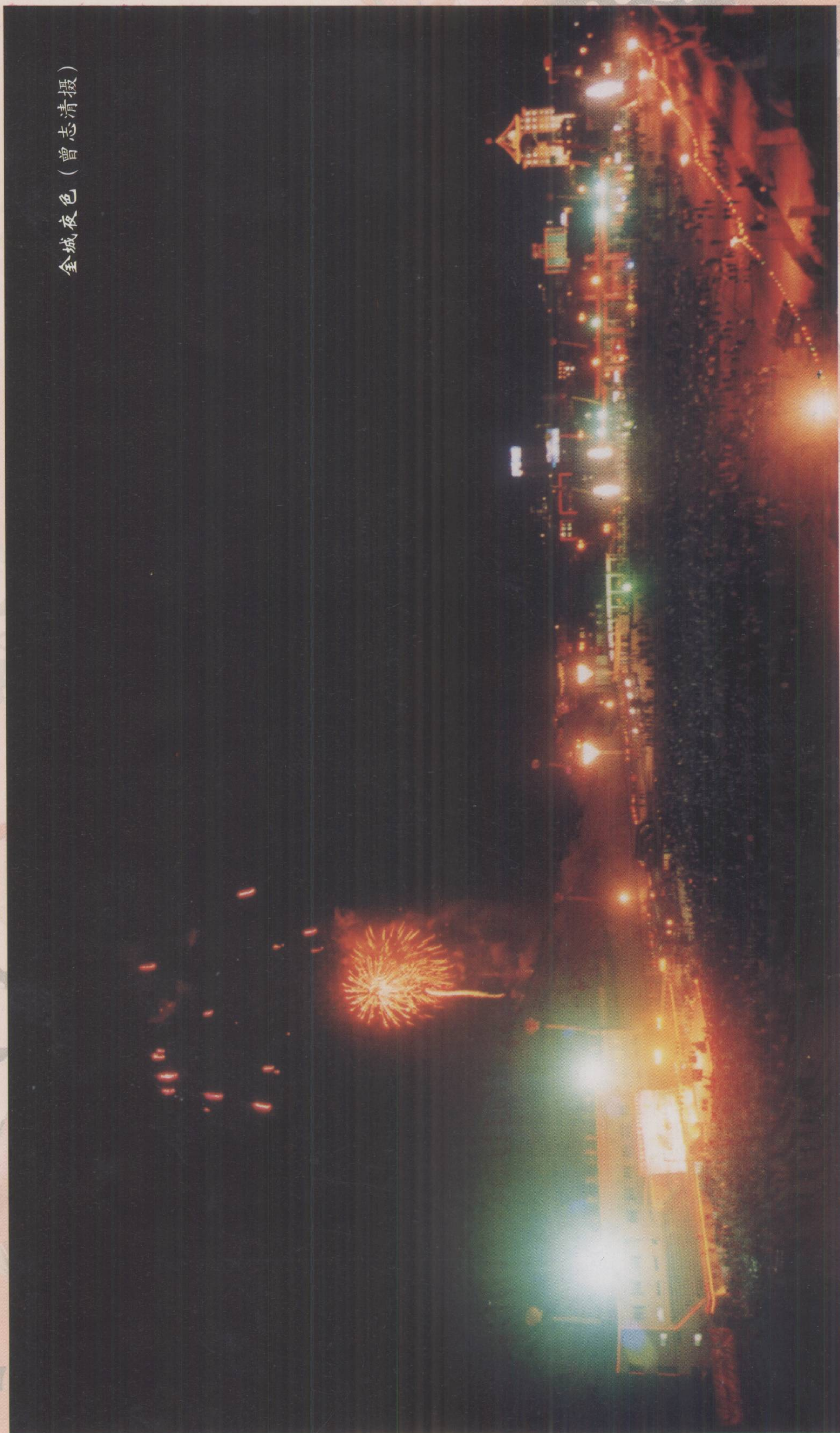
全城夜色