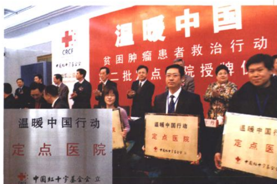
温暖中国行动定点医院