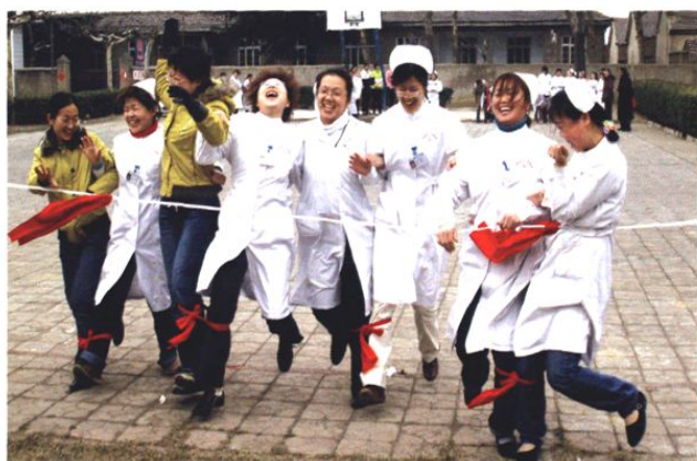
“三·八”妇女节娱乐活动