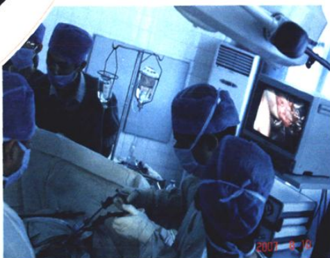
急救、微创、介入、重症医学多学科发展