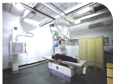
美国GE DR Definium6000飞天2（2008年）