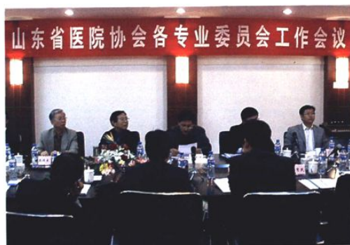
承办山东省医院协会各专业委员会工作会议