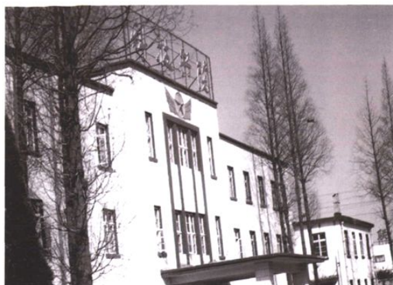
1960年的胶南县人民医院门诊楼是胶南县第一幢楼房