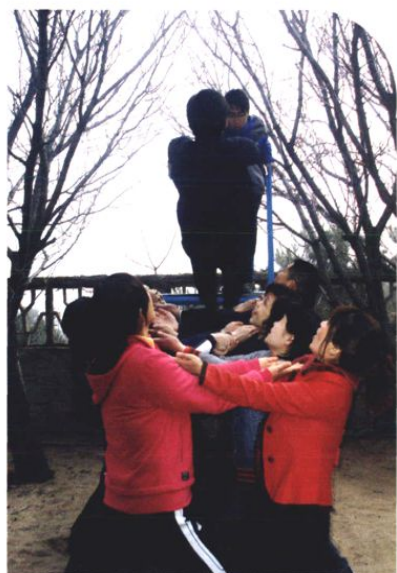
“五·四”青年节拓展训练