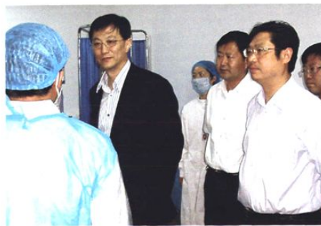
青岛市卫生局局长曹勇多次来院视察指导工作