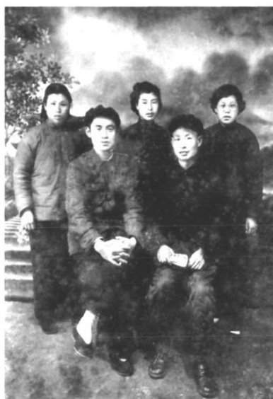
1958年胶南县医院成立党支部时 第一任书记和支部委员合影