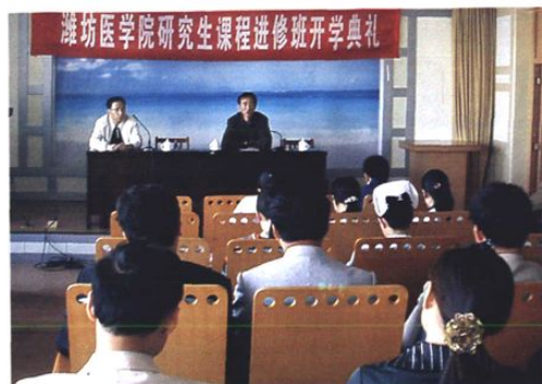
潍坊医学院研究生课程进修班开学典礼