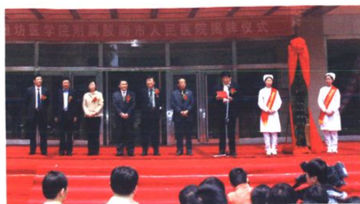
2008年4月26日潍坊医学院附属医院挂牌