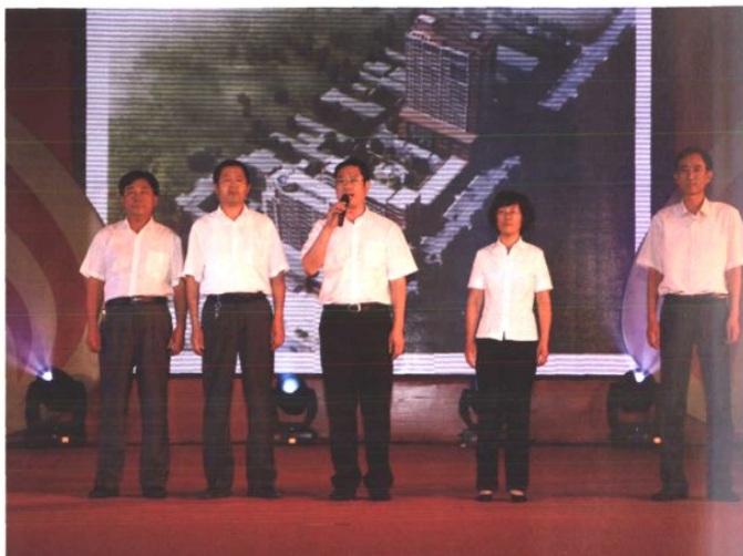
庆典上现任领导班子展望未来