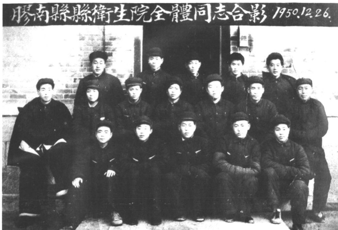
1950年12月胶南县卫生院全体同志合影