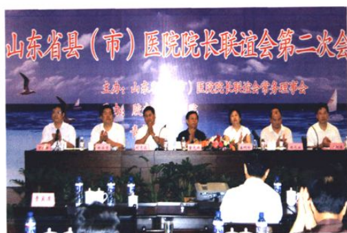
承办山东省县(市)医院院长联谊会第二次会议