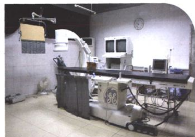
美国GE 数字减影血管造影X线机 9800C（2003年）