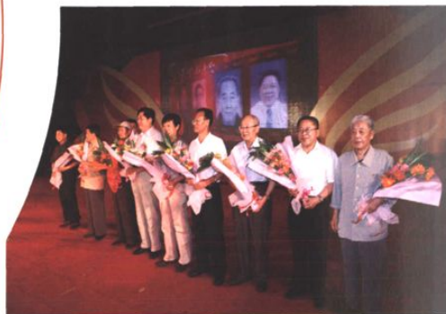
庆典上为历任老院长、老书记献花