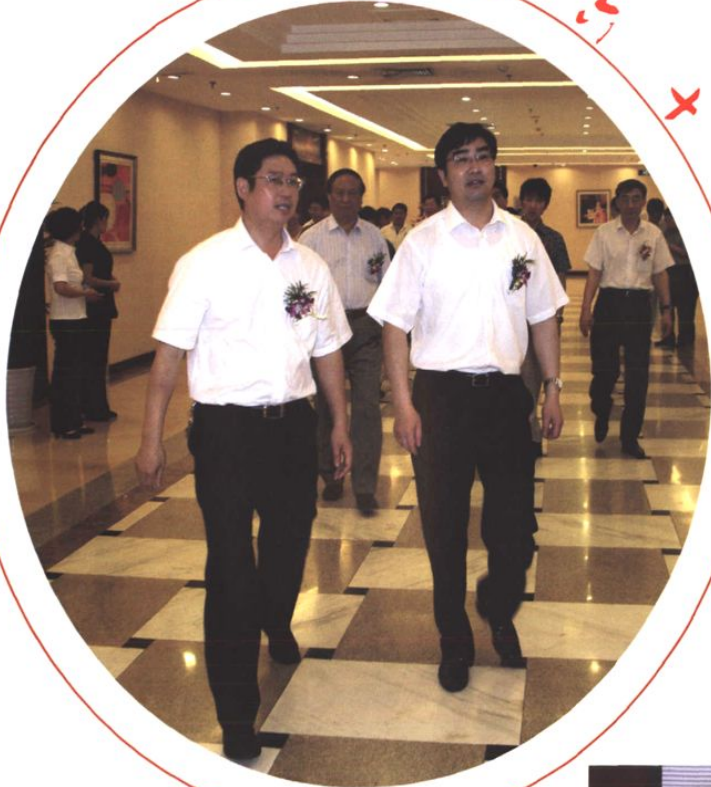
胶南市委书记万建忠参加庆典