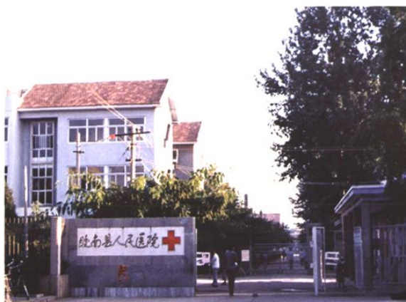
1988年胶南县人民医院外景