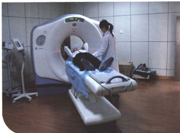
美国GE 16层螺旋CT Lightspeed16（2004年）