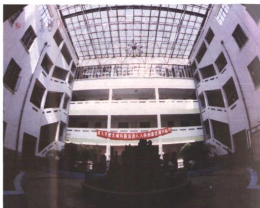
80年代的老门诊楼门诊大厅