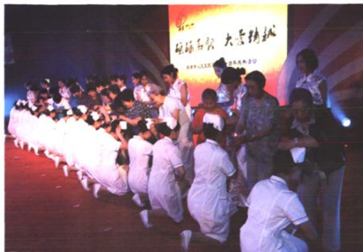
庆典上护理老前辈为新护士授帽