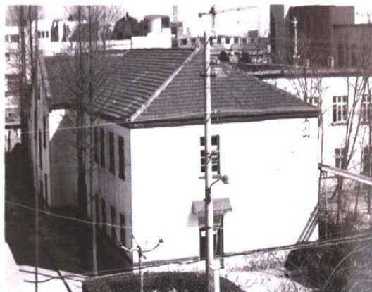
1960年胶南县第一幢二层瓦面楼房(病房楼)