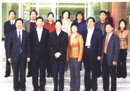
山东省卫生厅厅长包文辉来院视察指导工作