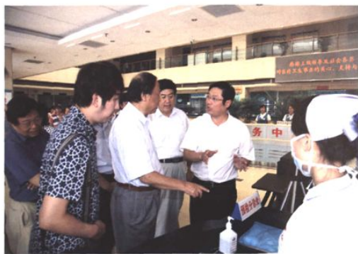
中国医院协会会长曹荣桂等参加庆典的来宾参观医院