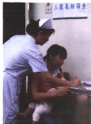
三聚氰胺奶粉患者筛查