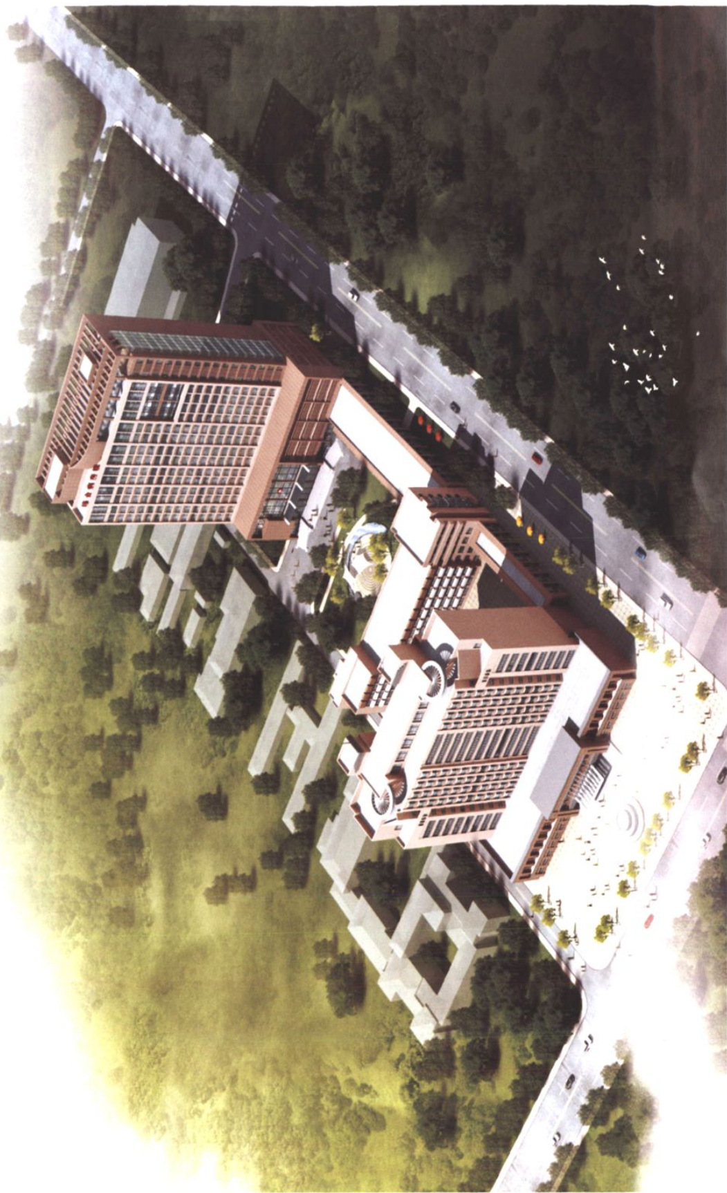
胶南市人民医院整体规划鸟瞰图