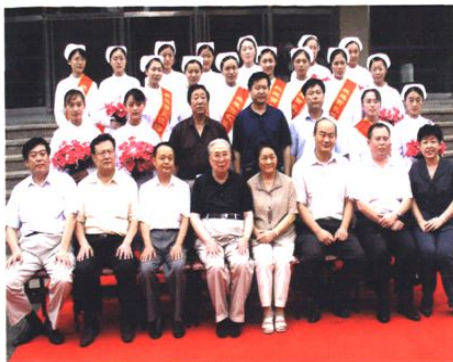
2004年8月27日全国人大副委员长吴阶平院士来院视察指导工作