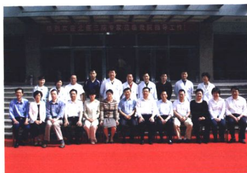
北医三院专家莅临医院指导工作