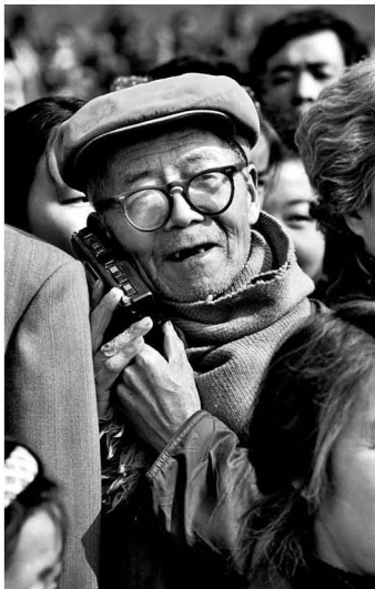
【“国家大事” 1991】 谁说咱这绝不同世情 “国家大事”尽在掌裡