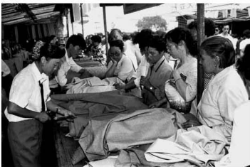
【炊 1989】扯块布样混伴表 当年的母亲们 总得掂量很久很久