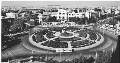
【盘旋路 1989】当年是这座城市的地标 在车流滚滚中成为过去