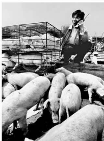
【大哥大 1990】 信息时代的沟通 不是都发生在写字楼里