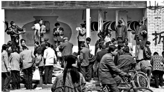
【“市场经济” 1993】 当年的甩卖声 都撞出今天的好日子