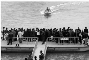
【坐快艇 1996】 习惯了筏子的速度 这么快能坐住不