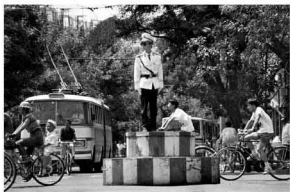
【交警指挥 1989】 没有红绿灯的年代 秩序靠人维系 也靠人心维系