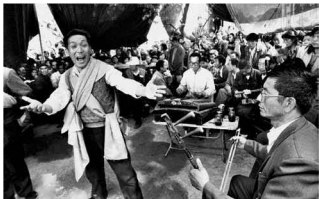
【吼秦腔 1996】 咱秦腔有没有市场 棚子里人挤满着呢 这把尺吼得咋个样 身上有人脸被红呢