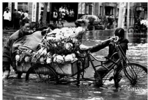
【记忆 1994】 日子就是这么熬过来的 回头看，已淡了那些艰难