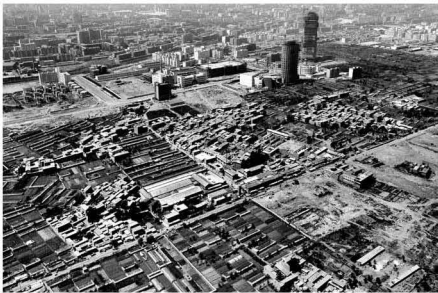
【雁滩 1998】 从田畴到高楼 中间地带 总是一片繁忙的工地