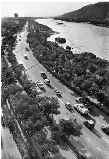
【南滨河路 1988】 没有高楼耸立 没有车流拥堵 这样的时光需要重复吗