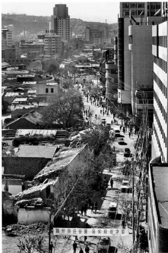
【灰阳路 1995】 过往不久的岁月 有时候你无法想象