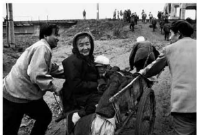
【农村外出架子车 1994】 不管什么春 方便就好 不论啥样的日子 温饱就好