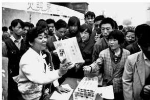
【促销股卷 1995】 记录时间的股卷 最坏被时间记录了