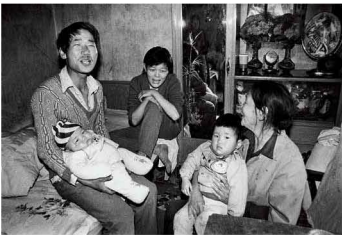
【住 1984】三代人的十二平米 局促已成过去 温馨时常怀想