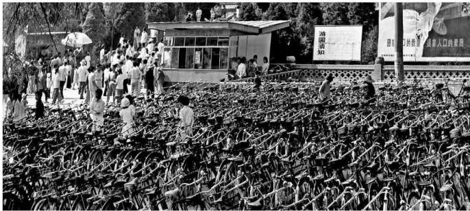
【五泉山门口的自行车 1989】 公园还是那个公园 人群已不是那些人 景象也不再是那个情景