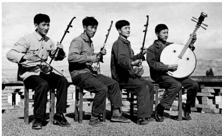
【自拍像 1978】 清贫的日子也有欢乐 如今已不能重复