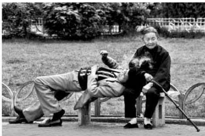
【母与子 1988】 在母亲膝头小憩 什么累就都没了