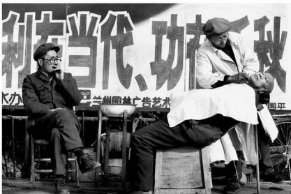
【街头理发 1985】 过往年代的惬意 我们能体味得到吗