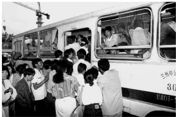
【行 1989】挤就挤吧 既然要前进 就不要在乎拥挤