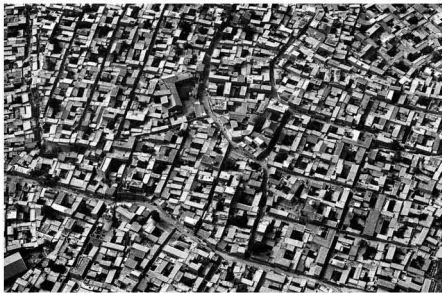
【民宅 1998】 常常会想起孩童的日子 前街后院的邻居 如今都去了哪里