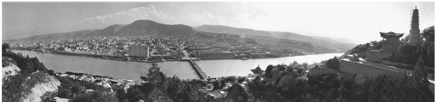
【兰州旧貌 1986】时光深处 城市的记忆模糊成了黑白