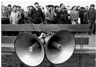
拆迁动员会，讲政策讲程序