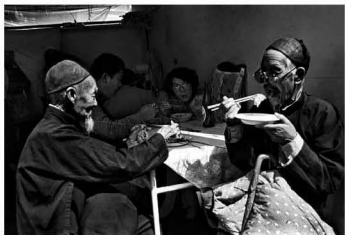
【食 1982】下馆子先得下决心 尝个味道那个味 光阴还得省着点过