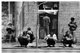
【中大院 1992】 大碗里的市井 马路边的市井 兰州人朴素的市井