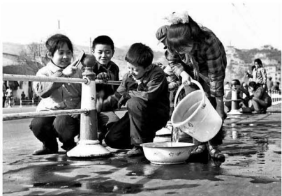
【记忆 1983】 他们的孩子也被这么大了 世界还像从前一样吗