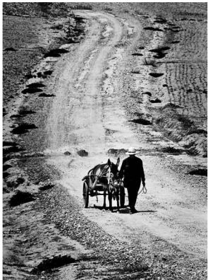
【取水】 1984年夏，永登县王川，村民吃水要从十几里外用驴车拉回来