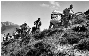
一方有难，八方支援。地震发生后，人们用自行车搬运救灾物资

【七山乡地震】 1995年7月22日6时44分，甘肃省永登七山乡发生5.8级地震。地震造成14人死亡，533人受伤，8860人无家可归……道路堵塞，山体滑坡毁坏大批农田