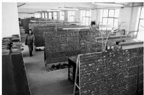
【铅字印刷 1995】 铅与火 曾经用来记录历史 现在已变成历史