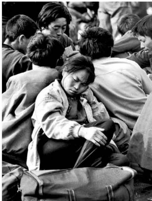
【民工潮】 上世纪90年代中期，春节前后的“民工潮”是兰州火车站的一大景观