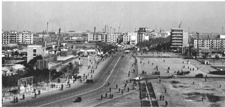
【东方红广场 1982】城市的客厅曾经是会场 旗帜和呼喊已交替多年