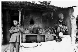
【乡村小买部 1981】 巴望看来点生意 且碰住老少光阴