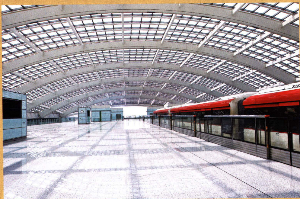
▶ 机场线3号航站楼站