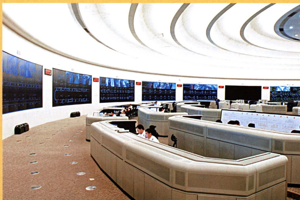
轨道交通指挥中心