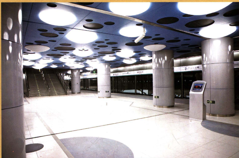
▶ 奥运支线奥林匹克公园站