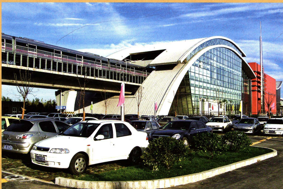
换乘便捷的地铁站