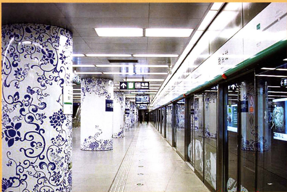
▶ 奥运支线北土城站