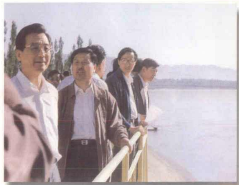
温家宝视察景电灌区