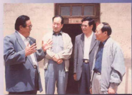
仲兆隆视察古浪灌区