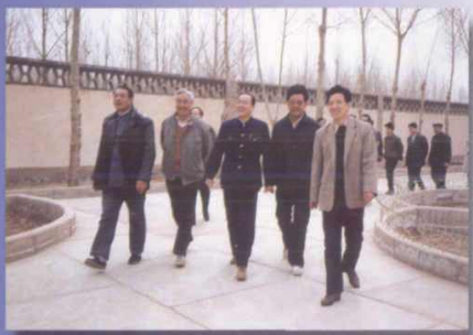
顾金池视察古浪灌区