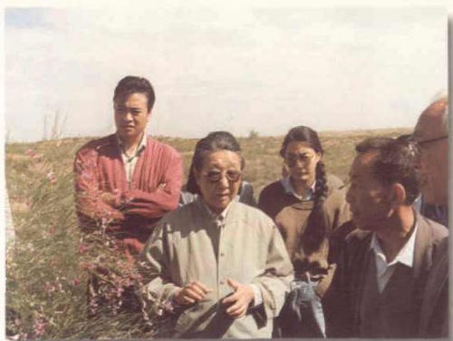
钱正英视察古浪灌区