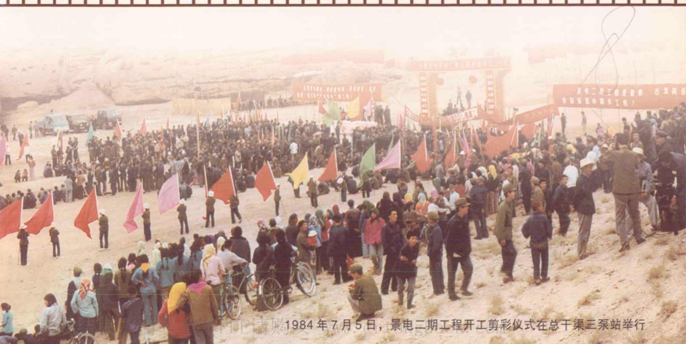
1984年7月5日，景电二期工程开工剪彩仪式在总干渠三泵站举行