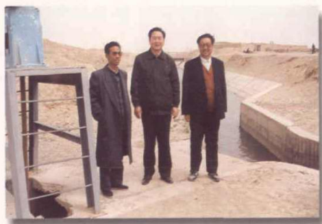
孙英视察古浪灌区