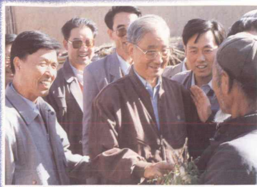
宋平视察古浪灌区