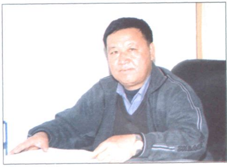
مستشاران و هیئت مدیران تشکیلاتی همکاران هیئت رئیسه هیئت مدیران هیئت مدیران هیئت مدیران