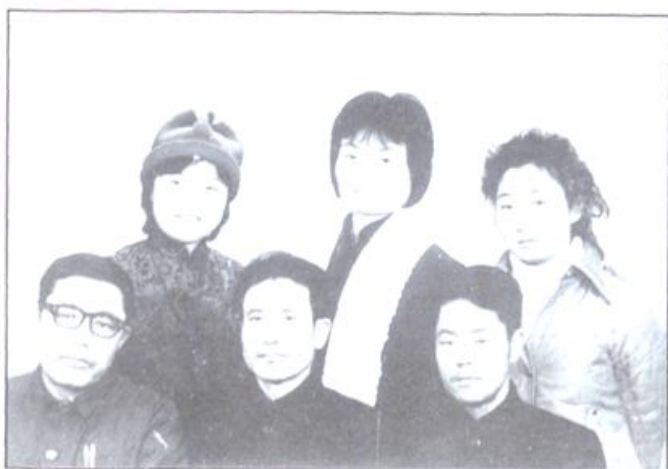
1980年11月，在清华大学校园内留影。