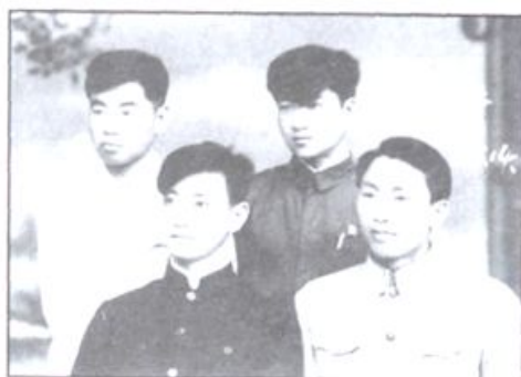
1980年11月，在清华大学校园内留影。