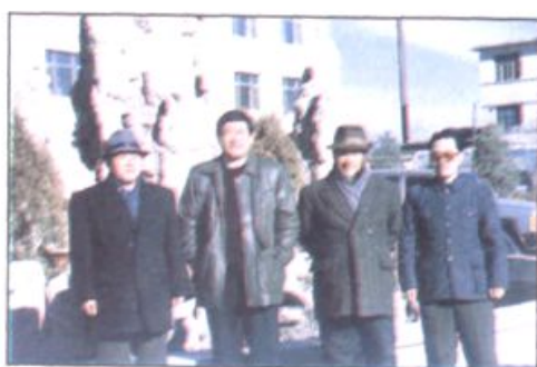
1980年11月，在清华大学校园内留影。