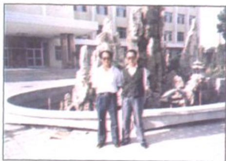
1980年11月，在清华大学校园内留影。