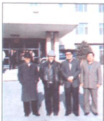
1980年11月，在清华大学校园内留影。