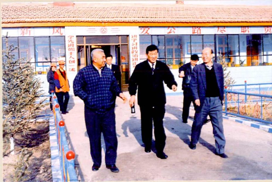
省委常委、副省长郭琨(中),省人大常委会副主任柯茂盛(右一),在总段视察工作