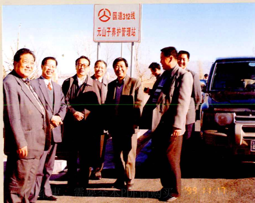
省委常委、省委宣传部部长马西林(左三)在元山子养护管理站调研思想政治工作