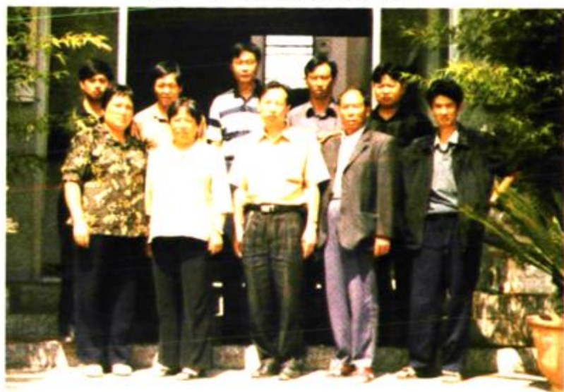
第二届“两委”会班子成员合影