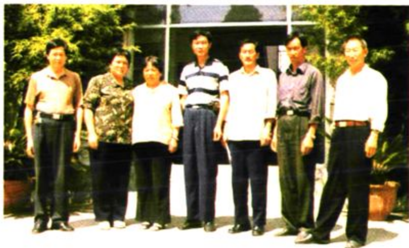
第一届村委会成员合影