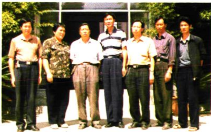
第一届总支委员会成员