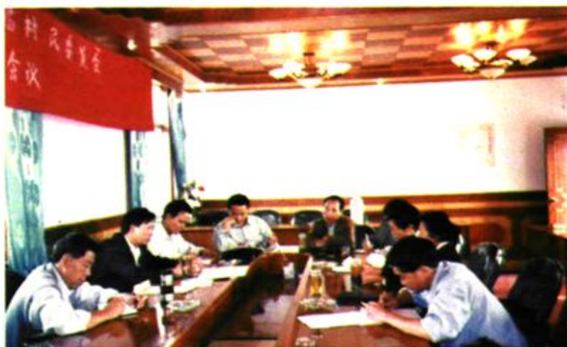
第一届村委选举工作会议