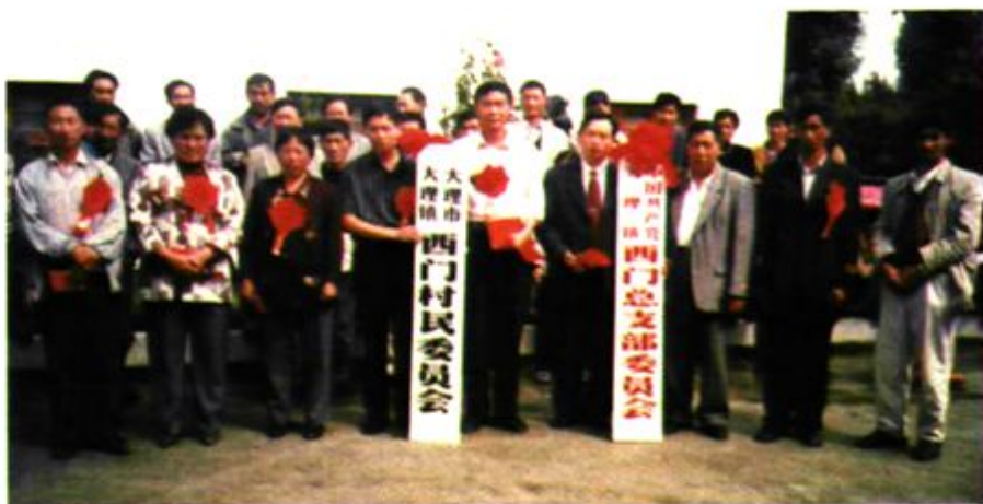
第一届“两委”授牌仪式留影