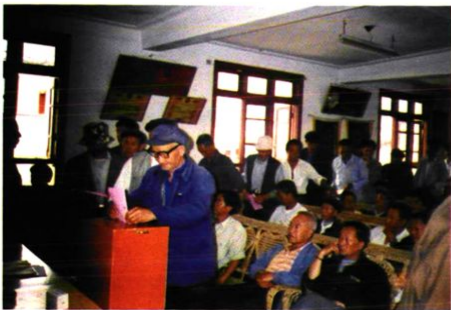
西门村选举投票仪式