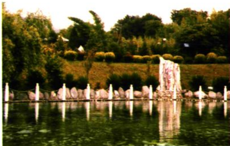
西门银箔泉民族风情园