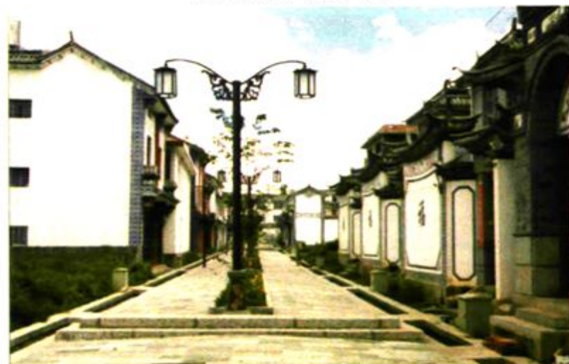
西门村三月街辅助区一角