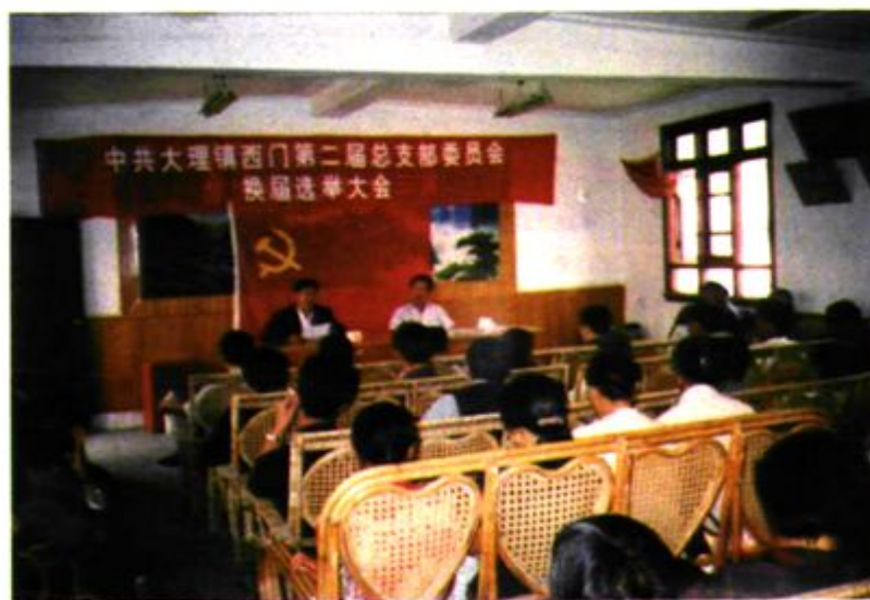
第二届总支委员会