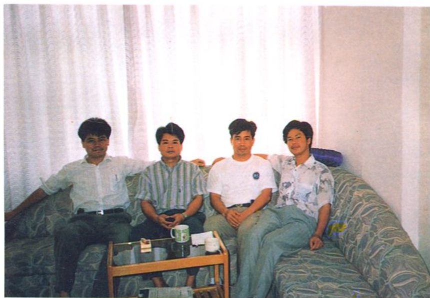
农机服务公司领导干部合影