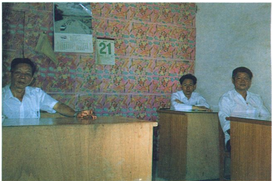
农机学校领导干部合影