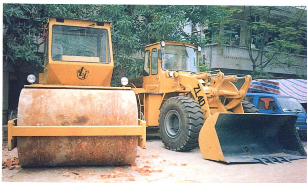
农机服务公司商场商品之一——推土机