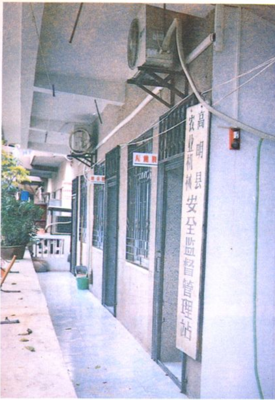
高明县农业机械安全监督管理站