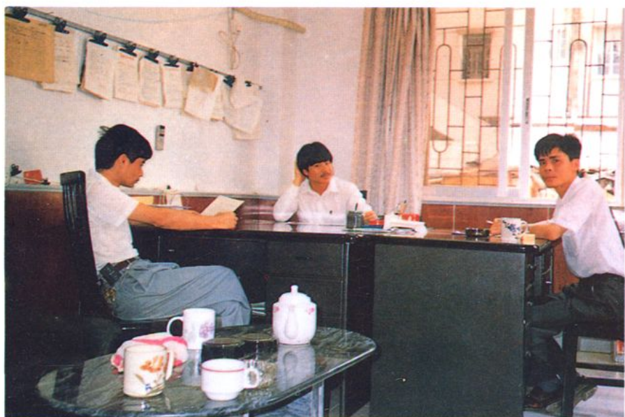
农机供应公司领导干部在办公室工作