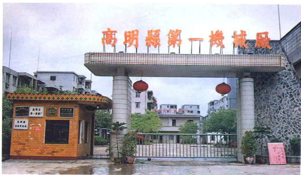
高明县第一机械厂