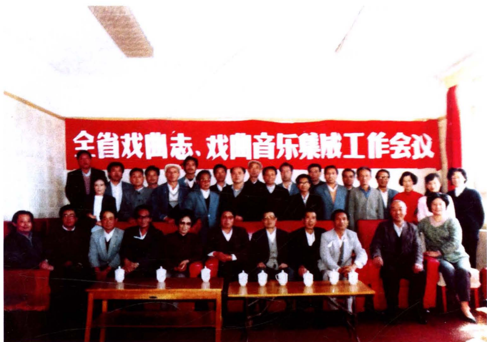
1983年青海省“全省戏曲志·戏曲音乐集成工作会议”在西宁召开,会议结束时 与会人员合影。