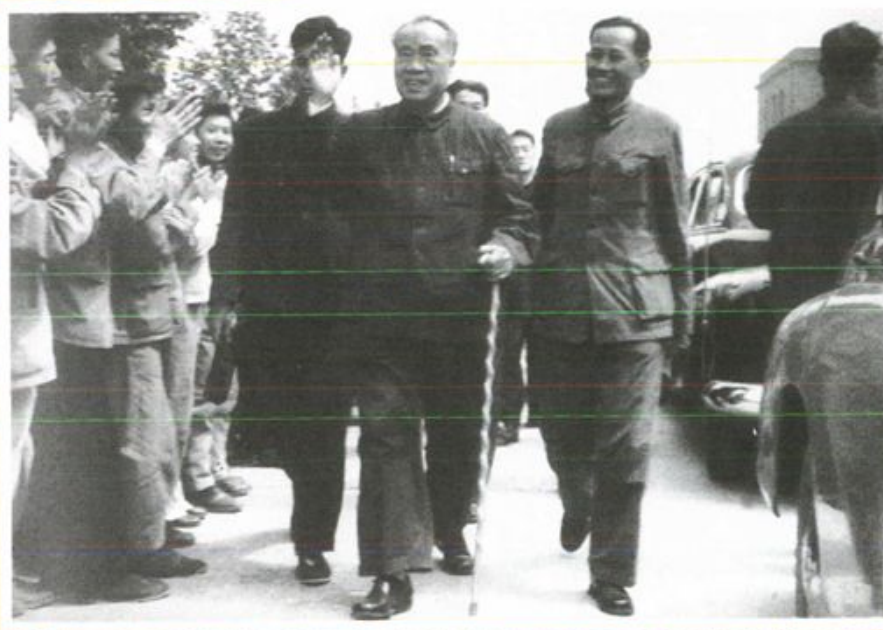
1961年5月，朱德委员长在宝鸡建行拨款兴建的宝成仪表厂视察