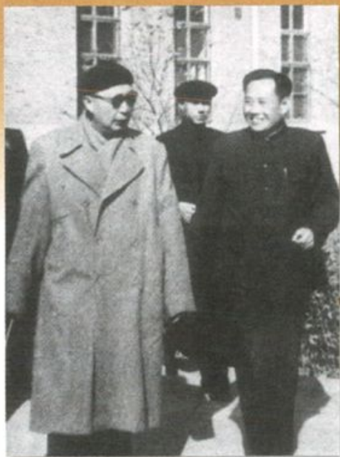
▲ 1961年12月，聂荣臻副总理视察宝鸡建行拨款建成的宝鸡仪表厂