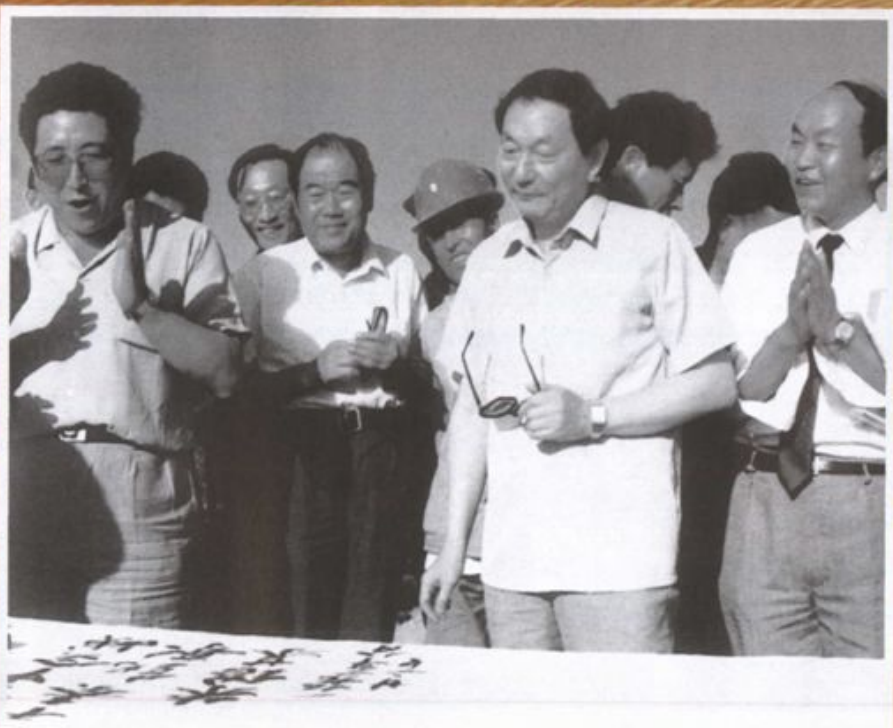
1992年8月2日，朱镕基副总理视察宝鸡建行代理的重点建设项目宝中铁路建设并挥毫题词：“宝中会战、早奏凯歌”。