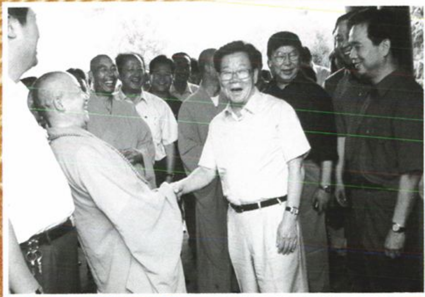
2002年9月9日，全国政协主席李瑞环视察宝鸡建行贷款新建的法门寺博物馆珍宝阁