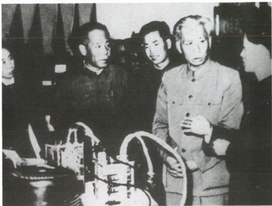
1960年4月，刘少奇主席视察宝鸡建行拨款建成的宝成仪表厂