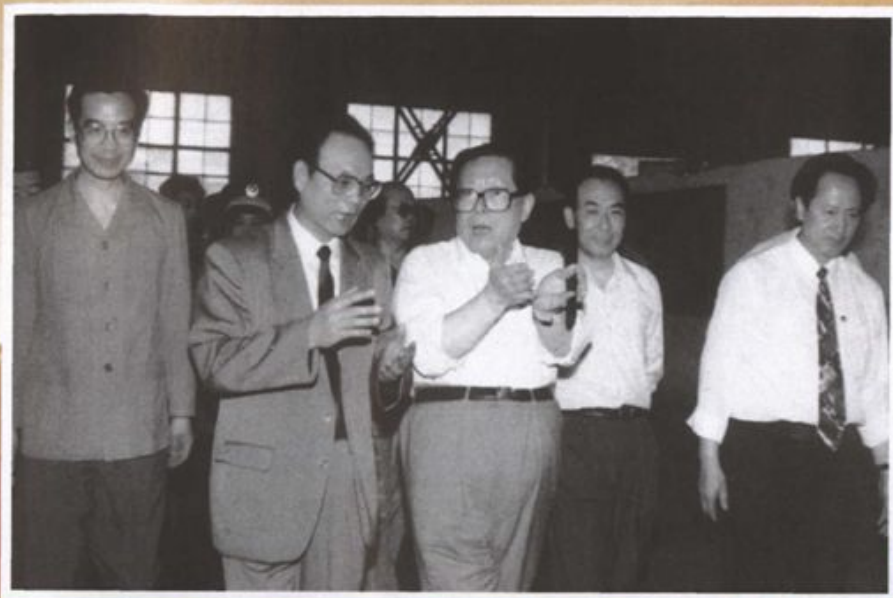
1993年6月，江泽民总书记视察宝鸡建行拨、贷款重点支持的宝鸡石油钢管厂（左一为中共中央政治局候补委员、中央书记处书记、中央办公厅主任、中央直属机关工委书记温家宝）