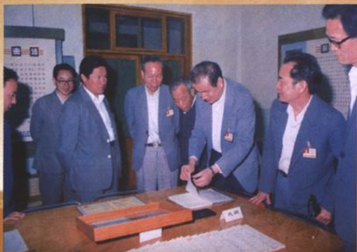
1987年，石油部副部长周永康（左三）视察宝鸡建行拨贷款支持的重点企业宝鸡石油机械厂