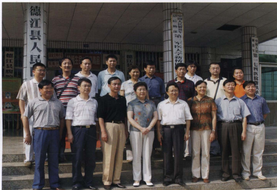
2008年6月28日副省长刘鸿麻(女左4)、行署副专员龙林(左3)、省卫生厅副厅长周惠明(女右3)、地区卫生局局长秦大慧(左1)、县委书记杨频(右4)、县长夏虹(左2)等省地县领导与医院领导合影