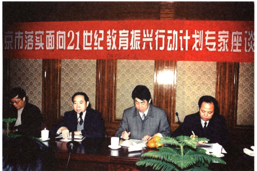
1999年时任北京市市长助理、市教委主任袁贵仁（左二）出席我院“北京市落实面向21世纪教育振兴行动计划专家座谈会”