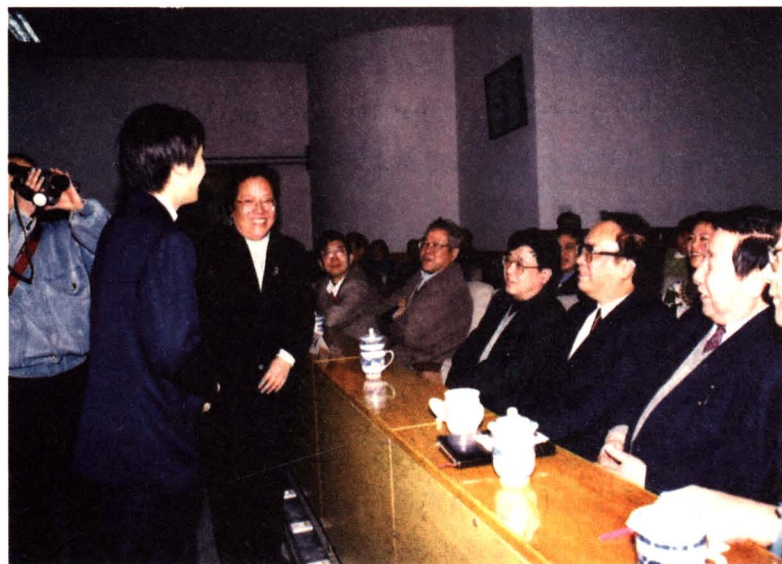
1999年时任中 共北京市委副 书记李志坚(右 二)到我院观 摩教研活动