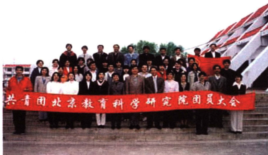
1997年4月共青团北京教科院第一届总支委员会成立大会