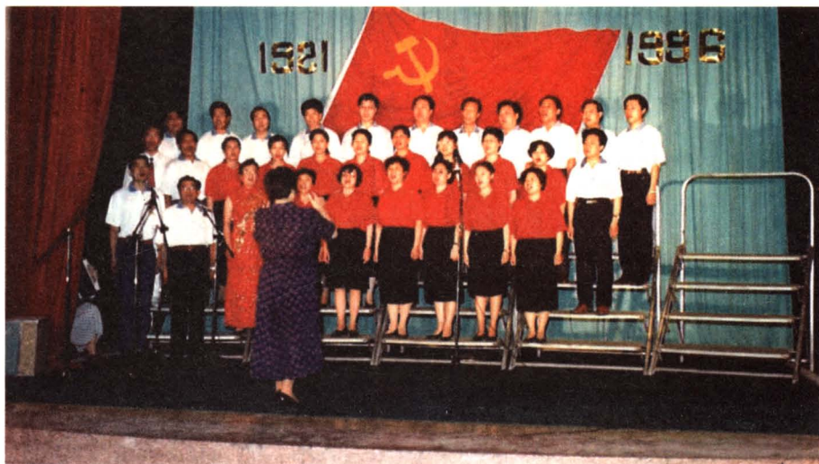
1996年6月首次庆“七一”文艺汇演