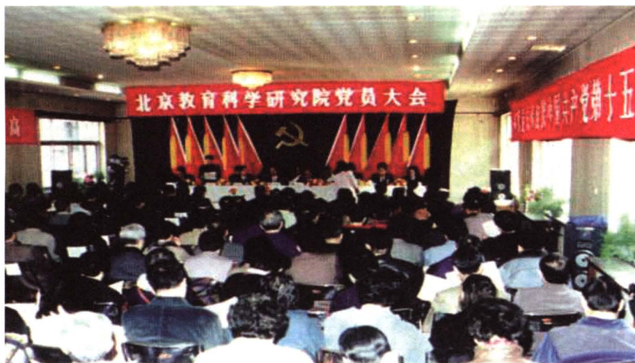
1997年3月中共北京教育科学研究院委员会选举大会