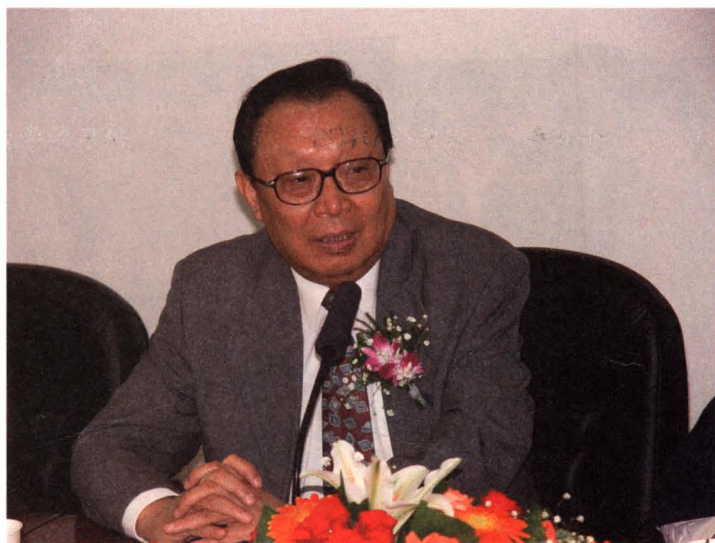
2004年著名教育家陶西平出席我院活动