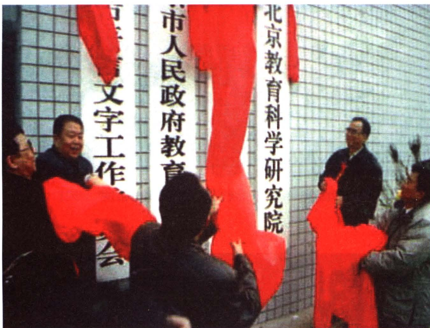
1996年2月15日北京教育科学研究院揭牌仪式