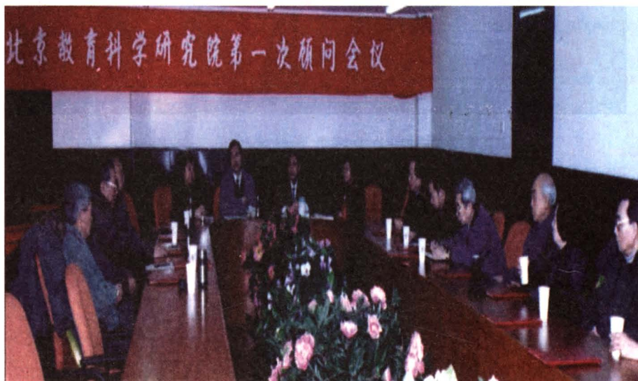
1997年1月顾问委员会成立会议