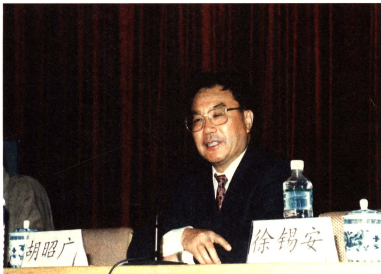
1997年时任 北京市副市长 胡昭广出席我 院学术报告会