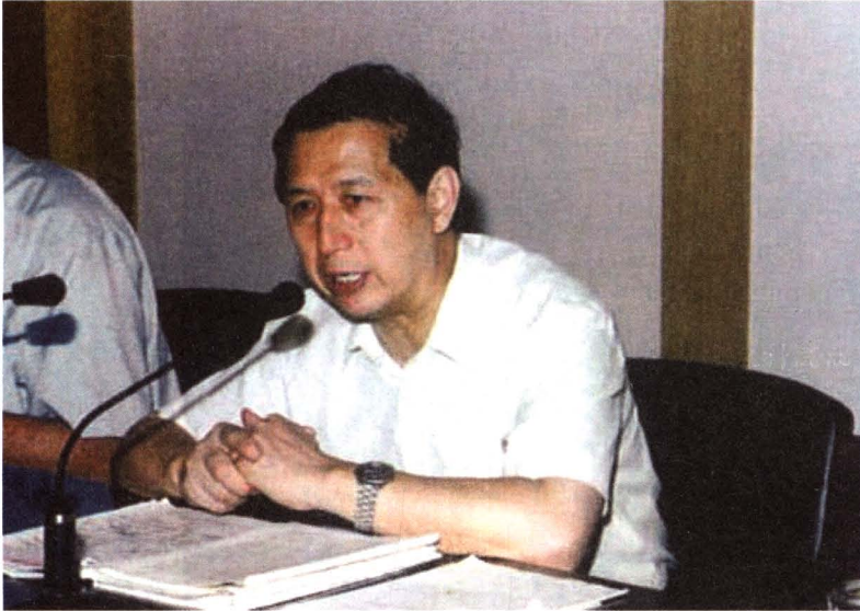
1999年时任中共北京市委常委、市委教育工委书记、市教委主任徐锡安到我院指导工作