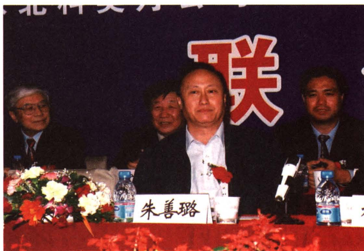
2002年时任中共北京市委常委、市委教育工委书记朱善璐参加我院活动