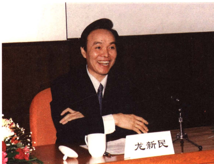
2002年时任中共北京市委副书记龙新民到我院指导工作