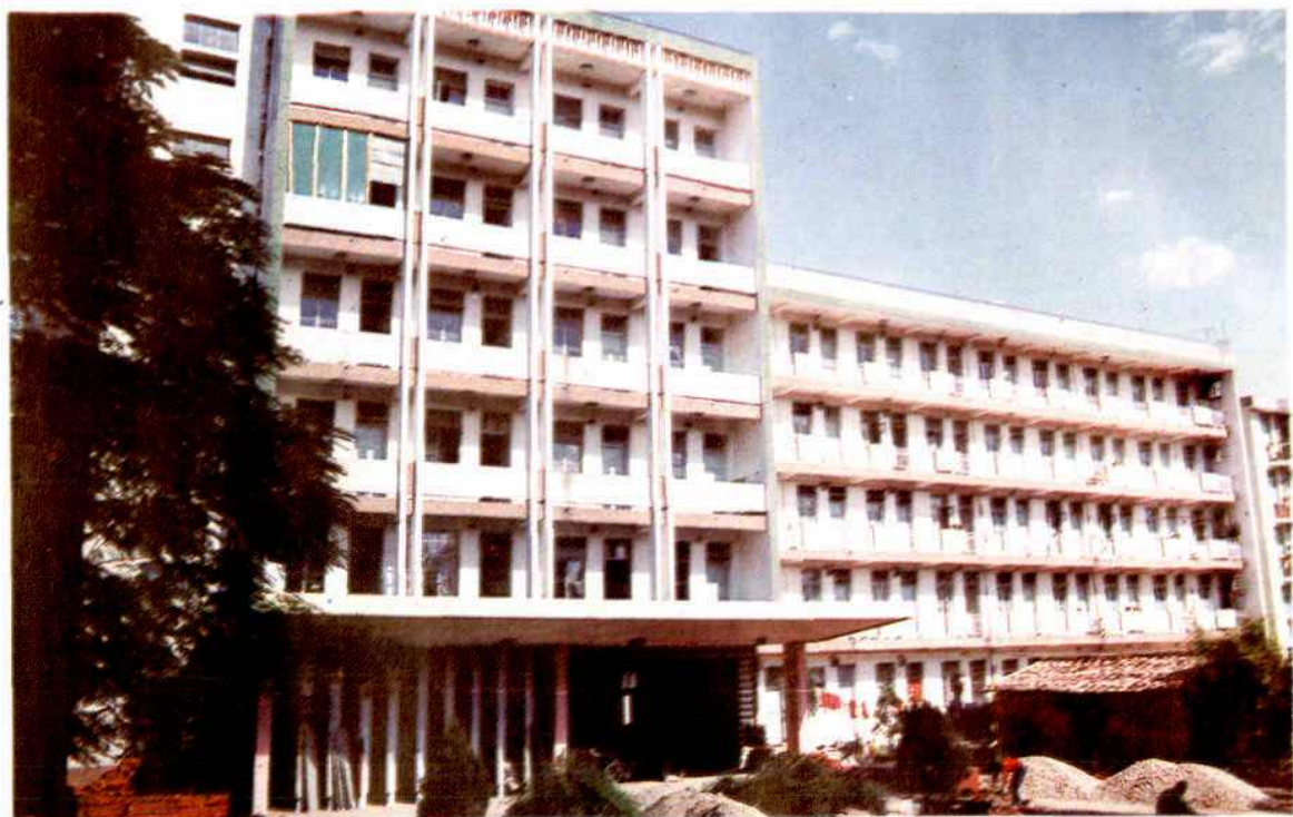
仙游农业局办公大楼