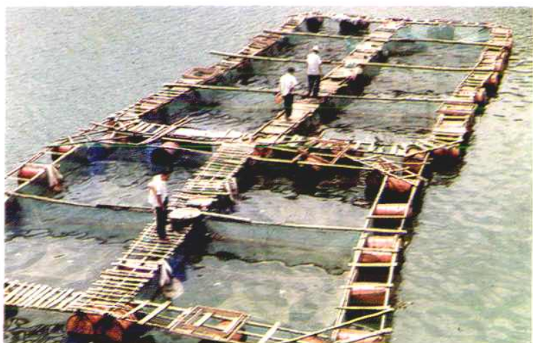
东溪水库网箱养鱼