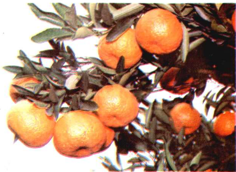
度尾等地栽培的柑桔——硬芦