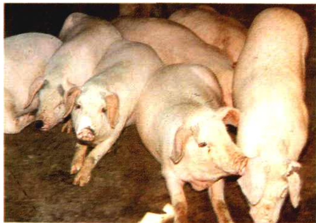
梅山猪与长白公猪杂交一代仔猪