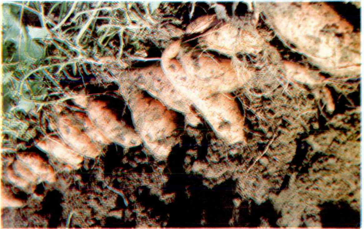
甘茹良种金山57在赖店西埔作花生茹。 1993年验收亩产达三千五百多公斤