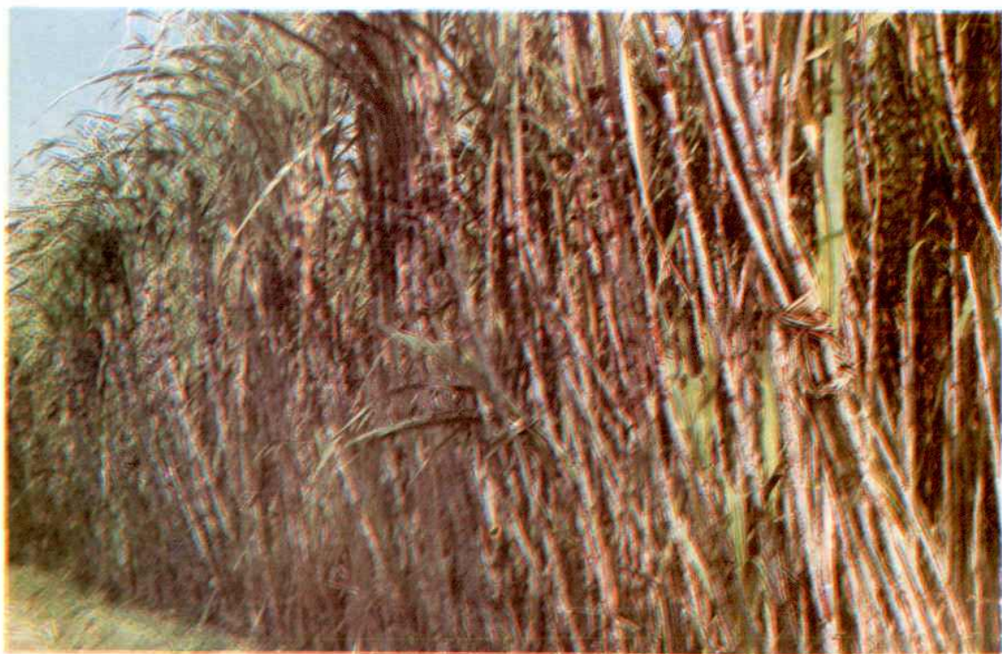
龙华建华的甘蔗419良种亩产达10吨以上