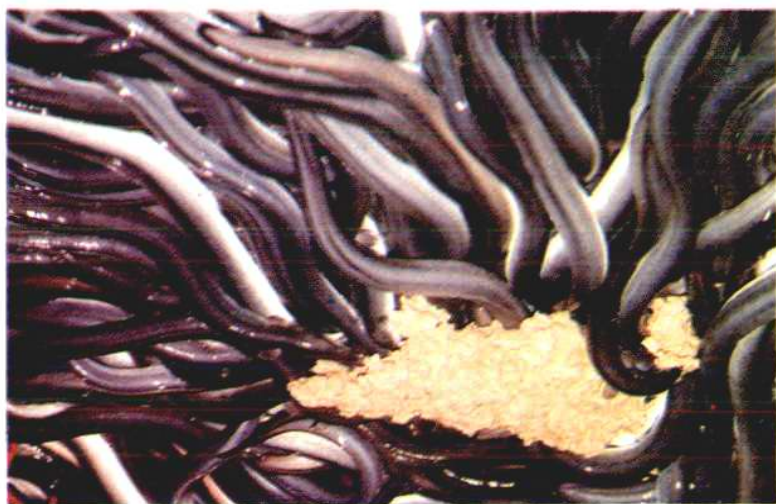
县鳗鱼场饲养的鳗鱼