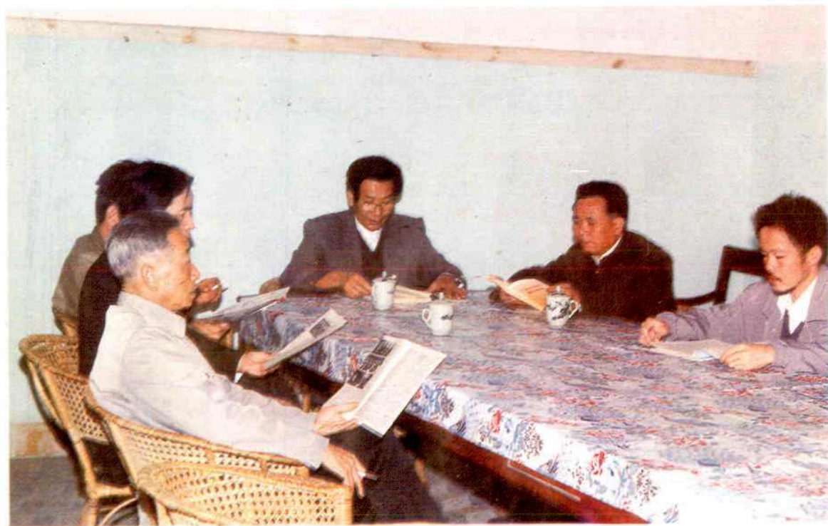
县农业志编纂人员在研究工作