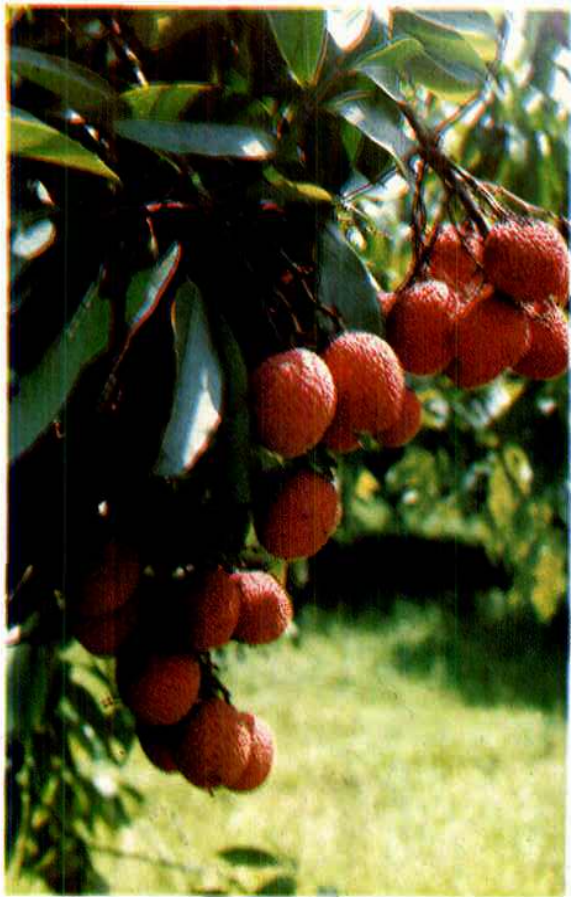
枫亭东宅陈紫荔枝