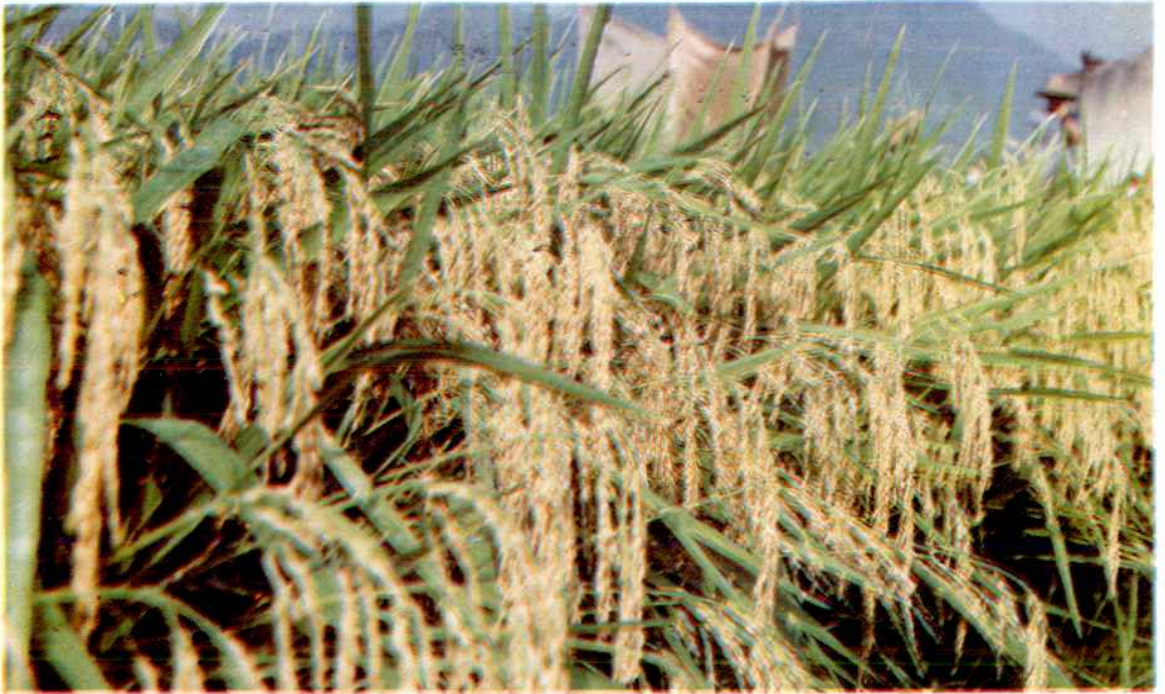
特优63杂交水稻作早稻抛秧栽培，1992 年最高一季亩产达810·7公斤