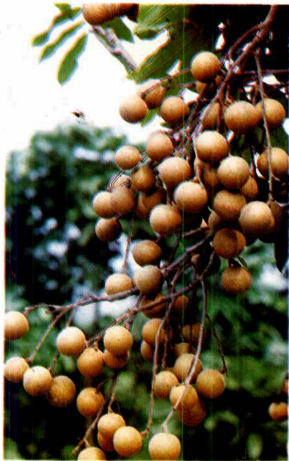
著名的龙眼优良品种——乌龙岭