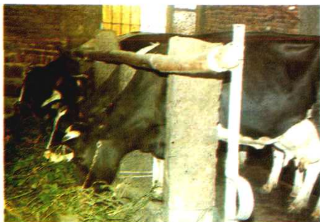
县乳牛场饲养的奶牛