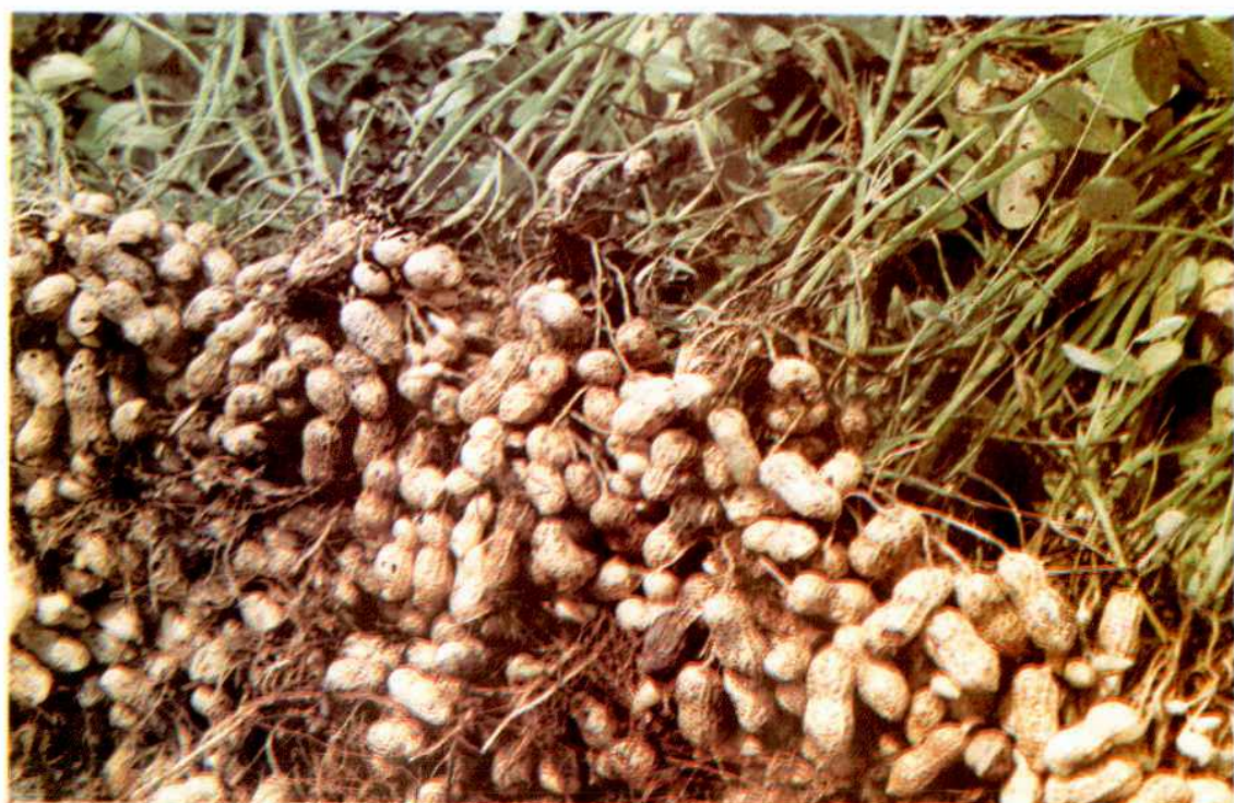
白沙一号花生良种，1993年验收亩产达402公斤