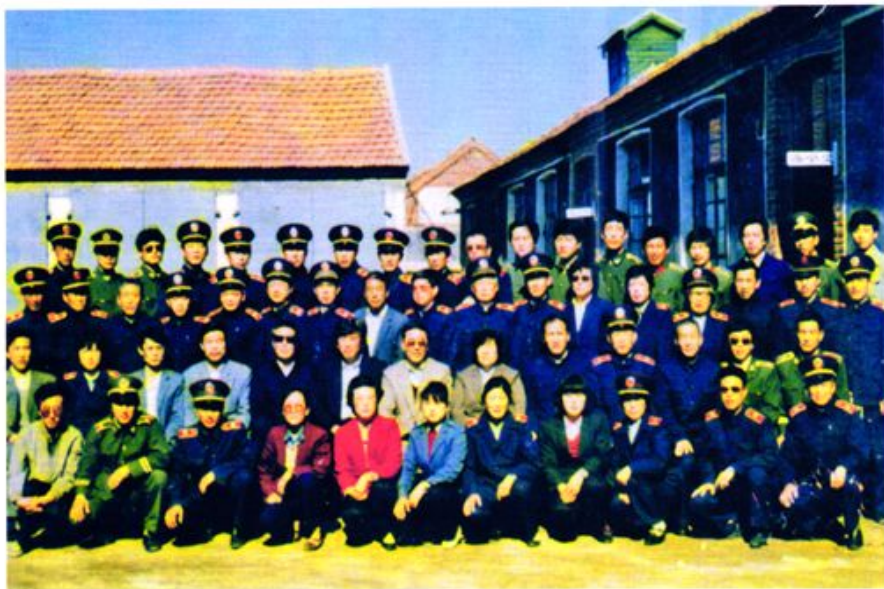
■ 1990年6月，省高级人民法院院长宇培杲（二排左七）在烟台市中级人民法院院长张英春（二排左八）陪同下，到海阳市人民法院视察工作时与院机关全体干警合影留念。