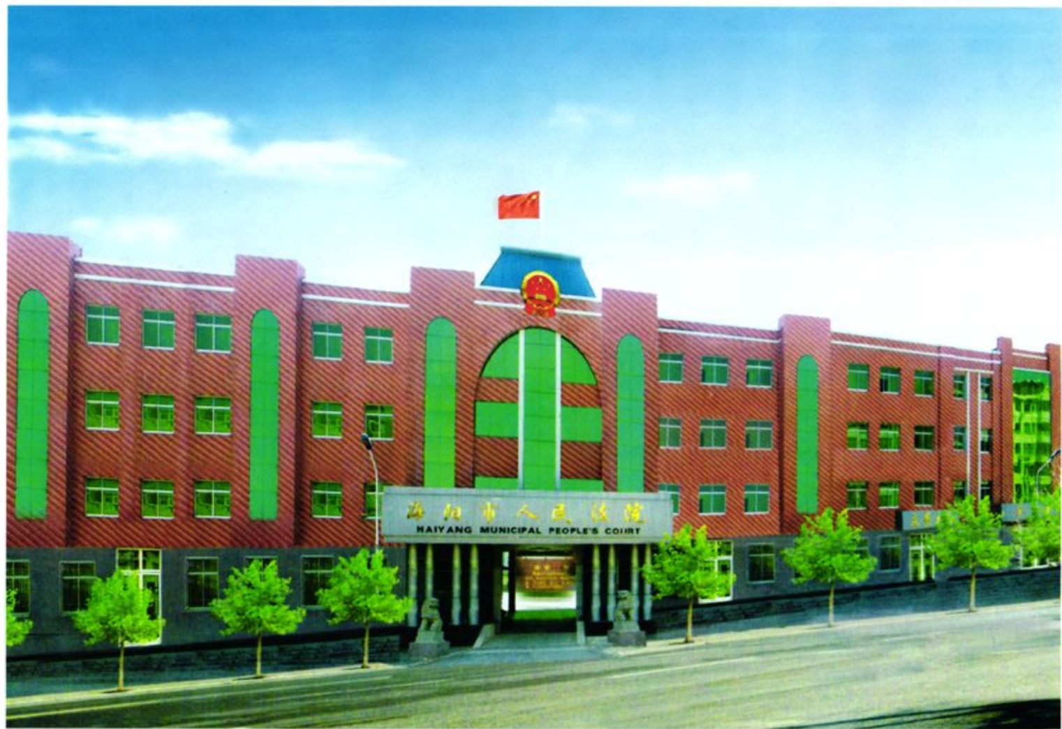
■ 海阳市人民法院办公楼