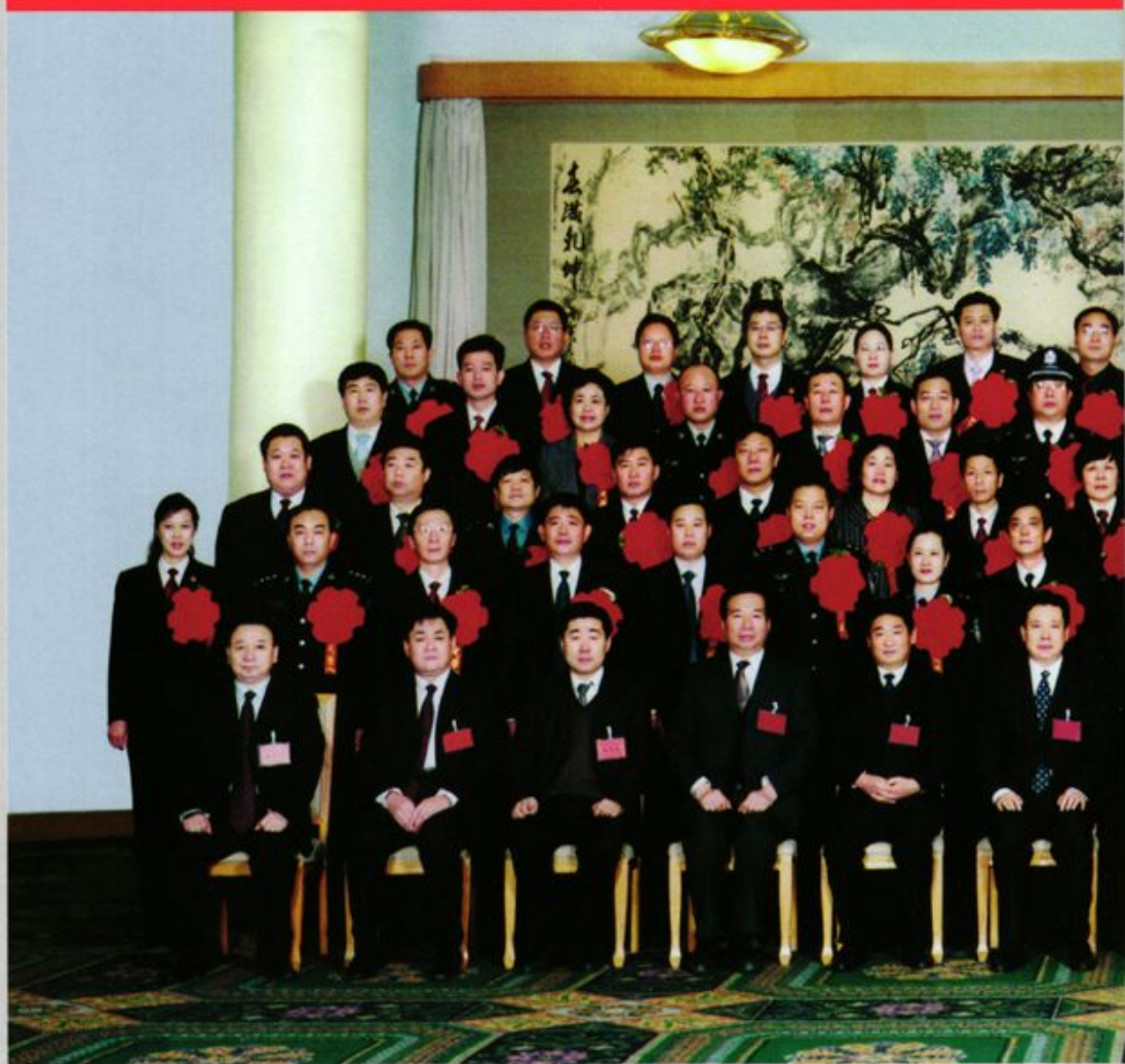
■ 省领导与全省人民满意的公务员和集体代表合影