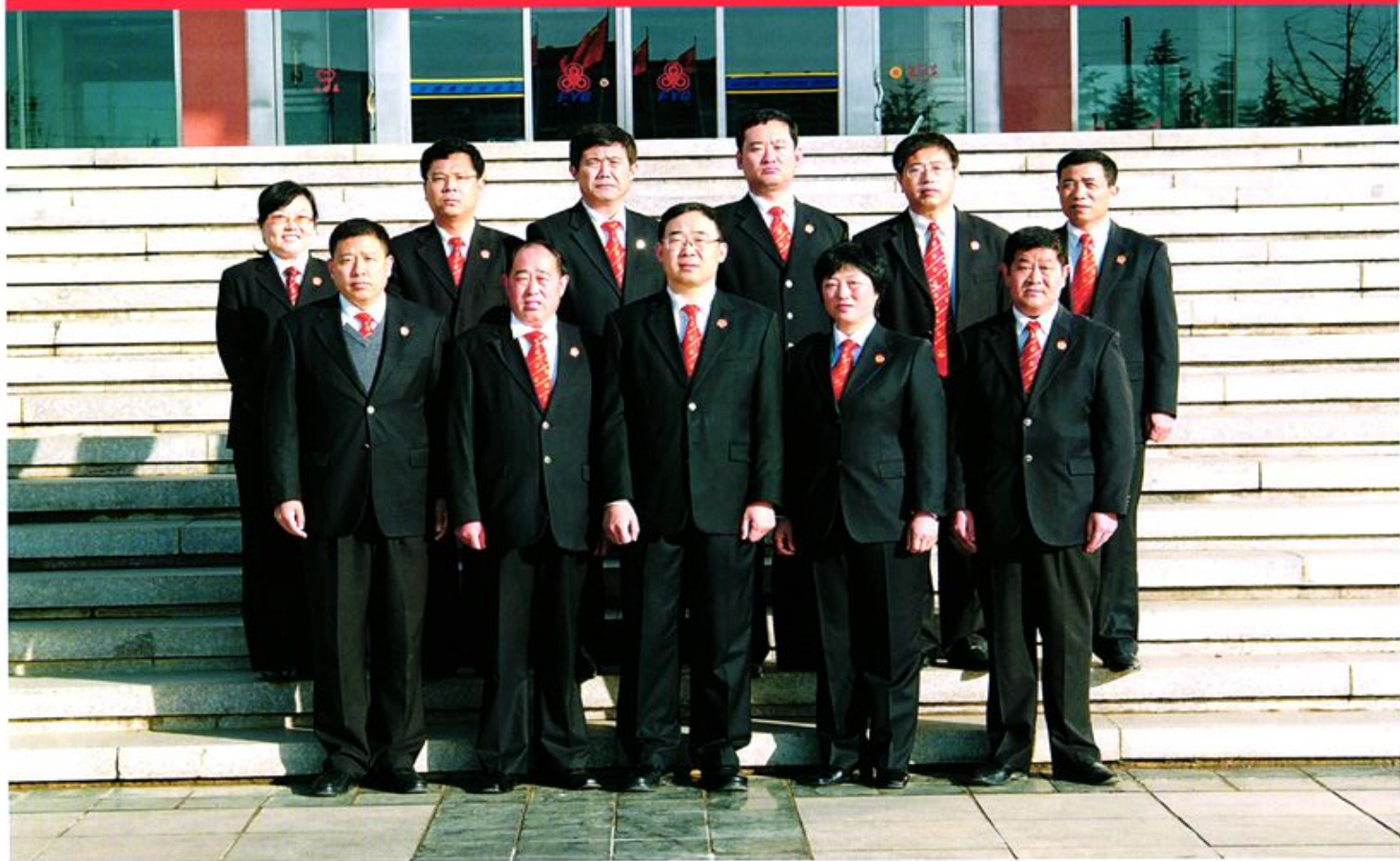
■ 市中级人民法院领导班子成员合影