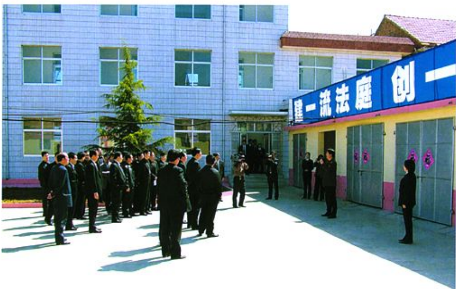
■ 2005年4月21日，参加烟台市法院执行工作会议的各县市区法院领导参观留格庄法庭。