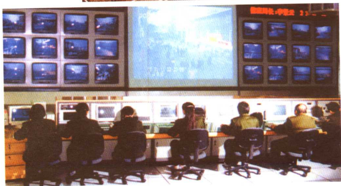
1998年建成的市公安指挥中心大楼