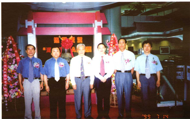
1999年7月宣化工程机械集团有限公司股票在深圳股票交易所上市