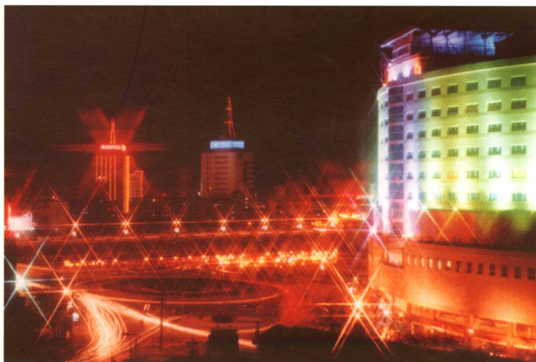
开放繁荣文明的张家口市夜景