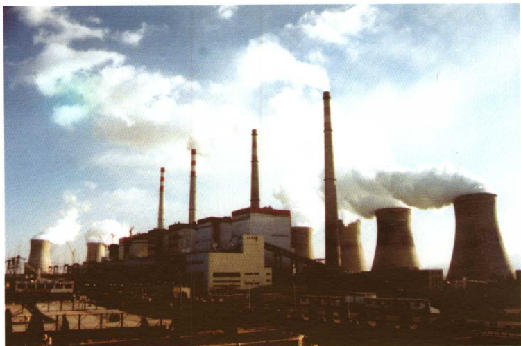
1999年12月北京大唐张家口发电厂6号机组并网发电