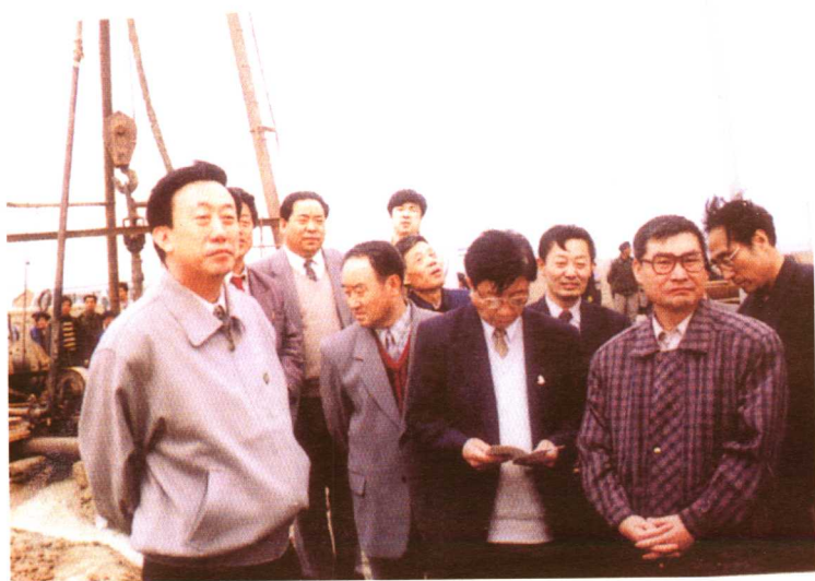
市委副书记程葆刚陪同副省长郭庚茂到地震灾区指导工作