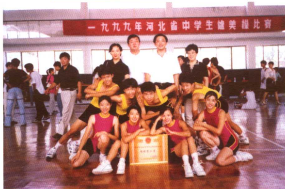
张家口市一中参加省中学生健美操比赛名列前茅