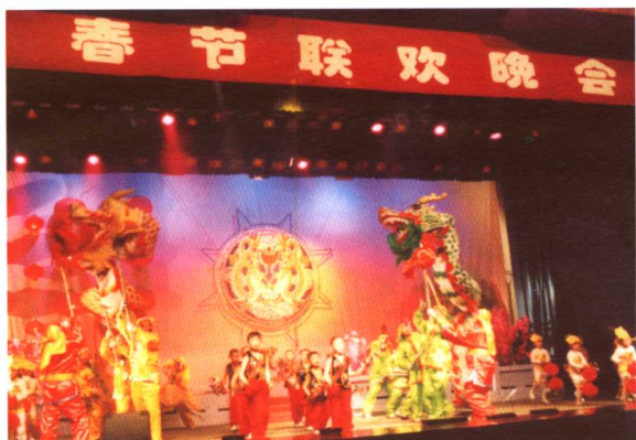
群众文化丰富多彩