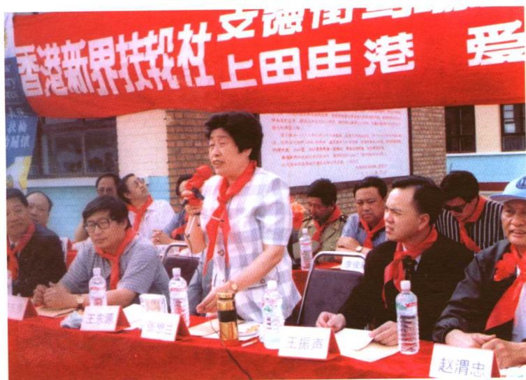
市委副书记张懋兰出席怀安县希望小学竣工典礼