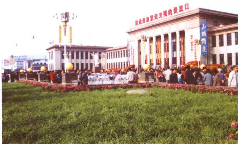
新建的市文化广场