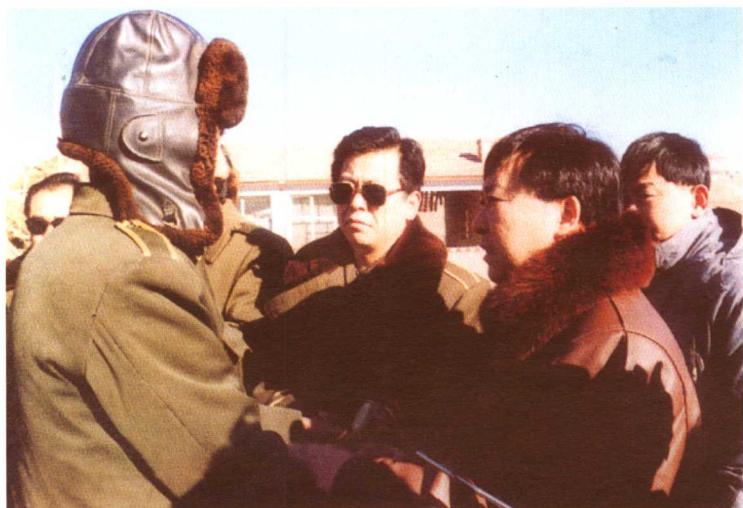
市长张宝义到灾区慰问受灾群众