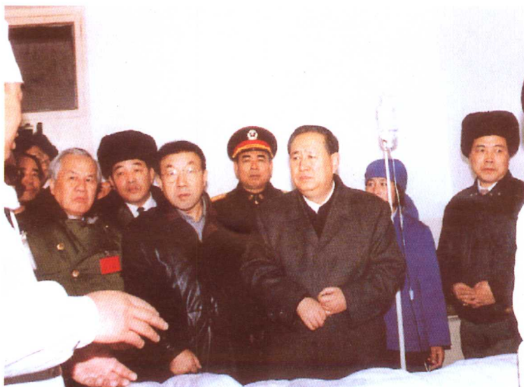
受江泽民总书记和李鹏总理委托，中共中央政治局委员、国务院副总理姜春云在省长叶连松、张家口市委书记杨德庆陪同下到张北县慰问受灾群众。