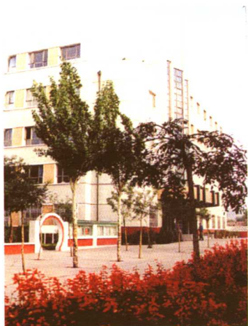
1998年创办的省第四外国语高中