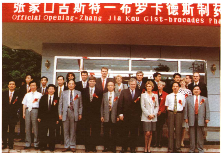
1998年6月张家口吉斯特—布罗卡德斯制药有限公司开业，副省长郭世昌和市领导杨德庆、张宝义出席剪彩仪式。