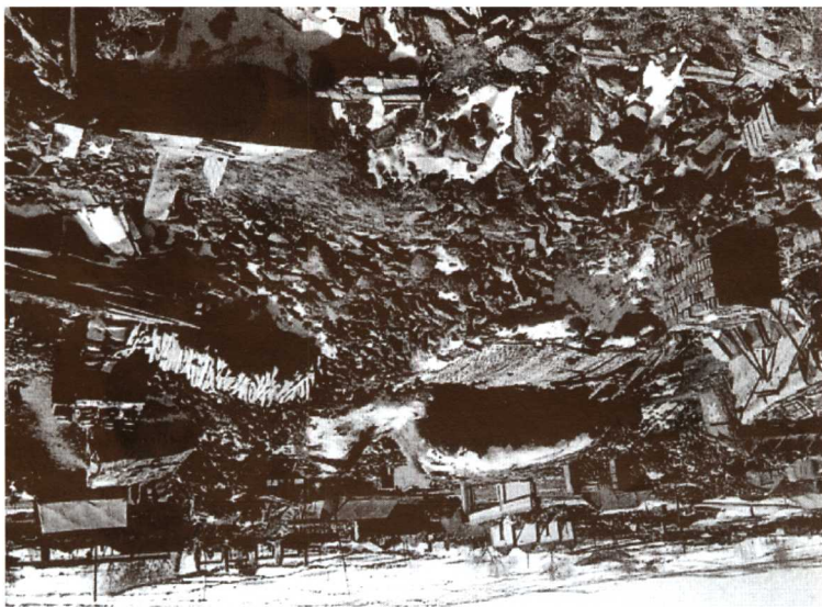
1998年1月10日张北、尚义两县交界处发生里氏6.2级地震