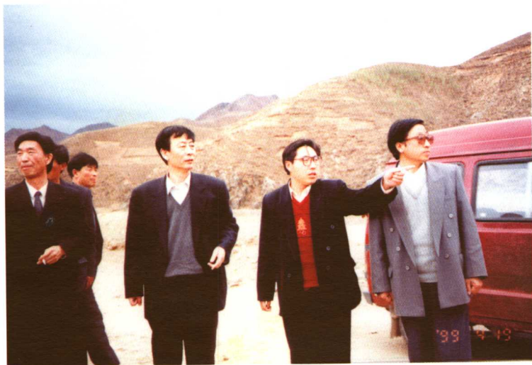
市委副书记王建雄到扶贫点视察工作