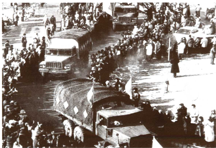
张家口人民夹道欢迎英雄的子弟兵凯旋