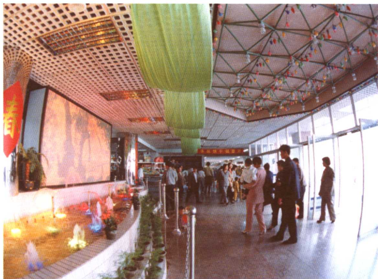
帝达购物中心优美的购物环境