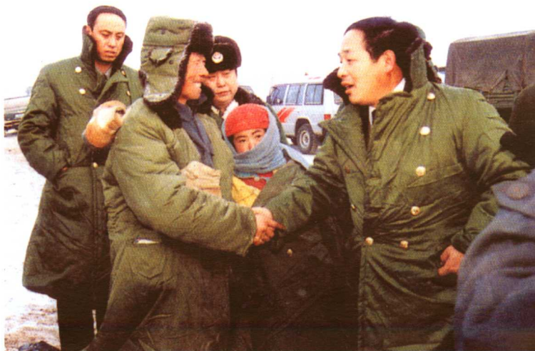
市委书记杨德庆到灾区慰问受灾群众