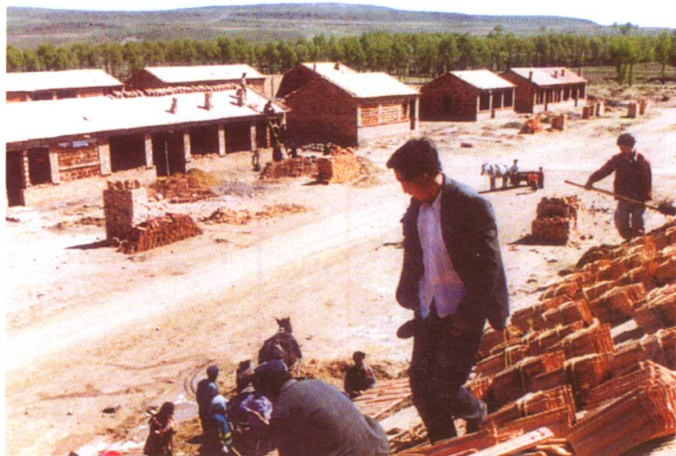
地震灾区群众喜建新房