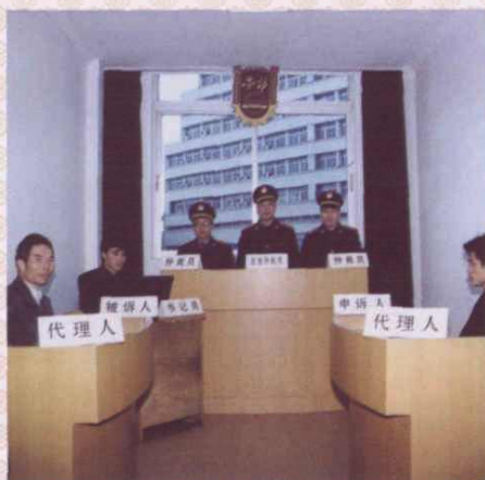
温岭市人事劳动局仲裁庭开庭审理劳动争议案件。