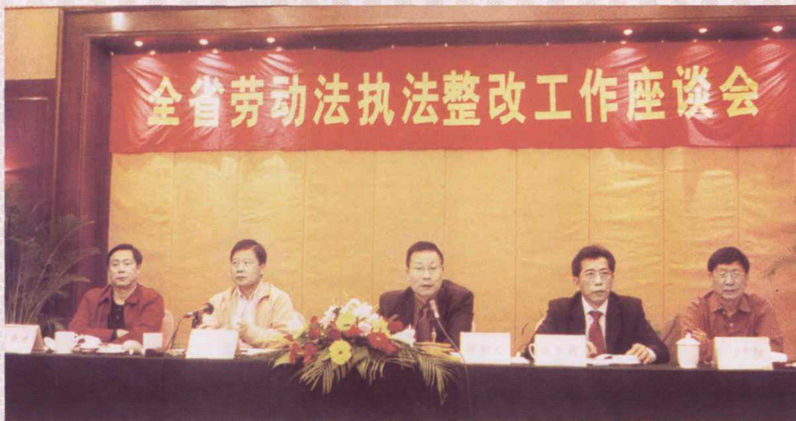
2003年10月21日，全省劳动法执法整改工作座谈会在台州召开。副省长陈加元出席会议并讲话，省劳动保障厅厅长陈小恩、副厅长金汝斌参加了会议。陈小恩厅长代表省劳动保障厅在会上发言。