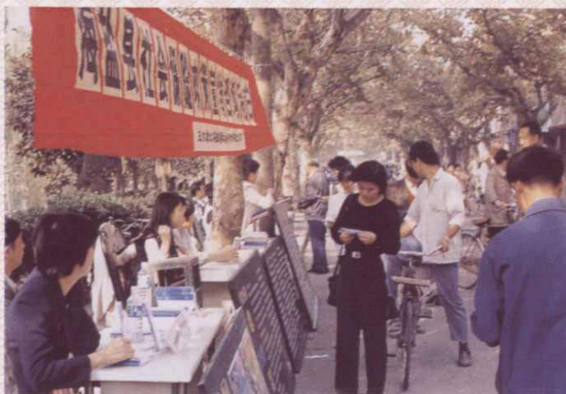
海盐县开展社会保险扩面街头咨询。