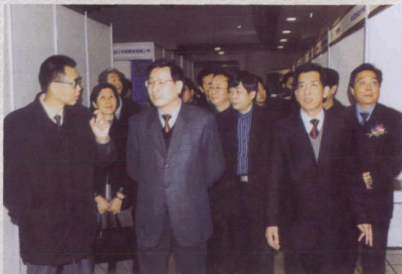
2003年3月15日，副省长陈加元视察省人力资源交流大会现场。