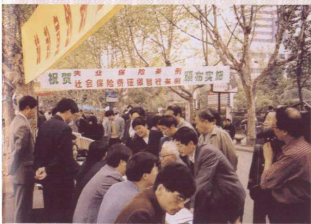
劳动保障宣传咨询服务场景。