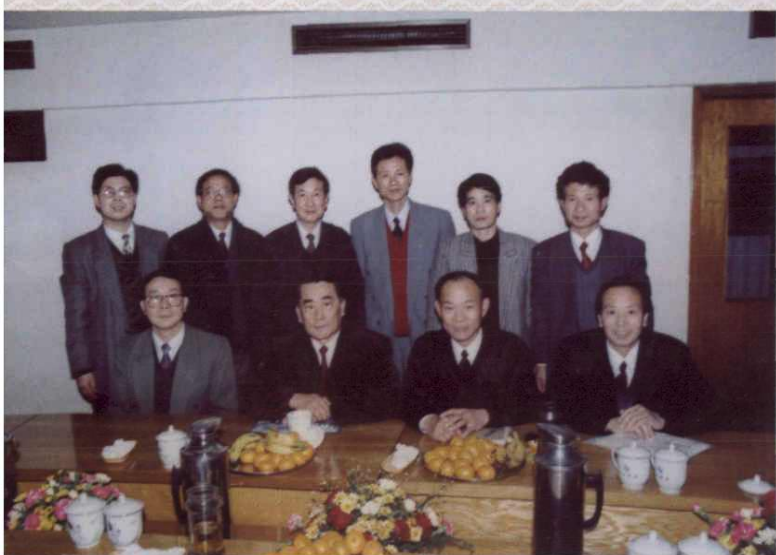
1996年4月,劳动部部长李伯勇视察浙江劳动工作,图为与省劳动厅部分领导和处室负责人座谈时合影。