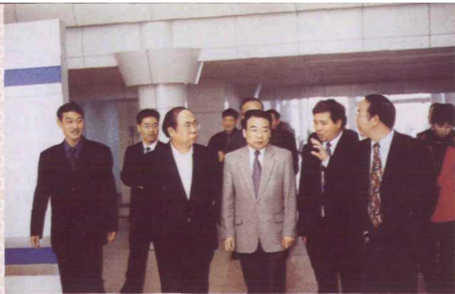
1999年4月11日~18日，劳动部党组书记、副部长李其炎（左三）在省市有关领导陪同下，赴杭州、绍兴、宁波、温州等地检查和指导工作。