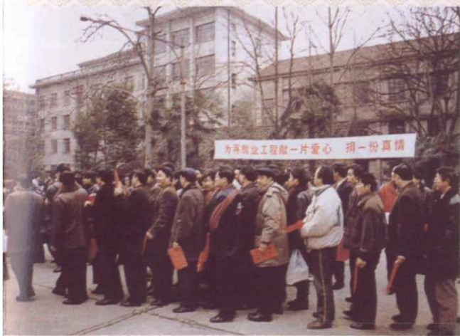
金华市通过“万人捐、帮万家、情系再就业”活动的广泛宣传，社会各界踊跃为再就业工程捐款捐物。