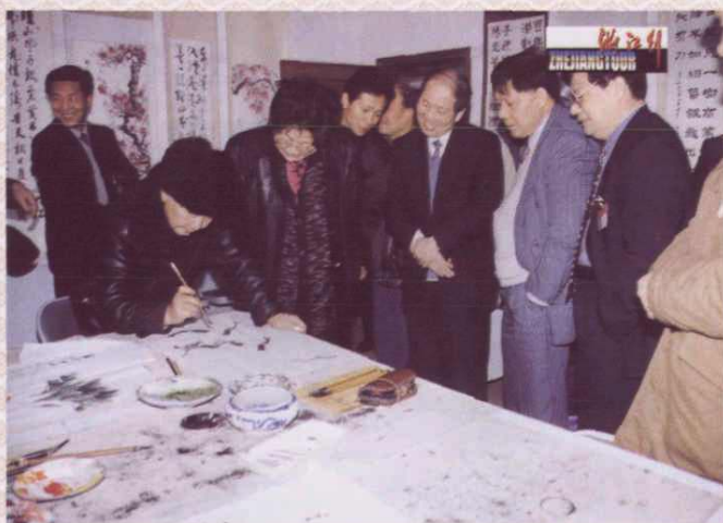
劳动保障部副部长王建伦（左三）来浙江检查“两个确保”工作，并慰问下岗职工和企业离退休人员家庭。图为部、省、市领导参观杭州市退休职工大学。