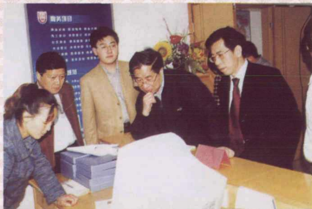
2003年10月27日~11月1日，以劳动保障部副部长张小建（右二）为组长的中央再就业工作督查组到我省开展再就业情况的督查工作。图为督查组考察杭州市江干区采荷街道洁莲社区。