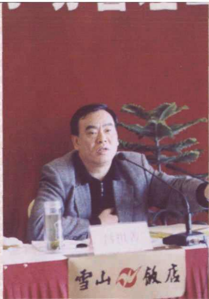
2002年3月6日，省委常委、常务副省长吕祖善在温州举行的全省劳动用工管理和社会保险工作座谈会上作重要讲话。