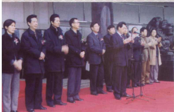
省劳动保障厅厅长陈小恩主持省人力资源交流大会。