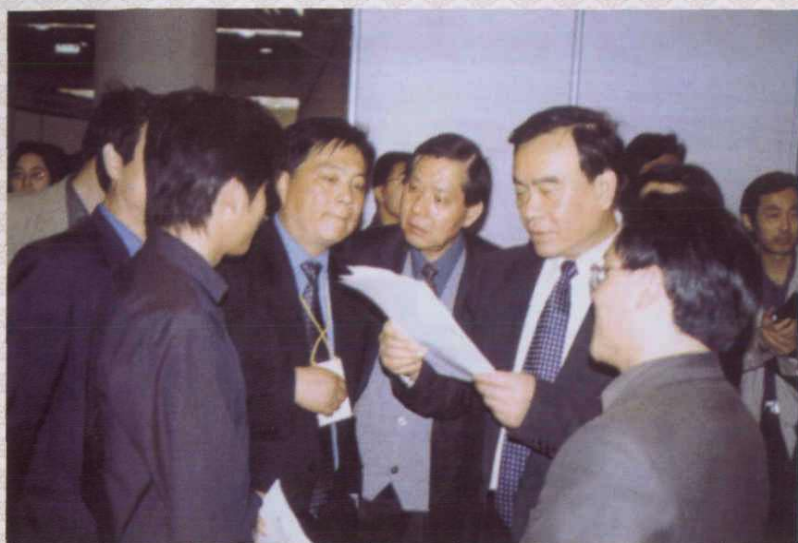
2002年4月5日，省委常委、常务副省长吕祖善视察浙江省劳动力市场。