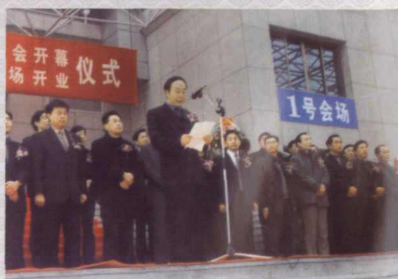
省劳动保障厅副厅长金汝斌祝贺义乌市人才市场、劳动力市场开业。