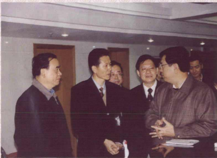
2001年11月14日，中共浙江省委书记张德江、常务副省长吕祖善、省委秘书长张曦在省劳动保障厅召开调研座谈会。