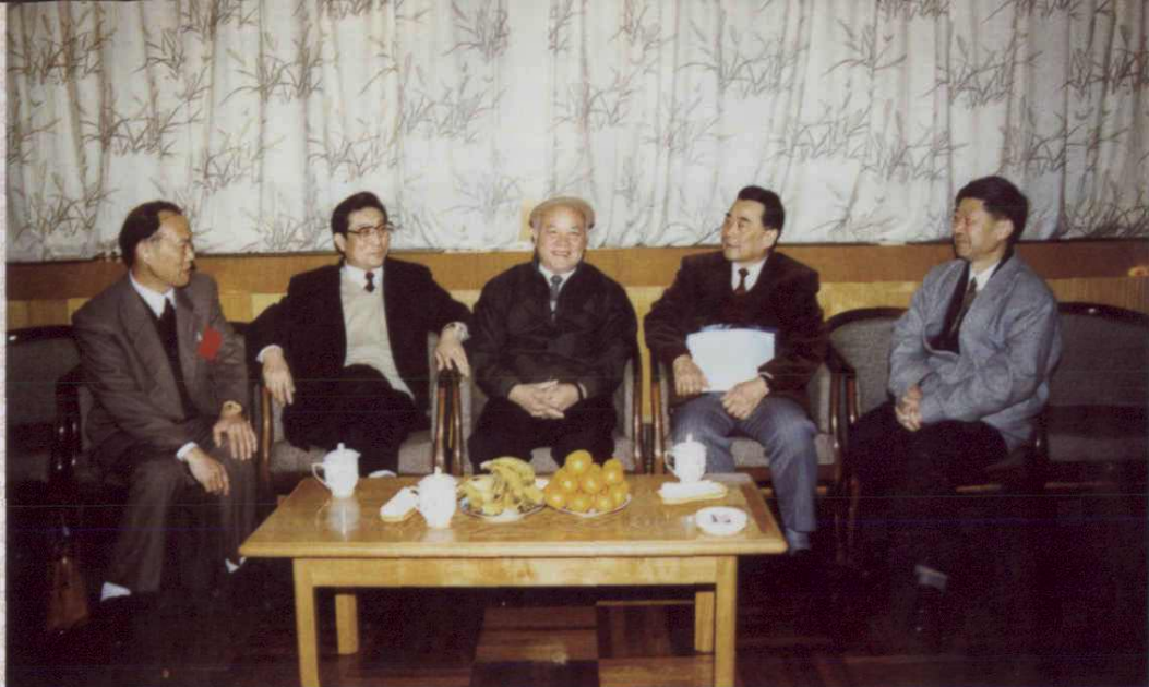
1995年11月29日~30日,出席浙江省失业保险与就业工作会议的全国人大常委会副委员长李沛瑶(中)、劳动部部长李伯勇和副省长柴松岳、省人大常委会副主任杨彬、省劳动厅厅长郑经富等在一起交谈。