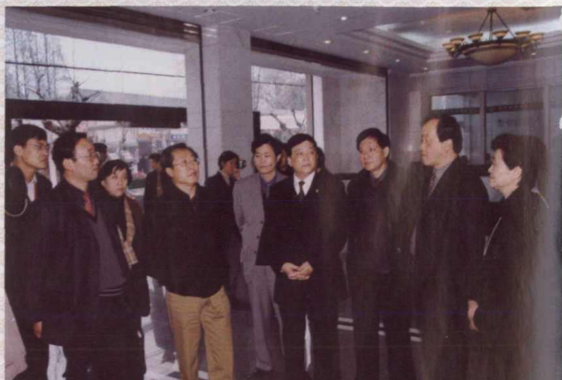
2002年3月24日~28日,劳动保障部部长张左己在省劳动保障厅厅长韩春根、副厅长金汝斌等的陪同下,对我省就业与再就业和下岗人员基本生活保障等工作在杭州、湖州、温州等地进行调研。