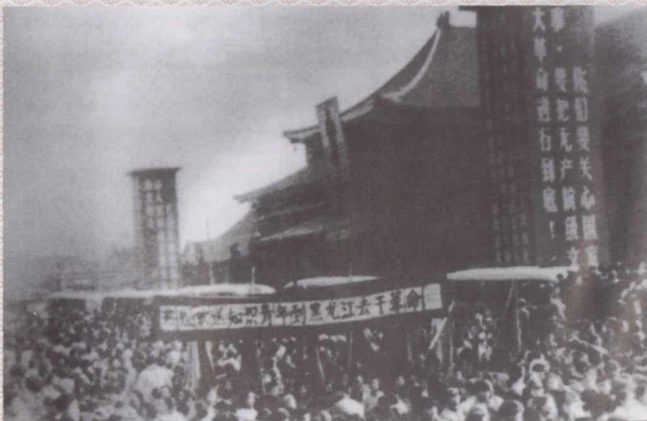
在毛泽东发出知识青年上山下乡的号召后，1968年底，杭州市首批知识青年奔赴黑龙江农村支边，随后全省掀起了知识青年上山下乡的高潮，共有60多万人上山下乡。图为在杭州城站火车站欢送支边支农知青的情景。