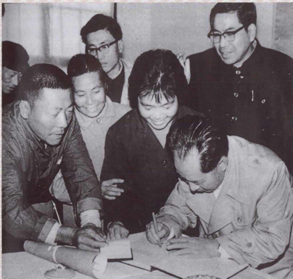
1985年12月29日，中共中央总书记胡耀邦到大陈岛看望30年前（1956年）来自温州等地的知青——老垦荒队员，并为他们题词。