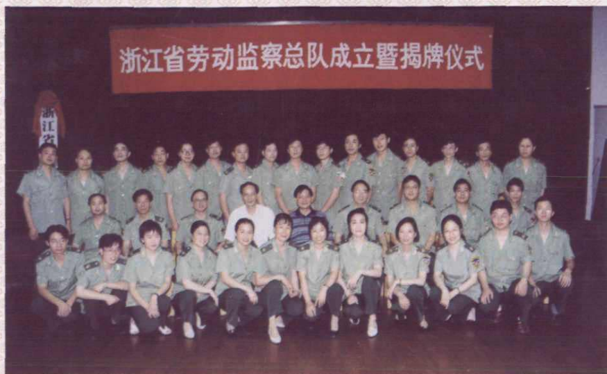
1998年6月24日，在杭州举行浙江省劳动监察总队成立暨揭牌仪式。