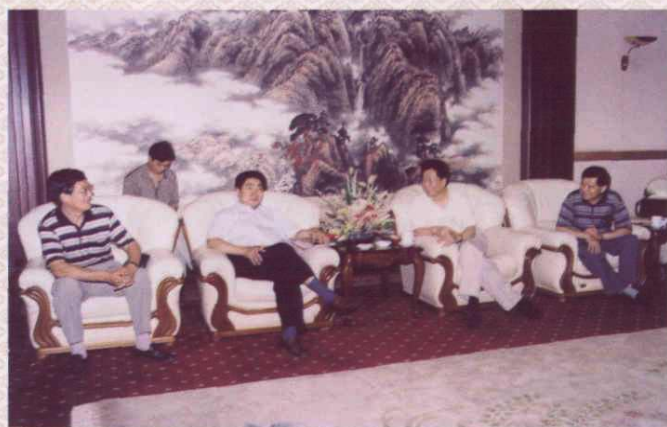
劳动保障部副部长王东进（左二）在听取副省长卢文舸的情况介绍。