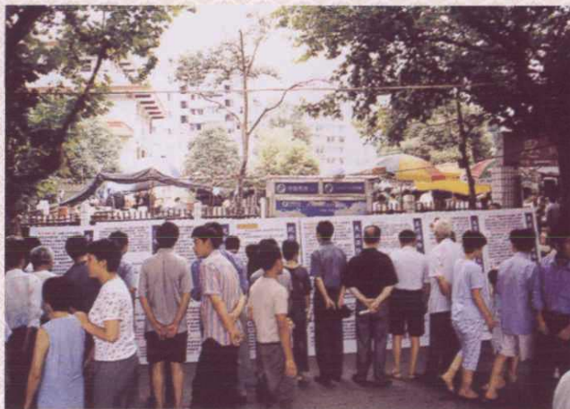
受到群众关注的劳动保障知识宣传栏。