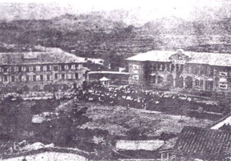
▲ 超古學堂全景 (清末建)