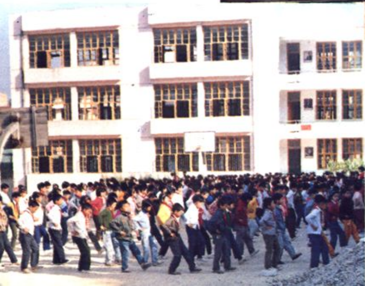
◀ 水口中心小学复建校舍一角