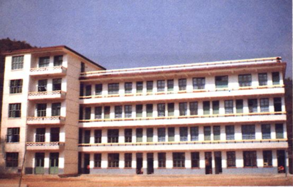
◀ 古田溪水电厂 职工子弟学技 职业高中大楼