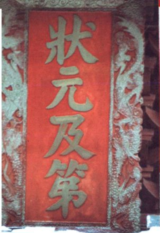
▲宋光宗御賜余复金匾