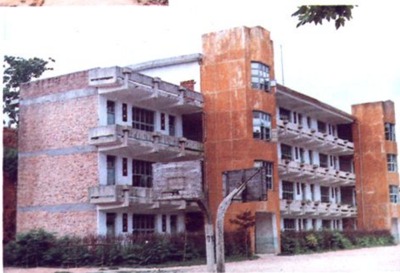
古田六中 教学大楼 ▶