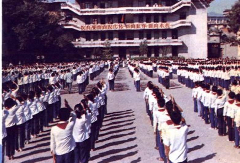
古田一小 升旗仪式 ▶