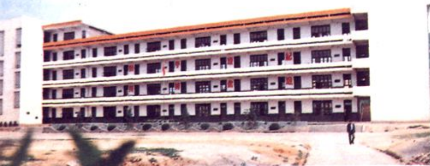
◀ 古田玉田中学 新建教学大楼