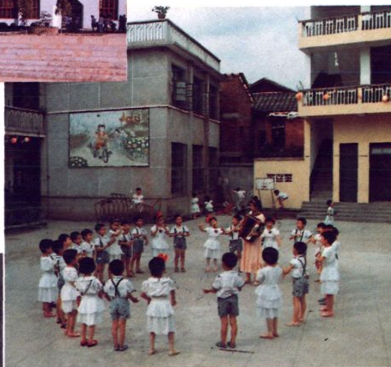
古田县实验 幼儿园 ▶