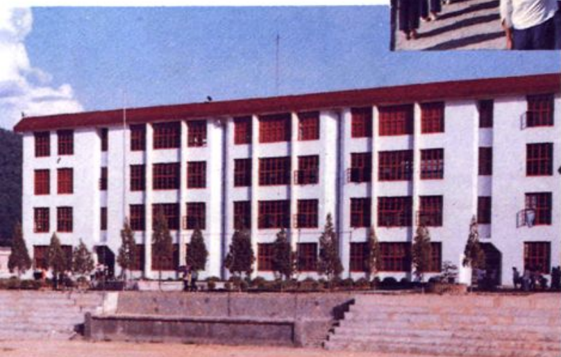
◀ 古田一中 综合大楼