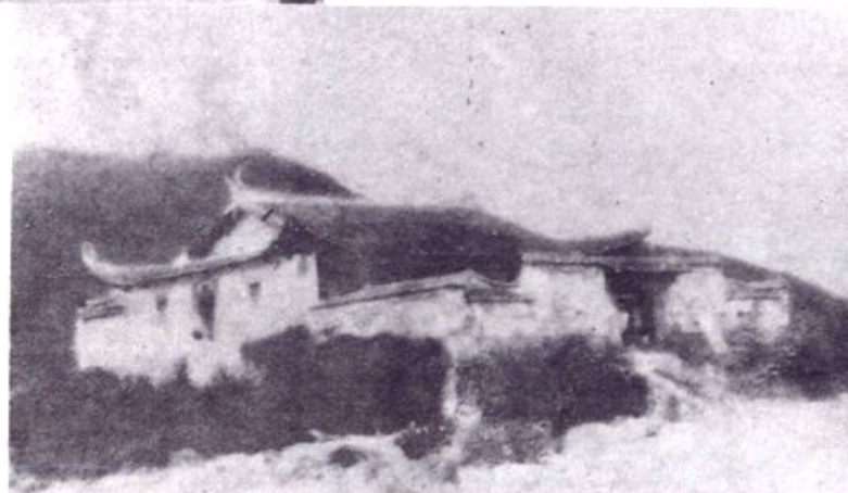
▶ 縣城溪山書院 (宋初年建)