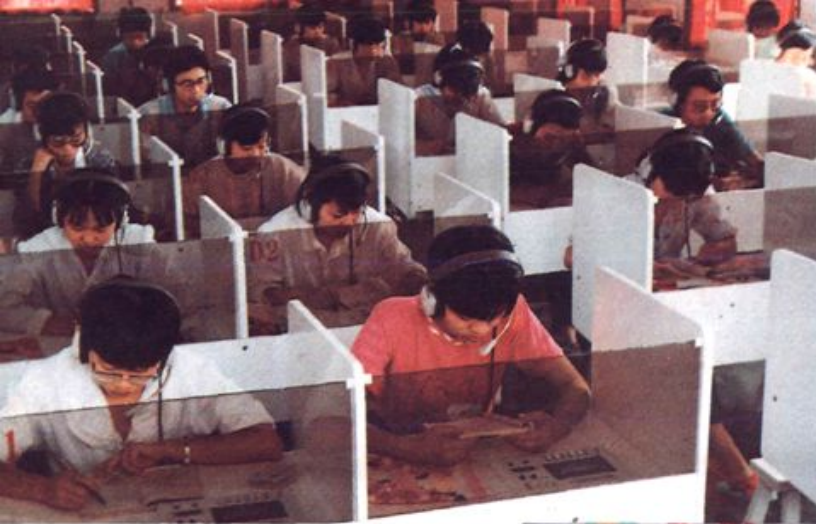
◀ 古田一中电化教学 语音室