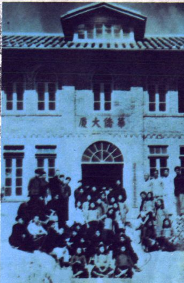
玉田高中校舍 “華僑大廈”正門▶