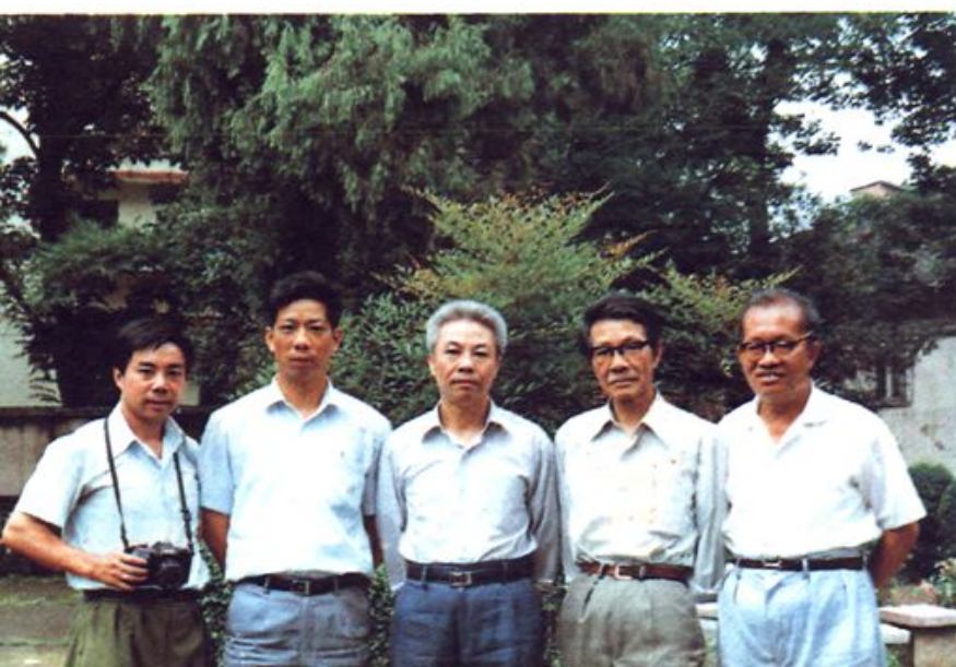
◀ 古田县教育志编写 领导小组及工作人 员合影