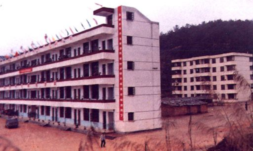
◀ 古田八中复建 新校舍