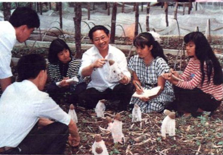
古田十一中职高班 实习教学现场 ▶