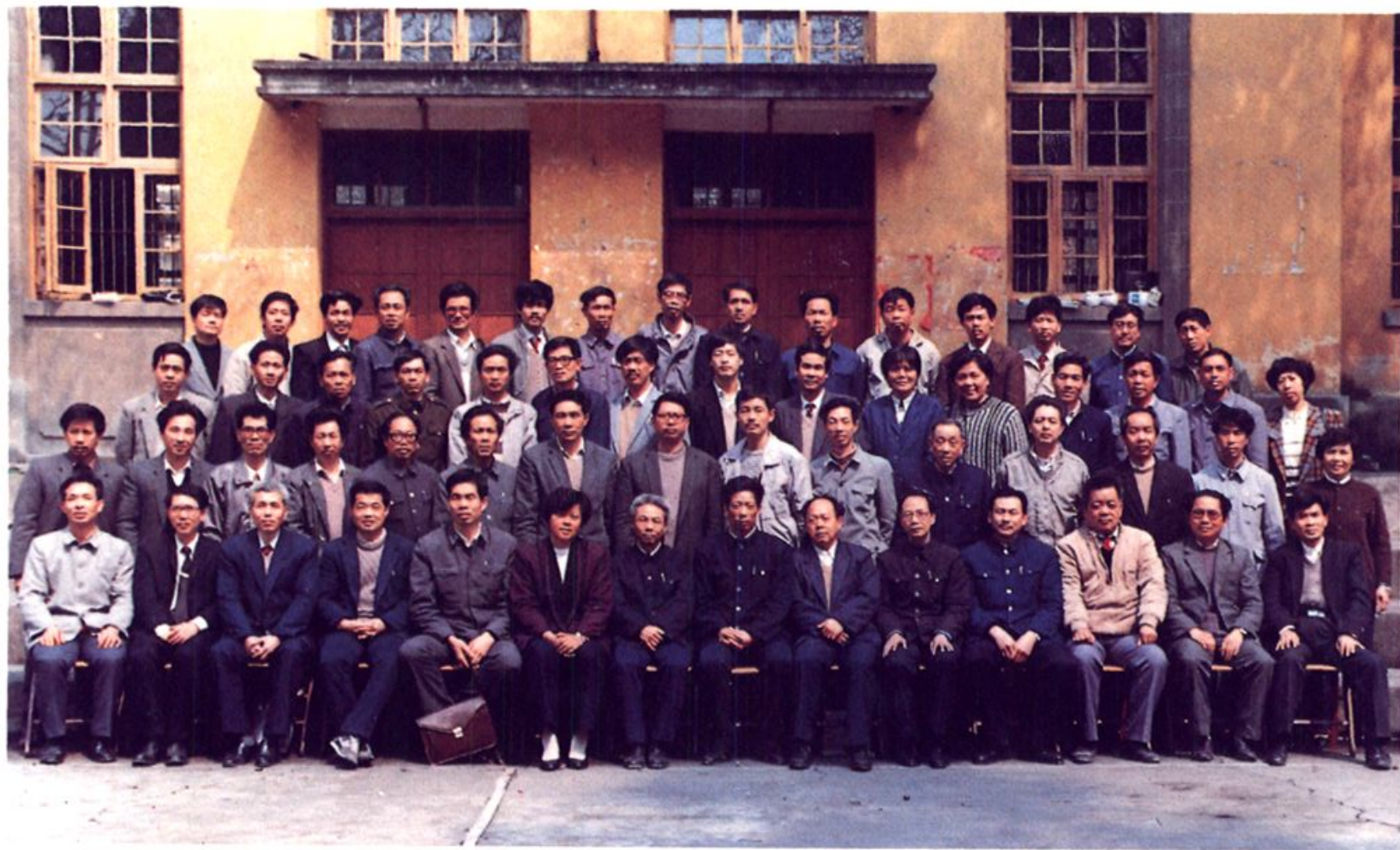
古田县各中学各学区校长暨教育局各股室负责人会议合影