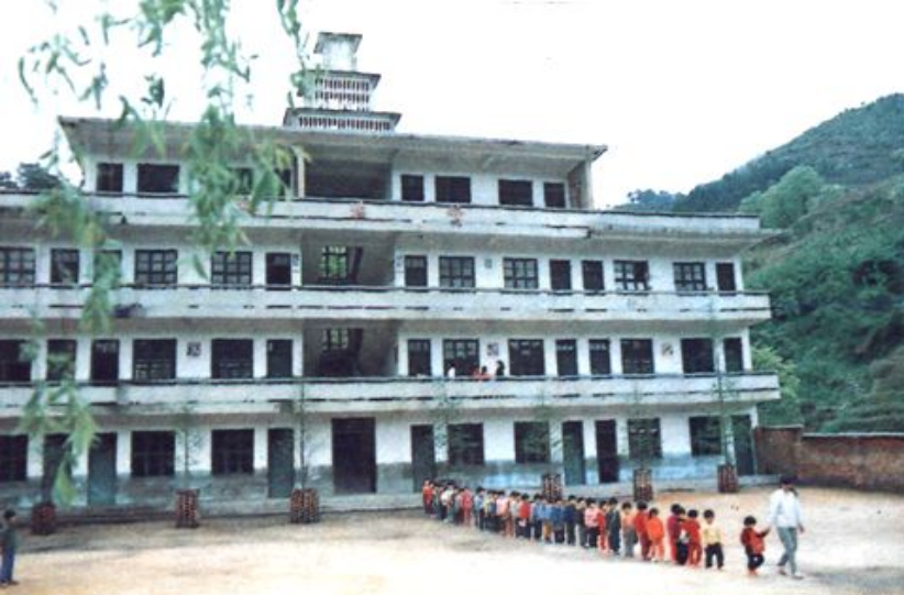
◀ 华侨捐建的横洋小学“赞汤楼”