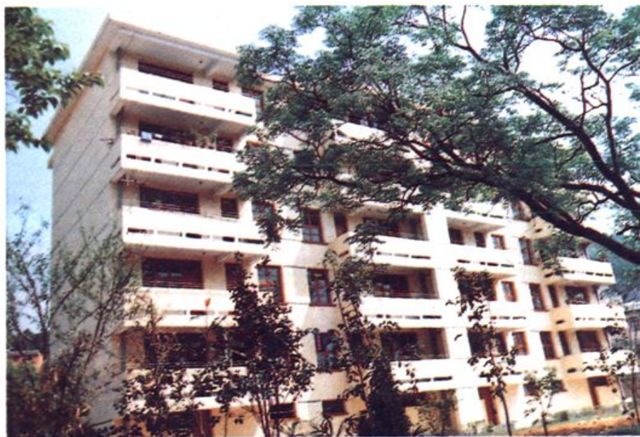
古田县实验小学 教工宿舍 ▶