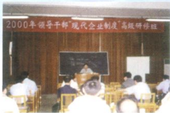
2000年8月，省电力党校邀请华北电力大学曾鸣教授为领导干部研修班授课