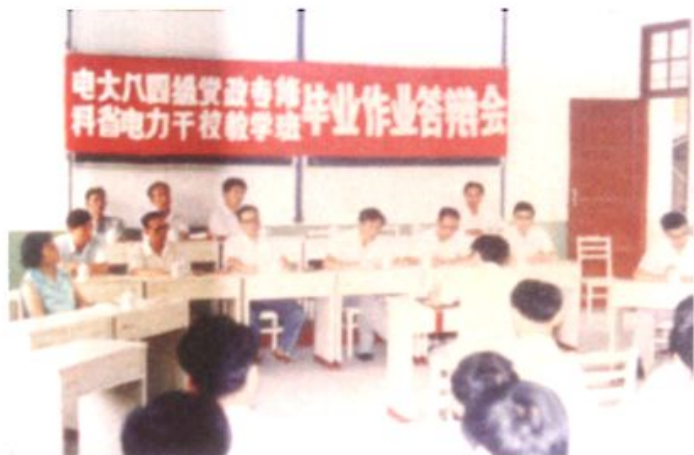
1986年10月，电大1984级党政专修班学员在进行毕业答辩