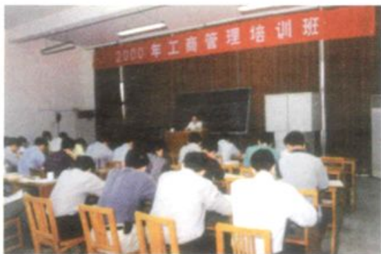
2000年工商管理培训班