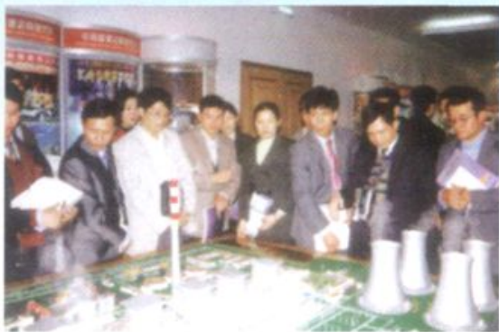
1999年11月，第九期中青班学员在山东电力公司考察学习