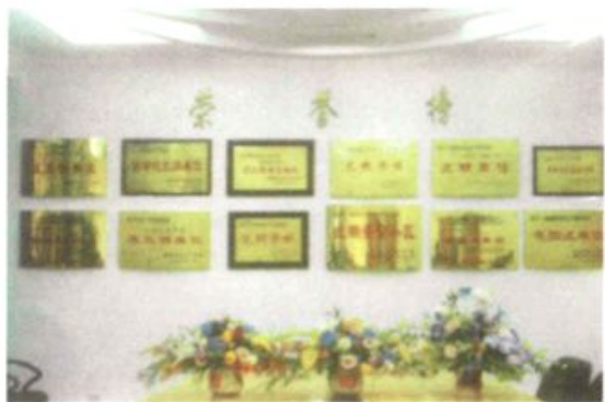
省电力干校、党校搬迁福州后获得表彰文明单位的部分荣誉