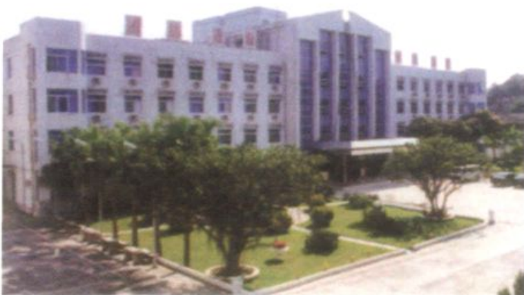
搬迁福州后省电力干校的新校园