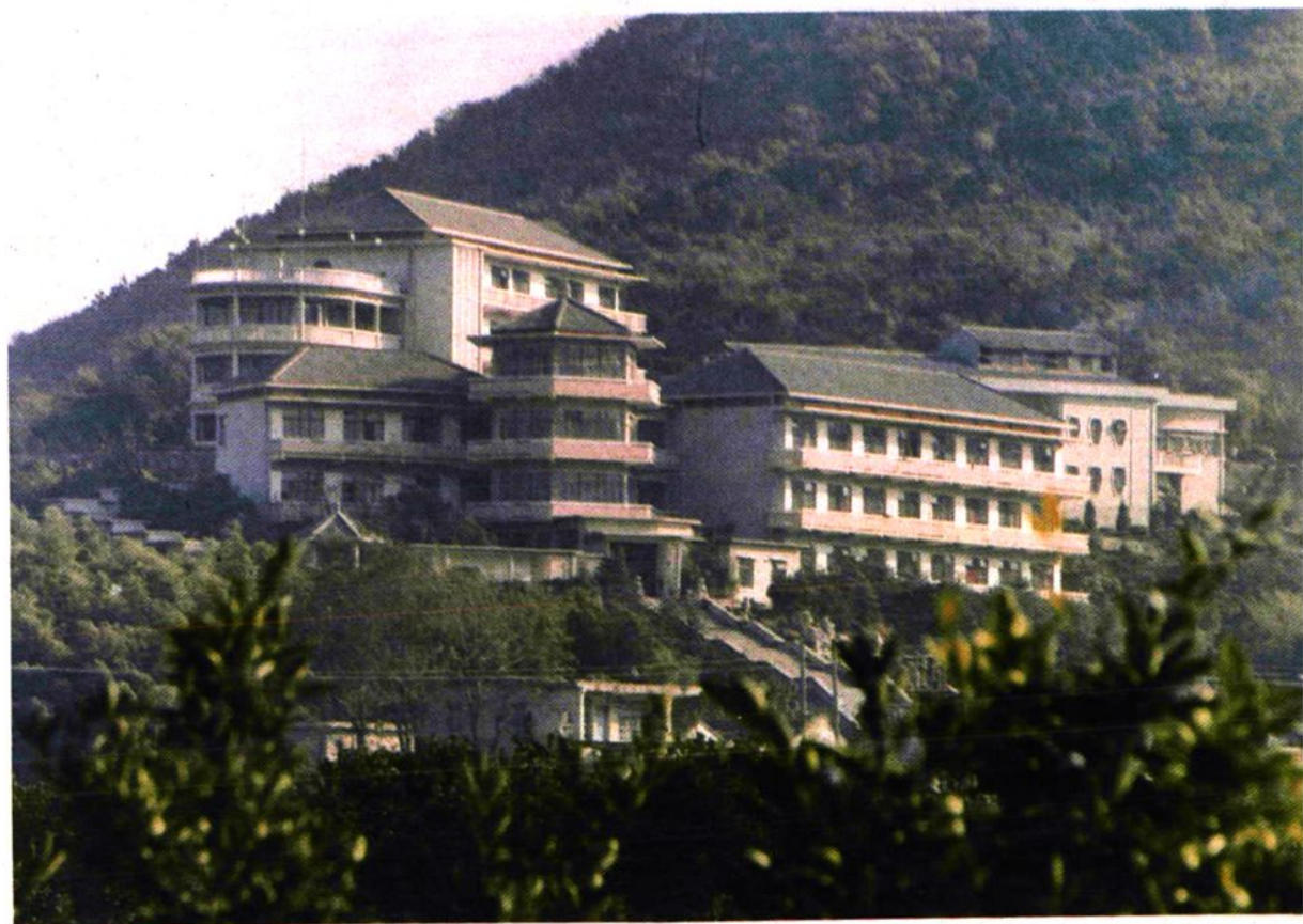
无锡纺织工人疗养院