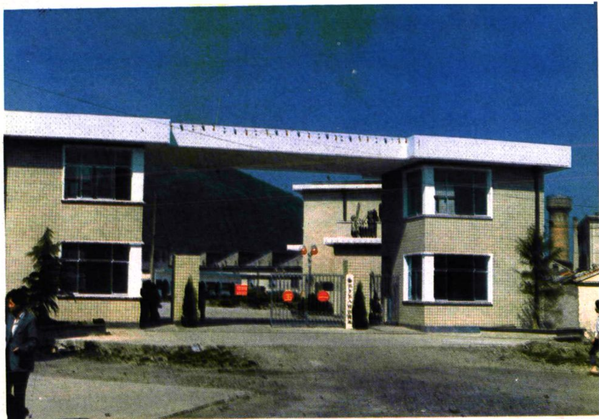
无锡市第八棉纺织厂