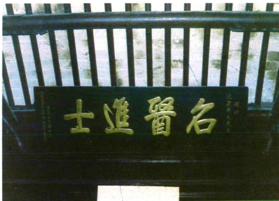
名醫進士匾（韓世忠）