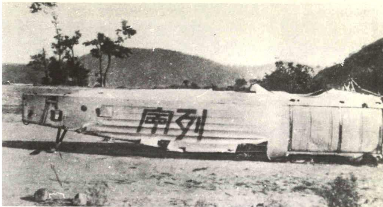
1931年配合鄂豫皖工农红军参加黄安战役的“列宁号”飞机。