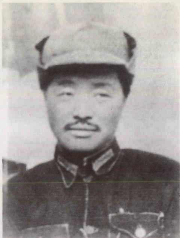
湘鄂西革命根据地时期的贺龙。