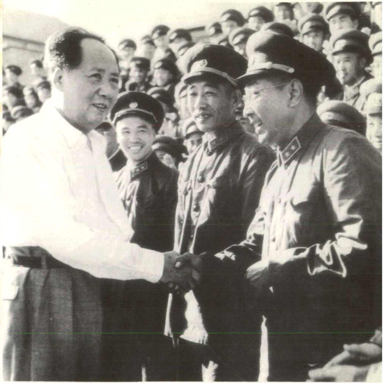
毛泽东接见武汉军区党代表大会全体代表。