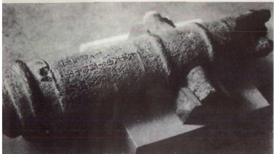
太平天国辛酉十一年（公元1861年）湖北黄州监制之铁炮。