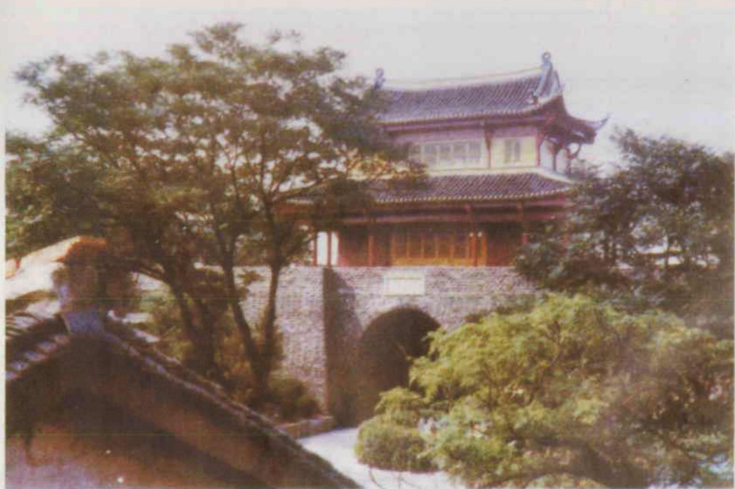
武昌起义门（原为中和门）。