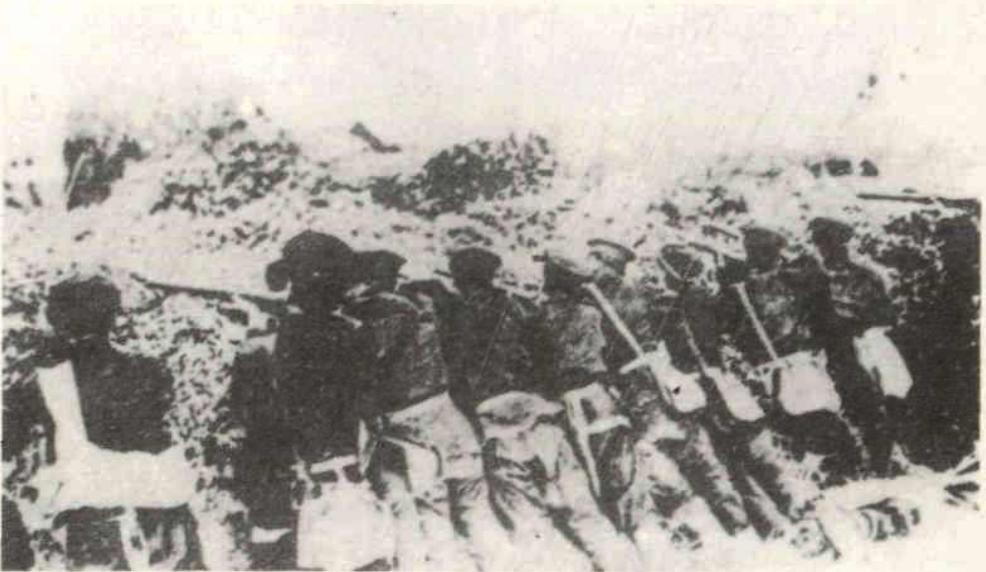
南下清军。 阳夏保卫战中，革命军在汉口伏击