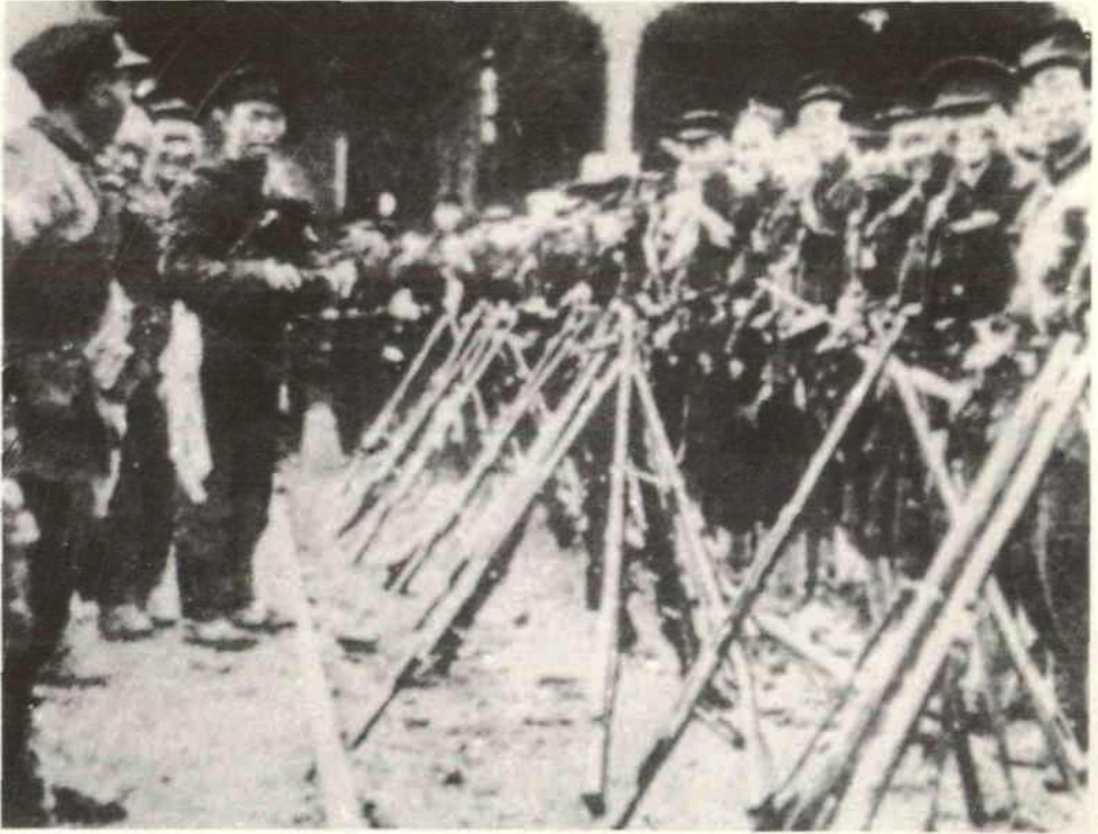
1911年武昌起义打响第一枪的湖北新军 工程第八营士兵。