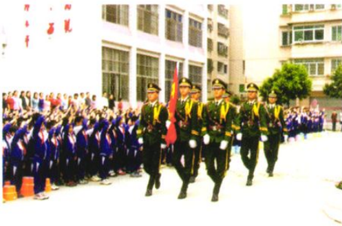
河滨小学丰富多采的爱国主义教育。