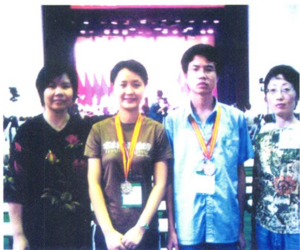
从化中学“化学反应中的能量变化实验探究活动”研究性学习成果荣获广东省银牌。图为指导教师和研究性学习小组学生在第十届广东省青少年科技创新大赛颁奖现场。