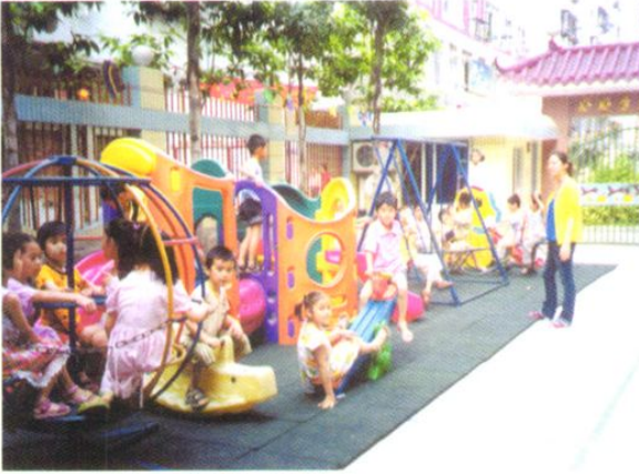
英才幼儿园是孩子们的花园、家园、乐园。