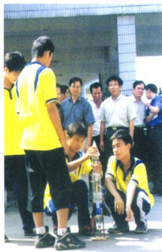
从化中学成功举办了研究性学习现场会，市教育局和学校领导在观看“水火箭”发射实验。