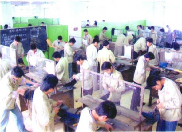
技工学校机电专业学生在实操练习。该工种参加广州市属技工学校技能竞赛获团体第一名。