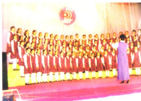
街口镇中心小学合唱队参加广州市学校 合唱节比赛屡获佳绩。