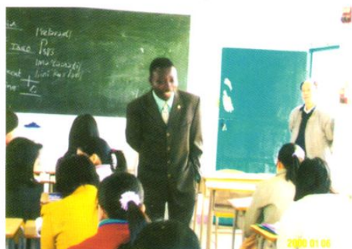
职业教育中心特邀外籍教师上英语口语课。