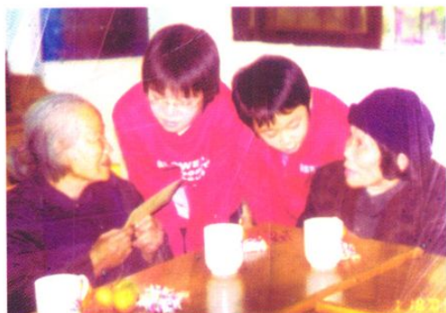
街口镇中心小学开展“敬老爱老”活动。