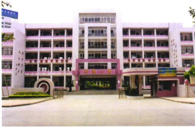
河滨小学雄伟的教学楼。