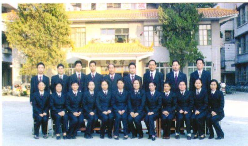
二中的青年教师已成为高三级教师团队的重要力量。他们使高中教育教学工作永葆青春活力，高考成绩稳步提高。