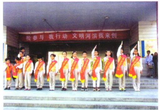
河滨小学开展“我参与、我行动、文明河滨我来创”活动。