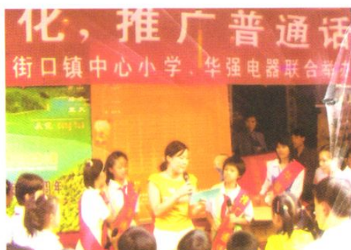
街口镇中心小学开展“面向现代化、推 广普通话”社区实践活动。