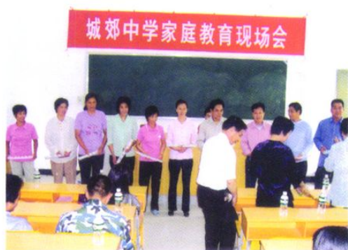
城郊中学家庭教育现场会，参加者有城郊镇领导，关工委成员和家长代表。