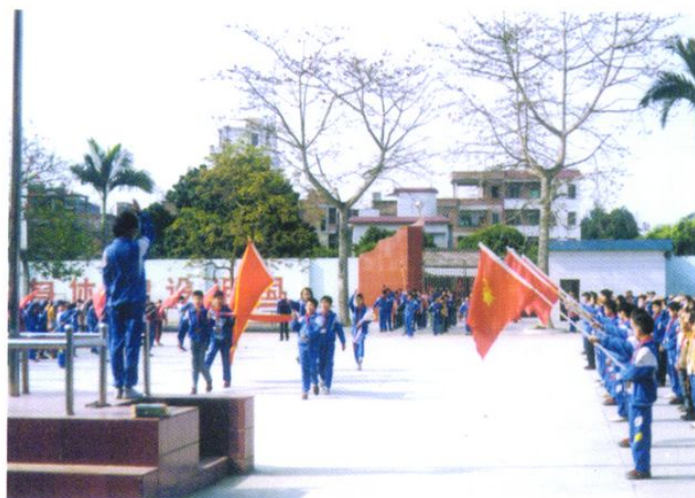
城郊镇中心小学每周一次的庄严肃穆的升国旗仪式。