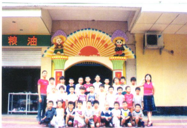
和兴幼儿园大班的小朋友与老师在一起。