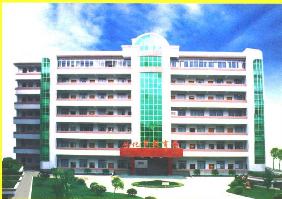
从化市教育局办公大楼