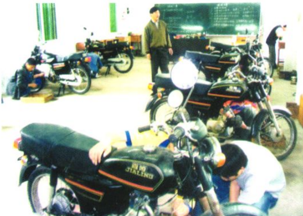
农校面向农村青年长年开办短期技能培训班。图为摩托车维修工中级班学员在实习。