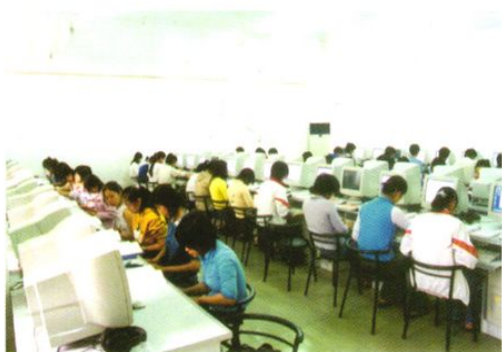
职业教育中心计算机实验室。