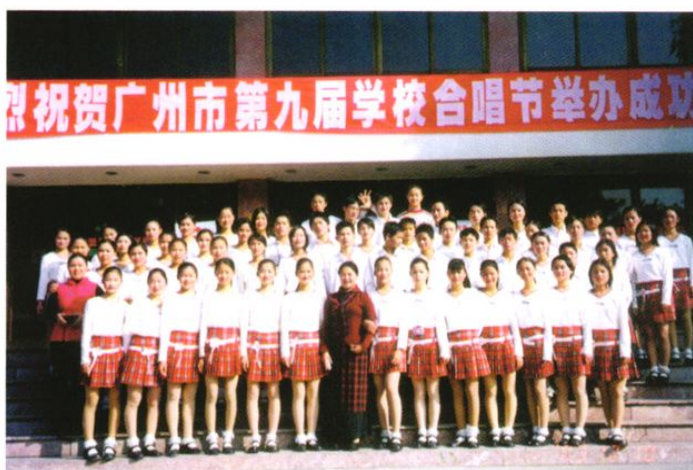
2003年11月城郊中学初二(4)班同学代表从化市参加广州市第九届学校合唱节荣获班际合唱比赛一等奖。