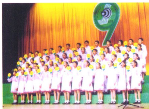
西宁小学参加广州市学校合唱节比赛。