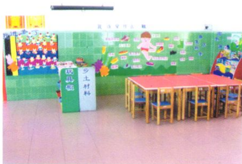
街口幼儿园自制的乡土材料玩具。