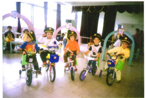
第二幼儿园的老师让学生当邮递员。看，小邮递员多么神气！