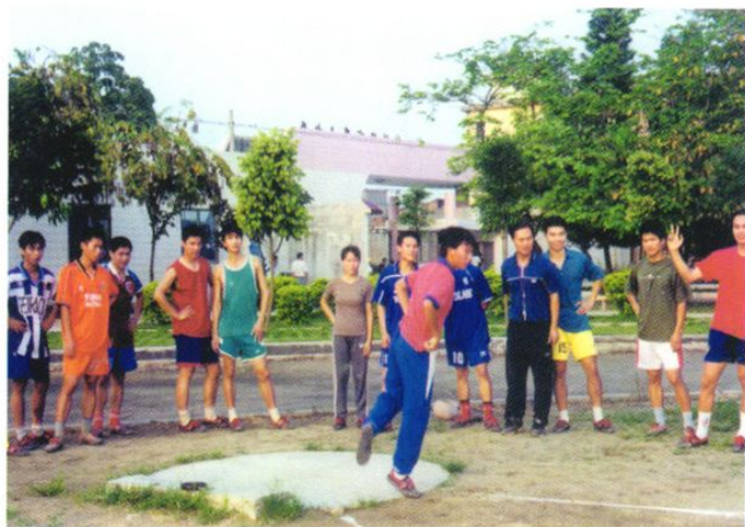
五中学生 体育活动开 展得蓬蓬勃 勃，且颇具 特色。

六中于1996年开办时就提出以英语为教学特色，并积极进行探索与实践。每年举办口语考试与广外大志协联谊，举行英语晚会、英语活动周、邀请外籍教师讲课等，取得了良好的效果。图为2004年4月20日晚该校的英语晚会。该会请一名外籍教师一同主持晚会。