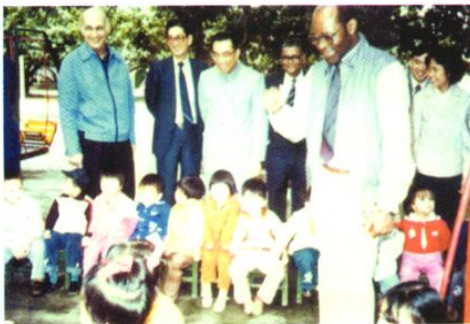
国际卫生组织官员来第一幼儿园视察卫生保健工作。