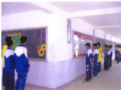
从化三中文化长廊