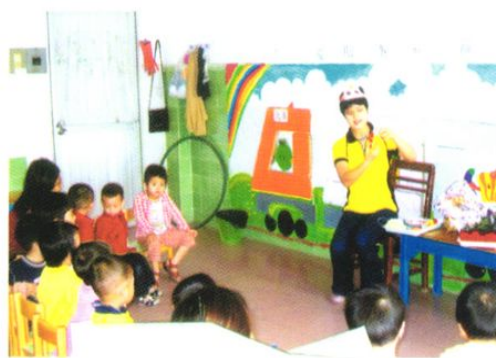
街口幼儿园的小朋友在上课。