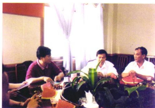
城郊镇党委、政府十分重视成人教育。图为镇领导和镇成人教育中心校领导在研究成人教育工作。