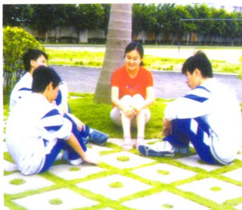
四中的班主任经常与学生谈心，耐心做学生的思想工作，成为学生的知心朋友。