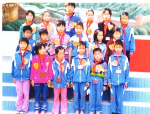
城郊镇中心小学每月进行“文明之星”评比活动。图为参赛学生合照。