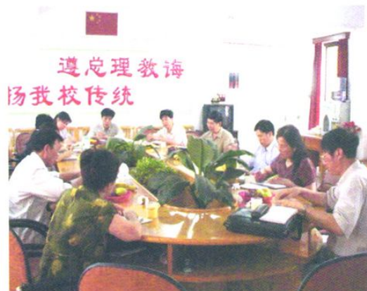
广州市教研室、广州市教科所、从化市教研室的领导对流溪小学的研究课题进行论证。