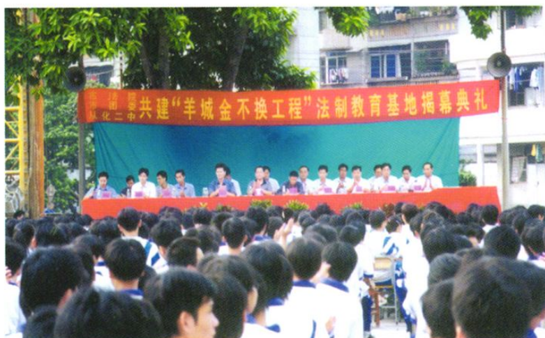
市法院、团市委与二中共建“羊城金不换工程”法制教育基地。