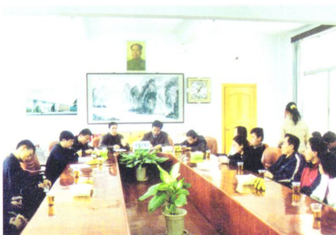
从化中学行政领导与科组长一起研究新课程实施方案。