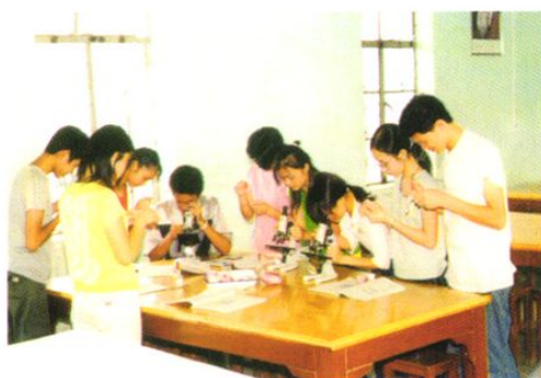
五中重视培养学生的动手能力，构建探究式教学模式。