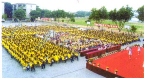
团市委在三中举办纪念“五·四”运动八十五周年大型总结表彰大会。