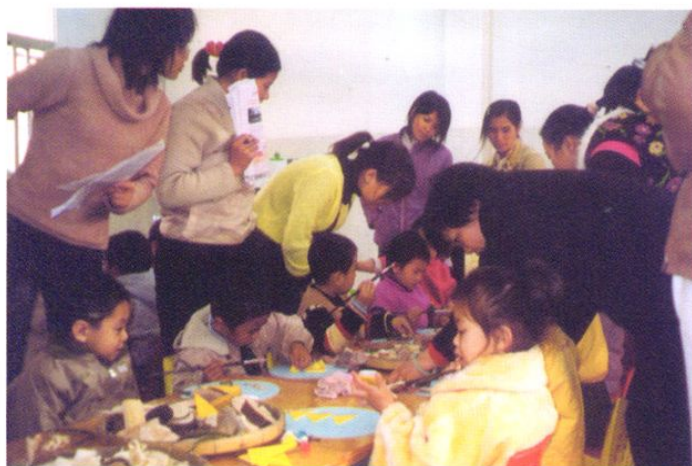
街口幼儿园创造性地开展“有趣的木头”活动，利用木头，让幼儿想像拼成各种小动物，添上钮扣、瓶盖等，小朋友制作的小动物栩栩如生。