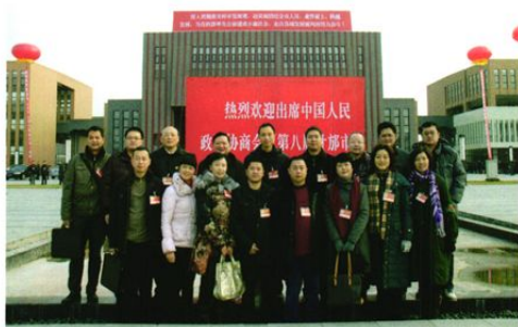
政协什邡市第八届委员会医卫小组