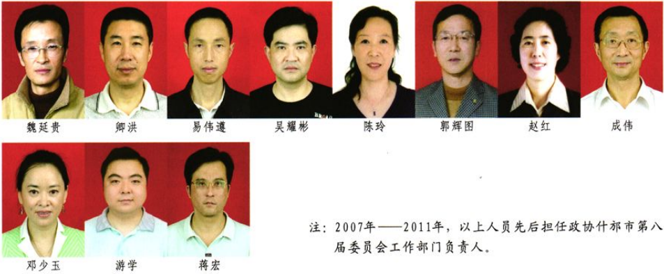
注: 2007年——2011年, 以上人员先后担任政协什邡市第八届委员会工作部门负责人。