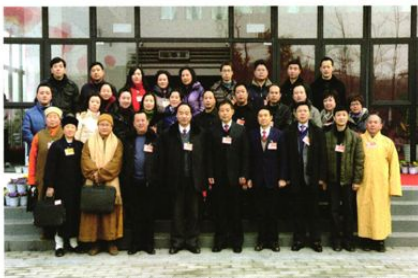
政协什邡市第八届委员会群团、民宗小组