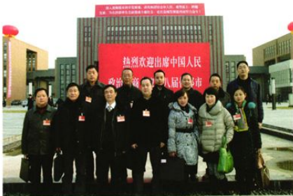
政协什邡市第八届委员会科技、科协小组