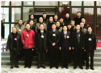
政协什邡市第八届委员会工商联小组