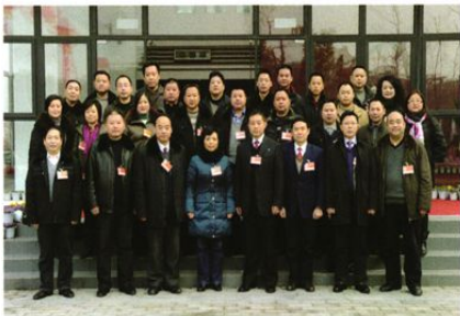
政协什邡市第八届委员会农业小组