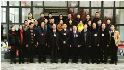
政协什邡市第八届委员会商贸小组