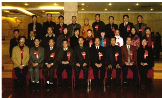
2006年12月15日，当选的八届委员会主席、副主席、秘书长、常务委员在什邡金桥酒店大厅合影。