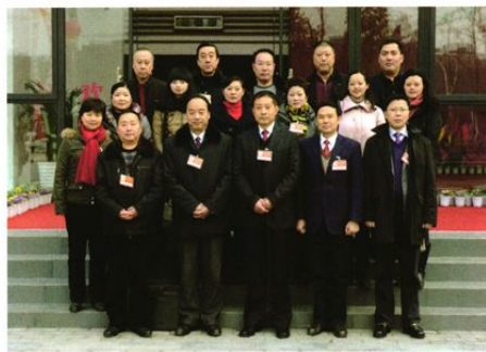
政协什邡市第八届委员会工业、经济小组