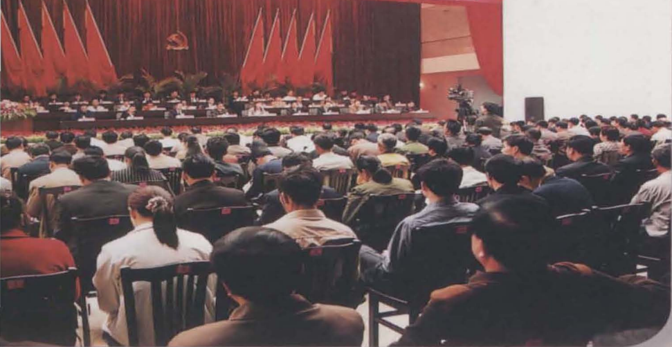
中国共产党南宁市良庆区第一次代表大会召开