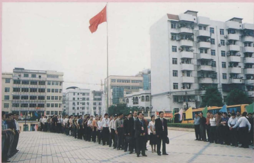
政协委员列队步入政协良庆区第一届委员会第一次会议会场