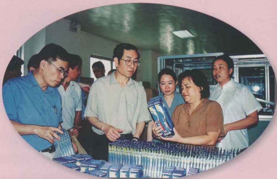
自治区党委常委、南宁市委书记马飏（右四）到良庆区视察