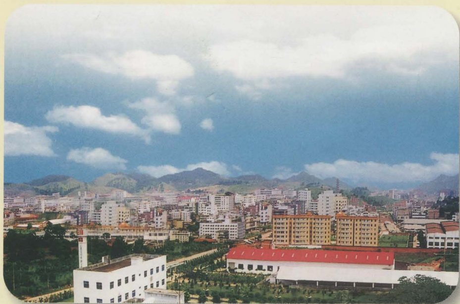
沿海经济走廊开发区