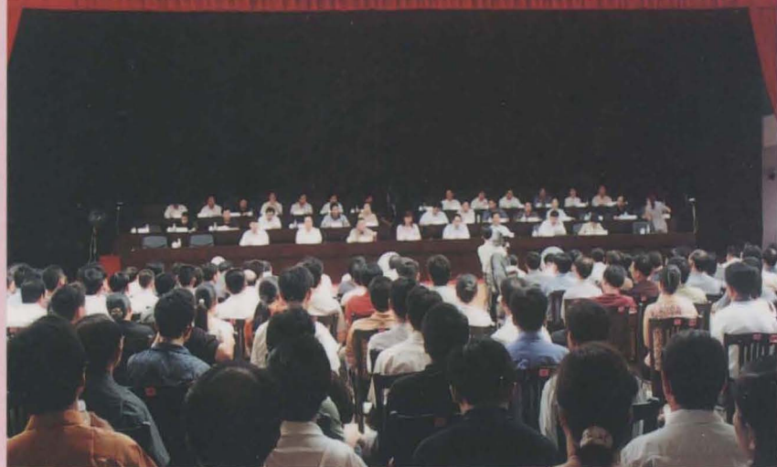
南宁市良庆区第一届人大常委会颁发任命书大会会场