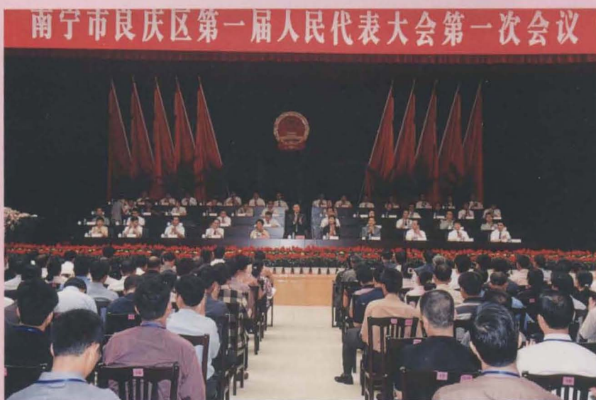
南宁市良庆区第一届人民代表大会第一次会议召开