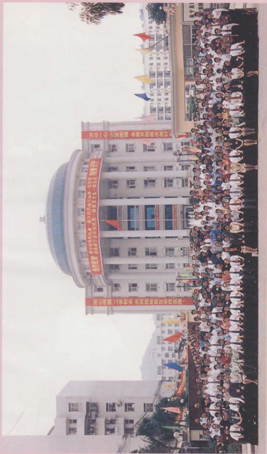
南宁市良庆区第一届人民代表大会代表合影