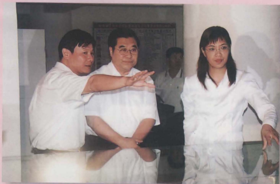
南宁市市长林国强（中）于良庆区视察。图为良庆区委书记朱朝霞（右一）、区长陈世平（左一）向林市长介绍良庆区的发展规划