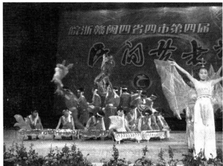
皖浙赣闽四省四市艺术节黟县节目

十一届三中全会以后，“百花齐放”方针得到贯彻，全县文化活动开始活跃，各地业余剧团逐渐恢复活动，1981 年春节，全县 14 个业余剧团上演剧目 47 个，其中现代戏 19 个、传统剧目 28 个。是年 11 月，西武公社在农民业余剧团基础上，建立蓓蕾黄梅戏剧团，排演传统黄梅戏《乔太守乱点鸳鸯谱》、《花田错》、《打猪草》、《闹花灯》、《天仙配（选场）》、《十五贯》等传统剧目，还排演县创作组创作的现代戏《断了的红线》、《这样可不行》、《林海丹心》等，并分别到西武、美溪、宏潭、碧山、渔亭等地演出。20 世纪 80 年代后，随着农村电影、电视普及，群众对文化需求内容变化，农民业余剧团活动逐渐减少，并逐渐停止活动。