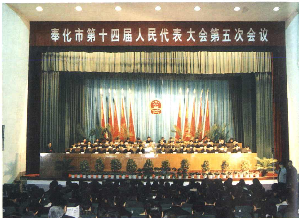
市十四届人民代表大会第五次 会议会场