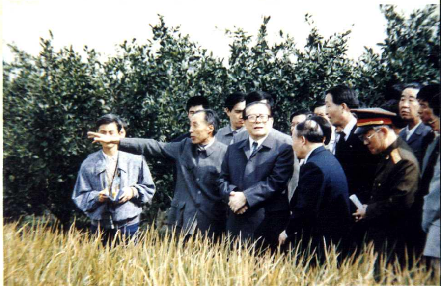
1991年10月21日，中共中央总书记江泽民视察滕头村