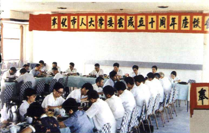
1991年9月3日，市人大常委会召开人大成立十周年座谈会