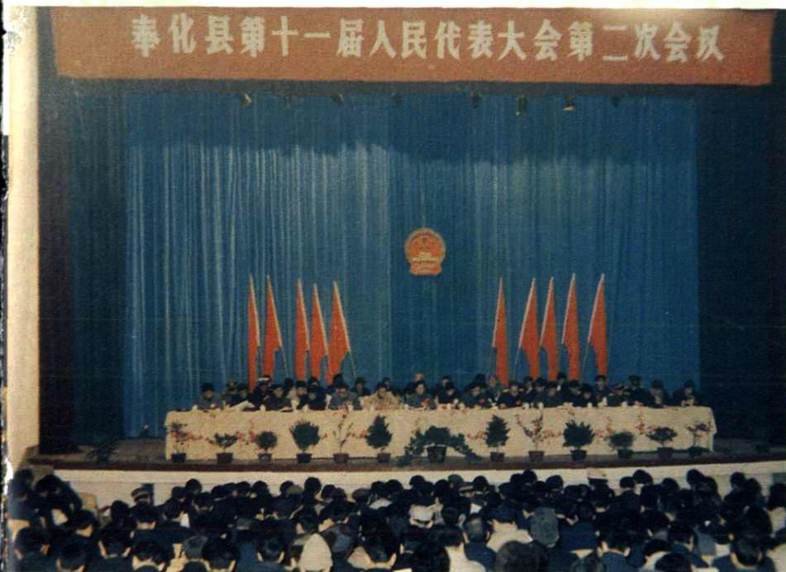
县第十一届人民代表大会 第一次会议会场