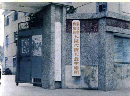
1988年初，新建第一个尚田镇人大主席团