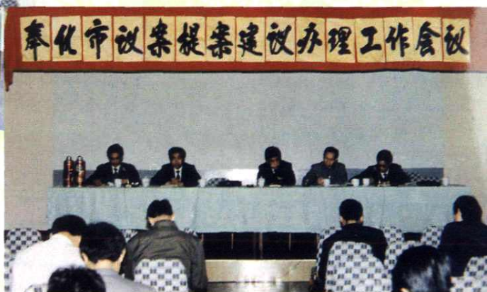
奉化市议案提案建议办理工作会议会场