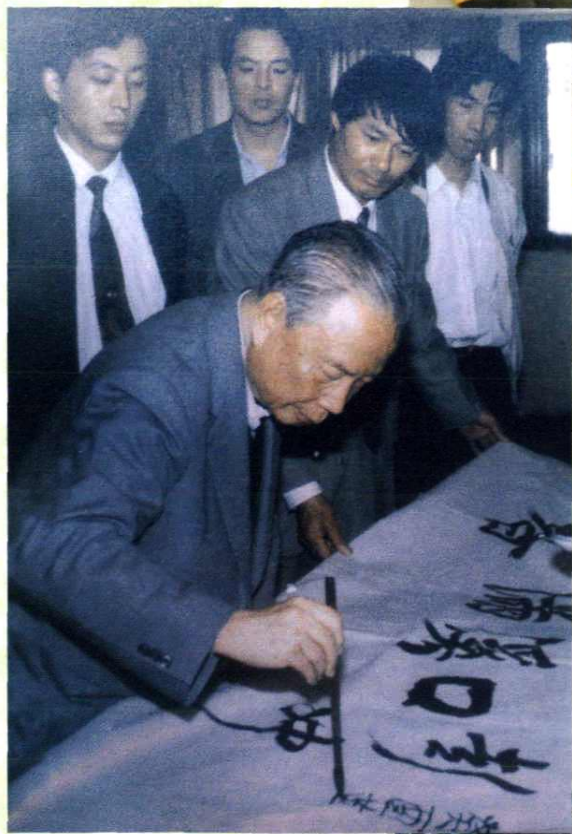
1990年7月1日，全国人大常委 会副委员长彭冲视察溪口