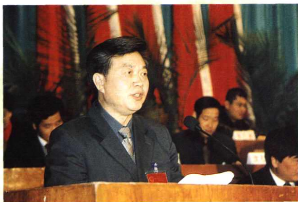
人大常委会主任何康根作《人大常委会工作报告》