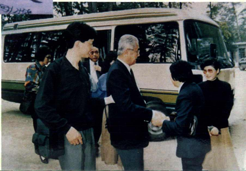
1992年4月28日，全国人大常 委会副委员长荣毅仁视察奉化