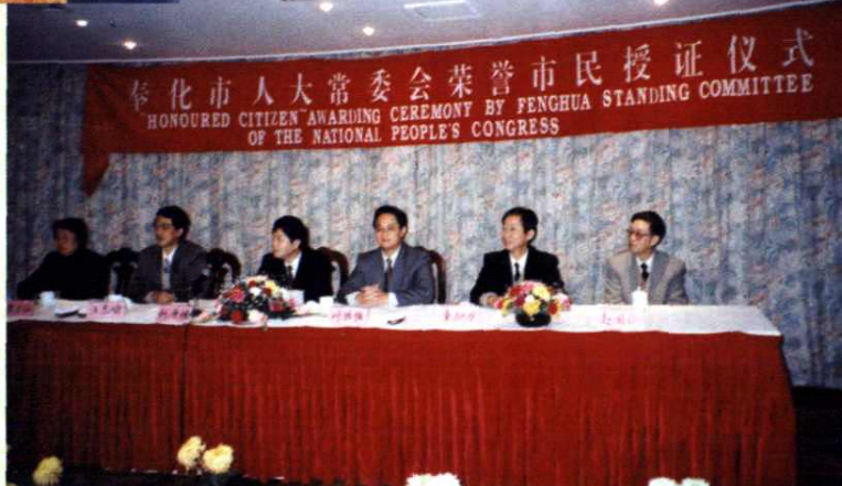
授予荣誉市民仪式