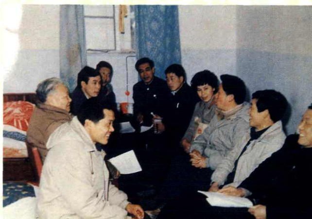
代表分组审议工作报告