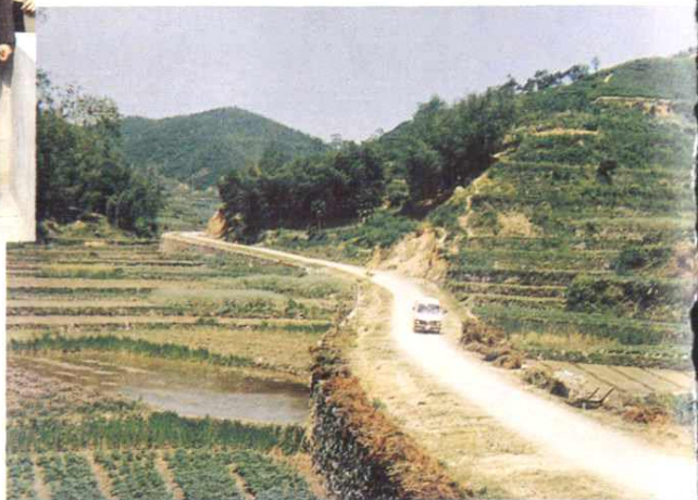
1989年12月，代表建议成功，建成董李乡竹岭至新昌蔡丰1.3公里的过境公路