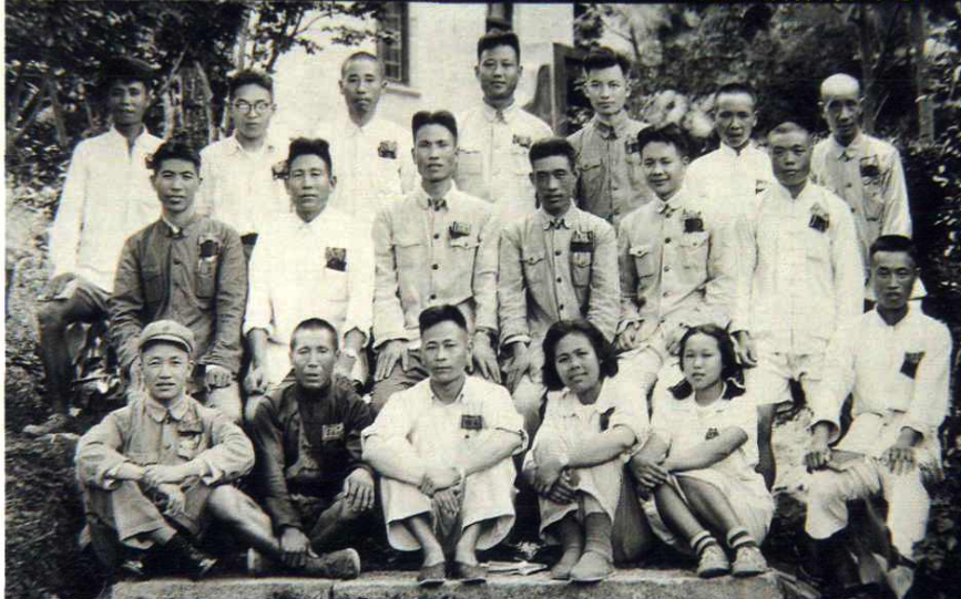
奉化縣第一屆人民代表大會主席團于第一次會議攝於1954年7月16日