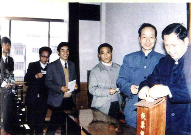
人大常委会依法行使人事任免权