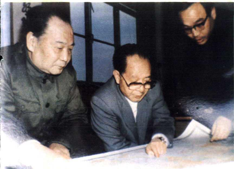
1985年12月28日，中共中央总书记胡耀邦视察奉化