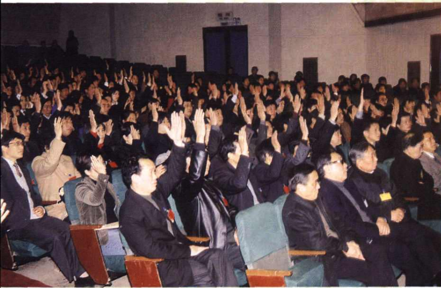
大会通过各项决议