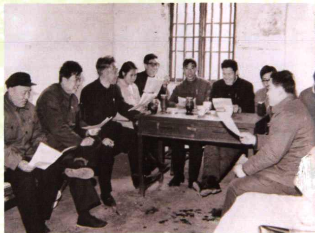
代表分组审议工作报告