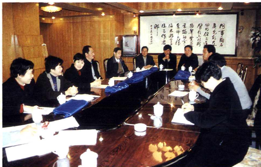
代表团分组 审议各工作报告