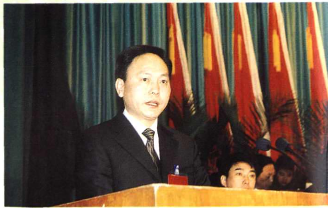
市长柴利能作《政府工作报告》