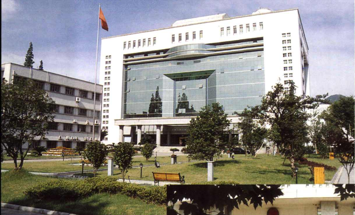
中共奉化市委、市人大常委会、 市人民政府、市政协办公楼