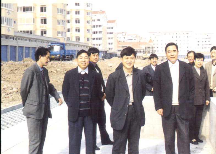
人大常委会和代表密切联系选民和群众。图为人大常委会视察城区建设。