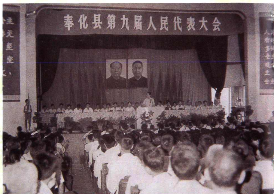
县第九届人民代表大会 第一次会议会场