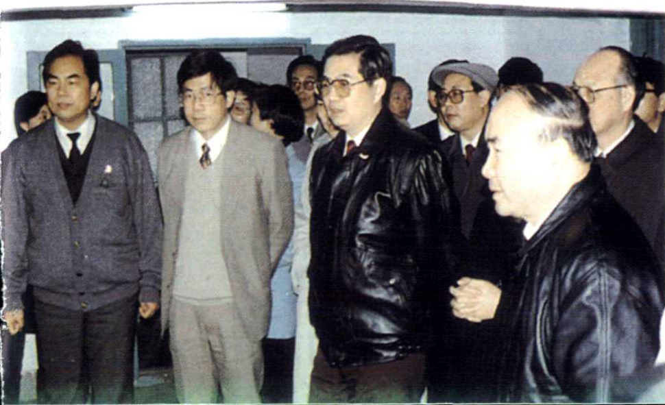
1993年11月21日，中共中央政治局常委胡锦涛视察溪口