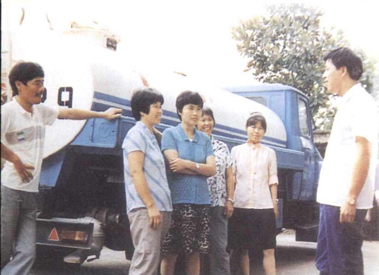
代表深入听取环卫工人意见